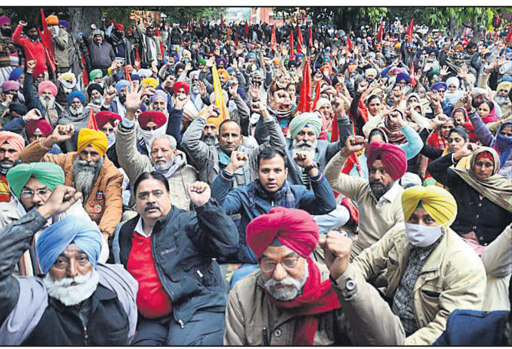
ଅନୁତସରରେ ଗଣମାନଙ୍କ ଦିଲ୍ଲୀ କମିଶନରଙ୍କ କାର୍ଯ୍ୟାଳୟ ଆଗରେ ବିରୋଧ ପ୍ରଦର୍ଶନ କରୁଛନ୍ତି।

କେନ୍ଦ୍ରର ନୂଆ କୃଷି ଆଇନ ବିରୋଧରେ ଦିଲ୍ଲୀ ସାମାଜିକ ଗଣମାନଙ୍କ ଆନ୍ଦୋଳନ ଯୋଗୁଁ ୧୯ ଦିନରେ ପହଞ୍ଚିଥିବାବେଳେ ଏହା ସାରା ଦେଶକୁ ବ୍ୟାପିଛି।