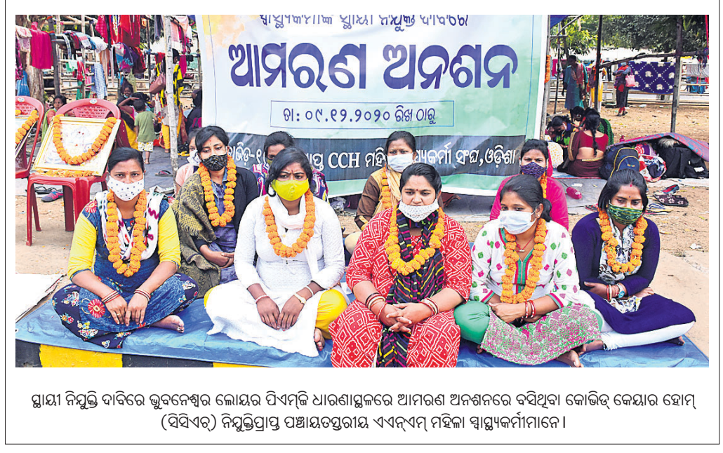
ସ୍ତ୍ରୀମାନଙ୍କୁ ଦାବିରେ ଭୁବନେଶ୍ୱର ଲୋକସେବା ସମିତି ଧାରଣାସ୍ଥଳରେ ଆମରଣ ଅନଗଣରେ ବସିଥିବା କୋଭିଡ଼ କେୟାର ହୋମ୍ (ସିଏଏଚ୍) ନିୟୁତ୍ତିପ୍ରାପ୍ତ ପଞ୍ଚାୟତସଭାଦ୍ୱାରା ଏବଂଏମ୍ ମହଲା ସ୍ୱାସ୍ଥ୍ୟକର୍ମୀମାନେ।