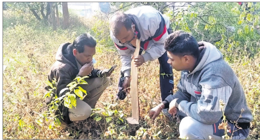
ବନ ବିଭାଗ ଅଧିକାରୀମାନେ ତଦନ୍ତ କରୁଛନ୍ତି ।

ଉତ୍ତରକୋଟ, ୧୪।୧୨(ସ.ପ୍ର.) ନବରଙ୍ଗପୁର ଜିଲ୍ଲା ଉତ୍ତରକୋଟ ପୌରାଞ୍ଚଳ ଅଧୀନ ଗୋଡ଼ିଗୁଡ଼ା(୨ନଂ. ଓଡ଼)ଅଞ୍ଚଳରୁ ରବିବାର ରାତିରେ ପ୍ରାୟ ୮ରୁ ଊର୍ଦ୍ଧ୍ୱ ଚନ୍ଦନଗଛ ଚୋରି ହୋଇଥିବା ଅଭିଯୋଗ ହୋଇଛି । ପୂର୍ବନା ଅନୁଯାୟୀ, ସୌନ୍ଦର୍ଯ୍ୟ ବୃଦ୍ଧି ପାଇଁ ସାହିର ଯୁବଗୋଷ୍ଠୀଙ୍କ ପ୍ରଚେଷ୍ଟାରେ ଚନ୍ଦନ ସମେତ ବିଭିନ୍ନ ଚାନ୍ଦିଆପତ୍ର କରାଯାଇଥିଲା । ତେବେ ରବିବାର ରାତିରେ ଦୁର୍ଭିକ୍ଷମାନେ ଅଞ୍ଚଳକୁ ପ୍ରାୟ ୮ରୁ ଊର୍ଦ୍ଧ୍ୱ ଚନ୍ଦନ ଗଛ କାଟି ନେଇଯାଇଥିବା ଜଣାପଡ଼ିଛି । ମଧ୍ୟରାତ୍ରିରେ ଦୁର୍ଭିକ୍ଷମାନେ ସାହିରେ ପଶିଥିବା ସାହିବାସିନ୍ଦା ଜାଣିବାକୁ ପାଇଥିଲେ । କିନ୍ତୁ ସେମାନଙ୍କ ଘର ବାହାରେ ଦୁର୍ଭିକ୍ଷମାନେ ତାଲାପକାଇ ଗଛ କାଟିଥିଲେ । ତେଣୁ ସାହିବାସିନ୍ଦା ବାହାରକୁ ବାହାରିପାରି ନ ଥିଲେ । ତେବେ ସାହିବାସିନ୍ଦା ହୋହାଲ୍ଲା କରିବାକୁ ଆଉ କେତୋଟି ଗଛ ଅଧା