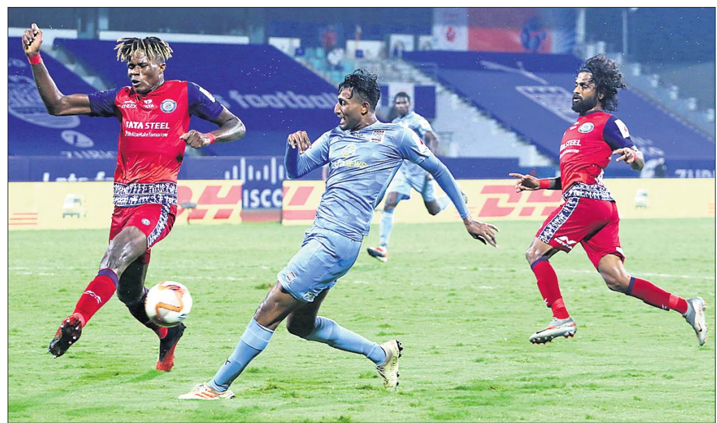
ସୋମବାର ଜାମସେଦପୁର ଓ ମୁମ୍ବାଇ ଯିବି ଏପ୍ରି ମଧ୍ୟରେ ଅନୁଷ୍ଠିତ ମ୍ୟାଚ୍।