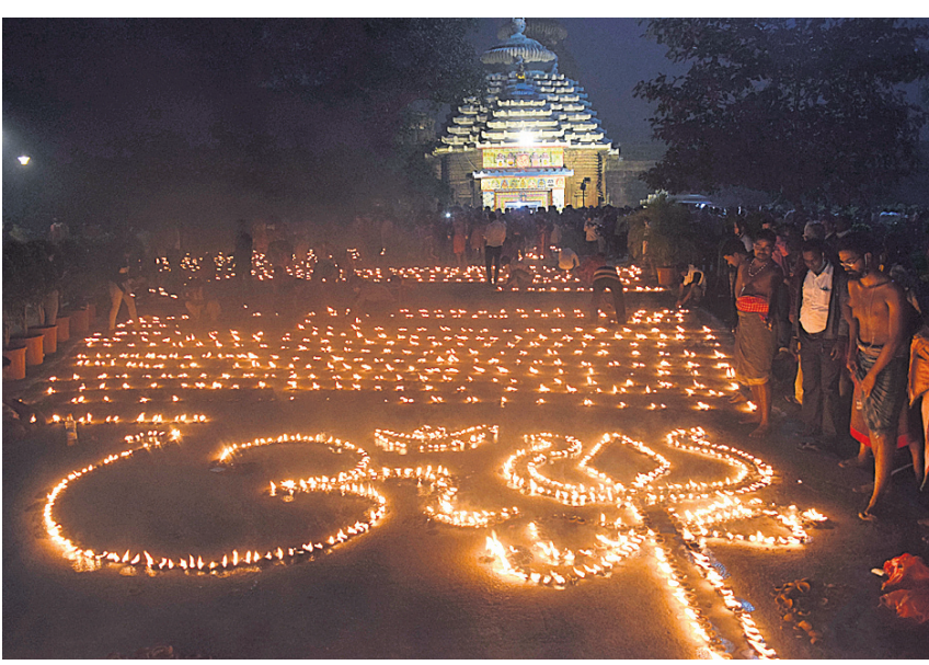
ଲିଙ୍ଗରାଜ ମନ୍ଦିର ପାଇଁ କ୍ୟାବିନେଟ୍ରେ ଅଧ୍ୟାୟେକ୍ସ ମଞ୍ଜୁର ପରେ ମନ୍ଦିର ସମ୍ମୁଖରେ ୧୦ ହଜାର ଦୀପଦାନ କରାଯାଇଛି।

ଭୁବନେଶ୍ଵର, ୧୪/୧୨ (ବୁଧବେ) ପୁରୀ ଶ୍ରୀମନ୍ଦିର ଭଳି ଭୁବନେଶ୍ଵରରେ ଥିବା ମହାପ୍ରଭୁ ଶ୍ରୀ ଲିଙ୍ଗରାଜ ମନ୍ଦିର ପରିଚାଳନା ପାଇଁ ରାଜ୍ୟ ସରକାର ଏକ ସ୍ଵତନ୍ତ୍ର ଆଇନ ଆଣିଛନ୍ତି। ଏହାଦ୍ଵାରା ମନ୍ଦିର, ଏହାର ସମ୍ପତ୍ତି, ପରିସର ମଧ୍ୟରେ ଓ ବାହାରେ ଥିବା ଅନ୍ୟ ମନ୍ଦିର, ପବିତ୍ର ସ୍ଥାନ ଓ ମଠ ସମ୍ପର୍କିତ ବିଷୟଗୁଡ଼ିକର ସୁପରିଚାଳନା ଓ ସୁଶାସନକୁ ଦୃଷ୍ଟିରେ ରଖି ଏହାର ପରିଚାଳନା ଦାୟିତ୍ଵ ଏକ କର୍ମଚିକୁ ନ୍ୟସ୍ତ କରାଯିବ। ରାଜ୍ୟ ସରକାର ସ୍ଵତନ୍ତ୍ର ଆଇନକୁ କାର୍ଯ୍ୟକାରୀ କରିବା ପାଇଁ ଅଧ୍ୟାୟେକ୍ସ ଆଣିଛନ୍ତି। ଏହାଦ୍ଵାରା ମନ୍ଦିର କାର୍ଯ୍ୟଗୁଡ଼ିକର ଉତ୍ତମ ଏବଂ ସୁ ପରିଚାଳନା ହେବା ସହିତ ତାହାପ୍ରା, ଭକ୍ତ ଓ ଉପାସକମାନଙ୍କୁ ଉନ୍ନତ ମାନର ସୁବିଧା ସୁଯୋଗ ଯୋଗାଇ ଦିଆଯାଇପାରିବ। ଏହି ଆଇନ ମନ୍ଦିର ସମ୍ପତ୍ତି ସୁରକ୍ଷିତ ରଖିବା ପାଇଁ କର୍ମଚିକୁ ସମ୍ବଳ କରିବ। ଭକ୍ତ ଅଧ୍ୟାୟେକ୍ସ ଅଣାଯିବା ପରେ ଶ୍ରୀଲିଙ୍ଗରାଜ ମନ୍ଦିର ରାଜ୍ୟ ସରକାର ରାଜ୍ୟରେ ତାହାର ଅଭାବ ପୂରଣ କରିବା, ମେଡିକାଲ ଶିକ୍ଷାର ପ୍ରସାର ଏବଂ ଉନ୍ନତ ମାନର ସ୍ଵାସ୍ଥ୍ୟସେବା ଯୋଗାଇ ଦେବା ନିମନ୍ତେ ଚର୍ଚ୍ଚା କି ମାଧ୍ୟମରେ ଯାଜପୁର ଓ ପୁରୀଠାରେ ଦୁଇଟି ମେଡିକାଲ କଲେଜ ଓ ହସ୍ପିଟାଲ ନିର୍ମାଣ କରିବାକୁ ନିଷ୍ପତ୍ତି ନେଇଛନ୍ତି। ଏଥିପାଇଁ ୬୫୧.୦୭ କୋଟି ଟଙ୍କା ଫ୍ଲୁଷ୍ଟା-୪