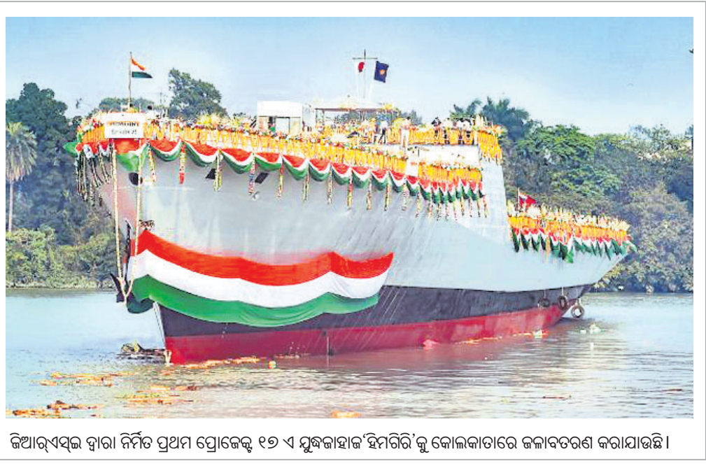
ଜିଆର୍ଏସ୍‌ଏଲ୍ ଦ୍ୱାରା ନିର୍ମିତ ପ୍ରଥମ ପ୍ରୋଜେକ୍ଟ ୧୭ ଏ ମୁଖଜାହାଜ 'ହିମାଳୟ'କୁ କୋଲକାତାରେ ଜଳାବତରଣ କରାଯାଇଛି।

ବିଶାଳତା ଏବଂ ଭାରତର ଜଳବିଜ୍ଞାନ, ପାଣିପାଗ, ବିପର୍ଯ୍ୟୟ ପରିଚାଳନା, ପରିବେଶ ବ୍ୟବସ୍ଥା ଓ ଅନ୍ୟାନ୍ୟ କାର୍ଯ୍ୟରେ ଏହାର ଭୂମିକାକୁ ବିଚାରକୁ ନେଇ ଏହାକୁ ବିଶ୍ୱର ତୃତୀୟ ମେଡ଼ା ବିବେଚନା କରାଯାଇଛି।