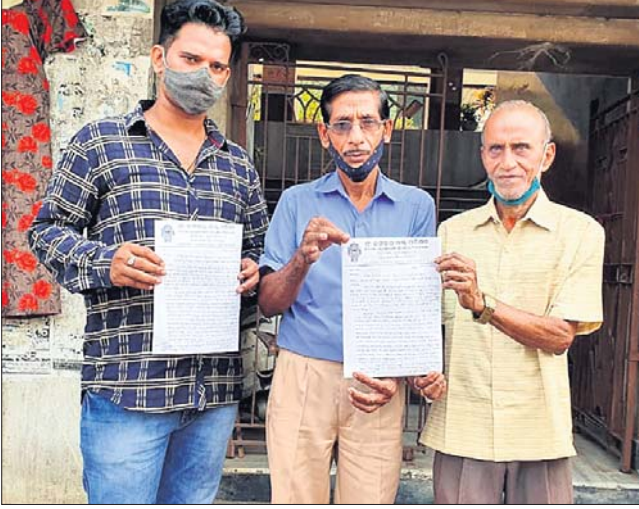
ସିଂହଦ୍ୱାର ଥାନାରେ ଏତଲା ଦେବାକୁ ଆସିଥିବା ଶ୍ରୀଜଗନ୍ନାଥ ଭକ୍ତ ପରିଷଦର କର୍ମକର୍ମୀ।

ପୁରୀ ଅଫିସ୍, ୧୫୧୨: ଲିଖିତ ଭାବେ ଜଣାଇଛନ୍ତି ଯେ, ପୋଲିସ୍ କର୍ମଚାରୀଙ୍କ ଏତଲା କାର୍ଯ୍ୟକଳାପ ଜଗନ୍ନାଥ ସଂସ୍କୃତି ବିରୋଧୀତରଣ କରୁଛି। ଭକ୍ତମାନଙ୍କ ଆବେଗକୁ ବଦି ୨ଜଣ ପୋଲିସ୍ କର୍ମଚାରୀ ଅବହା ସେବନ କରୁଥିବାର ଦୃଶ୍ୟ ସାମାଜିକ ଗଣମାଧ୍ୟମରେ ଭାଇରାଲ ହେଉଛି। 'ଧରନ୍ତ୍ରୀ'ରେ ଏହି ଖବର ପ୍ରକାଶିତ ହେବା ପରେ ଫଟୋ ସାମାଜିକ ଗଣମାଧ୍ୟମରେ ଘୁରି ଚାଲିଥିଲା। ସୋମବାର ଶ୍ରୀଜଗନ୍ନାଥ ଭକ୍ତ ପରିଷଦ ଏ ନେଇ ସିଂହଦ୍ୱାର ଥାନାରେ ଏତଲା ପୋଲିସ୍ କର୍ମଚାରୀଙ୍କ ଏତଲା କାର୍ଯ୍ୟକଳାପକୁ ନିନ୍ଦା କରିଥିବା ବେଳେ ଆଇନଗତ କାର୍ଯ୍ୟାନୁଷ୍ଠାନ ବାଦି କରିଛନ୍ତି। ଅଭିଯୋଗକାରୀମାନେ