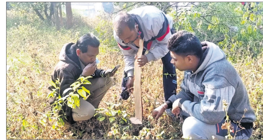
ବନ ବିଭାଗ ଅଧିକାରୀମାନେ ଚନ୍ଦ୍ର କରୁଛନ୍ତି ।

ଲୁଚିନେଲେ ସୁନାଗହଣା ସମାଜୀୟ କୁଳରୁ ସହ ସାଧକଶିଳ୍ପିକ ଚମ୍ପର ଚନ୍ଦ୍ର