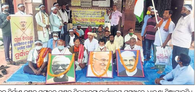
ନବ ନିର୍ମାଣ କୃଷକ ସଙ୍ଗଠନ ପକ୍ଷରୁ ବିକାଳକ କାର୍ଯ୍ୟାଳୟ ସମ୍ମୁଖରେ ଧାରଣା ଦିଆଯାଇଛି।

କରତସିଂହପୁର ଅଫିସ/ ବାଲିଆ, ୧୫୧୨ କେନ୍ଦ୍ରୀୟ କୃଷି ଆଇନ-୨୦୨୦ ପ୍ରତ୍ୟାହାର ଦାବିରେ ଦିଲ୍ଲୀରେ ଚାଲିଥିବା ଆନ୍ଦୋଳନକୁ ସମର୍ଥନ କରି ସୋମବାର କରତସିଂହପୁର ଜିଲ୍ଲାପାଳଙ୍କ କାର୍ଯ୍ୟାଳୟ ଆଗରେ ନବ ନିର୍ମାଣ କୃଷକ ସଙ୍ଗଠନ ତରଫରୁ ସତ୍ୟାଗ୍ରହ କରାଯିବା ସହ ବିରୋଧ ପ୍ରଦର୍ଶନ କରାଯାଇଥିଲା। ପୂର୍ବରୁ ସଙ୍ଗଠନ କର୍ମୀମାନେ ଏକତ୍ରିତ ହୋଇ କେନ୍ଦ୍ର ସରକାରଙ୍କ ଚାଷୀମାନଙ୍କ ନୀତିକୁ ସମାଲୋଚନା କରିବା ସହ ନାରାବାଜୀ