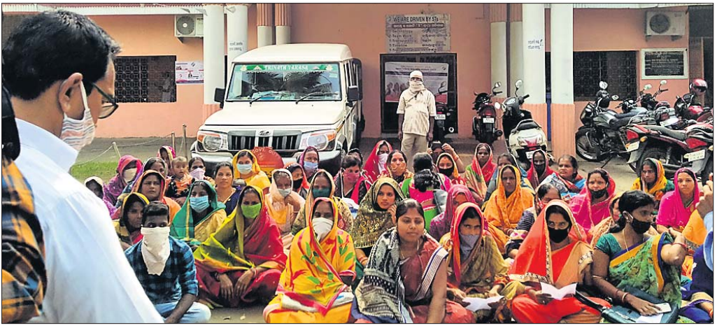
ମହିଳାମାନେ ଶୈଳକନ୍ୟ ଦୁର୍ଗତିର ତଦନ୍ତ ଦାବି କରି ବୁକ କାର୍ଯ୍ୟାଳୟ ସମ୍ମୁଖରେ ଧାରଣା ଦେଇଛନ୍ତି।

ବୁକକ, ୧୫୧୨ (ଡି.ଏନ୍.ଏ.) ବୁକକ ବୁକ ଅନ୍ତର୍ଗତ ବାଲିଆ ପଞ୍ଚାୟତରେ ସ୍ୱଳ ଭାବେ ଅଭିଯାନରେ ଶୈଳକନ୍ୟ ନିର୍ମାଣ ଯୋଜନା ଓ କାର୍ଯ୍ୟାଦେଶ ବ୍ୟବସ୍ଥାରେ ଦୁର୍ଗତି ହୋଇଥିବା ଅଭିଯୋଗ ହୋଇଛି। ମାତ୍ର ସୂତନା ଅଧିକାର ଆଇନରେ ବଳରେ ଏହି ଦୁର୍ଗତି ଉପରେ ଠିକ୍ ତଥ୍ୟ ପ୍ରଦାନ କରାଯାଇ ନ ଥିବା ଅଭିଯୋଗ କରି ସୋମବାର ପଞ୍ଚାୟତର ବହୁ ମହିଳା ବୁକ କାର୍ଯ୍ୟାଳୟ ଆଗରେ ଧାରଣା ଦେଇଥିଲେ। ଏ ସମ୍ପର୍କରେ ଦାବିପତ୍ର ବିଧି ଓ ଅଧିକ କୁମାର ପଞ୍ଚାୟତ ପ୍ରଦାନ କରିଥିଲେ। ସେମାନଙ୍କ ଅଭିଯୋଗ ଅନୁଯାୟୀ, ବାଲିଆ ପଞ୍ଚାୟତରେ ବହୁ ହିତାଧିକାରୀ ସରକାରଙ୍କ ଶୈଳକନ୍ୟ