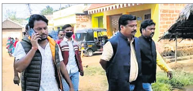
ବ୍ୟୁତପତନରେ ନୟାଗଡ଼ ଜିଲ୍ଲା କଂଗ୍ରେସର ଚିନ୍ ମୃଗିତ ଅନୁଧ୍ୟାନ କରୁଛନ୍ତି।