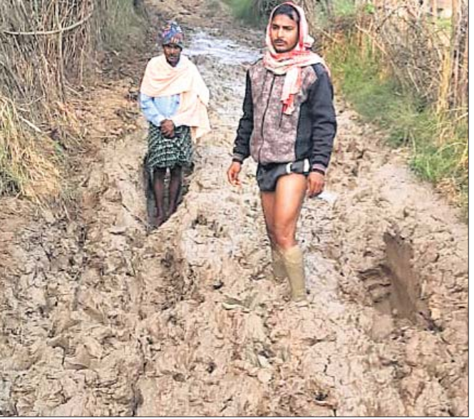
କାସୁଅ ପଥପଥ କୁଣ୍ଡିହା-ରୁଲକଡ଼ିହା ରାସ୍ତା।