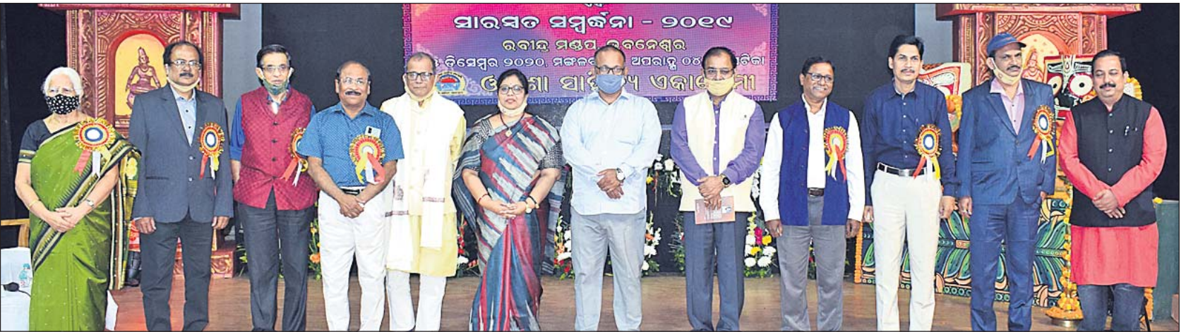
ରବୀନ୍ଦ୍ର ମଣ୍ଡପରେ ମଙ୍ଗଳବାର ଆୟୋଜିତ ଓଡ଼ିଶା ସାହିତ୍ୟ ଏକାଡେମୀ ପୁରସ୍କାର ଓ ସାରସ୍ୱତ ସମର୍ଥନା ଉତ୍ସବରେ ଅତିଥିଙ୍କ ସମ୍ମାନରେ ୨୦୧୯ ପାଇଁ ୧୫ ଏକାଡେମୀ ପୁରସ୍କାର ପାଇଥିବା ସାହିତ୍ୟ ସାରସ୍ୱତ ବ୍ୟକ୍ତିଗଣମାନେ।