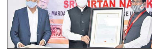
ଭୁବନେଶ୍ୱର, ୧୫.୧୨ (ସ୍ପେଶାଲ୍)