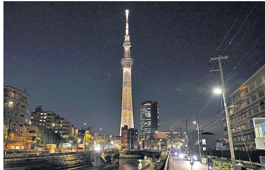
ଅଲିମ୍ପିକ ଟକିଓ ରିଲେର ୧୦୦ ଦିନ ପୂର୍ବରୁ କାପାନର ସର୍ବୋଚ୍ଚ ଟାଉର 'ଦି ଟୋକିଓ ସ୍କାସ୍କ୍ରାଟ୍ଟୁ' ମଙ୍ଗଳବାରଠାରୁ ଆଲୋକିତ କରାଯାଇଛି।