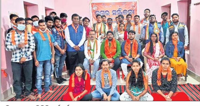
ସମ୍ମିଳନୀରେ ଏକତ୍ରିତ କର୍ମକର୍ତ୍ତା।

ହାତଖର୍ଚ୍ଚରେ ସହାୟକ ହୁଏ। ତେବେ ୧୫ବର୍ଷ ବୟସରୁ ଅଧ୍ୟାପ୍ୟ ଏହି ବୃଦ୍ଧିକୁ ଆପଣାଇ ଚାଷୀଙ୍କୁ କୁହୁଥିଲେ ପେଟ ପୋଷି ଆସିଲେ। ପୁଅମାନେ ବଡ଼ ହୋଇଗଲା ପରେ ପରିବାର ବୋଧେ ଆଉ ତାଙ୍କ ଉପରେ ପଡ଼ୁନାହିଁ। ତେବେ ଘରେ ବସି ସମୟକୁ ଅତିବାହିତ ନ କରି ଦେହରେ ବଳ ଥିବା ଯାଏଁ ସେ ନିଜକୁ ନିୟୋଜିତ କରି ଅର୍ଥ ଉପାର୍ଜନ କରିବେ ବୋଲି ପ୍ରକାଶ କରିଛନ୍ତି। ଏହା ଦ୍ୱାରା ସେ ଅନ୍ୟମାନଙ୍କ ପାଇଁ ପ୍ରେରଣା ଯୋଗାଇଥିବା ବେଳେ ସମାଜ ପାଇଁ ଏକ ବାଣୀ ବାଣ୍ଟିଛନ୍ତି। ବାଞ୍ଛକ୍ୟ ଭଣ୍ଡା ସହିତ ସେ ରାସନ ସାମଗ୍ରୀ ପାଉଥିବା ବେଳେ ଅଧ୍ୟାପ୍ୟ ଆବାସ ଯୋଜନାରେ ଘର ଖର୍ଚ୍ଚକି ମିଳିପାରି ନାହିଁ। ବାରମ୍ବାର ଅଭିଯୋଗ କଲେ ମଧ୍ୟ କେହି ତାଙ୍କ ରୁହାଣି ଶୁଣୁ ନ ଥିବା ସେ ଅଭିଯୋଗ କରିଛନ୍ତି। ତୁରନ୍ତ ଆବାସ ଯୋଜନାରେ ତାଙ୍କୁ ଘର ଖର୍ଚ୍ଚ ଯୋଗାଇଦେବାକୁ ଅଞ୍ଚଳବାସୀ ଦାବି କରିଛନ୍ତି।