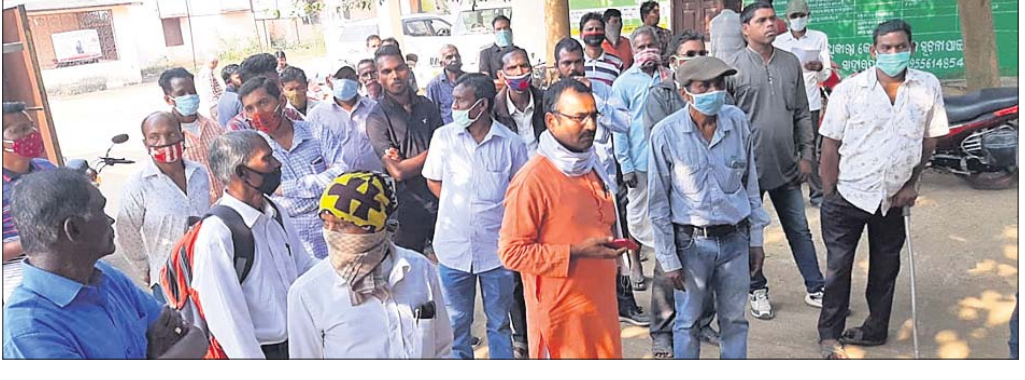
ବୁକ୍ ସମ୍ମୁଖରେ ଚାଷୀ।

କେନ୍ଦୁଝର, ୧୫୧୨ (ଡି.ଏନ୍.ଏ.): କେନ୍ଦୁଝର ଜିଲ୍ଲା ବେପାମରିକ ଯୋଗାଣ ବିଭାଗ ସ୍ତରୀ ଏକ ସଂଘୀୟ ସମିତିରୁ ଚାଷୀଙ୍କୁ ନେଇ ୧୨ ଦମ୍ପା ଦାବୀପତ୍ର ସାହାଯ୍ୟରେ ବିଡିଓଙ୍କୁ ପ୍ରଦାନ କରାଯାଇଛି। ବିଭିନ୍ନ ଦାବି ମଧ୍ୟରେ ଧାନ ମଣ୍ଡରେ କୁଳଖ୍ୟାଳ ପିଛା ୫ କିଲୋ ଧାନ କାଟ ବନ୍ଦ କରିବା, ଧାନ ବିକ୍ରି ପାଇଁ ନାମ