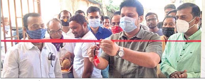
ଉଦ୍ଘାଟନୀ କାର୍ଯ୍ୟକ୍ରମରେ ବିଧାୟକ ବିଷୁବ୍ରତ ରାଉତରାୟ ଓ ଅନ୍ୟମାନେ।

ବାସୁଦେବପୁର, ୧୫୧୨ (ଡି.ଏନ୍.ଏ.): ବାସୁଦେବପୁର ନୂତନ ଉପକୋଷାଗାର କାର୍ଯ୍ୟାଳୟ ଗୃହ ମଙ୍ଗଳବାର ଉଦ୍ଘାଟିତ ହୋଇଛି। ମୁଖ୍ୟଅତିଥି ଭାବେ ଗ୍ଲାମାୟ ବିଧାୟକ ବିଷୁବ୍ରତ ରାଉତରାୟ ଯୋଗଦେଇ ଏହାକୁ ଉଦ୍ଘାଟନ କରିଥିଲେ। ଅନ୍ୟତମ ଅତିଥି ଭାବେ ଅତିରିକ୍ତ ଜିଲ୍ଲାପାଳ ଅଧିକାରୀ କୁମାର