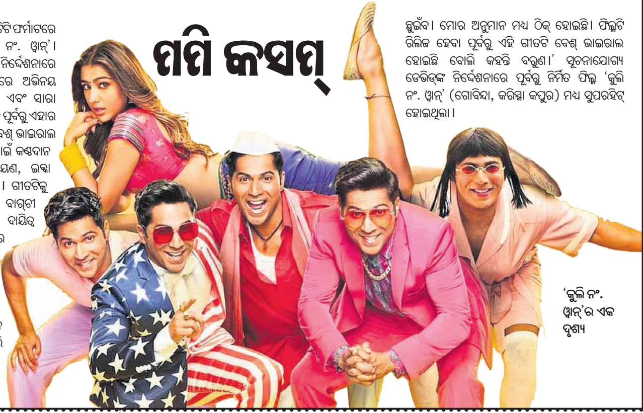
'କୁଲି ନଂ. ୩'ର ଏକ ଦୃଶ୍ୟ