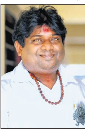
ନିର୍ମାଣ କରିବାକୁ ଚିନ୍ତା କଲି। ଏହି ସମୟରେ ଅନେକ ବାଧାବିଘ୍ନର ସମ୍ମୁଖୀନ ହୋଇଛି। ମୋତେ ଉପରେ କହିବାକୁ ଗଲେ ଏହି ଫିଲ୍ମଟି ଏକ ସ୍ମରଣୀୟ ଫିଲ୍ମ ହେଉ ବୋଲି ଆଶା ରଖୁଛି।