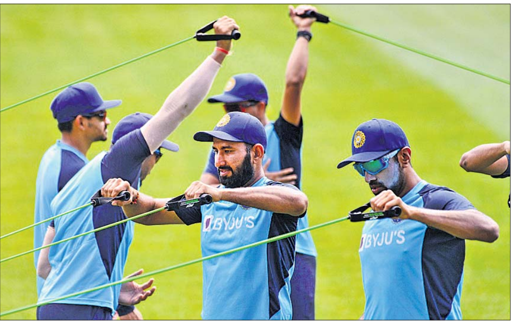
ଭାରତୀୟ ଦଳର ଅଭ୍ୟାସ।

ବିରାଟ କୋହଲିଙ୍କ ନେତୃତ୍ୱାଧୀନ ଭାରତ ଓ ଘରୋଇ ଅଷ୍ଟ୍ରେଲିଆ ଦଳ ଗୁରୁବାରଠାରୁ ଆରମ୍ଭ ହେବାକୁ ଯାଉଥିବା ପ୍ରଥମ ଚେଷ୍ଟାରେ ମୁହାଁମୁହିଁ ହେବେ। ସ୍ଥାନୀୟ ଆତିଥେତ୍ତ ଓଭାଲ ଗ୍ରାଉଣ୍ଡରେ ଆୟୋଜନ ହେବାକୁ ଥିବା ଏହି ମ୍ୟାଚ ଦିବାନାହିଁ ଖେଳ ହେବ। ପିଙ୍କ ବଲରେ ଖେଳାଯିବାକୁ ଥିବା ଏହି ମ୍ୟାଚ ଉପରେ ସମସ୍ତଙ୍କ ନଜର ରହିଛି। ପ୍ରଥମଥର ପାଇଁ ତୁଳ୍ୟ ଦେଶ କୌଣସି ଦିବାରାତ୍ରି ଚେଷ୍ଟା ମ୍ୟାଚରେ ପରସ୍ପରକୁ ଭେଟିବେ। ଚେଷ୍ଟା ଉଭୟ ଦଳ ପାଇଁ ମଧ୍ୟେଷ୍ଟ ଚ୍ୟାଲେଞ୍ଜ ରହିଛି। ଗତ ସିରିଜରେ ଭାରତ ଘରୋଇ ଅଷ୍ଟ୍ରେଲିଆକୁ ୨-୧ରେ ପରାସ୍ତ କରି ଭିଟ୍ ହାସଲ କରିଥିଲା। ଚେଷ୍ଟା ଏଥର ଅଷ୍ଟ୍ରେଲିଆ ଏହି ପରାଜୟର ପ୍ରତିଶୋଧ ନେବାକୁ ପ୍ରୟାସ କରିବ। ଉଭୟ ଦଳରେ ବିଶ୍ୱପ୍ରସିଦ୍ଧ ଖେଳାଳିମାନେ ରହିଛନ୍ତି।