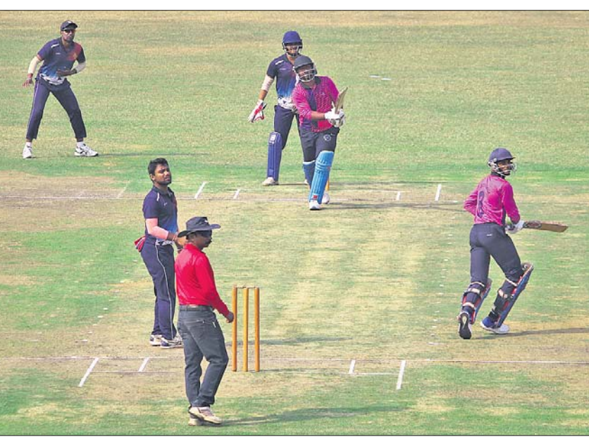
ଜଗତସିଂହପୁର ଓ ପୁରୀ ମଧ୍ୟରେ ଅନୁଷ୍ଠିତ ମ୍ୟାଚ୍।