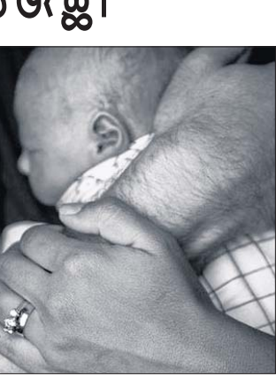
କେନ୍ ଫ୍ରିଲିୟମସନ୍ ଓ ତାଙ୍କ ନବଜାତ ସନ୍ତାନ।