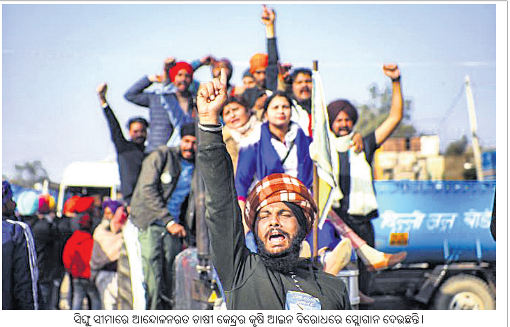
ସିନ୍ଧୁ ସାମାଜେ ଆନ୍ଦୋଳନରତ ରାଷ୍ଟ୍ରୀୟ କେନ୍ଦ୍ର କୃଷି ଆଇନ ବିରୋଧରେ ସ୍ଲୋଗାନ ଦେଉଛନ୍ତି।

ନୂଆଦିଲ୍ଲୀ, ୧୭୧୨ ଦିଲ୍ଲୀ ସାମାଜେ ରାଷ୍ଟ୍ର ଆନ୍ଦୋଳନ ଗୁରୁତ୍ୱର ଚତୁର୍ଥ ସପ୍ତାହରେ ପହଞ୍ଚିଥିବାବେଳେ ସର୍ବନିମ୍ନ ସହାୟକ ମୂଲ୍ୟ (ଏମ୍ଏସ୍ପି)କୁ ନେଇ ସରକାର ଲିଖିତ ପ୍ରତିଶ୍ରୁତି ଦେବାକୁ ପ୍ରସ୍ତୁତ ବୋଲି କେନ୍ଦ୍ର କୃଷିମନ୍ତ୍ରୀ ନରେନ୍ଦ୍ର ସିଂ ଚୋପାରା ଗଣତାନ୍ତ୍ର ମନ୍ତ୍ରାଳୟରେ କହିଛନ୍ତି।