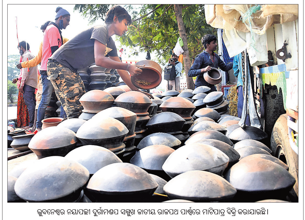
ଭୁବନେଶ୍ୱର ନୟାପଲୀ ଦୁର୍ଗାମଣ୍ଡପ ସମ୍ମୁଖ ଜାତୀୟ ରାଜପଥ ପାର୍ଶ୍ୱରେ ମାଟିପାତ୍ର ବିକ୍ରି କରାଯାଇଛି।

ଡାହାଣା ସନ୍ଦେହରେ ବୃକ୍ଷାଙ୍କୁ ଚାଙ୍ଗିଆରେ ହତ୍ୟା କେନ୍ଦୁଝର/କେଙ୍କିକୋଟ, ୧୭।୧୨ (ସ୍ୱ.ପ୍ର./ଡି.ଏନ.ଏ.): କେନ୍ଦୁଝର ଜିଲ୍ଲା ଘଟଣା ଥାନା ଭୋଳଦେଫା ଗ୍ରାମରେ ପ୍ରକ୍ଷା ସାହିରେ ବୁଧବାର ଡାହାଣା ସନ୍ଦେହରେ ଜଣେ ବୃକ୍ଷାଙ୍କୁ ଚାଙ୍ଗିଆରେ ହାଣି ନିର୍ମମ ଭାବେ ହତ୍ୟା କରାଯାଇଛି।