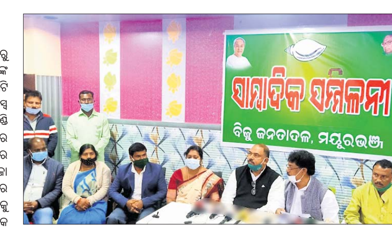
ଖବରଦାତା ସମ୍ମିଳନୀରେ ଉପସ୍ଥିତ ବିଜେଡି ନେତୃମଣ୍ଡଳ।

ବାରପଦା ଅପିସ, ୧୭/୧୨ । ମୟୂରଭଞ୍ଜ ଜିଲ୍ଲା ବିକ୍ତ ଜନତା ଦଳ ପକ୍ଷରୁ ମହାରାଜା ଶ୍ରୀରାମଚନ୍ଦ୍ର ଭଞ୍ଜଦେଓଙ୍କ ୧୫୦ତମ ଜୟନ୍ତୀ ପାଳନ ଉଦ୍ଦେଶ୍ୟରେ ଶ୍ରୀ ପ୍ରସାଦ ଗୁହାଟ ହୋଇଛି।