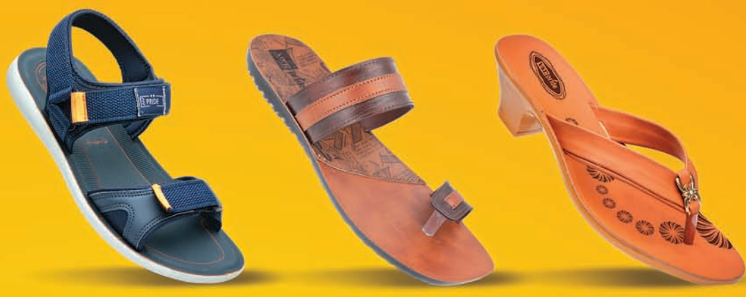
Art No. 3506 MRP: ₹349.00*

ସଠିକ୍ ରାସ୍ତା ବାଛିନ୍ତୁ । ଗର୍ବର ସହିତ ଚାଲନ୍ତୁ ।