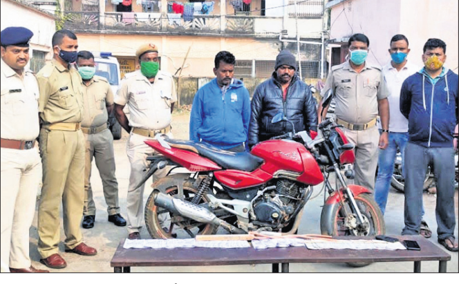
ପୋଲିସ୍ କର୍ମଚାରୀଙ୍କ ସହ ଗିରଫ ୨ ଅଭିଯୁକ୍ତ।