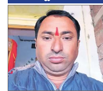
ରାଜସ୍ଵାମୀ ଯୁବକଙ୍କ ଦାନ ଖରାସାହାପୁର ଉଚ୍ଚ ବିଦ୍ୟାଳୟରେ ପଢ଼ାଉଥିବା ଶିଶୁମାରୀଙ୍କୁ ପଢ଼ାବେଳେ ଖୁଲାଇ ଦେଇଛନ୍ତି।