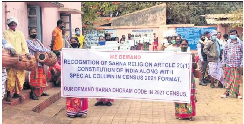
ବିକ୍ଷୁଙ୍କୁ ଦାବିପତ୍ର ଦେବାକୁ ଆସିଥିବା ସାରନା ସଂପ୍ରଦାୟର ଲୋକେ।