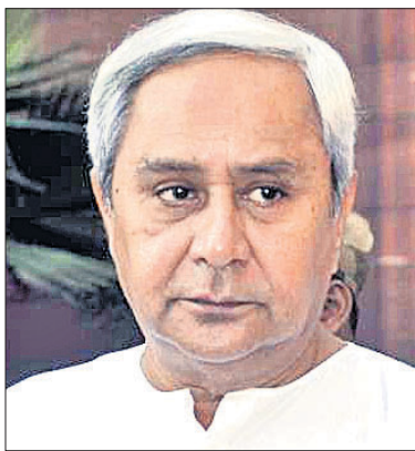
ପ୍ରଦାନ କରିଛନ୍ତି । ଇପିଏସ୍-୯୫ ପେନ୍ସନ ଉପଭୋକ୍ତାଙ୍କ ପେନ୍ସନ ବୃଦ୍ଧି କରିବାକୁ

୨୦୧୩ରେ ରାଜ୍ୟ ସଭା ସଦସ୍ୟ ଭାବେ କାର୍ଯ୍ୟ କରିଥିବା ଇପିଏସ୍-୯୫ ପେନ୍ସନ ଉପଭୋକ୍ତାଙ୍କ ପେନ୍ସନ ବୃଦ୍ଧି କରିବାକୁ ଗଙ୍ଗାଧାର ମିଶ୍ରଙ୍କୁ ଚିଠି ଲେଖିଲେ । ଇପିଏସ୍-୯୫ ପେନ୍ସନ ଉପଭୋକ୍ତାଙ୍କ ପେନ୍ସନ ବୃଦ୍ଧି କରିବାକୁ ଗଙ୍ଗାଧାର ମିଶ୍ରଙ୍କୁ ଚିଠି ଲେଖିଲେ । ଇପିଏସ୍-୯୫ ପେନ୍ସନ ଉପଭୋକ୍ତାଙ୍କ ପେନ୍ସନ ବୃଦ୍ଧି କରିବାକୁ ଗଙ୍ଗାଧାର ମିଶ୍ରଙ୍କୁ ଚିଠି ଲେଖିଲେ ।