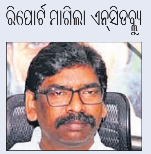
ରିପୋର୍ଟ ମାଗିଲା ଏନ୍‌ସିଡିଏ