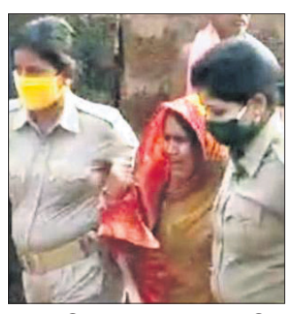
ହତ୍ୟା ଅଭିଯୁକ୍ତ ଭାରତୀୟ ସାହୁଙ୍କୁ ପୋଲିସ ଗିରଫ କରି ନେଉଛି।

ପାରିବାରିକ ଶତ୍ରୁତା ମନରେ ଦୁର୍ଘ୍ଟ କରିଥିଲା ପ୍ରତିହତ୍ୟା। ଏହି ଆକ୍ରୋଶରେ ବଳପୂର୍ବକ ଭାବରେ ଶୁଖିଲା କାଳିଆକୁ ପ୍ରସ୍ତୁତ କରାଯାଇଥିଲା କଫି ଯୋଗ୍ୟ।