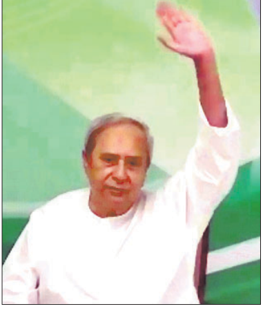
ଭିଡ଼ିଓ କନ୍ଫରେନ୍ସରେ ବିଜେଡି ସଭାପତି ନବୀନ ପଟ୍ଟନାୟକ

ଭୁବନେଶ୍ୱର, ୧୮.୧୨ (ବୁଧ୍ୱର) - ଜାତୀୟ ଦଳର ରାଜ୍ୟ ନେତା ମୂକ ପାଲଟିଛନ୍ତି । ରାଜ୍ୟ ସ୍ୱାର୍ଥକୁ ଅଣଦେଖା କରି ଶୀର୍ଷ ନେତାଙ୍କୁ ଖୁସି କରି ମତ୍ତା କିମ୍ପା କିଛି ବଡ଼ ପଦବୀ ହାସଲ କରିବା ସେମାନଙ୍କର ପୁଣ୍ୟ ଲକ୍ଷ୍ୟ ହୋଇଛି । ଓଡ଼ିଶାର ସ୍ୱତନ୍ତ୍ର ଐତିହ୍ୟର ପୁରସ୍କା ପାଇଁ ଜାତୀୟ ଦଳର ରାଜ୍ୟ ନେତାମାନଙ୍କର ଭଏସ୍ ନାହିଁ । ଏପରିକି ଜାତୀୟ ସ୍ତରରେ ଥିବା ନେତାଙ୍କ ପାଖରେ ରାଜ୍ୟ ବିଷୟ ଉଠାଇବାକୁ ଇଚ୍ଛା କରୁ ନାହାନ୍ତି । ଶୁକ୍ରବାର ବିଜେଡି ପୁଣ୍ୟ କାର୍ଯ୍ୟକାରୀଣା ବୈଠକରେ ବିଜୁ ମୁବ ଜନତା ଦଳର ପ୍ରଥମ ରାଜ୍ୟ କାର୍ଯ୍ୟକାରୀଣା ବୈଠକରେ ପୁଣ୍ୟ ଅତିଥି ଭାବେ ଯୋଗ ଦେଇ