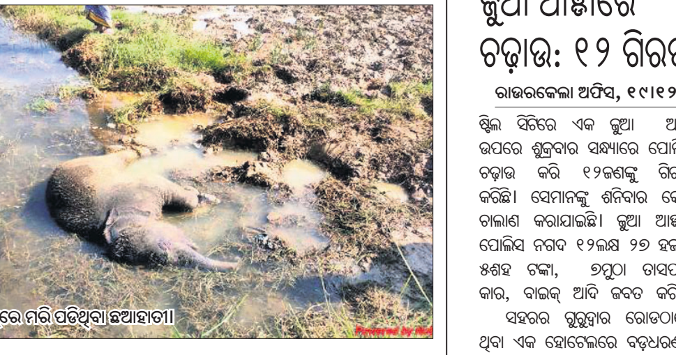
ଡ୍ୟାମ୍‌ରେ ମରି ପଡିଥିବା ଛୁଆହାତୀ।

ଖାଲିକୋ ପ୍ରମୁଖ ଉପସ୍ଥିତ ଥିଲେ । ଏନେକ କନ୍ଧାବାଞ୍ଜି ପଞ୍ଚାୟତର ସଭାରେ ଏକ ମାମଲା (ନଂ.୨୦/୨୦) ରୁକ୍ତ ହୋଇଛି।