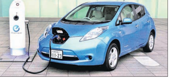
ଭୁବନେଶ୍ୱର, ୧୯/୧୨ (ସ୍ୱାଭାବ)

ସମଗ୍ର ବିଶ୍ୱରେ ବାୟୁ ପ୍ରଦୂଷଣ ବୃଦ୍ଧି ପାଇବାରେ ଲାଗିଛି। ତୁଟ ଶିଳ୍ପାୟନ ଓ ସହରୀକରଣ ଯୋଗୁ ପରିବେଶ ବେଳକୁ ବେଳ ଶ୍ୱାସ ରୁଦ୍ଧ ଅବସ୍ଥାକୁ