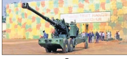
ବାଲେଶ୍ୱର ଅତିସ, ୧୯୧୨