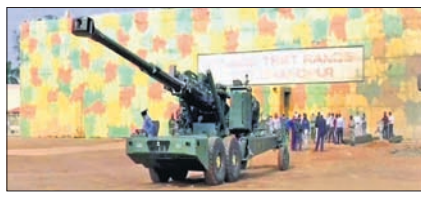
ବାଲେଶ୍ୱର ଅତିଏସ୍, ୧୯/୧୨