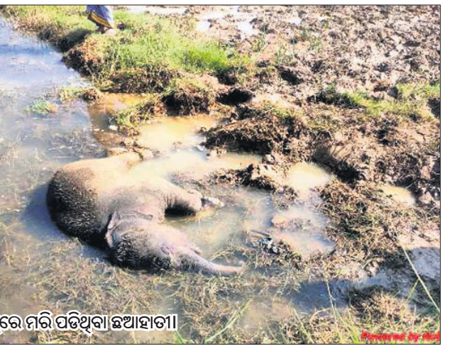
ଡ୍ୟାମ୍‌ରେ ମରି ପଡିଥିବା ଛୁଆହାତୀ।

ଖବର ପାଇ ବନ ବିଭାଗ ଉକ୍ତ ହାତୀପଲକୁ ରାତିରେ ବାଣ, ବାଦ୍ୟ ବଜାଇ ଉଦ୍ଧାରାଇଥିଲେ। ଫଳରେ ହାତୀପଲ ଛୁମ୍ବରୁଆଁ ଡ୍ୟାମ୍ ଆଡ଼କୁ ଚାଲି ଯାଇଥିଲେ। ହରଡ କିଆରିରେ ପଶି ଖାଇବା ସହ ନିକଟରେ ଥିବା ଡ୍ୟାମ୍‌କୁ ପାଣି ପିଇବାକୁ ଯାଇଥିବା ବେଳେ ଛୁଆହାତୀ କାହୁଁଆଁ ବାହାରି ନ ପାରି ମରି ଯାଇଥିବା ଅନୁମାନ କରାଯାଇଛି।