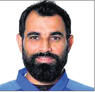
ଆଡିଲେଡ୍, ୧୯/୧୨ (ପି.ଟି.)

ଭାରତୀୟ ଦ୍ରୁତ ବୋଲର ପ୍ରଥମ ଟେଷ୍ଟ ମ୍ୟାଚର ଦ୍ୱିତୀୟ ଡିନିଂସରେ ବ୍ୟାଟିଂ କରିବାକୁ ବାଧ୍ୟ ହୋଇଥିଲେ।