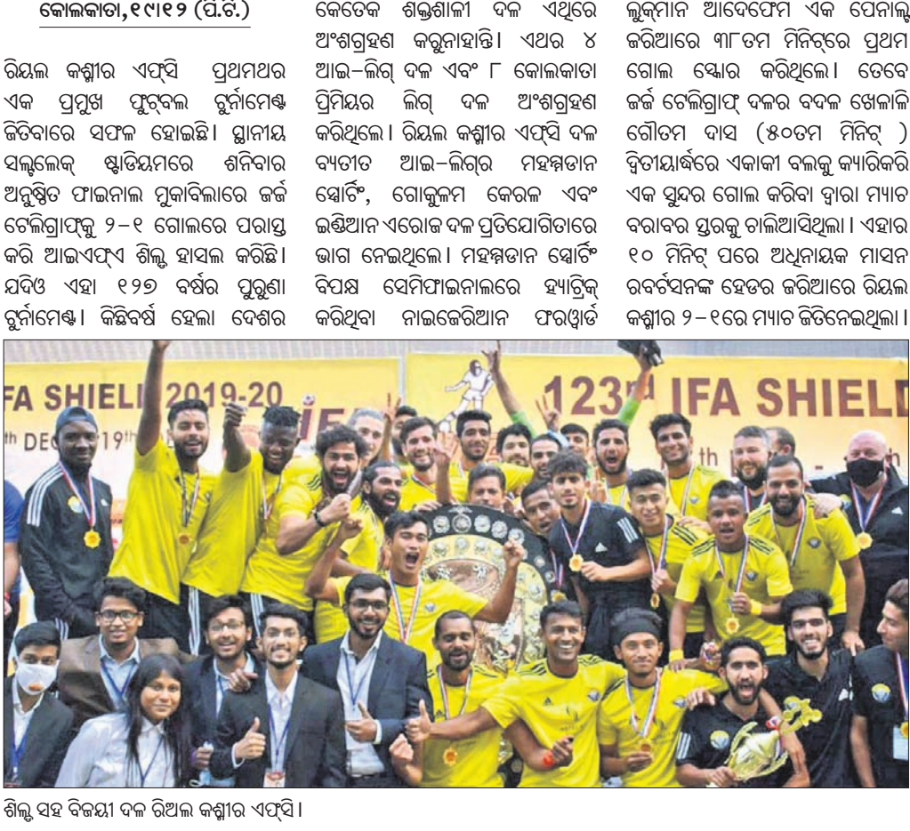
ଶିଲ୍ଡ ସହ ବିଜୟୀ ଦଳ ରିଅଲ କଶ୍ମୀର ଏସ୍ପି।