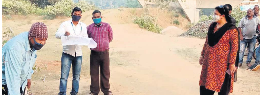
ଅଧିକାରୀମାନେ ଜମି ଚିହ୍ନଟ କରୁଛନ୍ତି।

ବନ୍ଧ, ୧୯।୧୨(ଡି.ଏନ.ଏ./ସ୍ଵ.ପ୍ର.) ଦୃଢ଼ନିୟମାବଳୀ ପ୍ରକାଶନ ପ୍ରକଳ୍ପର ଅଂଶ ରୂପେ ଶୁକ୍ରବାର ସନ୍ଧ୍ୟାରେ ଅଜଣା ଗାଡି ଧକ୍କାରେ ଜଣେ ବୃଦ୍ଧଙ୍କର ମୃତ୍ୟୁ ଘଟିଛି। ବୃଦ୍ଧଙ୍କର ପରିଚୟ ମିଳିପାରି ନାହିଁ। ଶନିବାର ସକାଳେ ଗ୍ରାମବାସୀଙ୍କର ସୂଚନା ପାଇ ପୋଲିସ୍ ସେଠାରେ ପହଞ୍ଚି ମୃତଦେହ ଉଦ୍ଧାର କରିଛି। ଏନେଇ ପୋଲିସ୍ ଏକ ମାମଲା (ନଂ ୧୪୦/୨୦) ଚଳାଇ ଦେଇଛନ୍ତି।