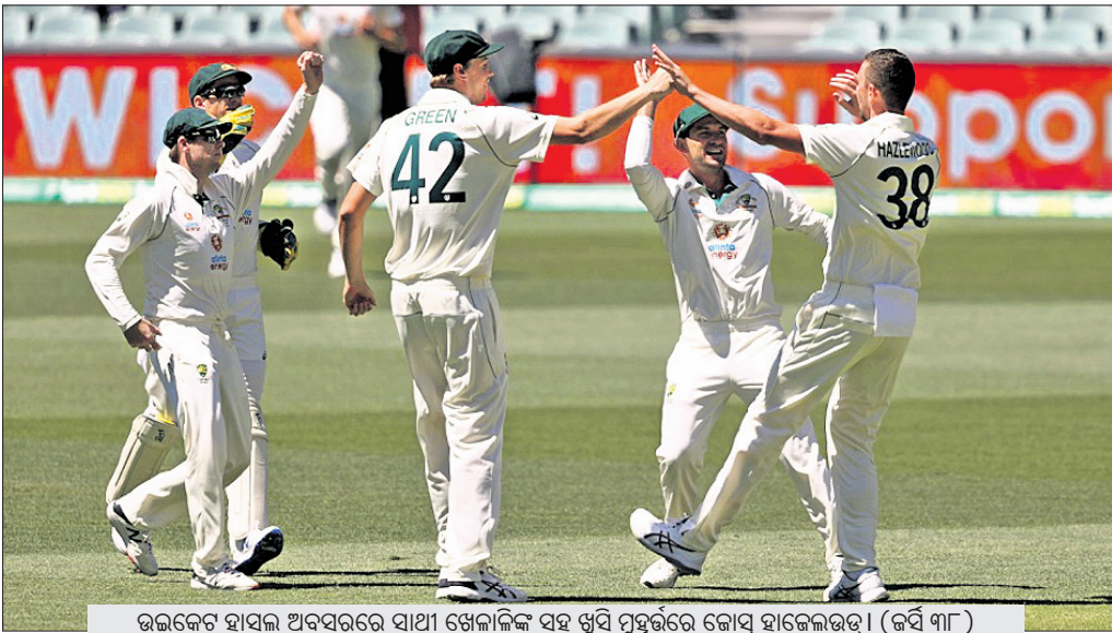
ଉଇକେଟ ହାସଲ କରିବା ପାଇଁ ଷ୍ଟୋର ସହ ଖୁସି ପୂର୍ଣ୍ଣ ହୋଇଛନ୍ତି। (କର୍ମୀ ୩୮)

୨୪୪ ରନ ସଂଗ୍ରହ କରିଥିଲା। ଏହାର ଫାଇଦା ଉଠାଇ ଅଷ୍ଟ୍ରେଲିଆ ଅତି ସହଜରେ ବିଜୟ ହୋଇଥିଲା।