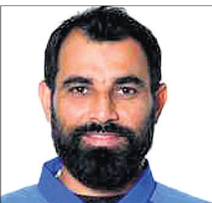
ଅତିରକ୍ତ, ୧୯୧୨ (ପି.ଟି.)