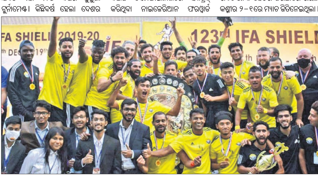
ଶିଲ୍ଡ ସହ ବିଜୟୀ ଦଳ ରିଅଲ କଶ୍ମୀର ଏସପି