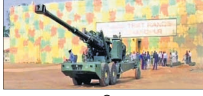
ବାଲେଶ୍ୱର ଅତିସ୍ୱର, ୧୯୧୨