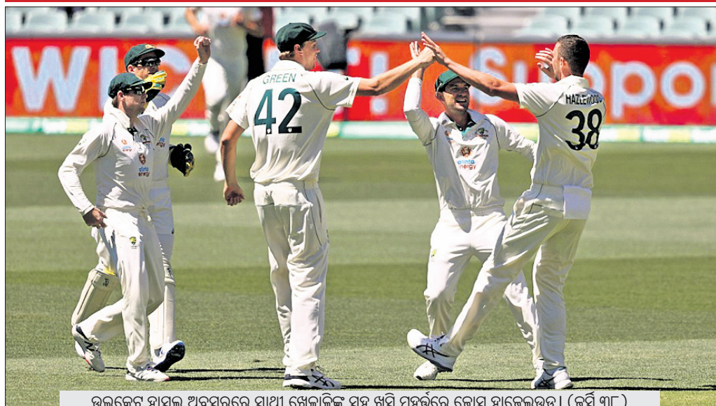
ଉଇକେଟ ହାସଲ କରିବା ପାଇଁ ଷ୍ଟୋର ସହ ଖୁସି ପୁଝୁରେ ଗୋଲ୍ ହାଜିରା କରିବା (କପ୍ ଶାଫ୍)