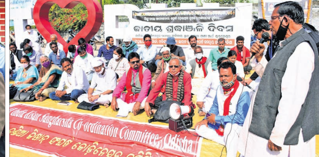
ସଂସ୍କୃତ କିମ୍ପାନ ମୋର୍ଟା ପକ୍ଷରୁ ରବିବାର ଭୁବନେଶ୍ୱର ମାଷ୍ଟରକ୍ୟାମ୍ପନ ଛକରେ ଶହାଦ କୃଷକଙ୍କୁ ଶ୍ରଦ୍ଧାଞ୍ଜଳି ଦିଆଯାଇ ଉପସ୍ଥିତ ଗଞ୍ଜାମ ଓ କୃଷକନେତା।