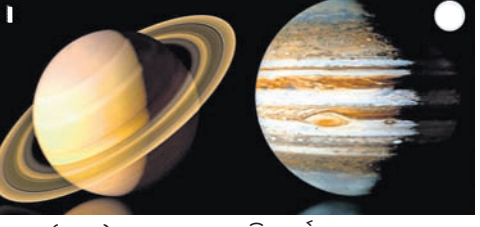
ସଂଯୋଗ (ନାସା) ପକ୍ଷରୁ କୁହାଯାଇଛି । ସୂର୍ଯ୍ୟାସ୍ତ ପରେ ଭାରତର ଅଧିକାଂଶ ସହରର ଲୋକେ ଏହି ଦୃଶ୍ୟ ଦେଖିପାରିବେ ।

କୋଲକାତା, ୨୦୧୯: ଏକ ବିରଳ ସଂଯୋଗକ୍ରମେ ସୋମବାର ଶନି ଓ ବୃହସ୍ପତି ଯୋଗରେ ନିକଟତର ହେବେ । ଏହାପରେ ପୃଥିବୀ ପୃଷ୍ଠରୁ ଉଭୟ ଗ୍ରହ ଗୋଟିଏ ଉଜ୍ଜ୍ୱଳ ଚାନ୍ଦର ଭଳି ପ୍ରତୀକ୍ଷାମାନ ହେବେ । ୧୨୨୩ ମସିହା ପରଠାରୁ ଏଭଳି ଘଟଣା କେବେ ଦେଖିବାକୁ ମିଳି ନ ଥିଲା । ବୈଜ୍ଞାନିକଗୁଡ଼ିକ କହୁଛନ୍ତି ଯେହେତୁ ପ୍ଲାନେଟାରିୟମରେ ସନ୍ଧ୍ୟା ସାଢ଼େ ୬ଟାକୁ ସାଢ଼େ ୭ଟା ମଧ୍ୟରେ ଏହି ଦୃଶ୍ୟ ଦେଖିବା ପାଇଁ ବ୍ୟବସ୍ଥା ହୋଇଛି । ଏଭଳି ସଂଯୋଗ ଆସନ୍ତା ୬୦ ବର୍ଷ ମଧ୍ୟରେ ଦେଖିବାକୁ ମିଳିବ ନାହିଁ ବୋଲି ଆମେରିକା ମହାକାଶ ଗବେଷଣା