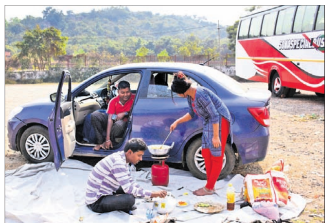
ଖଣ୍ଡଗିରି ନିକଟ ଏକ ଖୋଲାଘାଟରେ ପର୍ଯ୍ୟଟକମାନେ ଭୋଜି କରୁଛନ୍ତି।