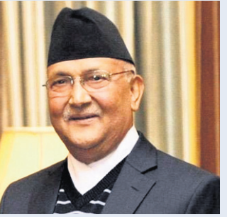
କେ.ପି. ଶର୍ମା ଓଲି

କରିବା ନିମନ୍ତେ ନିଷ୍ପତ୍ତି ନେଇଥିଲେ । ପାଇଁ ମୋକ୍ଷ ଭଙ୍ଗ ପାଇଁ ଓଲି ସରକାରଙ୍କୁ ଏନ୍ସିପି ଅଧ୍ୟକ୍ଷ ତଥା ପୂର୍ବତନ ପ୍ରଧାନମନ୍ତ୍ରୀ ଶେର ବାହାଦୂର ଦେଉବା କଡ଼ା ସମାଲୋଚନା କରିଛନ୍ତି । ଓଲି ଦେଶରେ ଏକଦଳୀୟ ଶାସନ ବ୍ୟବସ୍ଥା ଲାଗୁ କରିବାକୁ ଉଦ୍ୟମ କରୁଥିବା ସେ କହିଛନ୍ତି । ଶାସକ ଏନ୍ସିପିର ବୁଦ୍ଧଗୋଷ୍ଠୀ ମଧ୍ୟରେ ଦୀର୍ଘଦିନ ହେଲା ଟଣାଓଟରା ଲାଗିରହିଥିବାରୁ ପ୍ରଧାନମନ୍ତ୍ରୀଙ୍କ ଉପସ୍ଥାପନା ଦାବି କରିଥିଲେ ପ୍ରଚଣ୍ଡ ଏବଂ ମାଧ୍ୱ ନେପାଳ । ସରକାର ଓ ଦଳକୁ ଜରୁରୀ ବୈଠକ ଡାକିଛି । ଦିନକ ପୂର୍ବରୁ ଏନ୍ସିପି ଏବଂ ରାଷ୍ଟ୍ରୀୟ ଜନତା ପାର୍ଟି ପାଇଁ ମୋକ୍ଷ ଭଙ୍ଗର ସ୍ୱତନ୍ତ୍ର ଅଧିବେଶନ ଜଣାପଡିଛି । ଏକ ସଂଖ୍ୟାଗରିଷ୍ଠ ଦଳର