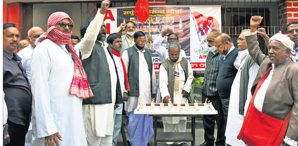
କୃଷି ଆଇନକୁ ବିରୋଧ କରି ଦିଲ୍ଲୀ ଚଲେ। ଆନ୍ଦୋଳନରେ ସାମିଲ ହୋଇ ଶହାଦ ହୋଇଥିବା ଗଞ୍ଜାମ ଉଦ୍ଦେଶ୍ୟରେ ରବିବାର ଭୁବନେଶ୍ୱର ଭଗବତୀ ଭବନରେ ଏଆଇକେଏସ୍ ପକ୍ଷରୁ ମହମବତୀ କାଳି ଶ୍ରଦ୍ଧାଞ୍ଜଳି ଦିଆଯାଇଛି।