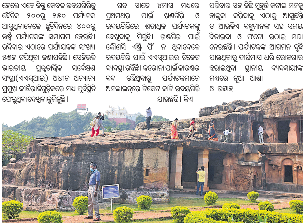
ଉଦୟଗିରିରେ ପର୍ଯ୍ୟଟକମାନେ ଐତିହ୍ୟ ବୁଝି ଦେଖୁଛନ୍ତି।

ରାଜ୍ୟରେ କରୋନା ସଂକ୍ରମଣ କମିବାରେ ଲାଗିଛି। ଧୀରେ ଧୀରେ ସ୍ଥିତି ସ୍ୱାଭାବିକ ହେଉଥିବା ବେଳେ ଦୀର୍ଘ ୮ମାସରୁ ଉର୍ଦ୍ଧ୍ୱ ସମୟ ଧରି ଲକ୍ଷ୍ମୀପୁର ଓ ଶତ୍ରୁଘ୍ନ କଟକଣାରେ ରହିଥିବା ଲୋକେ ଏବେ ଶୀତଳ ମଞ୍ଚା ନେବାକୁ ବାହାରକୁ ବାହାରିଛନ୍ତି। ଶୀତୁଆ ସକାଳ ହେଉ କି ସନ୍ଧ୍ୟାରେ ରାଜଧାନୀର ବିଭିନ୍ନ ପର୍ଯ୍ୟଟନସ୍ଥଳୀରେ ଦେଖିବାକୁ ମିଳିଲାଣି ଗହଳି ଚଢ଼କି। ଖଣ୍ଡଗିରି, ଉଦୟଗିରି ସହ ଧଉଳି ଶାନ୍ତିସ୍ତୁପ, ବିଭିନ୍ନ ପାର୍କ ଓ ଐତିହାସିକ କୀର୍ତ୍ତିରାଜି ପରିସରରେ ପର୍ଯ୍ୟଟକଙ୍କ ଭିଡ଼ ଜମିଲାଣି। ଖଣ୍ଡଗିରି ଓ ଉଦୟଗିରିକୁ ଅଗଷ୍ଟରୁ ଖୋଲାଯାଇଥିଲେ ମଧ୍ୟ ଆରମ୍ଭରୁ କରୋନା ଭୟରେ ପର୍ଯ୍ୟଟକମାନେ ଆସୁ ନ ଥିଲେ।