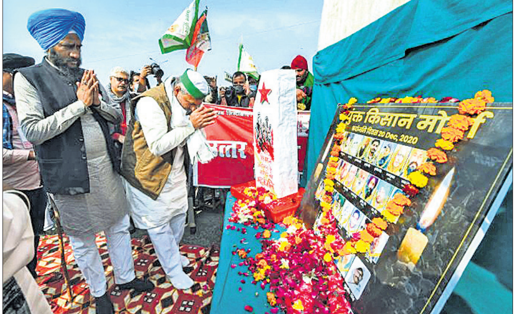
ଭାରତୀୟ କିଶାନ ଯୁନିୟନ ମୁଖ୍ୟପାତ୍ର ରାଜେଶ ଟିକାୟତ ଆନ୍ଦୋଳନରେ ମୃତ ଚାଷୀଙ୍କୁ ଶ୍ରଦ୍ଧାଞ୍ଜଳି ଜଣାଉଛନ୍ତି ।