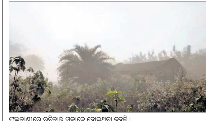
ଫୁଲବାଣୀରେ ରବିବାର ସକାଳେ ହୋଇଥିବା କୁହୁଡ଼ି।

ଘୋରୋନ୍ନ ଯାବଦ ଏହି ସୂଚନା ଦେଇଛନ୍ତି। ଏଥିସହିତ ସେମାନେ ୨୫ରୁ ୨୭ ବେଳେ ଜନସାଧାରଣ ଘରେ ଥାଳି ବାଡ଼େଇବା ପାଇଁ କୃଷକ ନେତାମାନେ ଆହ୍ୱାନ ଦେଇଛନ୍ତି। ସୋମବାର ଚାଷୀଙ୍କ ଉପବାସ ସମ୍ପର୍କରେ ସ୍ୱରାଜ କଣ୍ଠିଆ ମୁଖ୍ୟ