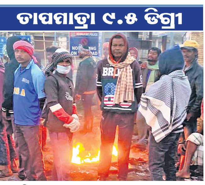
ଲୋକେ ନିଆଁ ଜାଳି ସେକି ହେଉଛନ୍ତି। ପାଇବ ବୋଲି ଆଶଙ୍କା ଥିବାରୁ ଜିଲ୍ଲା ପ୍ରଶାସନ ଗରିବ ଓ ଅସହାୟ ଲୋକଙ୍କ

ନିଆଁ ଜାଳି ସେକି ହେଉଥିବା ବେଳେ ରାତ୍ରୀ କଡ଼ରେ ରାତ୍ରୀଯାତ୍ରୀମାନେ କରୁଥିବା ପିଲା ଓ ବୟସ୍କ ବହୁ ଅସୁବିଧାର ସମ୍ମୁଖୀନ ହେଉଛନ୍ତି। ରାତ୍ରୀଆଶ୍ରୟ ଗୃହ ଜିଲ୍ଲା ମୁଖ୍ୟାଳୟଠାରୁ ୫/୬ କି.ମି. ଦୂରରେ ଥିବାରୁ ସେଠାକୁ ଯାଇ ଲୋକେ ଆଶ୍ରୟ ନେଇ ପାରୁନାହାନ୍ତି। ଏପରିକି ସମସ୍ତ ଯାତ୍ରୀବାହି ବସ୍ ପୁରୁଣା ବଜାର ବ୍ୟତୀତ ଯାତ୍ରୀମାନେ ରାତ୍ରୀ କଡ଼ରେ ପ୍ରବଳ ଥଣ୍ଡାରେ ଆଶ୍ରୟ ନେଉଥିବା ଅଭିଯୋଗ ହେଉଛି। ଗ୍ରାମାଞ୍ଚଳ ଓ ପାହାଡ଼ିଆ ଅଞ୍ଚଳରେ ଗରିବ ଲୋକେ ପ୍ରବଳ ଥଣ୍ଡାକୁ ଚାହୁଁ ପାରୁନାହାନ୍ତି। ରାତିରେ ନିଆଁ ଜାଳି ବିପଦଭରଣ ଅବସ୍ଥାରେ ଶୋଭାପାଳି କମଳ ଓ ଶୀତ ବସ୍ତୁ ଆବାବକୁ ଭଙ୍ଗାଦବରା ଘରେ ବହୁ କଷ୍ଟରେ ଅନେକ ଗରିବ ଲୋକ ଅନିଦ୍ରା ହୋଇ ନିଆଁ ପାଖରେ ବସି ରାତି କଟାଉଛନ୍ତି। ଜିଲ୍ଲାରେ ଶୀତର ପ୍ରକୋପ ଆହୁରି ବୃଦ୍ଧି