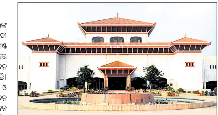
ଓଲିଙ୍ଗର ବିବାଦ ଲାଗିରହିଥିଲା । ଶାସକ ଦଳର ବୁଦ୍ଧଗୋଷ୍ଠୀ ମଧ୍ୟରେ ବିବାଦ ଚରମ ସୀମାରେ ପହଞ୍ଚିବା ପରେ ଓଲି

ପ୍ରଧାନମନ୍ତ୍ରୀ କେ.ପି. ଶର୍ମା ଓଲିଙ୍ଗ ସୁପାରିସକ୍ରମେ ରାଷ୍ଟ୍ରପତି ବିଦ୍ୟା ଦେବୀ ଭଣ୍ଡାରୀ ଉପରେ ନେପାଳ ପାଇଁ ମୋକ୍ଷ ଭଙ୍ଗ କରିବା ସହ 'ଏପ୍ରିଲ-ମେ'ରେ ମଧ୍ୟବର୍ତ୍ତୀକାଳୀନ ସାଧାରଣ ନିର୍ବାଚନ ପାଇଁ ତାରିଖ ଘୋଷଣା କରିଛନ୍ତି । ଏପ୍ରିଲ ୩୦ରେ ପ୍ରଥମ ପର୍ଯ୍ୟାୟ ଓ ମେ ୧୦ରେ ଦ୍ୱିତୀୟ ପର୍ଯ୍ୟାୟ ନିର୍ବାଚନ ଅନୁଷ୍ଠିତ ହେବ ବୋଲି ରାଷ୍ଟ୍ରପତି ଭବନ ପକ୍ଷରୁ ପ୍ରକାଶିତ ବିକ୍ଷେପରେ କୁହାଯାଇଛି ।