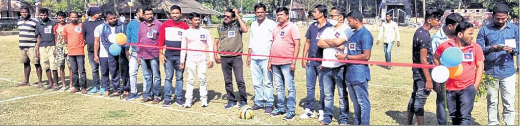
ଅତିଥିଙ୍କ ସହ ଖେଳାଳିମାନେ।