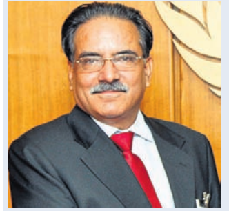
ପୁଷ୍ପ କମଳ ଦହଲ 'ପ୍ରଚଣ୍ଡ'