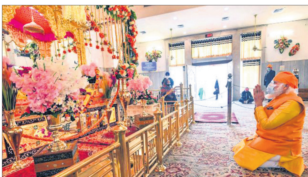
ଗୁରୁ ତେଜ ବାହାଦୁରଙ୍କ ୪୦୦ତମ ପ୍ରକାଶ ପର୍ବରେ ପ୍ରଧାନମନ୍ତ୍ରୀ ନରେନ୍ଦ୍ର ମୋଦି ଗୁରୁଦ୍ୱାରା ରାଜ୍ୟ ଗଜ ସାହିବରେ ପୂଜାର୍ଚ୍ଚନା କରୁଛନ୍ତି ।

ସେଖୁଲ ଭିଷ୍ଣା ପ୍ରୋଜେକ୍ଟ ବାତିଲ କରି ସେହି ଅର୍ଥକୁ ଗରିବ, ଅସହାୟଙ୍କ ଖାଦ୍ୟ ଓ ଅନ୍ୟାନ୍ୟ ଆବଶ୍ୟକତା ପୂରଣ ପାଇଁ ପ୍ରଦାନ କରାଯାଉ ବୋଲି ସମ୍ବଳନ ପକ୍ଷରୁ ଜାରି ଏକ ବିବୃତିରେ ଦାବି କରାଯାଇଛି । ମହାମାରୀ ସମୟରେ ଭାଇପା ନିର୍ବାଚନା କ୍ୟାମ୍ପେନ କରୁଥିବାବେଳେ ପାଇଁ ମୋକ୍ଷ ଅଧିବେଶନ ପାଇଁ କରୋନା ବାହାନା ଦେଖାଉଛି ।