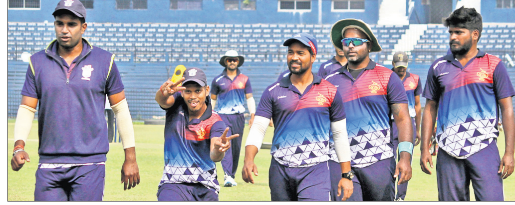
କଟକ-ଏ' ଦଳର ଖୋଜାଲିମାନେ।