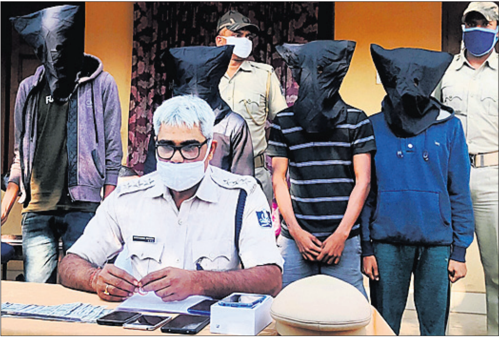
ଏଟିଏମ୍ ଭାଙ୍ଗି ଟଙ୍କା ଲୁଚ୍ ଘଟଣାରେ ଗିରଫ ୪ ଅଭିଯୁକ୍ତ।

ବ୍ୟବହୃତ ୨ଟି ବାଇକ୍ (ନଂ. ଓଡି. ୧୯ କ୍ୟୁ ୪୬୩୩ ଏବଂ ନଂ. ଓଡି. ୧୯ କେ ୧୦୩୫), ୪ ମୋବାଇଲ୍, ୨ ଗ୍ୟାସ୍ ସିଲିଣ୍ଡର, ଗୋଟିଏ ଗ୍ୟାସ୍ ସିଲିଣ୍ଡର ଚାକି, ୫ଟି ଏଟିଏମ୍ କ୍ୟାଶ୍ ଟ୍ରେ ସହ ୨୧,୫୦୦ ଟଙ୍କା ଜବତ କରାଯାଇଛି।