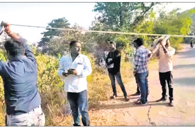
ଗଜପତି ଓ ଆନ୍ଧ୍ରପ୍ରଦେଶର ଶ୍ରୀକାକୁଳମ ଜିଲାର ରାଜ୍ୟ ଅଧିକାରୀମାନଙ୍କ ଉପସ୍ଥିତିରେ ମାପରୂପ ଗଠିତ।

ଗଜପତି ଜିଲା ପାରଳାଖେମୁଣ୍ଡିର ୧୨୬୭ ଜମିର ନାମା ଓଡ଼ିଶା ସରକାରଙ୍କ ପକ୍ଷରୁ ୧୨ ଏକର ଗାଈଜମି ଯୋଗାଇ ଦିଆଯାଇଥିଲା।