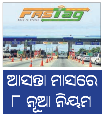
ଆସନ୍ତା ମାସରେ ୮ ନୂଆ ନିୟମ

ପହିଲାକୁ ଏକାଧିକ ପୁରୁଣା ନିୟମ ପରିବର୍ତ୍ତନ ହେବାକୁ ଯାଉଛି। ୮ ନୂଆ ନିୟମ ଲାଗୁ ହେବାକୁ ଯାଉଛି। ଜାନୁଆରୀ ୧ ରୁ ସବୁ ୪ ଚକିଆ ଯାନ ଲାଗି ଫାଷ୍ଟାଗ ବାଧ୍ୟତାମୂଳକ କରାଯାଇଛି। କେନ୍ଦ୍ର ସଡ଼କ ପରିବହନ ଏବଂ ରାଜପଥ ମନ୍ତ୍ରାଳୟ ପକ୍ଷରୁ ଏ ନେଇ ବିଜ୍ଞାପିତ ପ୍ରକାଶ ପାଇଛି। ମୋଟର ଯାନ ଆଇନ ୧୯୮୯ର ସଂଶୋଧନ ଫଳରେ ସରକାର ଏଭଳି ନିଷ୍ପତ୍ତି ନେଇଛନ୍ତି। ସେହିଭଳି ଟେକ୍ କ୍ଲିୟରାନ୍ସ ଲାଗି ପହିଲାକୁ ପଞ୍ଜିକିତ ପେ ସିୟମ ଲାଗୁ ହେବାକୁ ଯାଉଛି। ଏହି ନିୟମ ଲାଗୁ କରିବାକୁ ରିଜର୍ଭ ବ୍ୟାଙ୍କ ନିଷ୍ପତ୍ତି ନେଇ ଯାଉଛି। ୫୦ ହଜାର ଟଙ୍କାରୁ ଉର୍ଦ୍ଧ୍ୱ ମୂଲ୍ୟର ଟେକ୍ ଲାଗି କିଛି ସୂଚନାକୁ ରିଜନିଫର୍ମ କରିବାକୁ ହେବ। ଟେକ୍ ଇସ୍ତଫା କରୁଥିବା ବ୍ୟକ୍ତି ଟେକ୍ ନମ୍ବର, ଟେକ୍ ଟେକ୍