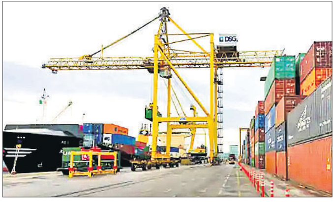
ସମ୍ପୂର୍ଣ୍ଣ ଅଂଶଧନ ବିକ୍ରୟ ସରକାର ବିକ୍ରି ଦାଖଲର ଶେଷ ତାରିଖ ଫେବୃଆରୀ ୧୩

ଶିପିଂ କର୍ପୋରେଶନରେ ରହିଥିବା ସମ୍ପୂର୍ଣ୍ଣ ଅଂଶଧନକୁ ସରକାର ବିକ୍ରି କରିଦେବେ। ଏଥି ଲାଗି ସରକାର ବିଦ୍ ଆହ୍ୱାନ କରିଛନ୍ତି। ଭାରତ ପେଟ୍ରୋଲିୟମ ଉପରେ ଆଉ ଏକ ରାଷ୍ଟ୍ରାୟତ୍ତ କମ୍ପାନୀକୁ ଘରୋଇକରଣ କରିବା ଲାଗି ସରକାର ପ୍ରକ୍ରିୟା ଜାରି କରିଛନ୍ତି। ଶିପିଂ କର୍ପୋରେଶନରେ ସରକାରଙ୍କ ୬୩.୫୫% ଅଂଶଧନ ରହିଛି। ଅଂଶଧନ ହାସଲ କରିବାକୁ ଥିବା ବ୍ୟକ୍ତି ବିଶେଷ ୨୦୨୧ ଫେବୃଆରୀ ୧୩ ପୂର୍ବକ ଏଥି ଲାଗି ଏକ୍ସପ୍ରେସନ ଅଫ୍ ଇଣ୍ଟେରେଷ୍ଟ ଦାଖଲ କରିବାକୁ ହେବ। ସେହିଭଳି ବିଦ୍ ସଂକ୍ରାନ୍ତ କୌଣସି ପ୍ରସଙ୍ଗରେ ଅବଗତ ହେବାକୁ ଥିବା ଗ୍ରାହ୍ୟାକାର ଆଡଭାଇଜରଙ୍କୁ ଜାଣିବାକୁ ୨୩ ଡିସେମ୍ବର ଯୋଗାଯୋଗ କରିବାକୁ କୁହାଯାଇଛି। ଶିପିଂ ବିକ୍ରୟରେ ପ୍ରାୟ କ୍ଷେତ୍ରରେ