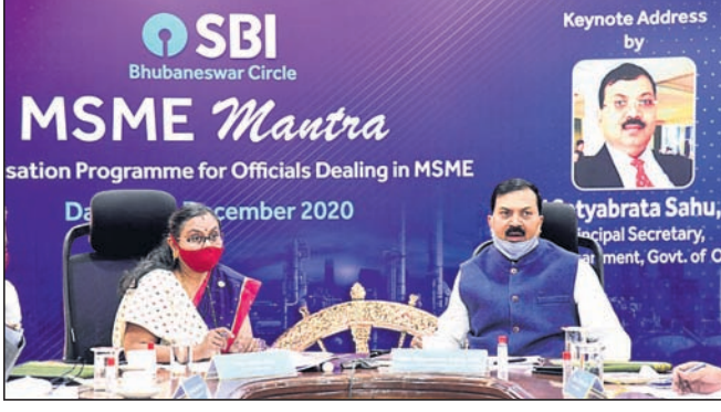
ଭୁବନେଶ୍ୱର, ୨୨ ଡିସେମ୍ବର

ଭାରତୀୟ କ୍ଷେତ୍ର ବ୍ୟାଙ୍କ (ଏସ୍‌ଏସ୍‌ଆଇ) ପକ୍ଷରୁ ସୋମବାର ଏକ ସ୍ୱତନ୍ତ୍ର ଏମ୍‌ଏସ୍‌ଏମ୍‌ଇ କାର୍ଯ୍ୟକ୍ରମ ସ୍ଥାନୀୟ ମୁଖ୍ୟ କାର୍ଯ୍ୟାଳୟ ପରିସରରେ ଅନୁଷ୍ଠିତ ହୋଇଯାଇଛି। ଏହି ଅବସରରେ ଆଇ.ଏସ୍‌ଏସ୍‌ଆଇ ଆଣ୍ଡ ଅନୁପାୟା ସିଂହଲର ବ୍ୟାଙ୍କୁ କୋର୍ଟରେ ଆବେଦନ କରାଯାଇଥିବା ଜଣାପଡ଼ିଛି। ଏସ୍‌ଏସ୍‌ଏମ୍‌ଇ ବର୍ତ୍ତମାନ ସଙ୍କଟ ସ୍ଥିତି ଦେଇ ଗତି କରୁଛି। ଅଗୋନୋମସ ରିଷ୍ଟ୍ରେକ୍ଟିଂ ସପୋର୍ଟ (ଏଆର୍‌ଏସ୍) କାର୍ଯ୍ୟକ୍ରମ ଲାଗି ମଧ୍ୟ ଏହି କମ୍ପାନୀ ଆବେଦନ କରିଛି।