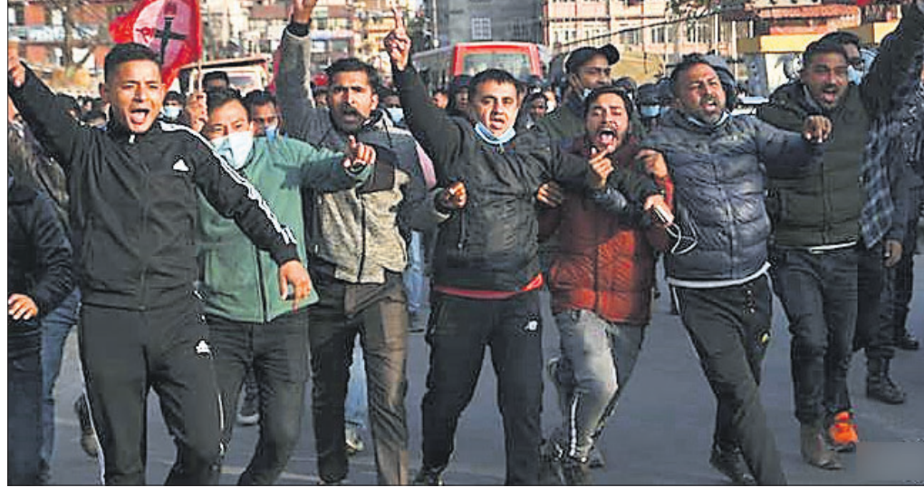
ପାର୍ଲିମେଣ୍ଟ ଭଙ୍ଗ ପ୍ରତିବାଦରେ କାଠମାଣ୍ଡୁରେ ବିରୋଧ ପ୍ରଦର୍ଶନ କରୁଛନ୍ତି ନେପାଳ ଛାତ୍ର ସଂଗଠନ ସଦସ୍ୟ।

ବିବାଦୀୟ ଘଟଣାକୁମରେ ନେପାଳ ପ୍ରଧାନମନ୍ତ୍ରୀ କେ.ପି. ଶର୍ମା ଓଲି ହଠାତ୍ ପାର୍ଲିମେଣ୍ଟ ଭଙ୍ଗ କରି ମଧ୍ୟବର୍ତ୍ତିକାଳୀନ ନିର୍ବାଚନ ଘୋଷଣା କରିବା ପରେ ଦେଶରେ ସାମ୍ବିଧାନିକ ସଙ୍କଟ ସୃଷ୍ଟି ହୋଇଛି। ନେପାଳ ସମ୍ବିଧାନରେ ପ୍ରଧାନମନ୍ତ୍ରୀ ଏକତରଫା ଭାବେ ପାର୍ଲିମେଣ୍ଟ ଭଙ୍ଗ କରିବାର ବ୍ୟବସ୍ଥା ନାହିଁ। ଦେଶର ଗଣତାନ୍ତ୍ରିକ ଇତିହାସରେ ଏହା ପ୍ରଥମ ପାର୍ଲିମେଣ୍ଟ ଭଙ୍ଗ। ପ୍ରଧାନମନ୍ତ୍ରୀ ଓଲିକ୍ ଭଙ୍ଗ ବିବାଦୀୟ ନିଷ୍ପତ୍ତି ବିରୋଧରେ ଅନେକ ବିରୋଧୀ ଦଳ ରାସ୍ତାକୁ ଓହ୍ଲାଇଛନ୍ତି। ଫଳରେ ନେପାଳ ରାଜନୈତିକ ଅନିଶ୍ଚିତତା ଭିତରକୁ ଟାଣିହୋଇ ଯାଇଛି।