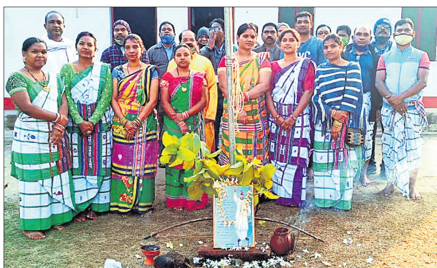
ନିରାହାର ଭାବେ ସାନ୍ତାଳୀ ଭାଷା ବିଜୟ ଦିବସ ପାଳନ କରାଯାଇଛି ।

ବର୍ତ୍ତମାନ, ୨୨।୧୨(ଡି.ଏନ.ଏ.) ବର୍ତ୍ତମାନ, ୨୨।୧୨(ଡି.ଏନ.ଏ.) ବର୍ତ୍ତମାନ, ୨୨।୧୨(ଡି.ଏନ.ଏ.)