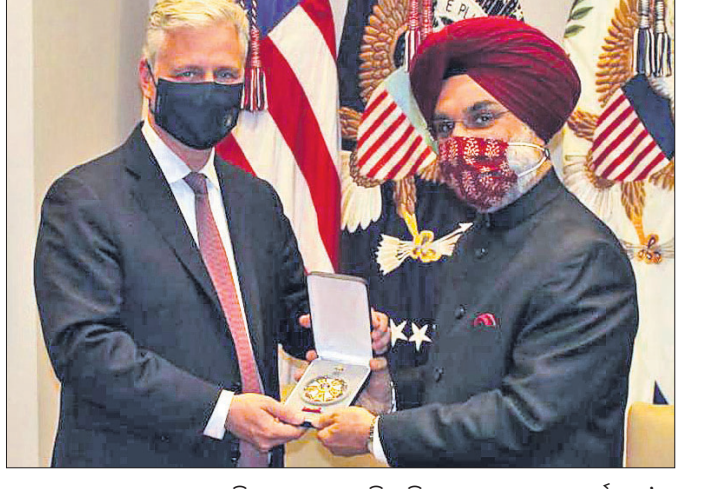
ପ୍ରଧାନମନ୍ତ୍ରୀ ନରେନ୍ଦ୍ର ମୋଦିଙ୍କ ପକ୍ଷରୁ ତରଞ୍ଜିତ ସିଂ ସାଣ୍ଡୁ ଏଏସଏଏ ରବର୍ଟ ଓ' ବ୍ରିସନଙ୍କଠାରୁ ପୁରସ୍କାର ଗ୍ରହଣ କରୁଛନ୍ତି।

ପ୍ରଧାନମନ୍ତ୍ରୀ ନରେନ୍ଦ୍ର ମୋଦିଙ୍କୁ ଆମେରିକା ରାଷ୍ଟ୍ରପତି ଡୋନାଲ୍ଡ ଟ୍ରମ୍ପ ଆମେରିକାର ଶୀର୍ଷ ସମ୍ମାନ 'ଲିଜିଅନ ଅଫ ମେରିଟ୍'ରେ ସମ୍ମାନିତ କରିଛନ୍ତି। ମୋଦିଙ୍କ ପକ୍ଷରୁ ଆମେରିକାରେ ଅବସ୍ଥାପିତ ଭାରତ ରାଷ୍ଟ୍ରପତି ତରଞ୍ଜିତ ସିଂ ସାଣ୍ଡୁ ସୋମବାର ସ୍ୱାଇଲ୍ ହାଉସ୍‌ରେ ଆମେରିକା ଜାତୀୟ ସୁରକ୍ଷା ପରାମର୍ଶଦାତା (ଏଏସଏଏ) ରବର୍ଟ ଓ' ବ୍ରିସନଙ୍କଠାରୁ ଏହି ସମ୍ମାନ ଗ୍ରହଣ କରିଛନ୍ତି। ଆମେରିକା-ଭାରତ ମଧ୍ୟରେ ସହଭାଗିତା ଆଗକୁ ବଢ଼ିଥିବାରୁ ଏବଂ ମୋଦିଙ୍କ ନେତୃତ୍ୱରେ ଭାରତ ବିଶ୍ୱ ଶକ୍ତି ଭାବେ ଉଭା ହୋଇଥିବାରୁ ଟ୍ରମ୍ପ ତାଙ୍କୁ ଏହି ସମ୍ମାନରେ ସମ୍ମାନିତ କରିଥିବା ବିବରଣୀ ଦିଆଯାଇଛି। ଲିଜିଅନ ଅଫ ମେରିଟ୍ ମୋଦିଙ୍କୁ ୨୦ ଜୁଲାଇ ୧୯୪୨ରେ କଂଗ୍ରେସ ଦ୍ୱାରା ପ୍ରତିଷ୍ଠିତ ହୋଇଥିଲା। ଉଲ୍ଲେଖନୀୟ କାର୍ଯ୍ୟ କରିଥିବା ଆମେରିକା ସାମରିକ ଅଧିକାରୀ ତଥା ବିଦେଶର ସାମରିକ ସଦସ୍ୟ କିମ୍ବା ରାଜନୈତିକ ବ୍ୟକ୍ତିବିଶେଷଙ୍କୁ ଏହି