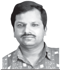
ଡ. ମନୋଜକୂମର ପ୍ରଧାନ