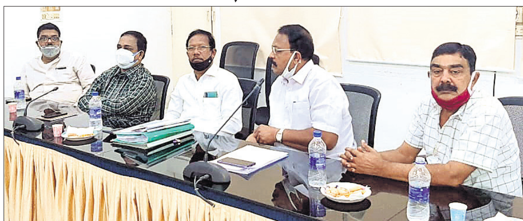
ବୈଠକରେ ଉପସ୍ଥିତ ଅଧିକାରୀ ଓ ଅନ୍ୟମାନେ ।