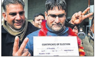
ମୁଖ୍ୟ ଆଞ୍ଚଳିକ ଦଳଗୁଡ଼ିକର ମେଣ୍ଟ ସଭେ ଭାଜପା ପ୍ରାର୍ଥୀ ସିଦ୍ଧାନ୍ତ କୁମ୍ଭର ଶ୍ରୀନଗରରେ ଖୋଲିମୋହ-୨ ଡିଡିସି ଆସନରେ ବିଜୟ ହୋଇଛି। ସେହିପରି ବହିରୋପା ଜିଲାର ତୁଲାଇଲ୍ ଆସନରୁ ଏବଂ ପ୍ରାର୍ଥୀ ସିଦ୍ଧାନ୍ତ ଆସନରେ ଆଗୁଆ ଅଛି। ୨୮୦