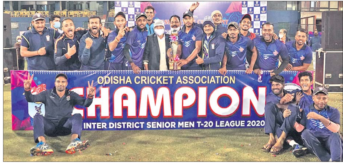
ଓସିଏ ଆନ୍ତଃଜିଲ୍ଲା ସିନିୟର ଟି୨୦ର ଚାମ୍ପିୟନ କଟକ 'ଏ' ଦଳ ଗ୍ରୁପି ସହ ।

ଚହଲ-ଧନଶ୍ରୀ ବାହାହେଲେ ନୂଆଦିଲ୍ଲୀ, ୨୨ ଡିସେମ୍ବର: ଭାରତୀୟ କ୍ରିକେଟର ତଥା ରିଷ୍ଟି ସିନିୟର ଯୁଗବେନ୍ଦ୍ର ଚହଲ ଓ ତାଙ୍କ ବାନ୍ଧବୀ ଧନଶ୍ରୀ ବର୍ମା ବିବାହ କରିଛନ୍ତି । ସୋସିଆଲ ମିଡିଆରେ ଚହଲ ମଙ୍ଗଳବାର ତାଙ୍କ ବିବାହ ଫଟୋ ଶେୟାର କରିଛନ୍ତି । ସେମାନଙ୍କର ଅଗଷ୍ଟ ୮ରେ ନିର୍ବାହ ହୋଇଥିଲା । ଧନଶ୍ରୀ ଜଣେ କୋରିଓଗ୍ରାଫର ଓ ସୋସିଆଲ ମିଡିଆରେ ବେଶ୍ ଚର୍ଚ୍ଚିତ ରହିଆସିଛନ୍ତି । ଏବେ ସବୁ ମହଲରୁ ଚହଲଙ୍କ ନିକଟକୁ ଅଭିନୟନର ସୁଅ ଛୁଟିଛି । ଆଇପିଏଲ୍ ଖେଳିବା ଅବସରରେ ଉଭୟ ଯୁଗଲରେ କିଛି ସମୟ ଏକାଠି ବିତାଇଥିଲେ ।