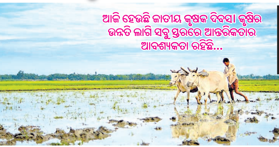
ଆଜି ହେଉଛି ଜାତୀୟ କୃଷକ ଦିବସ । କୃଷିର ଉନ୍ନତି ଲାଗି ସବୁ ସ୍ତରରେ ଆନ୍ତରିକତାର ଆବଶ୍ୟକତା ରହିଛି...

ସାମ୍ପ୍ରତିକ କାଳରେ ରାସାୟନିକ ପଦାର୍ଥର ଭୟାନକ ପରିମାଣକୁ ପୂର୍ଣ୍ଣ ଓ ନିରାକରଣ ନିମନ୍ତେ ଉନ୍ନତ କୃଷି କାର୍ଯ୍ୟକ୍ରମ ଲାଗି ଓ ମିତବ୍ୟୟୀ ଜୀବନାଶକ ତଥା ଜୈବିକ କୌଶଳ ଅବଲମ୍ବନ ମାଧ୍ୟମରେ ମାନବ ସମାଜ ଏବଂ ପରିବେଶକୁ ସୁସ୍ଥ ରଖାଯାଇପାରିବା ଦିଗରେ କାର୍ଯ୍ୟକ୍ରମ ସବୁ ସ୍ତରରେ କରାଯାଉଛି । ବେଶ୍ ତଥା ରାଜ୍ୟରେ ପରିବର୍ତ୍ତିତ ଜଳବାୟୁ ସହିତ ଭୂତଳ ଜଳସ୍ତରର ହ୍ରାସ ଆମକୁ ଚିନ୍ତାରେ ପକାଇଛି ଏବଂ ତାହାର ନିରାକରଣ ନିମନ୍ତେ ଚେଷ୍ଟା କରାଯାଉଛି । ଜଳର ସୁବିନିଯୋଗ ଓ ସଂରକ୍ଷଣ ଆଜିର ଆହ୍ୱାନ ହୋଇଛି । ଅନ୍ୟ ରାଜ୍ୟ ଚୁଲନାରେ ଏବଂ