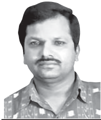
ଡ. ମନୋଜକୂମର ପ୍ରଧାନ