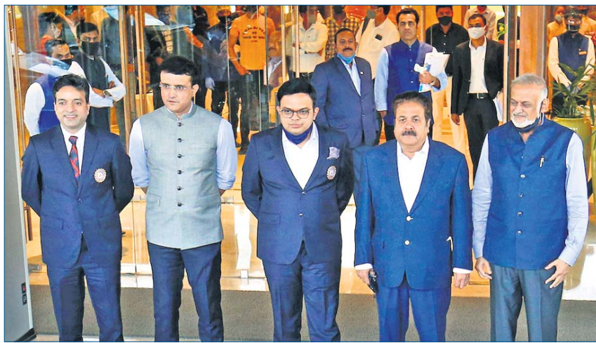
ଗୁରୁବାର ଅହମ୍ମଦବାଦରେ ଅନୁଷ୍ଠିତ ବିସିଆଇର ଟିମ୍ ଟ୍ୟାଲିମାନ୍ ବାସୀରାଣୀ ଟିମ୍ (ଏକିଏମ୍) ଅଧିକାରୀଙ୍କ ସହିତ ଟିମ୍ ଟ୍ୟାଲିମାନ୍ ବାସୀରାଣୀ ଟିମ୍ (ଏକିଏମ୍) ଅଧିକାରୀଙ୍କ ସହିତ

ଗୁରୁବାର ଅହମ୍ମଦବାଦର ମୋଟେରୋ ଷ୍ଟାଡ଼ିୟମରେ ବୈଠକ ହୋଇଥିଲା। ଏଥିରେ ବିସିଆଇ ସଭାପତି ଚୌରୁଜ ଗାଲୁଲି ଅନ୍ତର୍ଜାତୀୟ କ୍ରିକେଟ କାଉନ୍ସିଲ୍ (ଆଇସିସି) ବୋର୍ଡରେ ପୂର୍ବରୁ ନିର୍ଦ୍ଦେଶକ ପଦରେ ରହି କାର୍ଯ୍ୟକରିବେ ଓ ରାଜୀବ ଶୁକ୍ଲାଙ୍କୁ ବିସିଆଇ ଉପସଭାପତି ଭାବେ ନିଯୁକ୍ତ କରିବା ନେଇ ଗୁରୁତ୍ୱପୂର୍ଣ୍ଣ ନିଷ୍ପତ୍ତି ନିଆଯାଇଛି। ଏଥିସହ ୨୦୨୮ ଅଲିମ୍ପିକ୍‌ରେ କ୍ରିକେଟକୁ ସାମିଲ କରିବା ନେଇ ଆଇସିସିର ପ୍ରୟାସକୁ ସମର୍ଥନ କରିବାକୁ ମଧ୍ୟ ନିଷ୍ପତ୍ତି ନିଆଯାଇଛି। ଆସନ୍ତାବର୍ଷ ଆଇପିଏଲ୍‌ରେ ଦଳ ସଂଖ୍ୟା ବୃଦ୍ଧି କରିବା ନେଇ ହେବାକୁ ଥିବା ପ୍ରକ୍ରିୟା ପାଇଁ ହାତରେ ଆବଶ୍ୟକ ସମୟ ନାହିଁ ବୋଲି ବୈଠକରେ ସହସମ୍ପାଦକ ହୁଦୟଜାମ୍ କହିଥିଲେ। କାରଣ ଏଥିପାଇଁ ଦେଶର ଫ୍ଲୋଟି ପ୍ରୋସେସିଂ, ମ୍ୟାଚ ସଂଖ୍ୟା ବୃଦ୍ଧି ଓ ସାମିଲ ହେବାକୁ ଥିବା ସବୁ ବିଦେଶୀ ଖେଳାଳିଙ୍କ ଅନ୍ତର୍ଜାତୀୟ କ୍ୟାଲେଣ୍ଡରରେ ସରକାର ଆଣିବା ନିଷ୍ପତ୍ତି ଭାବେ କଷ୍ଟକର ଥିଲା। ଅଲିମ୍ପିକ୍‌ରେ ଟି୨୦ ୨୦୨୮ ଲଘୁ ଏକ୍ସେଲ୍ ଅଲିମ୍ପିକ୍‌ରେ କ୍ରିକେଟର ଟି୨୦ ଫର୍ମାଟ୍‌କୁ ସାମିଲ କରିବାକୁ ଆଇସିସି ପ୍ରୟାସ