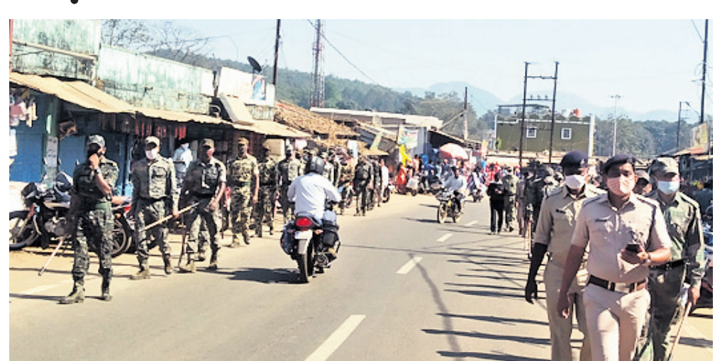
ବଡ଼ଦିନ ପୂର୍ବରୁ ବାଲିଗୁଡ଼ା ସହରରେ ଗୁରୁବାର ପୋଲିସ୍ ପକ୍ଷରୁ ଯୁଗ୍ମପାଳି କରାଯାଇଛି। ଗୁରୁବାର ବଡ଼ଦିନ ପାଇଁ ନିମନ୍ତେ କନ୍ୟାମାନଙ୍କୁ ଜିଲ୍ଲାରେ ବ୍ୟାପକ ସୁରକ୍ଷା ଦିଆଯାଇଛି।

ଜିଲ୍ଲାରେ ୩୧ ପ୍ଲାନୁ ଫୋର୍ସ୍, ୭୦ ଅଧିକାରୀ, ସିଆର୍ପିଏସ୍ ଏବଂ ଏଓଜିମାନଙ୍କୁ ବିଭିନ୍ନ ଥାନା ଅଞ୍ଚଳରେ ନିୟୋଜିତ କରାଯାଇଛି। ସମସ୍ତ ଥାନା ଅଞ୍ଚଳରେ ନାକାବନ୍ଦୀ କରାଯାଇ ଯାଞ୍ଚ ହୋଇଥିବା ଜିଲ୍ଲା ପୋଲିସ୍ ପ୍ରଶାସନ ପକ୍ଷରୁ ସୂଚନା ମିଳିଛି।