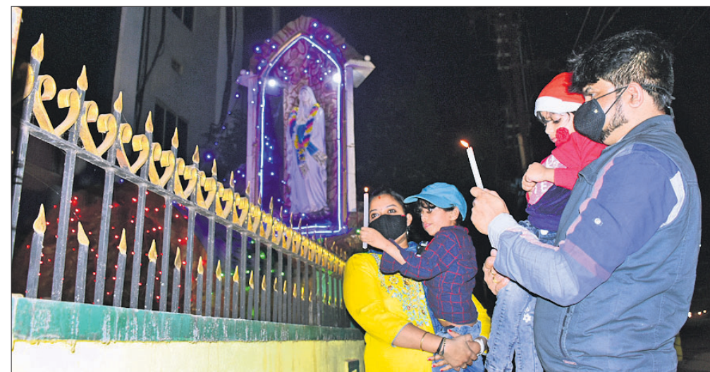
ବଡ଼ଦିନ ଅବସରରେ ପୂର୍ବରୁ କରୋନା ଯୋଗୁ ଗୁରୁବାର ଭୁବନେଶ୍ୱର ସତ୍ୟନଗରସ୍ଥିତ ଚର୍ଚ୍ଚ ବନ୍ଦ ରହିଛି। ଖ୍ରୀଷ୍ଟମାସକାର୍ଯ୍ୟକ୍ରମରେ ଚର୍ଚ୍ଚ ବାହାରେ ମହମଦୀ କାଳି ପ୍ରାର୍ଥନା କରୁଛନ୍ତି।

ମହାନ୍ତି କହିଛନ୍ତି, ତ୍ରିତେନ ଫେରାକାର ଉପରେ ନଜର ରଖାଯାଇଛି। ଷ୍ଟେନ୍ ସମ୍ପର୍କରେ ଅନୁଧ୍ୟାନ ଚାଲିଛି। ପୂର୍ବ କରୋନା ରୋଗୀଙ୍କ ଭଳି ଲକ୍ଷଣ ସମାନ ରହିଛି। ନୂଆ ଷ୍ଟେନରେ ସଂକ୍ରମଣ ଅଧିକ ରହିଛି ବୋଲି ବିଶେଷଜ୍ଞମାନେ କହୁଛନ୍ତି। କିନ୍ତୁ ତ୍ରିତେନର ପୂର୍ବ ତିନି ମାସର ସଂକ୍ରମଣ ହାର ଦେଖିଲେ ସେମାନେ କିଛି ପ୍ରତିକଳ୍ପ ହେଉନା। କିନ୍ତୁ ଆମକୁ ସତର୍କ ରହିବାକୁ ପଡ଼ିବ ବୋଲି ସେ କହିଛନ୍ତି। ସରକାର ମଧ୍ୟ ଏସବୁ ଉପରେ ସତର୍କ ଦୃଷ୍ଟି ରଖୁଛନ୍ତି ଓ ପୁଖ୍ୟମନ୍ତ୍ରୀ ପ୍ରତିଦିନ ସମୀକ୍ଷା କରୁଛନ୍ତି। ତ୍ରିତେନ ଫେରାକାର