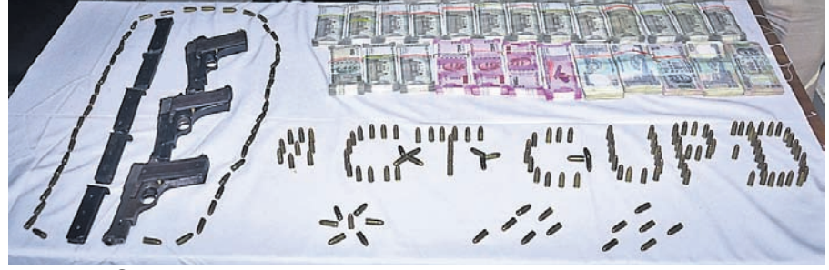
ଜବତ ବସ୍ତୁ, ବୁଲି ଓ ଟଙ୍କା।

ଧନସାମଗ୍ରୀ ଭ୍ରାତାଙ୍କ ଘରୁ ବିପୁଳ ଟଙ୍କା, ଅସ୍ତ୍ର ଜବତ