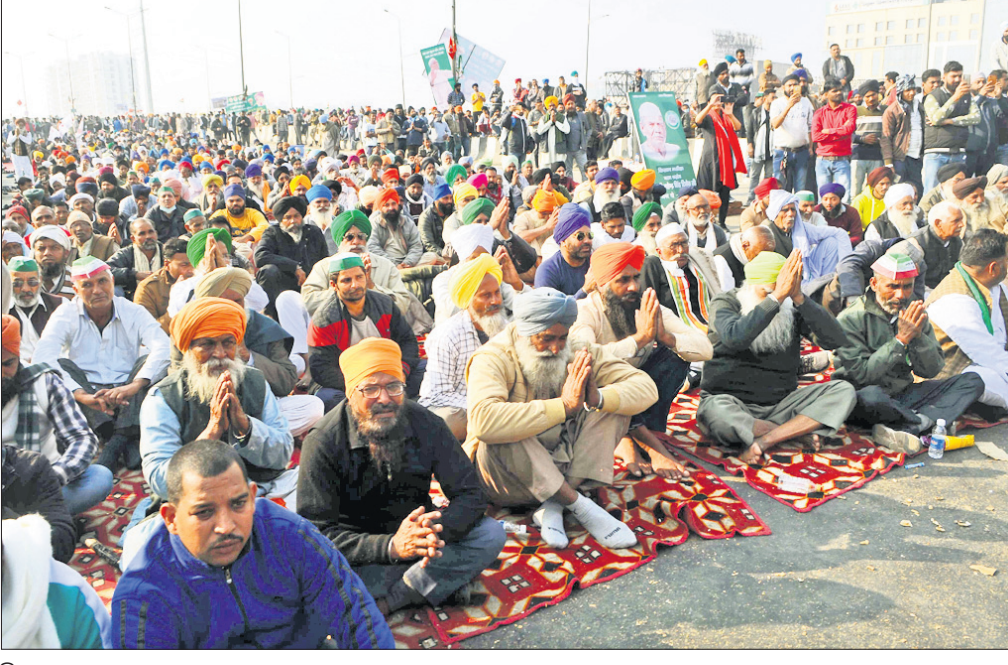
ଦିଲ୍ଲୀ-ଉତ୍ତରପ୍ରଦେଶ ସୀମାରେ ଆନ୍ଦୋଳନରତ ଚାଷୀ।

ଆସତା ଜାନୁୟାରୀ ୪ ଚାରିଖ ସକାଳ ୬ଟା ପର୍ଯ୍ୟନ୍ତ କଣ୍ଠେନମେଣ୍ଟ ଜୋନ୍ ଭାବେ ଘୋଷଣା କରିଛି। ଉକ୍ତ ସାହିକୁ ସାଧାରଣ ଲୋକଙ୍କ ପ୍ରବେଶ ଉପରେ କଟକଣା ଜାରି କରାଯାଇଛି। ମିଳିଥିବା ସୂଚନା ଅନୁଯାୟୀ, ଝାରପଡ଼ା ପଞ୍ଚାୟତରେ ଗୋଟିଏ ପରିବାରର ୩ଜଣ କରୋନା ପଜିଟିଭ୍ ଚିହ୍ନଟ ହୋଇଛନ୍ତି। ସେମାନଙ୍କ ମଧ୍ୟରୁ ଜଣେ