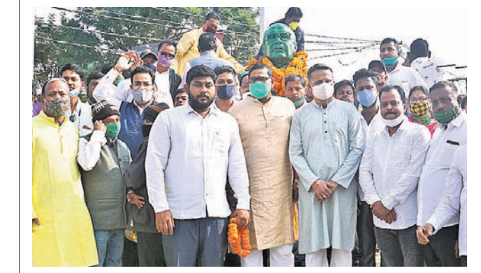
ବିଜେଡିର ପ୍ରତିଷ୍ଠା ଦିବସ ପାଇଁ ଅବସରରେ ଶନିବାର କଟକ ବିଜୁ ପଟ୍ଟନାୟକ ଛକଠାରେ ଥିବା ବିଜୁବାବୁଙ୍କ ପ୍ରତିମୂର୍ତ୍ତିରେ ମାଲ୍ୟାର୍ପଣ କରି ଶ୍ରଦ୍ଧାଞ୍ଜଳି ଅର୍ପଣ କରିଥିବା ବିଜେଡି ନେତୃତ୍ୱ।

ଛାତ୍ର ଉପରେ ଚାଷ କଲେ କମ୍ ପାଣି ଖର୍ଚ୍ଚ ହେବା ସହ ଭଲ ଫସଲ ଆମଦାନୀ ହୁଏ। ଏହାଦ୍ୱାରା ଚାଷ କ୍ଷେତର ଅଭାବ ଦୂର ହେବା ସହ ଛାତ୍ର ଉପରେ ଏକ ସବୁଜ ବନ୍ଦ୍ୟ ସୃଷ୍ଟି କରିଥାଏ।