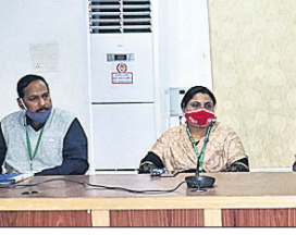
କାର୍ଯ୍ୟକ୍ରମରେ ଜିଲ୍ଲାପାଳ ଭବାନୀ ଶଙ୍କର ଚଉଧୁରୀ ଉଦ୍‌ଘୋଷଣା ଦେଇଛନ୍ତି।

୨୦୧୧ ଜନଗଣନା ବର୍ଷରେ କଟକ ଜିଲ୍ଲାରେ ଉଲ୍ଲେଖନୀୟ କାର୍ଯ୍ୟ ତୁଳାଇଥିବା ପ୍ରାୟ ୬୨ ଜଣ ଅଧିକାରୀଙ୍କୁ ଜିଲ୍ଲା ପ୍ରଶାସନ ଦ୍ୱାରା ସମ୍ବର୍ଦ୍ଧିତ କରାଯାଇଛି। ଜିଲ୍ଲାପାଳଙ୍କ ସମ୍ମିଳନୀ କକ୍ଷରେ ଶନିବାର ଆୟୋଜିତ କାର୍ଯ୍ୟକ୍ରମରେ ଜିଲ୍ଲାପାଳ ଭବାନୀ ଶଙ୍କର ଚଉଧୁରୀ ଅଧ୍ୟକ୍ଷତା କରି କହିଥିଲେ, ଯୋଜନା ଓ ବିକାଶର