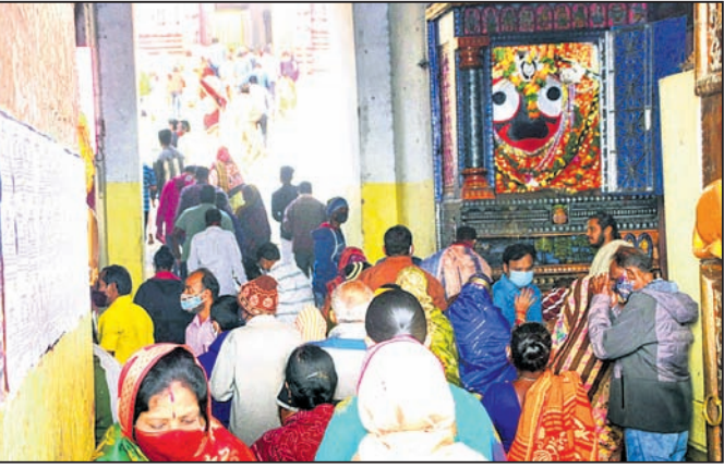
ପୁରୀ ଅପ୍ଟିସ, ୨୭/୧୨

ଶ୍ରୀମନ୍ଦିର ଖୋଲିବାର ୩ଦିନ ପରେ ଶନିବାର ସ୍ଥାନୀୟ ଲୋକେ ଦର୍ଶନ କରିବାର ସୁଯୋଗ ପାଇଛନ୍ତି। ପ୍ରଥମ ଦିନରେ ୩ଟି ପର୍ଯ୍ୟାୟରେ ପୁରୀବାସୀ ଶ୍ରୀଜଗନ୍ନାଥଙ୍କ ଦର୍ଶନ କରିଛନ୍ତି। ସକାଳ ବେଳା ୬ ଓ ୯ ନମ୍ବର, ଅପରାହ୍ନରେ ୧୨ ଓ ୧୫ ନମ୍ବର ଓ ସନ୍ଧ୍ୟାରେ ୧୧, ୨ ଓ ୩ ନମ୍ବର ଖାତର ଲୋକଙ୍କୁ ଏହି ଦର୍ଶନ ସୁବିଧା ମିଳିଥିଲା। ରାତ୍ର ସାଢ଼େ ୯ଟାରେ ପହଡ଼ ଶେଷ ହୋଇଥିଲା। ପ୍ରଥମ ଦିନରେ ୯, ୩୨୭୭୭ ଜଣ ଭକ୍ତ ଦର୍ଶନ କରିଛନ୍ତି। ସକାଳ ୭.୩୦ରେ ପୂର୍ବରୁ ନିର୍ଦ୍ଧାରିତ ଖାତର ଲୋକେ ବହୁ ସଂଖ୍ୟାରେ ଏକାଠି ହୋଇଥିଲେ। ପ୍ରଥମେ ଜଗନ୍ନାଥ ବଲ୍ଲଭଠାରୁ ଆରମ୍ଭ ହୋଇଥିବା