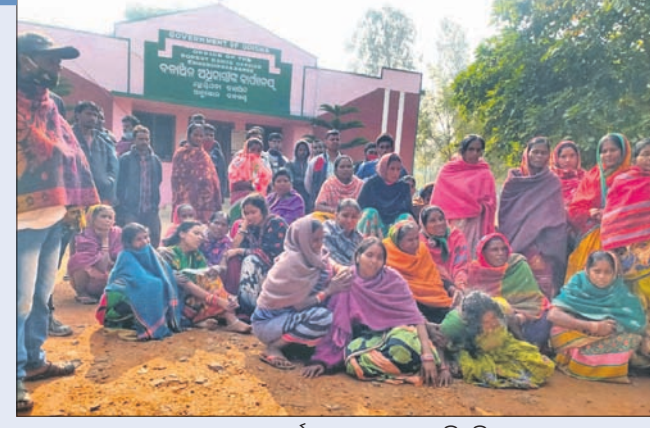
ଗ୍ରାମବାସୀ ବନାଞ୍ଚଳ ଅଧିକାରୀଙ୍କ କାର୍ଯ୍ୟାଳୟ ଘେରାଇ କରାଯାଇଛି।