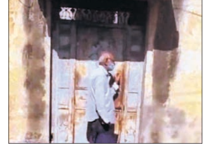
ପାଖରେ କିଛି ଖାଦ୍ୟ ରଖି ଦେଖାଯାଇଛି। ୩ ଜଣଙ୍କ ମାନସିକ ସ୍ୱାସ୍ଥ୍ୟ ସୁଧାରିବା ପାଇଁ ଚିକିତ୍ସା ଜରୁରୀ ବୋଲି ସଙ୍ଗଠନ ପକ୍ଷରୁ କୁହାଯାଇଛି।

ଭାଙ୍ଗିଲା ପରେ ଗାହା ଭିତର ସମ୍ପୂର୍ଣ୍ଣ ଅବସ୍ଥା ଦେଖିବାକୁ ମିଳିଥିଲା। ମା'ଙ୍କ ମୃତ୍ୟୁ ପରେ ସେମାନଙ୍କ ମାନସିକ ସ୍ଥିତି ବିଚଳି ଯାଇଥିଲା।