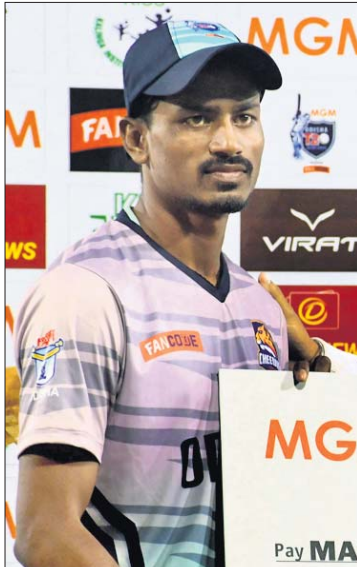
ଓଡ଼ିଶା ଚିତାସ୍ତର ଓ ଜାମୁଆର୍ଯ୍ୟ ମଧ୍ୟରେ ଅନୁଷ୍ଠିତ ମ୍ୟାଚ।

ଓଡ଼ିଶା କ୍ରିକେଟ ଆୟୋଗର (ଓସିଏ) ଆନୁକୂଲ୍ୟରେ ଚାଲିଥିବା ଏମ୍‌ଜିଏମ୍ ଟି୨୦ କ୍ରିକେଟ ଲିଗ୍‌ର ଯୋଗଦାନ ଅନୁଷ୍ଠିତ ପ୍ରଥମ ମ୍ୟାଚରେ ଓଡ଼ିଶା ଚିତାସ୍ତର ୬ ରନରେ ବିଜୟ ହାସଲ କରିଛି। ଜାମୁଆର୍ଯ୍ୟ ୨୦ ଓଭରରେ ୫ ରନରେ ହରାଇ ୧୪୩ ରନ କରିଥିବାବେଳେ ଚିତାସ୍ତର ୧୮.୫ ଓଭରରେ ୪ ରନରେ ହରାଇ ବିଜୟ ଲକ୍ଷ୍ୟ ହାସଲ କରି ନେଇଥିଲା। ପ୍ରତିଯୋଗିତାରେ ଓଡ଼ିଶା ଚିତାସ୍ତର ଏହାକୁ ଦ୍ୱିତୀୟ ବିଜୟ। ଦଳ ଏହାର ପ୍ରଥମ ମ୍ୟାଚରେ ରବିବାର ୬