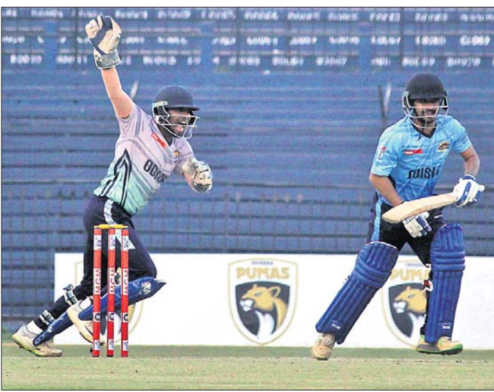
ଓଡ଼ିଶା ଚିତାସ୍ତର ଓ ଜାମୁଆର୍ଯ୍ୟ ମଧ୍ୟରେ ଅନୁଷ୍ଠିତ ମ୍ୟାଚ।