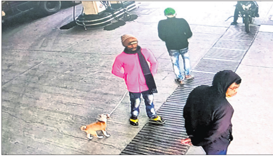
ପେଟ୍ରୋଲ ପମ୍ପରେ ସିଏ ଚିଲିରେ କଏଦ ହୋଇଥିବା ଅଭିଯୁକ୍ତମାନେ ।