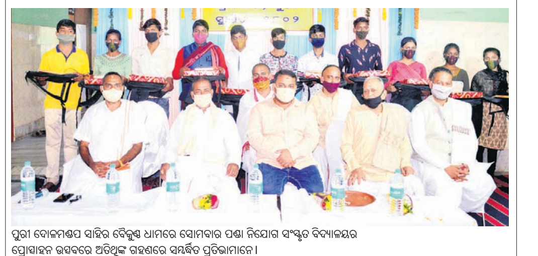
ପୁରୀ ଦୋଳମଣ୍ଡପ ସାହିରୁ ବୈକୁଣ୍ଠ ଧାମରେ ସୋମବାର ପଞ୍ଚା ନିଯୋଗ ସଂସ୍କୃତ ବିଦ୍ୟାଳୟର ପ୍ରେସାହଳ ଉତ୍ସବରେ ଅତିଥିଙ୍କ ଗହଣରେ ସମର୍ପଣ ପ୍ରତିଭାମାନେ।

ପୁରୀ ଅଫିସ୍, ୨୮।୧୨: ଦୋଳମଣ୍ଡପ ସାହିରୁ ବୈକୁଣ୍ଠ ଧାମରେ ସୋମବାର ପଞ୍ଚା ନିଯୋଗ ସଂସ୍କୃତ ବିଦ୍ୟାଳୟର ପ୍ରେସାହଳ ଉତ୍ସବ ଅନୁଷ୍ଠିତ ହୋଇଯାଇଛି।