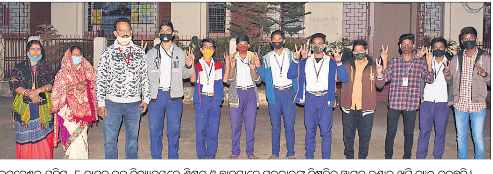
ଭୁବନେଶ୍ୱର ଯୁନିଟ୍-୮ ବାଳକ ଉଚ୍ଚ ବିଦ୍ୟାଳୟରେ ଶିକ୍ଷକ ଓ ଛାତ୍ରମାନେ ସରକାରଙ୍କ ନିଷ୍ପତ୍ତିକୁ ସ୍ୱାଗତ ଜଣାଇ ଖୁସି ବ୍ୟକ୍ତ କରୁଛନ୍ତି।

ଭୁବନେଶ୍ୱର, ୨୮।୧୨(ବ୍ୟୁରୋ) ସରକାରୀ ସ୍କୁଲରେ ପଢ଼ିବେଳେ ଫିଲିପ ସଂରକ୍ଷଣ। ସରକାରୀ ସ୍କୁଲ ବଞ୍ଚିତ ହେଉଥିଲେ।