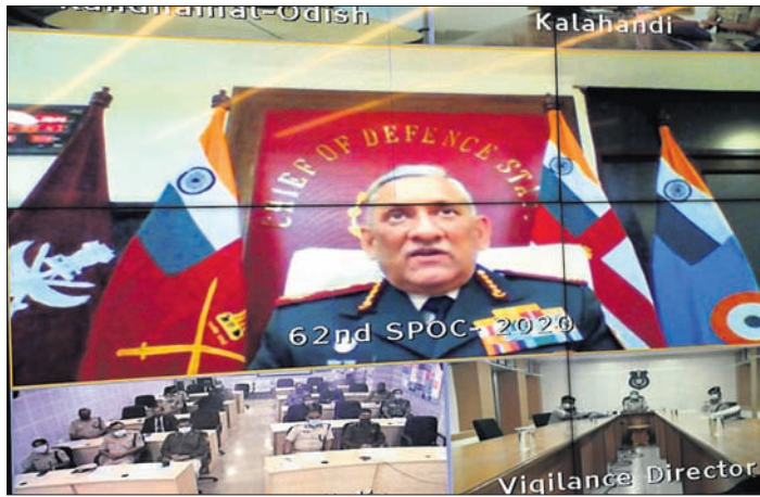
ଭାରତର ପ୍ରତିରକ୍ଷା ମୁଖ୍ୟ ଜେନେରାଲ ବିପିନ ରାଓଙ୍କୁ ଓଡ଼ିଶା ପୋଲିସକୁ ସମୟୋଚ୍ଚ କରୁଛନ୍ତି।

ସୁରକ୍ଷାର ଅଗ୍ରଦୂତ ହେଉଛି ପୋଲିସ। ଯେକୌଣସି ସମ୍ପଦ କାଳରେ ସରକାରଙ୍କ ସହଯୋଗ ଅଧିକ ଦୃଶ୍ୟମାନ ଓ ପ୍ରଥମ ପ୍ରତିକ୍ରିୟା ଦେଖିବା ପ୍ରତିନିଧି ହେଉଛି ପୋଲିସ ବୋଲି ଭାରତର ପ୍ରତିରକ୍ଷା ମୁଖ୍ୟ ଜେନେରାଲ ବିପିନ ରାଓଙ୍କୁ କହିଛନ୍ତି।