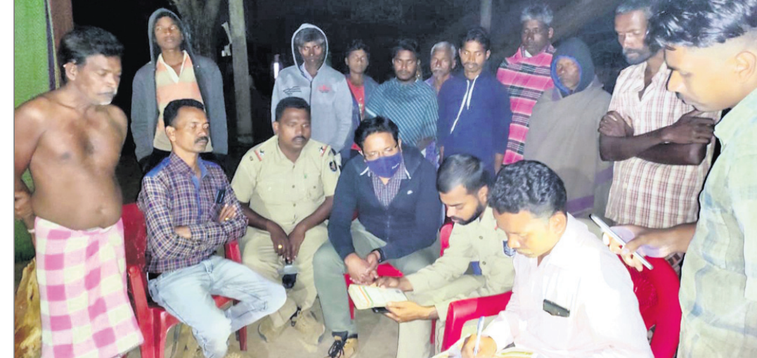
ବନ ବିଭାଗ କର୍ମଚାରୀ ଘଟଣାସ୍ଥଳରେ ଚର୍ଚ୍ଚା କରୁଛନ୍ତି ।

ଦି ଯାଇ ନ ଥିଲେ । ରବିବାର ରାତି ପ୍ରାୟ ୨ଟାରେ ହାତୀପଲ ସେଠାରୁ ଜଙ୍ଗଲ ଆଡ଼କୁ ଯିବା ପରେ ଶୁକ୍ରିୟାଙ୍କ ମୃତଦେହ ବନ କର୍ମଚାରୀମାନେ ଜବତ କରି ପୋଲିସ୍ ସହାୟତାରେ ସୋମବାର ବ୍ୟବଚ୍ଛେଦ ପାଇଁ ଭଞ୍ଜନଗର ସହରୀୟାଲୁ ପଠାଇଥିଲେ । ସେହିପରି ବ୍ରହ୍ମପୁର ବଡ଼ ମେଡିକାଲରେ ନାବାଳକ ଗଣ୍ଡେଙ୍କ ଗୌଡ଼ଙ୍କ ମୃତଦେହ ବ୍ୟବଚ୍ଛେଦ କରାଯାଇଛି । ହାତୀ ଆକ୍ରମଣରେ କାହାରି ମୃତ୍ୟୁ ଘଟିଲେ ସରକାରଙ୍କ ପକ୍ଷରୁ ମୃତକଙ୍କ ପରିବାରକୁ ୪ ଲକ୍ଷ ଟଙ୍କା ସହାୟତା ପ୍ରଦାନ କରାଯାଉଛି । ୨୪ ଘଣ୍ଟା ମଧ୍ୟରେ ଏହାର ୧୦ ପ୍ରତିଶତ ଅର୍ଥାତ୍ ୪୦ ହଜାର ଟଙ୍କା ଦିଆଯାଉଛି । ଏହି କ୍ରମରେ ସୋମବାର ବନ ବିଭାଗ ପକ୍ଷରୁ ମୃତ ଶୁକ୍ରିୟା ଓ ଗଣ୍ଡେଙ୍କ ପରିବାରକୁ ୪୦ ହଜାର ଟଙ୍କା ଲେଖାଏଁ ପ୍ରଦାନ କରାଯାଇଛି । ସେପଟେ ଡିଏଫ୍ ଅଭୟ କୁମାର ଦଳେଇ, ଏସିଏଫ୍ ସୁନ୍ଦରୀ ବାଦୀ, ରେଞ୍ଜିର ଉପାକାନ୍ତ ଦାସ ୨ଦିନ ହେବ ନ୍ୟୁଆପଲ୍ଲୀରେ ଡେରା