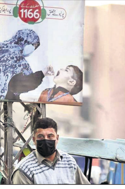
କ୍ରହାଯାଉଥିବା ବେଳେ ବିଭିନ୍ନ ଦେଶରେ ଟିକାଦାନ ଆରମ୍ଭ ହୋଇଛି। ତେବେ ଗରିବ ରାଷ୍ଟ୍ରରେ ମୁଖ ଓ ଅସ୍ଥିରତା ଟିକାକରଣ କ୍ଷେତ୍ରରେ ବଡ଼ ବ୍ୟାକାଉ ହୋଇପାରେ।

ଆତଙ୍କବାଦୀ ଏବଂ ମୌଳବାଦୀ ସଙ୍ଗଠନ ଲାଗି କରୋନା ଟିକାକରଣ ପ୍ରଭାବିତ ହୋଇପାରେ। ବିଶେଷକରି ମୁସଲିମ୍ ବହୁଳ ଦେଶରେ ଏହି ଆଶଙ୍କା ଦେଖିବା ମାରାତ୍ମକ ପୋଲିଓ ପ୍ରତିରୋଧକ ଦିଆଯିବା ସମୟରେ ପାକିସ୍ତାନରେ ସଂଘଟିତ ବର୍ତ୍ତମାନକୁ ବିଶ୍ୱ ଦେଖିଯାଉଛି।