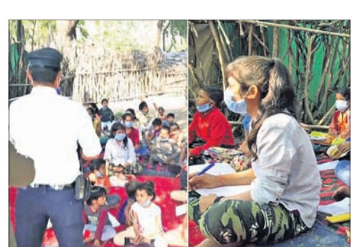
ଆଦି ବିଭିନ୍ନ ଜିନିଷ ଯୋଗାଇ ଦେଇଥାନ୍ତି। ନିଜ ଜୀବନରେ ଅନେକ ଅଧିକାର ସମ୍ପୂର୍ଣ୍ଣ ହୋଇ ପାଠ ପଢ଼ିଥିବା ଏବେ ଗରିବ ପିଲାଙ୍କୁ ସାହାଯ୍ୟ କରିବା ପାଇଁ ଆଗେଇ ଆସିଛନ୍ତି।

ଭୋପାଳ: ବୃତ୍ତିରେ ଜଣେ ପୋଲିସ୍ ଜନଶ୍ଵେଦକ କିନ୍ତୁ ଶିକ୍ଷକଭାବେ ତାଙ୍କର ରହିଛି ସ୍ଵତନ୍ତ୍ର ପରିଚୟ। ବିଭିନ୍ନ ବସ୍ତୁ ଅଞ୍ଚଳରେ ବୁଲି ବୁଲି ସେ ଗରିବ ପିଲାଙ୍କୁ ମାଗଣାରେ ପାଠ ପଢ଼ାଇ ଏଭଳି ଏକ ପରିଚୟ ହାସଲ କରିପାରିଛନ୍ତି।