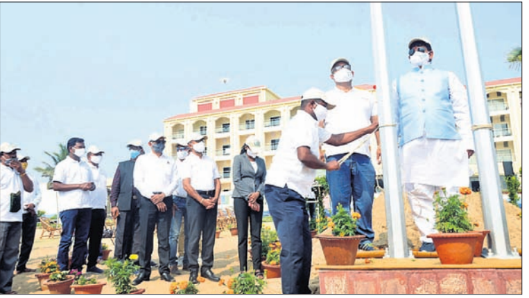
ବେଳାଭୂମିରେ ବୁ ଫ୍ଲାଇ ଉତ୍ତୋଳନ କରାଯାଇଛି।