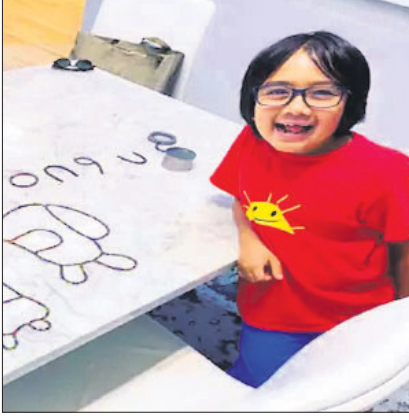
୨୦୧୯ରେ ସେ ତାଙ୍କ ଚଳାଚଳଚ୍ଚିତ୍ର ୧୯୯ କୋଟି ଏବଂ ୨୦୧୮ରେ ୧୬୯ କୋଟିରୁ ଉର୍ଦ୍ଧ ଟଙ୍କା କମାଇଥିଲେ।