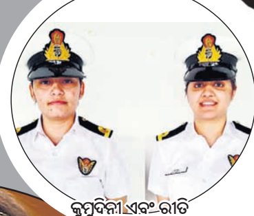
କୁମ୍ଭାଦିନୀ ଏବଂ ରାତି