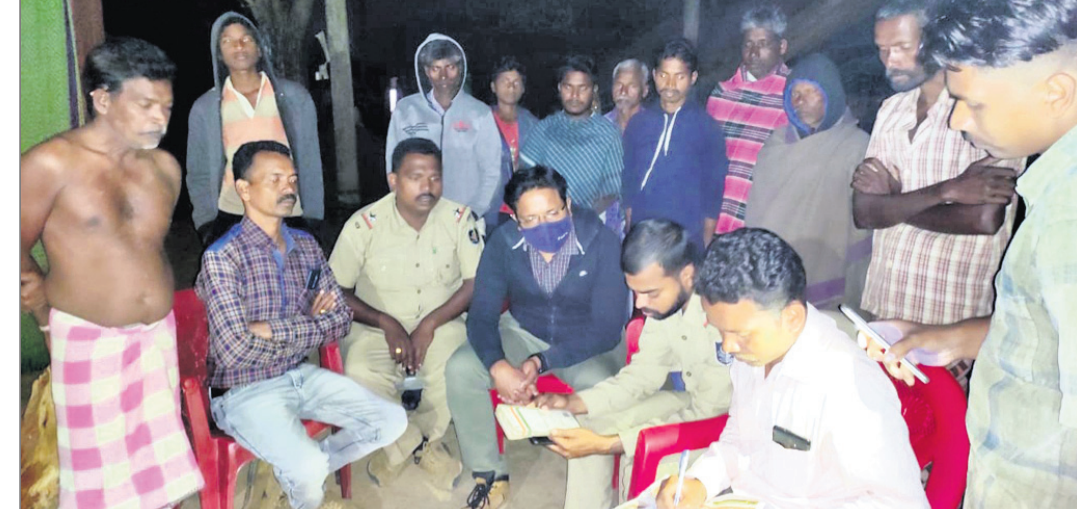
ବନ ବିଭାଗ କର୍ମଚାରୀ ଘଟଣାସ୍ଥଳରେ ଚର୍ଚ୍ଚା କରୁଛନ୍ତି ।

ଦି ଯାଇ ନ ଥିଲେ । ରବିବାର ରାତି ପ୍ରାୟ ୨ଟାରେ ହାତୀପଲ ସେଠାରୁ ଜଳାଇ ଆଡ଼କୁ ଯିବା ପରେ ଶୁକ୍ରିୟାଙ୍କ ମୃତଦେହକୁ ବନ କର୍ମଚାରୀମାନେ ଜବତ କରି ପୋଲିସ୍ ସହାୟତାରେ ସୋମବାର ବ୍ୟବଚ୍ଛେଦ ପାଇଁ ଭଞ୍ଜନଗର ହସ୍ପିଟାଲକୁ ପଠାଇଥିଲେ । ସେହିପରି ବ୍ରହ୍ମପୁର ବଡ଼ ମେଡିକାଲରେ ନାବାଳକ ଗଣେଶ ଚୌଡ଼ଙ୍କ ମୃତଦେହ ବ୍ୟବଚ୍ଛେଦ କରାଯାଇଛି । ହାତୀ ଆକ୍ରମଣରେ କାହାରି ମୃତ୍ୟୁ ଘଟିଲେ ସରକାରଙ୍କ ପକ୍ଷରୁ ମୃତକଙ୍କ ପରିବାରକୁ ୪ ଲକ୍ଷ ଟଙ୍କା ସହାୟତା ପ୍ରଦାନ କରାଯାଉଛି । ୨୪ ଘଣ୍ଟା ମଧ୍ୟରେ ଏହାର ୧୦ ପ୍ରତିଶତ ଅର୍ଥାତ୍ ୪୦ ହଜାର ଟଙ୍କା ଦିଆଯାଉଛି । ଏହି କ୍ରମରେ ସୋମବାର ବନ ବିଭାଗ ପକ୍ଷରୁ ମୃତ ଶୁକ୍ରିୟା ଓ ଗଣେଶଙ୍କ ପରିବାରକୁ ୪୦ ହଜାର ଟଙ୍କା ଲେଖାଏଁ ପ୍ରଦାନ କରାଯାଇଛି । ସେପଟେ ଡିଏମ୍ପିଓ ଅଭୟ କୁମାର ଦଳେଇ, ଏସିଏସ୍ ସୁନଶ୍ରୀ ବାଦୀ, ରେଞ୍ଜିର ଉପାଧ୍ୟକ୍ଷ ଦାସ ୨ଦିନ ହେବ ନୂଆପଲ୍ଲୀରେ ଡେରା