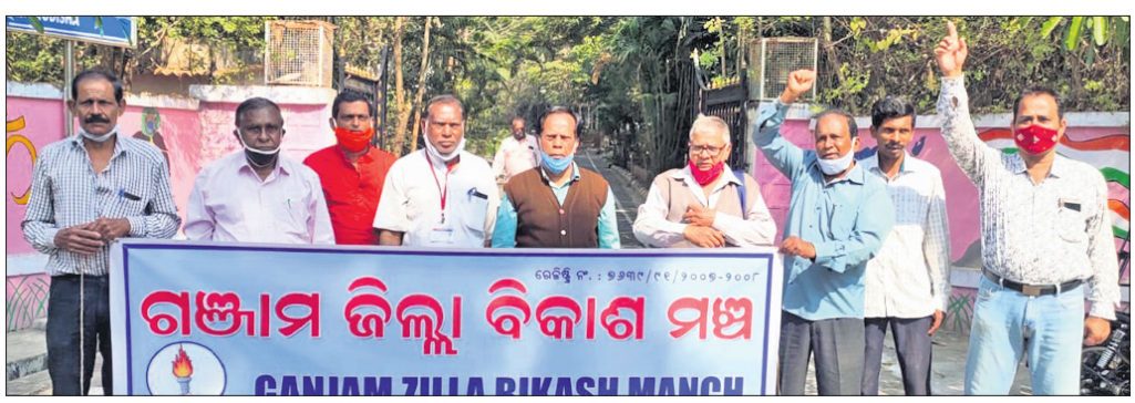
ଆର୍ଡିସିଙ୍କୁ କାର୍ଯ୍ୟକ୍ରମ ସମ୍ମୁଖରେ ବିକ୍ଷୋଭ।