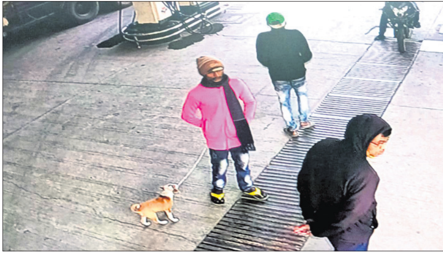
ପେଟ୍ରୋଲ ପମ୍ପରେ ସିଏ ଚିରିରେ କଏଦ ହୋଇଥିବା ଅଭିଯୁକ୍ତମାନେ ।