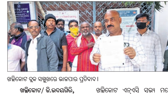
ଖଲିକୋଟ ବ୍ଲକ୍ ସମ୍ମୁଖରେ ଭାଜପା ପ୍ରତିବାଦ।

ଖଲିକୋଟ/ଜି.ଉଦୟଗିରି, ୨୮୧୨ (ଡି.ଏନ.ଏ.): କେନ୍ଦ୍ରୀୟ ଯୋଜନା ରାଜ୍ୟ ସରକାରଙ୍କ ନିର୍ଦ୍ଦେଶ ନାହିଁ ହୋଇଥିବାରୁ ସରକାରଙ୍କୁ ବିକ୍ଷୋଭ ଦେଖାଇବା ପାଇଁ ଶୋଭାଯାତ୍ରା କରିଥିଲେ।