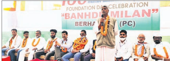
ବ୍ରହ୍ମପୁରର ନାଲିପୁର ସମର୍ଥକ ବିଠକ।