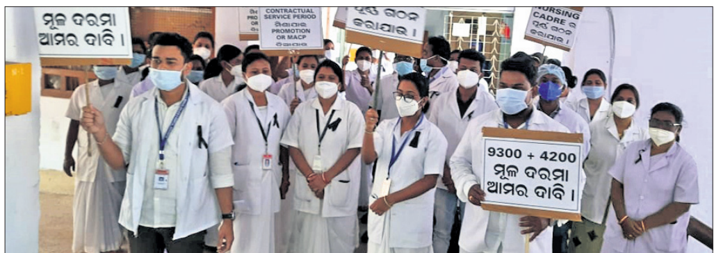
ନର୍ସିଂ ଅଫିସରଙ୍କ ବିକ୍ଷୋଭ।

ବୁଢ଼ୁଡ଼ା, ୨୮୧୨ (ଡି.ଏନ.ଏ.): ବୁଢ଼ୁଡ଼ା ବ୍ଲକ୍ ରାମଶ୍ରୀ ଗ୍ରାମର ୨ ଜଣ ଚାଷୀଙ୍କ ଯୋମାବାର ଅପରାଧରେ ଦିଲରେ ଥିବା ୧୦ଭଗଣ ଧାନ ଗଦା ଜଳିଯାଇଛି।