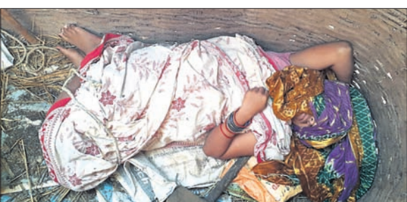
ଧାନଡୋଲିରେ ଅଚେତ ଅବସ୍ଥାରେ ପଡ଼ିଥିବା ଝିଲି ପ୍ରଧାନ।

ଗଞ୍ଜାମ ଜିଲ୍ଲା ବୁରୁଡ଼ା ଥାନା ଅନ୍ତର୍ଗତ ମଙ୍ଗରାଜପୁର ଡାକ୍ତରଖାନା ଗାଁରେ ଏକ ଅଭାବନୀୟ ଘଟଣା ଘଟିଛି। ଏକ ଧାନଡୋଲିକୁ ହାତଗୋଡ଼ ବନ୍ଧା ଅଚେତ ଅବସ୍ଥାରେ ପଡ଼ିଥିବା ଜଣେ ନବବଧୂକୁ ସୋମବାର ପୂର୍ବାହ୍ନରେ ଉଦ୍ଧାର କରାଯାଇଛି।