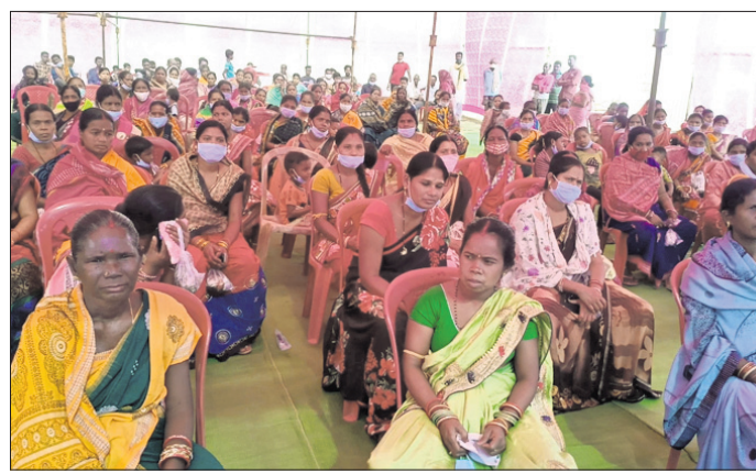
ଗ୍ରାମ ସଭାରେ ଉପସ୍ଥିତ ମହିଳା ବୃନ୍ଦ।

କଳାହାଣ୍ଡି ଜିଲ୍ଲା କେସିକା ବ୍ଲକ୍ କଡ଼େଶ୍ୱର ଗ୍ରାମପଞ୍ଚାୟତ ଚହସିର ଗ୍ରାମ କଲ୍ୟାଣ ମଞ୍ଚରେ ଏକ ଅଗ୍ରଣୀ ବ୍ୟକ୍ତିତ୍ୱରାଜ୍ୟରେ କାର୍ଯ୍ୟ କରିଥିଲେ।