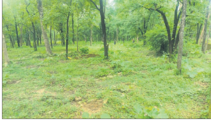
ଜରାଙ୍ଗ ଅଞ୍ଚଳରେ ଚିହ୍ନଟ ହୋଇଥିବା ଜମି।

ସମ୍ବଲପୁର ଜିଲ୍ଲା ସ୍ୱୟମ୍ପୁରା ବ୍ଲକ୍ରେ ଦେବଝରଣା ପର୍ଯ୍ୟଟନ ସ୍ଥଳ ଏକ ବୃତ୍ତ ପରିଚୟ ସୃଷ୍ଟି କରିଛି। ପର୍ଯ୍ୟଟକଙ୍କୁ ଆକୃଷ୍ଟ କରିବା ପାଇଁ ପ୍ରାଣୀ ଉଦ୍ୟାନ ଦେବଝରଣା ଜଳପ୍ରପାତ ନିକଟରେ ଜରାଙ୍ଗ ଅଞ୍ଚଳରେ ମୁକ୍ତ ପ୍ରାଣୀ ଉଦ୍ୟାନ କରିବାକୁ ଯୋଜନା କରିଛି।