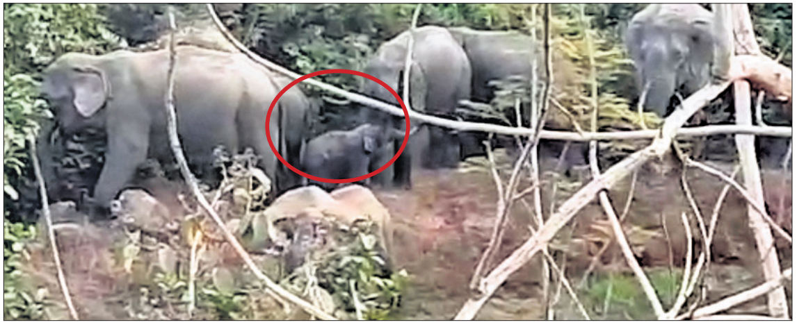
ଜନ୍ମ ହୋଇଥିବା ହାତୀ ଶାବକ।