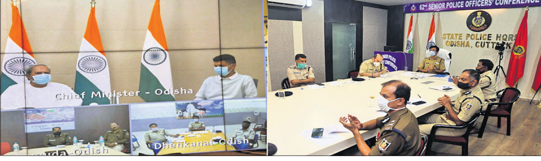
୨୨ତମ ବରିଷ୍ଠ ପୋଲିସ ଅଧିକାରୀ ସମ୍ମିଳନୀର ଉଦ୍‌ଘାଟନା କ୍ଷେତ୍ରରେ ପୁଞ୍ଜ୍ୟମନ୍ତ୍ରୀ ନବୀନ ପଟ୍ଟନାୟକ ଉଦ୍‌ଘାଟନା କର୍ତ୍ତବ୍ୟରେ ଉଦ୍‌ଘାଟନା କରୁଥିବା ଦେଖିବାକୁ ମିଳୁଛି। ପାଖରେ ଅଛି ୫-ଟି ସଭ୍ୟ ଓ କର୍ମଚାରୀ।

ମହିଳା ଓ ଶିଶୁଙ୍କ ସେକ୍ଟରରେ ଘଟୁଥିବା ଅପରାଧ ରୋକିବା ଦିଗରେ ଆହୁରି ପଦକ୍ଷେପ ନିଆଯିବ। ଏଥିପାଇଁ ଓଡ଼ିଶା ପୋଲିସର ଏକ ସ୍ୱତନ୍ତ୍ର ଶାଖା ଗଠନ କରାଯିବ ବୋଲି ପୁଞ୍ଜ୍ୟମନ୍ତ୍ରୀ ନବୀନ ପଟ୍ଟନାୟକ କହିଛନ୍ତି।