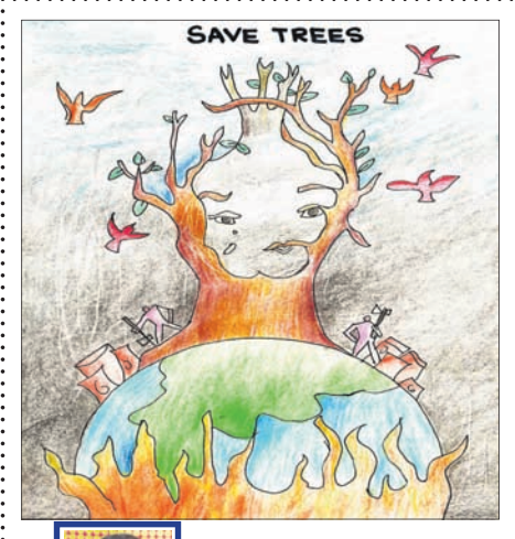
ଗାର୍ଗୀ ଦାଶ କ୍ଲାସ-୫, ଲୟୋଲା ସ୍କୁଲ, ଭୁବନେଶ୍ୱର

-ରାମଚନ୍ଦ୍ର ପ୍ରଧାନ ଶିକ୍ଷକ, ସାତରାପଲୀ, ଗଞ୍ଜାମ