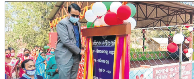
ଶିଶୁ ପ୍ରମୋଦ କେନ୍ଦ୍ରର ଉଦ୍‌ଘାଟନ କରୁଥିବା ଅତିଥି ।

ଅନ୍ୟପକ୍ଷରେ ଜଗତସିଂହପୁର ଜିଲ୍ଲାରେ କଳାକାରମାନଙ୍କୁ ସମାପନ କରିବା ପାଇଁ ଚିତ୍ରିକା ଦିନ ଆରମ୍ଭ ହେବ । କର୍ମଶାଳାରେ ଉପସ୍ଥିତ ଅତିଥି । କର୍ମଶାଳାରେ ଉପସ୍ଥିତ ଅତିଥି । କର୍ମଶାଳାରେ ଉପସ୍ଥିତ ଅତିଥି ।