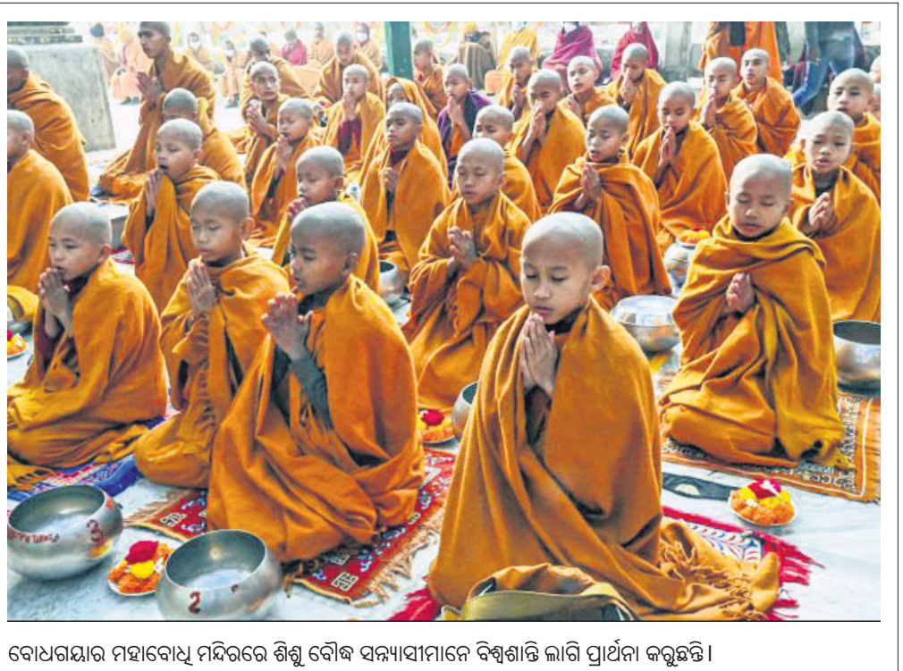
ବୋଧଧରମାର ମହାବେଧୁ ମନ୍ଦିରରେ ଶିଶୁ ବୌଦ୍ଧ ସମାଧାନରେ ବିଶ୍ୱଶାନ୍ତି ଲାଗି ପ୍ରାର୍ଥନା କରୁଛନ୍ତି।

ହେବାର ସୁରୁତ୍ୱପୂର୍ଣ୍ଣ ପର୍ଯ୍ୟାୟରେ ଥିଲାବେଳେ ନୂଆ ବ୍ୟବସ୍ଥାକୁ ଗ୍ରହଣ କରିପାରିବ।