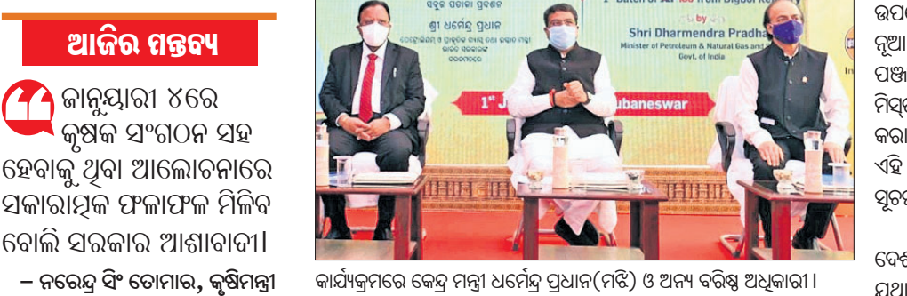
କାର୍ଯ୍ୟକ୍ରମରେ କେନ୍ଦ୍ର ମନ୍ତ୍ରୀ ଧର୍ମେନ୍ଦ୍ର ପ୍ରଧାନ (ମଝି) ଓ ଅନ୍ୟ ବରିଷ୍ଠ ଅଧିକାରୀ ।

ପୁରୁଧା ଉପଲବ୍ଧ ହେବ। ସେହିଭଳି ନୂଆ ଗ୍ୟାସ୍ ସଂଯୋଗ ଲାଗି ମଧ୍ୟ ଏହା କରିଥାରେ ପଞ୍ଜିକରଣ ହୋଇପାରିବ। କେନ୍ଦ୍ର ମନ୍ତ୍ରୀ ଧର୍ମେନ୍ଦ୍ର ପ୍ରଧାନ ଉଦ୍ଦିଷ୍ଟ ଆନ ଏଏଲ୍‌ରେ ଏହି ସର୍ବଭାରତୀୟ ଗ୍ୟାସ୍ ଚିପିଲ ରୁଟ୍ ସେବାକୁ ଶୁକ୍ରବାର ଶୁଭାରମ୍ଭ କରିଛନ୍ତି। କେବଳ ଭୁବନେଶ୍ୱରରେ ଉପଭୋକ୍ତା ଲାଗି ନୂଆ ଗ୍ୟାସ୍ ସଂଯୋଗର ପଞ୍ଜୀକରଣ ନିମନ୍ତେ ମିସ୍ତ କଲ୍ ଚଳାଇ ଦିଆଯାଇଥିବା ପ୍ରଧାନ ଏହି ଅବସରରେ ସୂଚନା ଦେଇଛନ୍ତି। ଭୁବନେଶ୍ୱର ସମେତ ଦେଶର ୭ ବଡ଼ ସହର ଯଥା- ଏପୁଷ୍ପା-୪