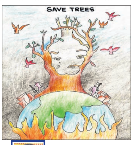
ଗାର୍ଗୀ ଦାଶ କ୍ଲାସ-୫, ଲୟୋଲା ସ୍କୁଲ, ଭୁବନେଶ୍ୱର

-ରାମଚନ୍ଦ୍ର ପ୍ରଧାନ ଶିକ୍ଷକ, ସାତରାପଲୀ, ଗଞ୍ଜାମ