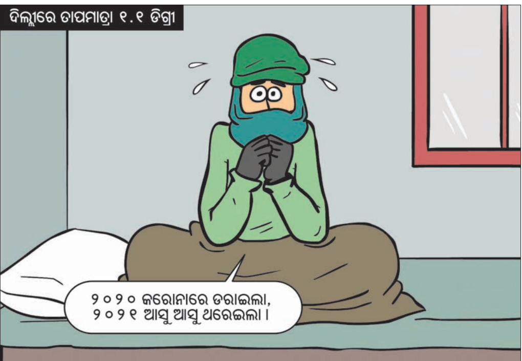
ଦିଲ୍ଲୀରେ ତାପମାତ୍ରା ୧.୧ ଡିଗ୍ରୀ

୨୦୨୦ ଜରୋନାରେ ତରାଇଲା, ୨୦୨୧ ଆସୁ ଆସୁ ଥରେଇଲା ।