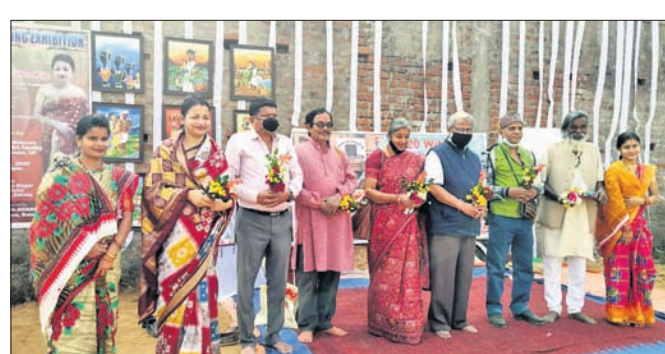
କର୍ମଶାଳା ଉଦ୍‌ଘାଟନ ଅବସରରେ ଉପସ୍ଥିତ ଅତିଥି ।