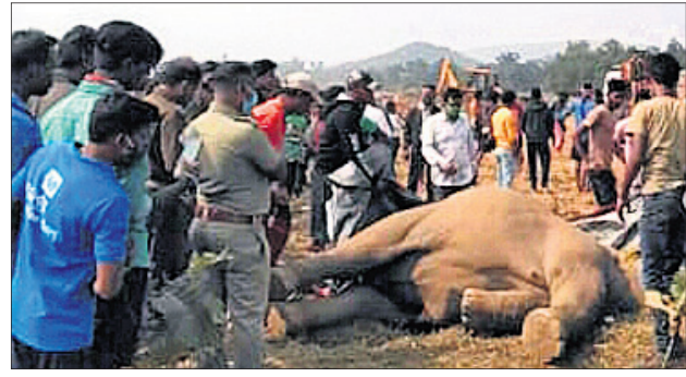
ଇଛାବଡ଼ା ମୌଳା ଯୋବା ଝର ନିକଟରେ ପଡ଼ିଥିବା ମୃତ ହାତୀ ।