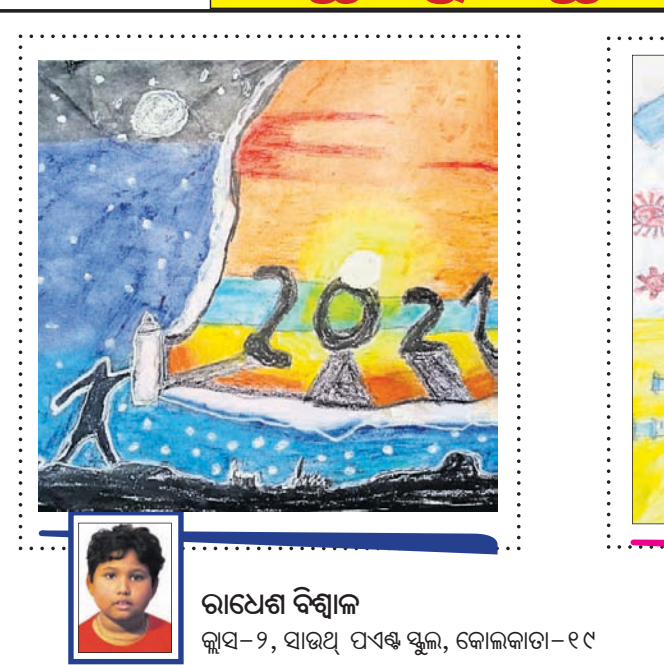
ରାଧେଶ ବିଶ୍ୱାଳ କ୍ୱାସ-୨, ସାଉଥ ପଏଣ୍ଟ ସ୍କୁଲ, କୋଲକାତା-୧୯