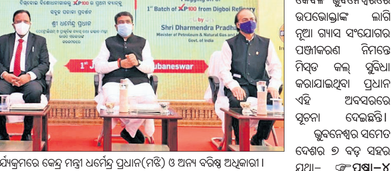
କାର୍ଯ୍ୟକ୍ରମରେ କେନ୍ଦ୍ର ମନ୍ତ୍ରୀ ଧର୍ମେନ୍ଦ୍ର ପ୍ରଧାନ (ମଝି) ଓ ଅନ୍ୟ ବରିଷ୍ଠ ଅଧିକାରୀ ।

ଗୋଟିଏ ମିସ୍ତ କଲ୍ ଦେଲେ ଲୋକଙ୍କ ଘରେ ଗ୍ୟାସ୍ ପହଞ୍ଚିବ । ଇଣ୍ଡିଆନ ଅଏଲ ଉପଭୋକ୍ତା ନିଜ ମୋବାଇଲ ଫୋନ୍‌ରୁ ୮୪୫୪୯୫୫୫୫୫୫ ନମ୍ବରରେ ମିସ୍ତ କଲ୍ କଲେ ଘରେ ଏଭଳି ସୁବିଧା ଉପଲବ୍ଧ ହେବ । ସେହିଭଳି ନୂଆ ଗ୍ୟାସ୍ ସଂଯୋଗ ଲାଗି ମଧ୍ୟ ଏହା କରିଥାରେ ପଞ୍ଜିକରଣ ହୋଇପାରିବ । କେନ୍ଦ୍ର ମନ୍ତ୍ରୀ ଧର୍ମେନ୍ଦ୍ର ପ୍ରଧାନ ଇଣ୍ଡିଆନ ଅଏଲର ଏହି ସର୍ବଭାରତୀୟ ଗ୍ୟାସ୍ ରିପେଲ ରୁକ୍ ସେବାକୁ ଶୁକ୍ରବାର ଶୁଭାରମ୍ଭ କରିଛନ୍ତି । କେବଳ ଭୁବନେଶ୍ୱରରେ ଉପଭୋକ୍ତା ଲାଗି ନୂଆ ଗ୍ୟାସ୍ ସଂଯୋଗର ପଞ୍ଜୀକରଣ ନିମନ୍ତେ ମିସ୍ତ କଲ୍ ସୁବିଧା କରାଯାଇଥିବା ପ୍ରଧାନ ଏହି ଅବସରରେ ସୂଚନା ଦେଇଛନ୍ତି । ଭୁବନେଶ୍ୱର ସମେତ ଦେଶର ୭ ବଡ଼ ସହର ଯଥା- ଏପ୍ରିଲ-୪