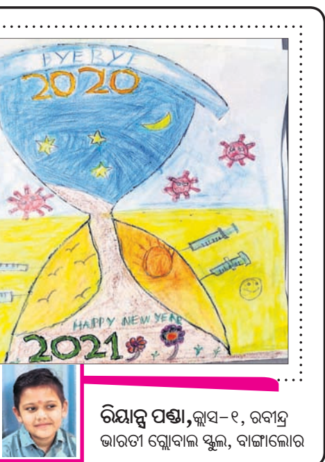
ରିୟାଜ ପଣ୍ଡା, କ୍ୱାସ-୧, ରବୀନ୍ଦ୍ର ଭାରତୀ ଗ୍ଲୋବାଲ ସ୍କୁଲ, ବାଙ୍ଗାଲୋର