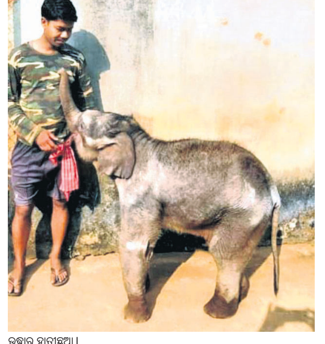
ଉଦ୍ଧାର ହାତୀ ଛୁଆ । ଶାବକ ଦିଆଯାଇଛି। ସେ ଆନନ୍ଦରେ ଧାରେ ଧାରେ ହାତୀ ଶାବକ ମାଛୁଳୁକ ସବୁଦିନ ଖାଇଛି। ଅପରପକ୍ଷେ ସହ ଆତ୍ମାୟତା ବଢ଼ାଇଛି। ମା'ଠୁ

ଗଞ୍ଜାମ ଜିଲ୍ଲା ଚିକିତ୍ସା ବ୍ଲକ ଅନ୍ତର୍ଗତ ବାହୁଡ଼ା ନଦୀ ପାର୍ଶ୍ୱ ରିକ୍ତ ଉଦ୍ଧାର ହୋଇ କପିଳାସ ଏଲିଫାଣ୍ଟ ରେସ୍କ୍ୟୁ ସେଣ୍ଟର ଆସିଥିବା ହାତୀ ଶାବକର ଶୁକ୍ରବାର ନାମକରଣ ହୋଇଛି। ଏହି ମାଲ ହାତୀ ଛୁଆର ନାଁ 'ପଦ୍ମା' ରଖାଯାଇଛି।