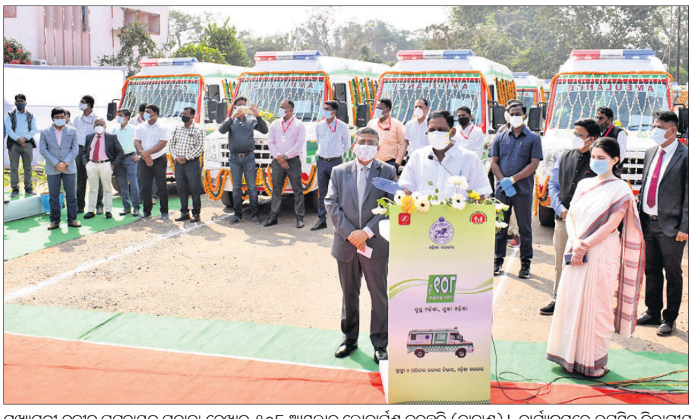
ମୁଖ୍ୟମନ୍ତ୍ରୀ ନବୀନ ପଟ୍ଟନାୟକ ପତାକା ଦେଖାଇ ୧୦୮ ଆୟୁଲ୍ୟାନ୍ସ ଲୋକାର୍ପଣ କରୁଛନ୍ତି (ବାହାଣ)। କାର୍ଯ୍ୟକ୍ରମରେ ଉପସ୍ଥିତ ବିଭାଗୀୟ ମନ୍ତ୍ରୀ ଓ ସଚିବଙ୍କ ସମେତ ବିଭାଗୀୟ କର୍ମଚାରୀମାନେ ।