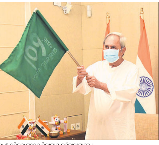
ସମ୍ବଲପୁର, ୧୧୧ (ବ୍ୟୁରୋ) ସମ୍ବଲପୁର ୫୩୩୦. ଜାତୀୟ ରାଜପଥର ଧରୁପାଲି ଥାନା ସଲିଲକା ନିକଟରେ ଶୁକ୍ରବାର ଏକ ମର୍ମହୀନ ସଡ଼କ ଦୁର୍ଘଟଣା ଘଟିଛି।