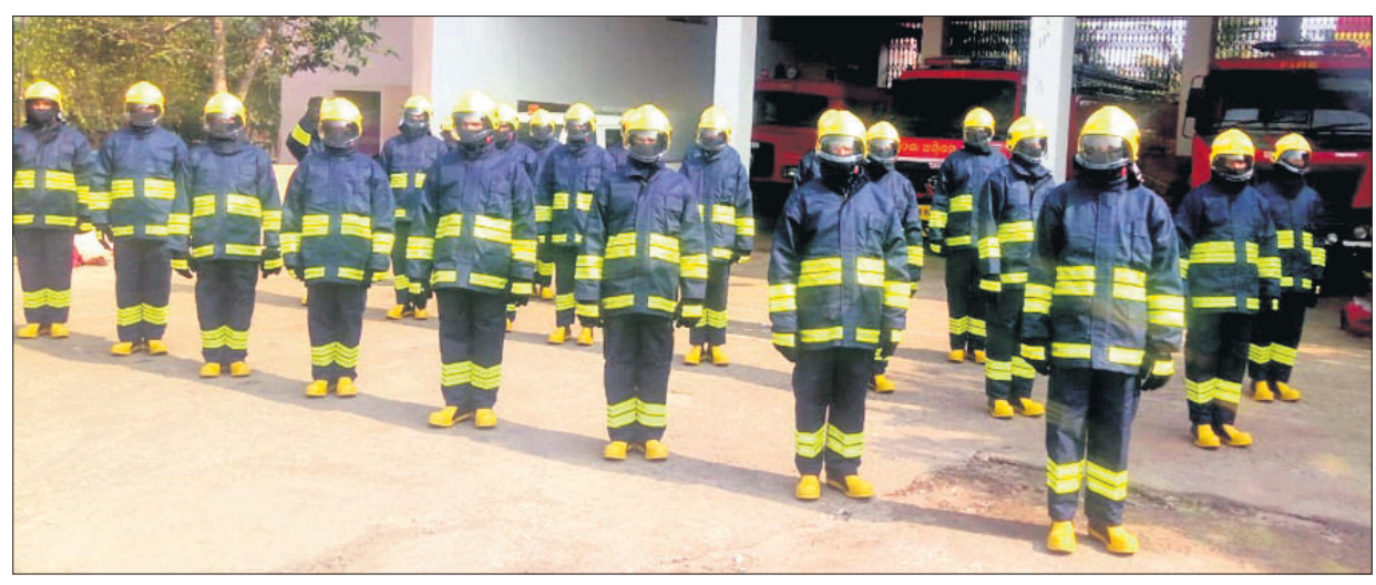
ଭୁବନେଶ୍ୱର, ୨୧ (ବୁଧବେଳା)

ଅଗ୍ନିଶମ ବାହିନୀର ସୁରକ୍ଷାକୁ ଦୃଷ୍ଟିରେ ରଖି ସେମାନଙ୍କ ପାଇଁ ସ୍ୱତନ୍ତ୍ର ଅଗ୍ନି ପ୍ରତିରୋଧକ ପୋଷାକ ପ୍ରସ୍ତୁତ କରାଯାଇଛି। ପୂର୍ବରୁ ଅଗ୍ନିଶମ କର୍ମଚାରୀ ପିନ୍ଧୁଥିବା ପୋଷାକରେ ନିଆଁ ଲାଗିଯାଉଥିଲା। ହେଲେ ଏହି ନୂତନ ପୋଷାକ ୮୦୦ ଡିଗ୍ରୀ ସେଲସିୟସ ପର୍ଯ୍ୟନ୍ତ ନିଆଁକୁ ପ୍ରାୟ ୧୦ରୁ ୨୦ସେକେଣ୍ଡ ଯାଏ ସହ୍ୟ କରିପାରିବ ବୋଲି ଅଗ୍ନିଶମ ବିଭାଗ ପକ୍ଷରୁ ଶୁଭବାଚନ ସୂଚନା ଦିଆଯାଇଛି। ପ୍ରଥମ ପର୍ଯ୍ୟାୟରେ