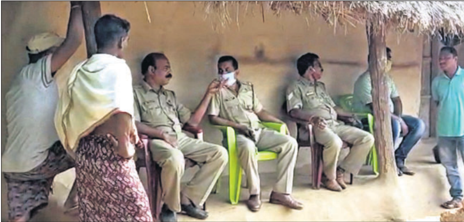
ଘଟଣାସ୍ଥଳରେ ପୋଲିସ ତଦନ୍ତ କରୁଛି।