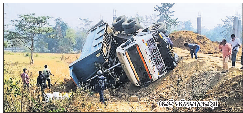
ଓଲଟି ପଡିଥିବା ହାଲଡିଆ