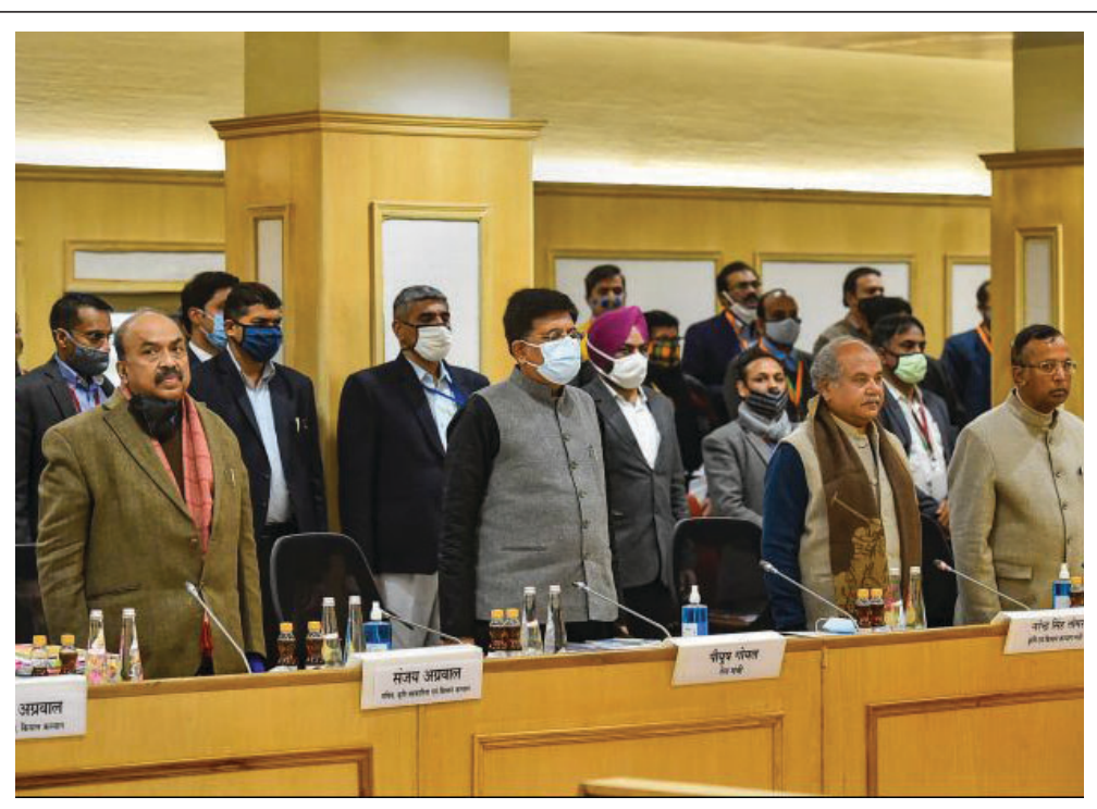
ଦିଲ୍ଲୀର ବିଜ୍ଞାନ ଭବନରେ ସରକାର ଓ କୃଷକଙ୍କ ମଧ୍ୟରେ ସପ୍ତମ ପର୍ଯ୍ୟାୟ ଆଲୋଚନା ପୂର୍ବରୁ ମୁଖ୍ୟମନ୍ତ୍ରୀଙ୍କ ସମ୍ମାନ କରାଯାଇଛି।

ସାମାଜ୍ୟ ମାରି ଫେସ୍ବୁକରେ ପୋଷ୍ଟ କଲେ ସ୍ତ୍ରୀ। ଏହାକୁ ଉତ୍ସାହ ସହ ସମର୍ଥନ ଦେବାକୁ ନିମନ୍ତ୍ରଣ କରାଯାଇଛି।