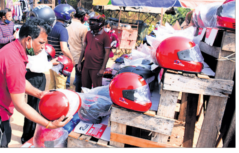
ରାସ୍ତାକଡ଼ରେ ବିକ୍ରି ହେଉଥିବା ହେଲମେଟ୍।