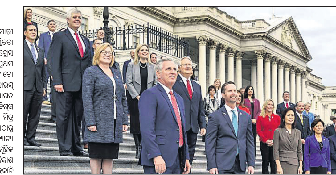
ଓଶ୍ଟିନରେ କ୍ୟାପିଟୋଲରେ ଯୋଗଦାନ କରୁଥିବା ଅମେରିକୀୟ ଉପର ସଂଖ୍ୟା ସଭ୍ୟମାନଙ୍କୁ ସ୍ୱାଗତ କରୁଛି।

ଅମେରିକାରେ କରୋନା ମହାମାରୀ ସମ୍ପର୍କରେ ଗବେଷଣା ପାଇଁ ପାକିସ୍ତାନ ସରକାର ଅମେରିକାକୁ ନିମନ୍ତ୍ରଣ କରିଛନ୍ତି।