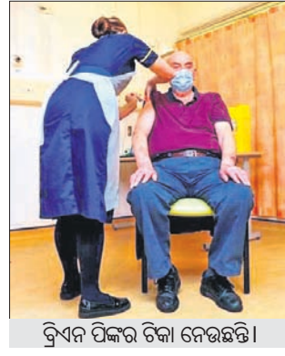
କିଙ୍ଗ୍ ରୋଗୀଙ୍କୁ ପ୍ରଥମ କୋଭିଡ଼ିନ୍ ଡୋଜ୍। ଏହାକୁ ଉତ୍ସାହ ସହ ସମର୍ଥନ ଦେବାକୁ ନିମନ୍ତ୍ରଣ କରାଯାଇଛି।

କିଙ୍ଗ୍ ରୋଗୀଙ୍କୁ ପ୍ରଥମ କୋଭିଡ଼ିନ୍ ଡୋଜ୍ ଦିଆଯାଇଛି। ଏହାକୁ ଉତ୍ସାହ ସହ ସମର୍ଥନ ଦେବାକୁ ନିମନ୍ତ୍ରଣ କରାଯାଇଛି।