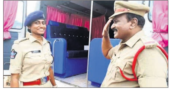
ତିଏସ୍ପି ଡିଏଲ୍ ଇନ୍ସପେକ୍ଟର ବାପାଙ୍କ ସାଲୁ୍ୟର୍। ଏହାକୁ ଉତ୍ସାହ ସହ ସମର୍ଥନ ଦେବାକୁ ନିମନ୍ତ୍ରଣ କରାଯାଇଛି।