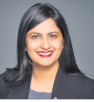
ଏମ୍ପି ପଦ ଗଲାଣି। ଏହାକୁ ଉତ୍ସାହ ସହ ସମର୍ଥନ ଦେବାକୁ ନିମନ୍ତ୍ରଣ କରାଯାଇଛି।

ଶୁଦ୍ଧତା ପାଇଁ ଏମ୍ପି ପଦ ଗଲାଣି। ଏହାକୁ ଉତ୍ସାହ ସହ ସମର୍ଥନ ଦେବାକୁ ନିମନ୍ତ୍ରଣ କରାଯାଇଛି।