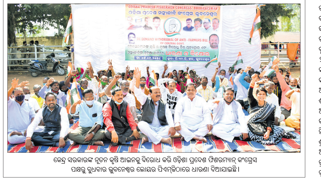
କେନ୍ଦ୍ର ସରକାରଙ୍କ ନୂତନ କୃଷି ଆଇନକୁ ବିରୋଧ କରି ଓଡ଼ିଶା ପ୍ରଦେଶ ପିଣ୍ଡାମାମା କଂଗ୍ରେସ ପକ୍ଷରୁ ବୁଧବାର ଭୁବନେଶ୍ୱର ଲୋକସଭା ପିଏମ୍‌ଠାରେ ଧାରଣା ଦିଆଯାଇଛି।

ସର୍ବସାଧାରଣ ଦର୍ଶନର ଚତୁର୍ଥ ଦିନରେ ବୁଧବାର ମହାପ୍ରଭୁଙ୍କ ବନକଲୀଗି ନୀତି ଅନୁଷ୍ଠିତ ହୋଇଛି। ଶ୍ରୀମନ୍ଦିର ମଧ୍ୟାହ୍ନ ୧୫ ପରେ ଦରମହାପାତ୍ର ସେବକମାନେ ଉତ୍ତରଦେବିରେ ମହାପ୍ରଭୁଙ୍କ ବନକଲୀଗି କରିଥିଲେ। ଶ୍ରୀବିଗ୍ରହଙ୍କ ଅଧର ପୋଛା ପରେ ବନକଲୀଗି ନୀତି ହୋଇଥିଲା। ଏଥିପାଇଁ ଦରମହାପାତ୍ର ସେବକମାନେ ବନକ ପ୍ରସ୍ତୁତ କରିଥିଲେ। ପ୍ରାୟ ୪ଘଣ୍ଟା ଧରି ଏହି ନୀତି କାର୍ଯ୍ୟ ଚାଲିଥିଲା। ଏହା ଏକ ଗୁପ୍ତ ନୀତି ହୋଇଥିବାରୁ ବୁଧବାର ପହୁଡ଼ ଆଳତି ପରେ ଅପରାହ୍ଣ ପ୍ରାୟ ୨ଟା ୩୦ରୁ ୬ଟା ୩୦ ମିନିଟ୍ ପର୍ଯ୍ୟନ୍ତ ୪ଘଣ୍ଟା ସାଧାରଣ ଦର୍ଶନ ବନ୍ଦ ରହିଥିଲା। ଗୁପ୍ତ ନୀତି ସମୟରେ ବାବୁନିଅଁଙ୍କ ଦର୍ଶନ ପାଇଁ ଶ୍ରଦ୍ଧାଳୁଙ୍କୁ ଅନୁମତି ମିଳି ନ ଥିଲା। ମହାପ୍ରଭୁଙ୍କ ଶ୍ରୀପୁଞ୍ଜ ଶୁଙ୍ଗାର ସରିବା ପରେ ପୁଣି ସ୍ୱାଭାବିକ ଦର୍ଶନ ଆରମ୍ଭ ହୋଇଥିଲା। ଉଲ୍ଲେଖଯୋଗ୍ୟ, କସ୍ତୁରୀ, କର୍ପୂର, ହେଲୁକ ଓ ହରିତକୀର ଏକ ମିଶ୍ରଣରେ ବନକ ପ୍ରସ୍ତୁତ କରାଯାଏ। ଏହାକୁ ଶ୍ରୀପୁଞ୍ଜରେ ଲଗାଇବା ପରେ ମହାପ୍ରଭୁ ଆହୁରି ଅଧିକ ଆକର୍ଷଣୀୟ ଲାଗନ୍ତି। ଶ୍ରୀମନ୍ଦିର ପ୍ରଥା ଅନୁଯାୟୀ ପ୍ରତ୍ୟେକ ବୁଧବାର କିନ୍ଧା ବୁଧବାର ଏହି ଗୁପ୍ତ ନୀତି ସମ୍ପନ୍ନ ହୋଇଥାଏ।