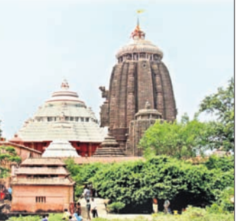
ପୁରୀ ଅଫିସ, ୨୧

ସର୍ବସାଧାରଣ ଦର୍ଶନର ଚତୁର୍ଥ ଦିନରେ ବୁଧବାର ମହାପ୍ରଭୁଙ୍କ ବନକଲୀଗି ନୀତି ଅନୁଷ୍ଠିତ ହୋଇଛି। ଶ୍ରୀମନ୍ଦିର ମଧ୍ୟାହ୍ନ ୧୫ ପରେ ଦରମହାପାତ୍ର ସେବକମାନେ ଉତ୍ତରଦେବିରେ ମହାପ୍ରଭୁଙ୍କ ବନକଲୀଗି କରିଥିଲେ। ଶ୍ରୀବିଗ୍ରହଙ୍କ ଅଧର ପୋଛା ପରେ ବନକଲୀଗି ନୀତି ହୋଇଥିଲା। ଏଥିପାଇଁ ଦରମହାପାତ୍ର ସେବକମାନେ ବନକ ପ୍ରସ୍ତୁତ କରିଥିଲେ। ପ୍ରାୟ ୪ଘଣ୍ଟା ଧରି ଏହି ନୀତି କାର୍ଯ୍ୟ ଚାଲିଥିଲା। ଏହା ଏକ ଗୁପ୍ତ ନୀତି ହୋଇଥିବାରୁ ବୁଧବାର ପହୁଡ଼ ଆଳତି ପରେ ଅପରାହ୍ଣ ପ୍ରାୟ ୨ଟା ୩୦ରୁ ୬ଟା ୩୦ ମିନିଟ୍ ପର୍ଯ୍ୟନ୍ତ ୪ଘଣ୍ଟା ସାଧାରଣ ଦର୍ଶନ ବନ୍ଦ ରହିଥିଲା। ଗୁପ୍ତ ନୀତି ସମୟରେ ବାବୁନିଅଁଙ୍କ ଦର୍ଶନ ପାଇଁ ଶ୍ରଦ୍ଧାଳୁଙ୍କୁ ଅନୁମତି ମିଳି ନ ଥିଲା। ମହାପ୍ରଭୁଙ୍କ ଶ୍ରୀପୁଞ୍ଜ ଶୁଙ୍ଗାର ସରିବା ପରେ ପୁଣି ସ୍ୱାଭାବିକ ଦର୍ଶନ ଆରମ୍ଭ ହୋଇଥିଲା। ଉଲ୍ଲେଖଯୋଗ୍ୟ, କସ୍ତୁରୀ, କର୍ପୂର, ହେଲୁକ ଓ ହରିତକୀର ଏକ ମିଶ୍ରଣରେ ବନକ ପ୍ରସ୍ତୁତ କରାଯାଏ। ଏହାକୁ ଶ୍ରୀପୁଞ୍ଜରେ ଲଗାଇବା ପରେ ମହାପ୍ରଭୁ ଆହୁରି ଅଧିକ ଆକର୍ଷଣୀୟ ଲାଗନ୍ତି। ଶ୍ରୀମନ୍ଦିର ପ୍ରଥା ଅନୁଯାୟୀ ପ୍ରତ୍ୟେକ ବୁଧବାର କିନ୍ଧା ବୁଧବାର ଏହି ଗୁପ୍ତ ନୀତି ସମ୍ପନ୍ନ ହୋଇଥାଏ।