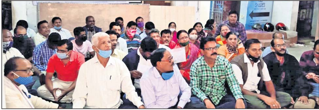
ସାହାରା ଇଣ୍ଡିଆ କାର୍ଯ୍ୟାଳୟ ଆଗରେ ଧାରଣା ଦିଆଯାଇଛି।

ସାହାରା ଇଣ୍ଡିଆ କମ୍ପାନୀର କର୍ମଚାରୀମାନେ ଫେରସ୍ତ ନିମନ୍ତେ କୁଧବାର ସମସ୍ତ ସାହାରା ଇଣ୍ଡିଆ କ୍ଷେତ୍ରୀୟ କାର୍ଯ୍ୟକାରୀ ବୃନ୍ଦ ଗଣାବେଶ୍ଚିତ୍ର ସାହାରା ଇଣ୍ଡିଆ ମୁଖ୍ୟ କାର୍ଯ୍ୟାଳୟ ସମ୍ମୁଖରେ ଧାରଣା ଦେଇଛନ୍ତି।