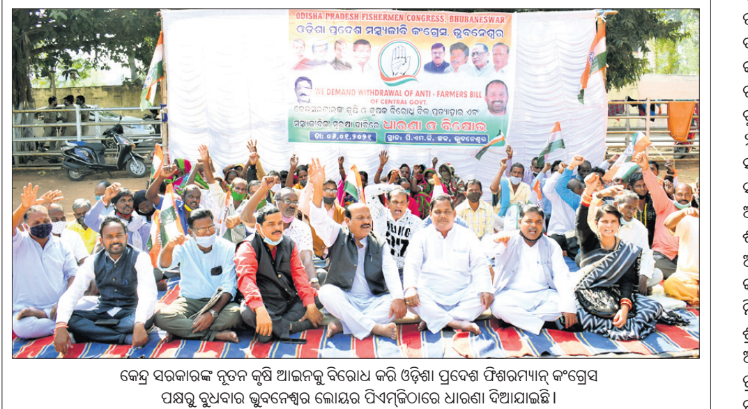
କେନ୍ଦ୍ର ସରକାରଙ୍କ ନୂତନ କୃଷି ଆଇନକୁ ବିରୋଧ କରି ଓଡ଼ିଶା ପ୍ରଦେଶ ପିଣ୍ଡାମାମ୍ବି କଂଗ୍ରେସ ପକ୍ଷରୁ ବୁଧବାର ଭୁବନେଶ୍ୱର ଲୋୟର ପିଏମ୍‌ଜିଠାରେ ଧାରଣା ଦିଆଯାଇଛି।