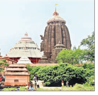
ପୁରୀ ଅଫିସ, ୨୧

ସର୍ବସାଧାରଣ ଦର୍ଶନର ଚତୁର୍ଥ ଦିନରେ ବୁଧବାର ମହାପ୍ରଭୁଙ୍କ ବନକଲୀଗି ନୀତି ଅନୁଷ୍ଠିତ ହୋଇଛି। ଶ୍ରୀମନ୍ଦିର ମଧ୍ୟାହ୍ନ ୧୨ ପରେ ଦର୍ଶନମହାପାତ୍ର ସେବକମାନେ ରତ୍ନବେଦିରେ ମହାପ୍ରଭୁଙ୍କ ବନକଲୀଗି କରିଥିଲେ।