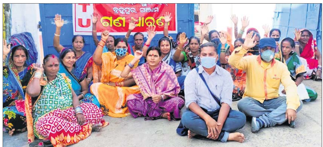
ବ୍ରହ୍ମପୁର ସେକ୍ସର ଚେରୁଡିଟି ମାନା ଟ୍ରଷ୍ଟ ସମ୍ମୁଖରେ ଧାରଣାରେ କର୍ମଚାରୀମାନେ।

ମାନା ଟ୍ରଷ୍ଟ ସେକ୍ସାଲ୍ କିଟେନ୍ କର୍ମଚାରୀ ମୁନିୟନ ପକ୍ଷରୁ ୪ ଦିନ ଦାବି ନେଇ କୁଧବାର କାର୍ଯ୍ୟବନ୍ଦ ଆନ୍ଦୋଳନ ସହ ଧାରଣା ଦିଆଯାଇଛି। କରୋନା ଲାଗି ହୋଇଥିବା ଲକ୍ଷଣର ଯୋଗୁ ଆହାର, ମଧ୍ୟାହ୍ନଭୋଜନ ପ୍ରସ୍ତୁତି କାର୍ଯ୍ୟ ବନ୍ଦ ରହିଥିଲା। ତେବେ ସେ ସମୟରେ କାର୍ଯ୍ୟରତ ଶ୍ରମିକଙ୍କୁ ମଜୁରି ସୁନିଶ୍ଚିତ କରିବାକୁ ରାଜ୍ୟ ସରକାର ଓ ସୁପ୍ରିମକୋର୍ଟଙ୍କ ପକ୍ଷରୁ ନିର୍ଦ୍ଦେଶ ଦିଆଯାଇଥିଲା। କିନ୍ତୁ ମାନା ଟ୍ରଷ୍ଟ ଏହାକୁ ହେଉଛନ୍ତି କରି କର୍ମଚାରୀଙ୍କୁ ମଜୁରି ଦେଇ ନ ଥିବା ସଂଘ ଅଭିଯୋଗ କରିଛି। ଲକ୍ଷଣର ପରା ୪ ପର୍ଯ୍ୟନ୍ତ ଟ୍ରଷ୍ଟର ଅଧିକାରୀ ଶ୍ରମିକଙ୍କୁ ନିୟମିତ କାର୍ଯ୍ୟ ମିଳୁନାହିଁ। ସର୍ବନିମ୍ନ ମଜୁରିଠାରୁ କମ୍ ହାରରେ ଦରମା ମିଳୁଥିବା ନେଇ ଟ୍ରଷ୍ଟର କର୍ତ୍ତୃପକ୍ଷଙ୍କୁ ଅବଗତ କରାଇଲେ କାର୍ଯ୍ୟରୁ ଛଟେକ କରାଯିବା ଧମକ ମିଳୁଥିବା