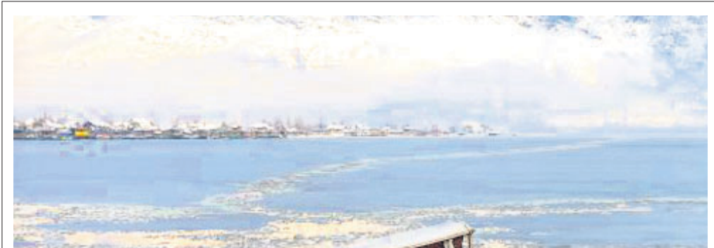
ଶ୍ରୀମତୀ: ପର୍ଯ୍ୟଟକମାନେ ତୁଷାରାବୃତ୍ତ ଭଲ ହୃଦରେ ଏକ ବୋଟରେ ଯାଉଛନ୍ତି।

କରି କଂଗ୍ରେସ ଉତ୍ତରପ୍ରଦେଶ ସରକାରଙ୍କୁ ସମାଲୋଚନା କରିଛି। ଘଟଣା ସମ୍ପର୍କରେ ଉକ୍ତ ପଦାଧିକାରୀଙ୍କୁ ଜଣାଇବା ଓ କାର୍ଯ୍ୟାନୁଷ୍ଠାନ ଗ୍ରହଣ କରିବାରେ ବିଳମ୍ବ ପାଇଁ ଉପାଦେୟ ଆନ୍ଦୋଳନ ହାତକୁ ଅଟକିଥିବା ନିଲମ୍ବନ କରାଯାଇଛି।