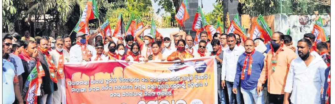
ଏସ୍ପି ଅଫିସ୍ ଆଗରେ ଭାଜପାର ବିକ୍ଷୋଭ