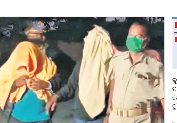
ଗିରଫ ଅଭିଯୁକ୍ତଙ୍କୁ ରୁଧିର ପୋଲିସ୍ କୋର୍ଟକୁ ନେଉଛି।

ନିର୍ଦ୍ଦିଷ୍ଟକୋଲ/ସାଲେପୁର, ୨୧ (ସ.ପ୍ର/ଡି.ଏନ.ଏ.)