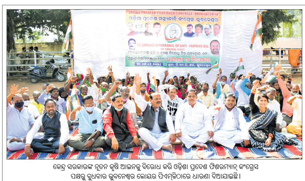
କେନ୍ଦ୍ର ସରକାରଙ୍କ ନୂତନ କୃଷି ଆଇନକୁ ବିରୋଧ କରି ଓଡ଼ିଶା ପ୍ରଦେଶ ପିଣ୍ଡାମାମା କଂଗ୍ରେସ ପକ୍ଷରୁ ରୁଧିର ଭୁବନେଶ୍ୱର ଲୋୟର ପିଏମ୍‌ଜିଠାରେ ଧାରଣା ଦିଆଯାଇଛି।