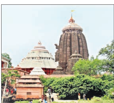
ପୁରୀ ଅଫିସ, ୨୧

ସର୍ବସାଧାରଣ ଦର୍ଶନର ଚତୁର୍ଥ ଦିନରେ ରୁଧିର ମହାପ୍ରଭୁଙ୍କ ବନକଲୀଗି ନୀତି ଅନୁସ୍ଥିତ ହୋଇଛି। ଶ୍ରୀମନ୍ଦିର ମଧ୍ୟାହ୍ନ ୪ଟା ପରେ ଦର୍ଶନମହାପାତ୍ର ସେବକମାନେ ଉତ୍ତରଦେଶରେ ମହାପ୍ରଭୁଙ୍କ ବନକଲୀଗି କରିଥିଲେ।