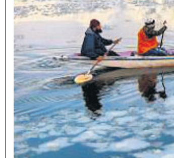
ଶ୍ରୀମନ୍ତର: ପର୍ଯ୍ୟଟକମାନେ ବୁଝାଇବାକୁ ଚାହୁଁଥିବା ସମୟରେ ଏକ ବୋଟରେ ଯାଉଛନ୍ତି।

ବେଙ୍ଗାଳୁରୁ, ୨୧: କୁଆଡ଼ିଆରୁ କର୍ମଚାରୀଙ୍କୁ ଖୁଲି ଖୋଲା ଯାଇଥିବାବେଳେ କିରୋନା ସଂକ୍ରମଣ ତୀବ୍ର ବଢ଼ାଇଛି। ମଙ୍ଗଳବାର ରାଜ୍ୟର ବିଭିନ୍ନ ସ୍ଥାନରୁ ୫୦ରୁ ଊର୍ଦ୍ଧ୍ୱ ଶିକ୍ଷକଙ୍କ କୋଭିଡ଼ ଟେଷ୍ଟ ରିପୋର୍ଟ ପଜିଟିଭ୍ ବାହାରିଛି।