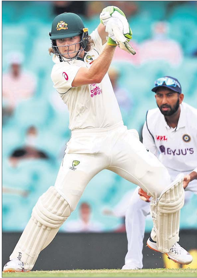
ଅର୍ଦ୍ଧଶତକୀୟ ଇନିଂସ୍ ଅବସରରେ ଫ୍ଲିକ୍ ପୁକୋଭାସ୍କି