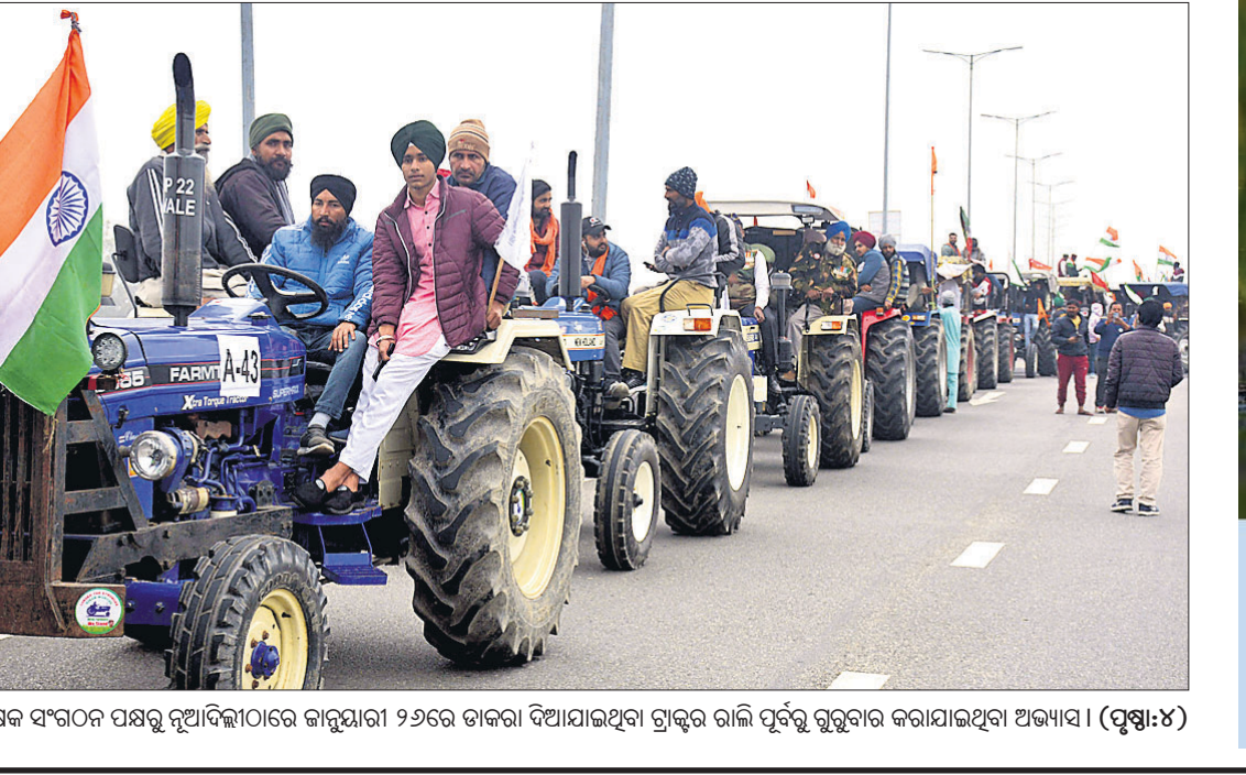
କୃଷକ ସଂଗଠନ ପକ୍ଷରୁ ନୂଆଦିଲ୍ଲୀରେ ଜାନୁୟାରୀ ୨୬ରେ ଡାକିବା ଦିଆଯାଇଥିବା ଟ୍ରାକ୍ଟର ରାଲି ପୂର୍ବରୁ ଗୁରୁବାର କରାଯାଇଥିବା ଅଭ୍ୟାସ। (ପୃଷ୍ଠା: ୪)