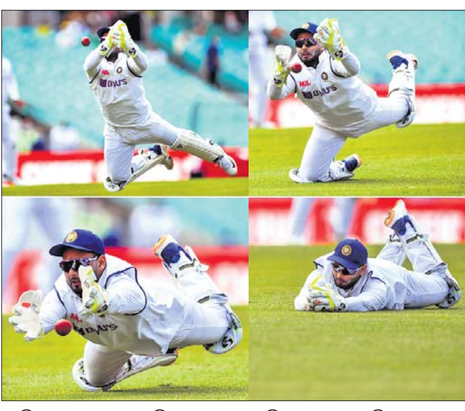
ସିଡ୍ନୀ ଟେଷ୍ଟର ପ୍ରଥମ ଦିବସରେ କ୍ୟାଟ୍ ଛାଡ଼ିବା ଅବସରରେ ରିଷଭ ପଟ୍ଟ

ଖେଳୁଥିବା ଜଣେ ଖେଳାଳିଙ୍କୁ ଅନ୍ୟଜଣେ ଖେଳାଳି ଆଉଟ କରିଥିଲେ। ପୂର୍ବ ଦୁଇ ଟେଷ୍ଟରେ ଭଲ ଆରମ୍ଭ କରିଥିଲେ ହେଁ ଲାଭୁସେନ ଗୋଟିଏ ହେଲେ ଅର୍ଦ୍ଧଶତକ ହାସଲ କରି ପାରି ନ ଥିଲେ। ମାତ୍ର ଏଠାରେ ସେ ତାହା ହେବାକୁ ନ ଦେଇ ବଡ଼ ଷ୍ଟୋର କରିବା ଆଶା ରଖାଯିବ ବୋଲି କୁହାଯାଇଛି। ୧୪୯ଟି ବଲ୍ ହାତରେ ସମ୍ପୂର୍ଣ୍ଣାନ୍ ହୋଇଥିବା ଏହି ନିର୍ଦ୍ଧାରଣାଧୀନ ବ୍ୟାଟ୍ମ୍ୟାନ ୮ ଚୌକା ସହାୟତାରେ ୬୭ ରନରେ ଅପରାଜିତ ରହିଛନ୍ତି। ସେହିପରି ପ୍ରଥମ ଦୁଇ ଟେଷ୍ଟରେ ବିଫଳ ରହିଥିବା ସିଡ୍ନୀ ଏଠାରେ ୬୪ ବଲ୍ ୫୫ ଚୌକା ସହ ୩୧ ରନରେ ଅପରାଜିତ ରହିଛନ୍ତି। ପୂର୍ବ ୩ ଇନିଂସରେ