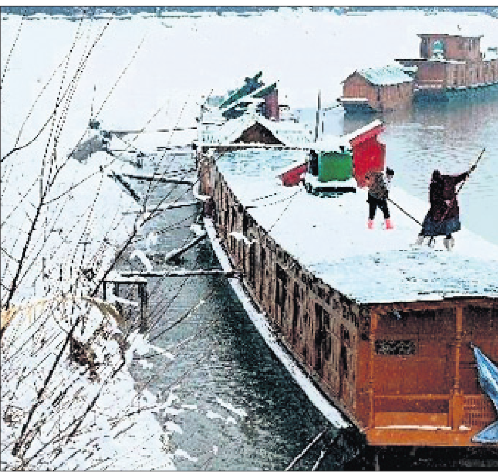
ରାଷ୍ଟ୍ରପତି ପରେ ଜମ୍ମୁ-କଶ୍ମୀରରେ ପସି ରହିଥିବା ପର୍ଯ୍ୟଟକଙ୍କ ପାଇଁ ଘରୋଇ ବୋର୍ଟ ସେବା ଆରମ୍ଭ ହୋଇଛି। ଯାତ୍ରା ପରିବହନ ପୂର୍ବରୁ କର୍ମଚାରୀମାନେ ବୋର୍ଟ ଉପରେ ଜମି ରହିଥିବା ବସ୍ତୁ ସଫା କରୁଛନ୍ତି।

ନୂଆଦିଲ୍ଲୀ: ଭାରତର ପ୍ରଧାନମନ୍ତ୍ରୀଙ୍କ ବର୍ତ୍ତମାନର ଠିକଣା ଲୋକକଲ୍ୟାଣ ମାର୍ଗ। ଏଠାରେ ରହିଛି ୪ ବର୍ଗକି.ମି.ର ପ୍ରଧାନମନ୍ତ୍ରୀଙ୍କ ନିବାସ ଏବଂ ବସ୍ତ୍ରାଳୟ। ହେଲେ ୨୦୨୪ ପୂର୍ବକ ଏହି ଠିକଣା ବଦଳିଯିବ। କାରଣ ନୂଆ ପାର୍ଲିମେଣ୍ଟ ଭବନ ନିର୍ମାଣ ସହ ସେଣ୍ଟ୍ରାଲ ଭିଷ୍ଟା ପ୍ରକଳ୍ପକୁ ସୁପ୍ରିମକୋର୍ଟ ସବୁଜ ସଙ୍କେତ ଦେଇସାରିଛନ୍ତି। ଏହାପରେ ପ୍ରକଳ୍ପ କାର୍ଯ୍ୟ ହାରାହାରି ହେବା ଲାଗି ରାସ୍ତା ଖୋଳିଛି। ତଦନୁଯାୟୀ ରାଷ୍ଟ୍ରପତି ଭବନଠାରୁ ଇଣ୍ଡିଆ ଗେଟ୍ ଯାଏ ମାଜିମି ପରିମିତ ଅଞ୍ଚଳର ନବକଳ୍ପ ହେବ। ନୂଆ ସଂସଦ ଭବନ ଏବଂ ପ୍ରଧାନମନ୍ତ୍ରୀଙ୍କ ଆବାସ ମଧ୍ୟ ଏହାର ଅନ୍ତର୍ଭୁକ୍ତ। ପ୍ରକଳ୍ପ ଆଗେଇବା ପୂର୍ବରୁ ପରିବେଶଗତ ସମସ୍ୟାକୁ ନେଇ ସୁପ୍ରିମକୋର୍ଟରେ ମାମଲା ରୁଜୁ ହୋଇଥିଲା। ତେବେ ନିକଟରେ ଏହି କେଶ୍ ହାଲୁକି ହୋଇଛି। ଯଦି ସବୁକିଛି ଠିକ୍ ଠାକୁ ଚାଲେ ତେବେ ୨୦୨୪ ପୂର୍ବକ ଭାରତର ନୂତନ ପାର୍ଲିମେଣ୍ଟ ଭବନ ପ୍ରସ୍ତୁତ ହୋଇଯିବ। ସେଣ୍ଟ୍ରାଲ ଭିଷ୍ଟା ପ୍ରକଳ୍ପ ନକ୍ସାରେ ନିର୍ମାଣ ହେବାକୁ ଥିବା ପିଏମ୍ ଆବାସ କମ୍ପ୍ଲେକ୍ସ ଏବେକାର କୋଠାଠାରୁ ଭିନ୍ନ ହେବ। ଏଠାରେ ୪ ମହଲା ବିଶିଷ୍ଟ ୧୦ ବିଲ୍ଡିଂ ରହିବ। ଏଗୁଡ଼ିକର ସର୍ବଧିକ ଉଚ୍ଚତା ୧୨ ମିଟର ମଧ୍ୟରେ ସୀମିତ ରହିବ। ଏହି କମ୍ପ୍ଲେକ୍ସ ୧୫ ଏକର କ୍ଷେତ୍ରରେ ନିର୍ମିତ ହେବ। ୩୦,୩୫୧ ବର୍ଗମିଟର ପରିମିତ ଅଞ୍ଚଳରେ ନୂତନ ପିଏମ୍ ନିବାସ ପରିବ୍ୟାପ୍ତ ହେବ। ସେଣ୍ଟ୍ରାଲ ପ୍ରୋଜେକ୍ଟ ନ୍ୟୁ ଲାଗି ୨.୫୦ ଏକରରେ ଏକ ନୂତନ ଭବନ ତିଆରି କରାଯିବ। ଏସବୁ ଲାଗି ସେଣ୍ଟ୍ରାଲ ପ୍ରକଳ୍ପ ଖାର୍ଚ୍ଚ ଶୁଣାଇବା ପାଇଁ (ସିପିଟିପି) ପକ୍ଷରୁ ପ୍ରସ୍ତାବିତ ବଜେଟ୍ ୧୧,୭୯୫ କୋଟିରୁ ୧୩,୪୫୦ କୋଟିକୁ ବୃଦ୍ଧି କରାଯାଇଛି। ପିଏମ୍ ହାଉସ୍ ଏବଂ କାର୍ଯ୍ୟାଳୟର କାର୍ଯ୍ୟକଳ୍ପ ସେଣ୍ଟ୍ରାଲ ଭିଷ୍ଟା ପ୍ରୋଜେକ୍ଟର ଅଂଶିକୃତ। ଏହା ସମ୍ପୂର୍ଣ୍ଣ ସ୍ୱଦେଶୀ କ୍ଷାମକୋଶକରେ ନିର୍ମିତ ହେବ। ଭୁକ୍ତ ପ୍ରତିରୋଧୀ କ୍ଷମତା ସହିତ ପାର୍ଲିମେଣ୍ଟ ଗତିବିଧି, ଅଧିକାରୀ ଏବଂ କର୍ମଚାରୀଙ୍କ ସୁବିଧା ଲାଗି ସମସ୍ତ ବ୍ୟବସ୍ଥା ଉପକଳ୍ପ ହେବ। ଏବେକାର ସଂସଦ ଭବନର କାର୍ଯ୍ୟାଳୟଗୁଡ଼ିକ ଯୋଜନାବଦ୍ଧ ଭାବେ ନିର୍ମିତ ହୋଇନାହିଁ। ତେଣୁ ସମୟ