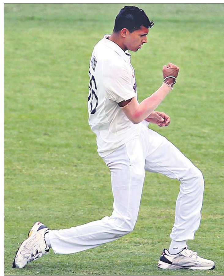
ଉଇକେଟ ନେବା ପରେ ନଭାପା ସଇନି