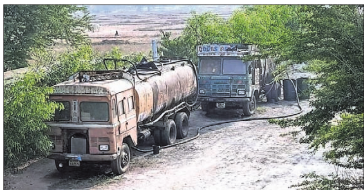
ଗୋଟିଏ ଟ୍ୟାଙ୍କରରୁ ଅନ୍ୟ ଟ୍ୟାଙ୍କରକୁ ତେଲ ବାହାର କରାଯାଉଛି ।

ଯାକପୁର ଜିଲ୍ଲା ଦେଇ ଯାଇଥିବା ଭୁବନେଶ୍ୱର-ପାରାଦୀପ ୫୩ ନମ୍ବର ଜାତୀୟ ରାଜପଥ ପାର୍ଶ୍ୱର ବିଭିନ୍ନ ସ୍ଥାନରେ ଚାଲିଛି ଫର୍ନେସ ଅଏଲ (ଏଫ୍ୱେ), ପେଟ୍ରୋଲ, ଡିଜେଲ ଆଦି ଡେଲିଭରୀ ପଦାର୍ଥର ଅପମିଶ୍ରଣ । ୧୦ରୁ ଉର୍ଦ୍ଧ୍ୱ ସ୍ଥାନରେ ଅତି ଗୋପନୀୟ ଭାବେ ଏହି ଅପମିଶ୍ରଣ ଚାଲିଛି । ଏହି ବ୍ୟବସାୟ କାରକାରୀଙ୍କ ଡେଲିଭରୀ ପଦାର୍ଥ ପରିବହନ କରୁଥିବା କେତେକ ଗାଡ଼ି ମାଲିକ କୋଟିପତି ହୋଇଛନ୍ତି । ଏଥିରେ ପୁରୁଣା ଏକ ପରିବହନ ସଂସ୍ଥା ବହୁ ଆଗରେ ରହିଛି । ପାରାଦୀପ ଅଞ୍ଚଳ କେତେକ ପ୍ରଭାବଶାଳୀ ଲୋକଙ୍କ ସହାୟତାରେ ଏହି ପରିବହନ ସଂସ୍ଥା ଏକେଣ୍ଟ୍ରିକ୍ କରିଆରେ ଫର୍ନେସ ଅଏଲ ବାହାର କରାଯାଉଛି । ପୁଣି ସେହି ଟ୍ୟାଙ୍କରରେ ଅପମିଶ୍ରଣ କରି ନିର୍ଦ୍ଦିଷ୍ଟ କମ୍ପାନୀମାନଙ୍କୁ ଯୋଗାଇ ଦିଆଯାଇଥିବା ଅଭିଯୋଗ ହେଉଛି । ଏନେଇ ଗଣମାଧ୍ୟମରେ ଖବର ପ୍ରକାଶ ପାଇବା ପରେ ପୋଲିସ୍ ସଂପୂର୍ଣ୍ଣ ଅଣ୍ଟିଆରେ ଏକେଣ୍ଟ୍ରିକ୍ ସୁରକ୍ଷା ଯୋଗାଇ ଦେବାକୁ ଉଦ୍ୟମ ଆରମ୍ଭ କରିଛି । ସେମାନଙ୍କୁ ସ୍ଥାନ ଛାଡ଼ି ଚାଲିଯିବାକୁ କହିଛି । ହେଲେ ସେମାନେ ଗାଡ଼ିଗୁଡ଼ିକ ଜବତ କରିବା କିମ୍ବା ଏକେଣ୍ଟ୍ରିକ୍ ରିମୁଫ୍ କରିବାରେ ପଛପୁଣି ଦେଉନା । ଫଳରେ ସେମାନେ ଗୋଟିଏ ସ୍ଥାନ ଛାଡ଼ି ଅନ୍ୟ ସ୍ଥାନରେ ଆଣି ଜମାଉଛନ୍ତି । ପୁଣି ଥରେ ନିର୍ଦ୍ଦିଷ୍ଟ ନିଜ କାରକାରୀ ଟ୍ୟାଙ୍କରକୁ ମିଳିଛି ।