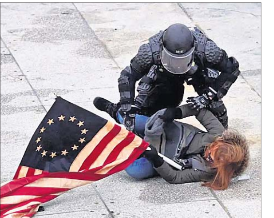
ଜଣେ ଦଙ୍ଗାକାରୀଙ୍କୁ ପୋଲିସ୍ କାବୁ କରୁଛି ।