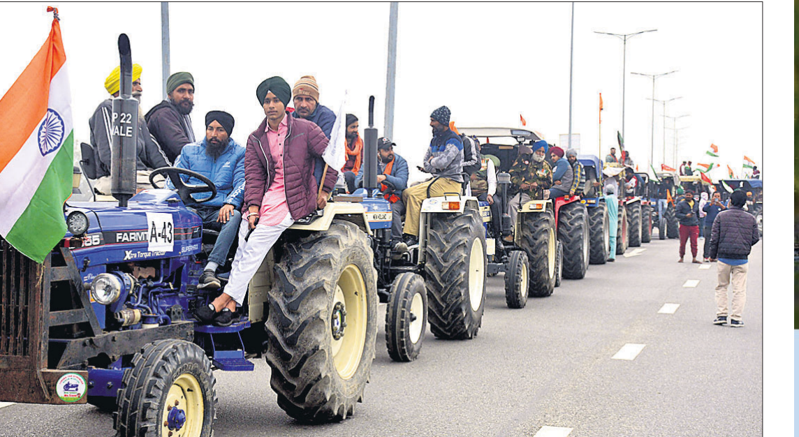
କୃଷକ ସଂଗଠନ ପକ୍ଷରୁ ନୂଆଦିଲ୍ଲୀରେ ଜାନୁୟାରୀ ୭ରେ ଡାକିବା ଦିଆଯାଇଥିବା ଟ୍ରାକ୍ଟର ରାଲି ପୂର୍ବରୁ ଗୁରୁବାର କରାଯାଇଥିବା ଅଭ୍ୟାସ। (ପୃଷ୍ଠା: ୪)

ପେଟ୍ରୋଲ ୨୪, ଡିଜେଲ ୩୦ ପଇସା ବଢ଼ିଲା। ନୂଆଦିଲ୍ଲୀ, ଭୁବନେଶ୍ୱର, ୭୧୧ ପ୍ରାୟ ୩୦ ଦିନର ବିରତି ପରେ ପୁଣି ୨ ଦିନ ହେବ ତେଲ ଦର ଲଗାତାର ବଢ଼ୁଛି। ଗୁରୁବାର ଭୁବନେଶ୍ୱରରେ ପେଟ୍ରୋଲ ଲିଟର ପିଛା ୨୪ ପଇସା ବଢ଼ିଥିବା ବେଳେ ଡିଜେଲ ୩୦ ପଇସା ଉର୍ଦ୍ଧ୍ୱରେ ରହିଛି। ଫଳରେ ପେଟ୍ରୋଲ ୮୪.୮୬ ଟଙ୍କା ଏବଂ ଡିଜେଲ ୮୧.୦୪ ଟଙ୍କା ହୁଇଥିବା ରାଷ୍ଟ୍ରୀୟ ଟେକ୍ ବିପଣନ କମ୍ପାନୀଗୁଡ଼ିକ ପକ୍ଷରୁ ସୂଚନା ମିଳିଛି। ବୁଧବାର ପେଟ୍ରୋଲ ଏବଂ ଡିଜେଲ ଦର ଯଥାକ୍ରମେ ୨୬ ଏବଂ ୨୬ ପଇସା ବଢ଼ିଥିଲା। କରୋନା