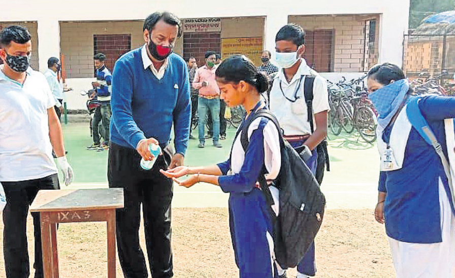
ଉତ୍କଳ ଜିଲା ସ୍କୁଲରେ ଛାତ୍ରୀଙ୍କ ହାତ ସାନିଟାଇଜ୍ କରାଯାଉଛି।