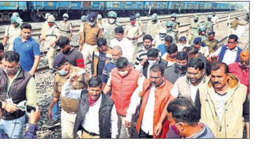
ରେଳ ଷ୍ଟେସନରେ ଆନ୍ଦୋଳନକାରୀମାନେ

ସମ୍ବଲପୁର ଜିଲ୍ଲା ରେଳାଳି ଷ୍ଟେଶନରେ ଧାନବାଦ- ଏଲେପି ଏକ୍ସପ୍ରେସ ରହଣି ଦାବି ନେଇ ରେଳାଳି କ୍ରିୟାତ୍ମକ କମିଟି ପକ୍ଷରୁ ପୂର୍ବ ଯୋଗ୍ୟା ମୂତାବକ ଶୁକ୍ରବାର ରେଳରୋକ୍ତ କରାଯାଇଥିଲା। ଏଥିସହ ରେଳାଳି ଅଞ୍ଚଳର ସରକାରୀ ଅଞ୍ଚଳ ଓ ବୋକାନ ବଜାରରୁ ଚଳି ବନ୍ଦ ରହିଥିଲା। ଷ୍ଟେସନରେ ରେଳରୋକ୍ତ ଯୋଗୁ ଦୀର୍ଘ ୫ଘଣ୍ଟା ଧରି ଟ୍ରେନ ଚଳାଚଳ ବ୍ୟାହତ ହୋଇଥିଲା। ରାଉରକେଲା-