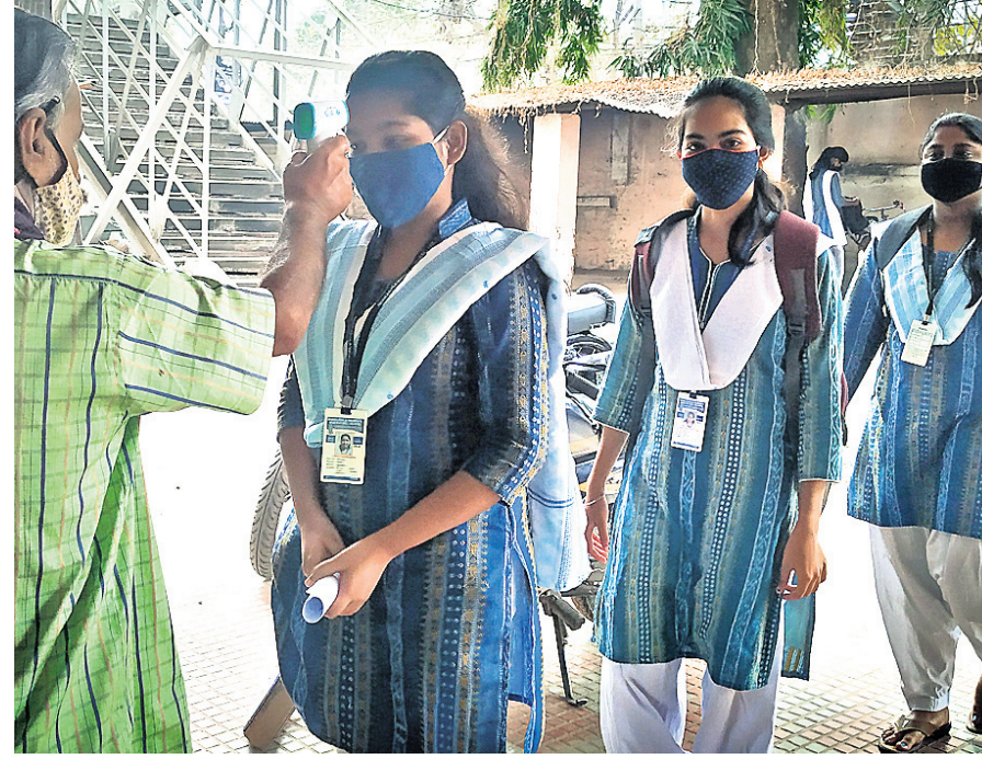
କଟକ ଶୈଳବାଳା ସମ୍ପ୍ରଦାୟର ମହିଳା ମହାବିଦ୍ୟାଳୟ ଛାତ୍ରୀଙ୍କ ଭିନି।