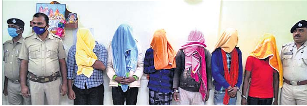
ପୋଲିସ୍ ହାତରେ ଧରା ପଡ଼ିଥିବା ଲୁଚେରାଗ୍ୟାଙ୍ଗର ।