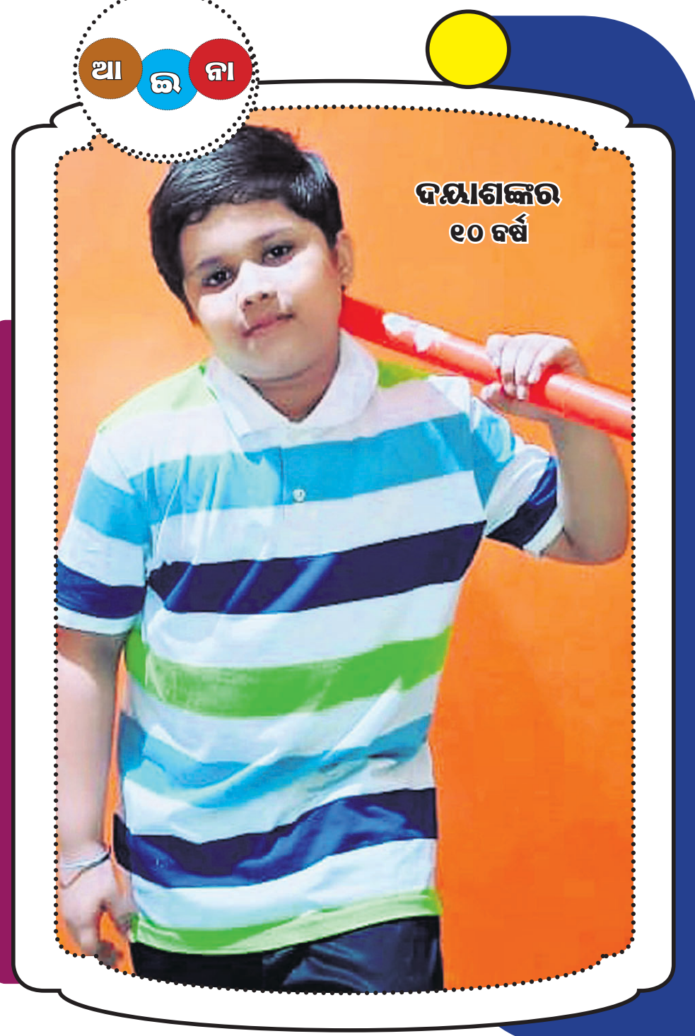
ଦୟାଶଙ୍କର ୧୦ ବର୍ଷ