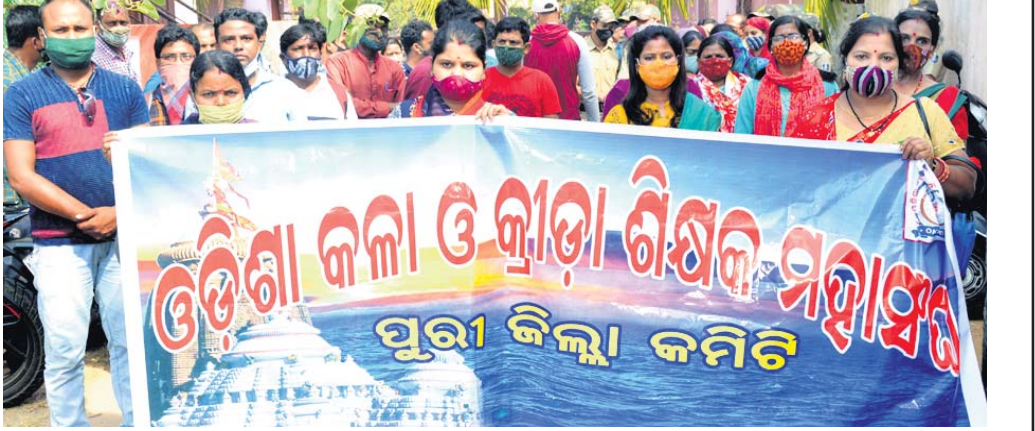
ବିଭିନ୍ନ ଦାବି ନେଇ ଓଡ଼ିଶା କଳା ଓ କ୍ରୀଡ଼ା ଶିକ୍ଷକ ମହାସଂଘ ପୁରୀ ଜିଲା ଶାଖା ପକ୍ଷରୁ ବିକ୍ଷୋଭ ପ୍ରଦର୍ଶନ ।