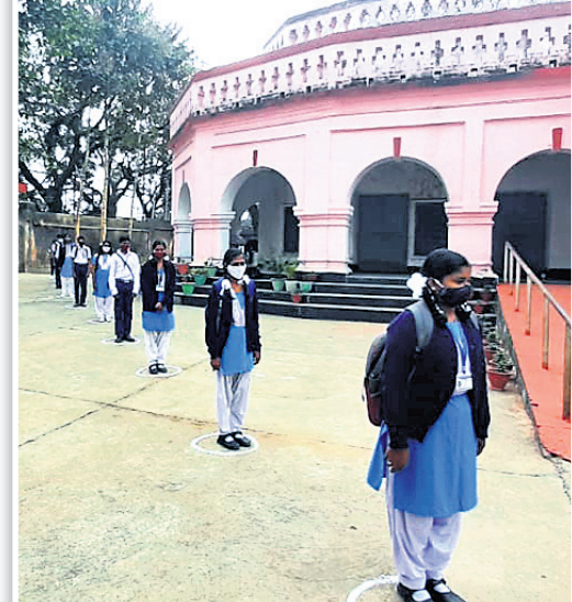
ସୁନ୍ଦରଗଡ଼ ଭବାନୀଶଙ୍କର ହାଇସ୍କୁଲରେ ଛାତ୍ରାଛାତ୍ରୀ ସ୍କୁଲ ପ୍ରବେଶ କରୁଛନ୍ତି।