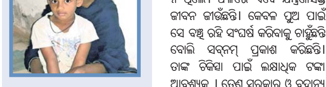
ଶାଶୁଘର ଲୋକେ ଖୁବ୍ ଖୁବ୍ ହୋଇଥିଲେ। ତେବେ ପରବର୍ତ୍ତୀ ସମୟରେ ତାଙ୍କର ଦୁଇଟି ଯାକ କିଡ଼ନୀ ସମସ୍ୟା ଥିବା ଜଣାପଡ଼ିଥିଲା। ଏହା ଜାଣି ସାମାଜିକ ଓ ଶାଶୁଘର ଲୋକେ ତାଙ୍କୁ ଘରେ ଜବରଦସ୍ତ ବିବା କରିଦେଇଥିଲେ। କୋଲକତା ଶିଶୁଟିଏ ଥିବାରୁ ସେ ଆଶ୍ରୟ ପାଇଁ ବାଧ୍ୟ ହୋଇ ବାପଘରକୁ ଚାଲିଆସିଥିଲେ। ବୃଦ୍ଧ ପିତାଙ୍କ ଉପରେ ବୋଧ୍ୟ ସର୍ବନମ୍ ହୋଇ ଖୁଖିକ୍ଷୁରେ ଚଳିଲେ। ତାଙ୍କ ବାପା ଧାରକରଜ କରିବା ସହ ଘରର ଆସବାବପତ୍ର ବିକି ଦେଇ ଚିକିତ୍ସା କରାଇଥିଲେ ବି ସେ ସୁସ୍ଥ ହୋଇ ନ ଥିଲେ। ଫଳରେ ଏବେ ଯନ୍ତ୍ରସାହାଯ୍ୟ ଜୀବନ ଜାଞ୍ଚିଛନ୍ତି। କେବଳ ପୁଅ ପାଇଁ ସେ ବନ୍ଧୁ ରହି ସର୍ବନମ୍ କରିବାକୁ ଚାହୁଁଛନ୍ତି ବୋଲି ସର୍ବନମ୍ ପ୍ରକାଶ କରିଛନ୍ତି। ତାଙ୍କ ଚିକିତ୍ସା ପାଇଁ ଲକ୍ଷାଧିକ ଟଙ୍କା ଆବଶ୍ୟକ। ତେଣୁ ସରକାର ଓ ବ୍ୟାପକ ବ୍ୟକ୍ତି ତାଙ୍କ ପ୍ରତି ସହାୟତା ଯାଚି ବଢ଼ାଇବାକୁ ସର୍ବନମ୍ ନିବେଦନ କରିଛନ୍ତି।