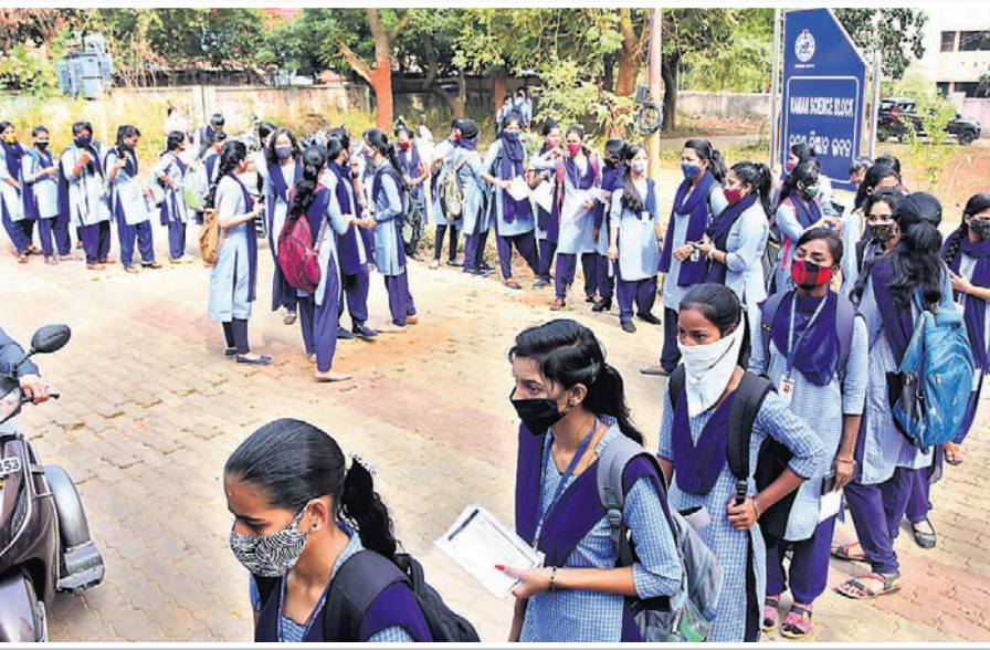
ବିଜେବି ଅଟୋନୋମସ୍ କଲେଜର ଛାତ୍ରୀମାନେ ଧାଡ଼ିରେ ଆସୁଛନ୍ତି।