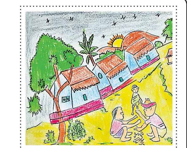
ସାଦ୍ୟାନ୍ତ ଶତପଥୀ କ୍ଲାସ୍-୨, ମଦ୍ୟ ପବ୍ଲିକ୍ ସ୍କୁଲ, ପୁରୀ