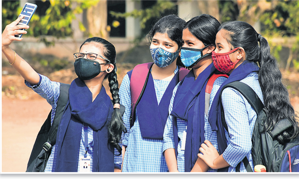
ଦୀର୍ଘଦିନ ପରେ ଏକାଠି ହୋଇ କଲେଜ କ୍ୟାମ୍ପସ୍‌ରେ ସେଲ୍‌ଫି ନେଉଛନ୍ତି।