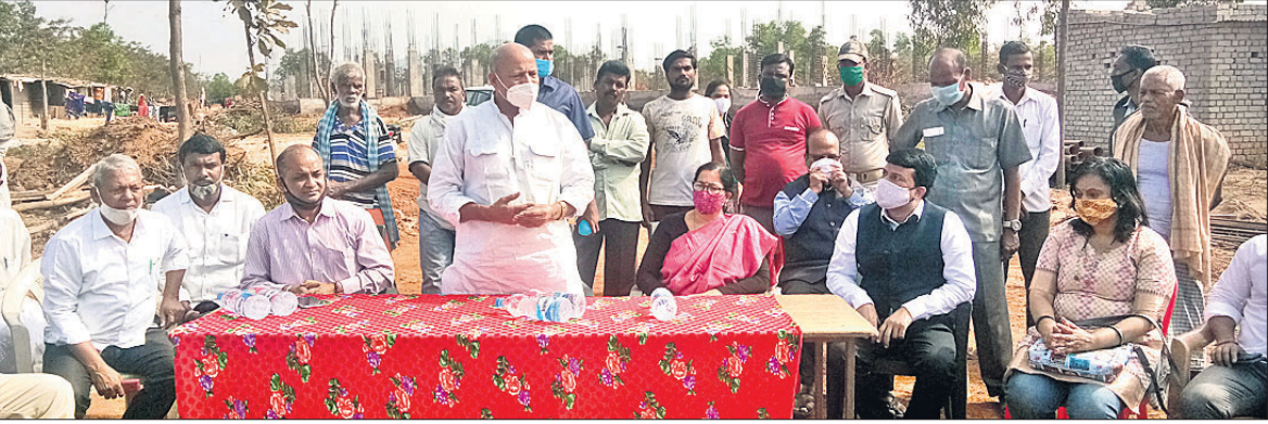
ସିଦ୍ଧାଠାରେ ଉତ୍କଳ ବିଶ୍ୱବିଦ୍ୟାଳୟର ଗ୍ରାମୀଣ କ୍ୟାମ୍ପସ୍ ସମୀକ୍ଷା କରୁଥିବା କୁଳପତି ଓ ବିଧାୟକ।