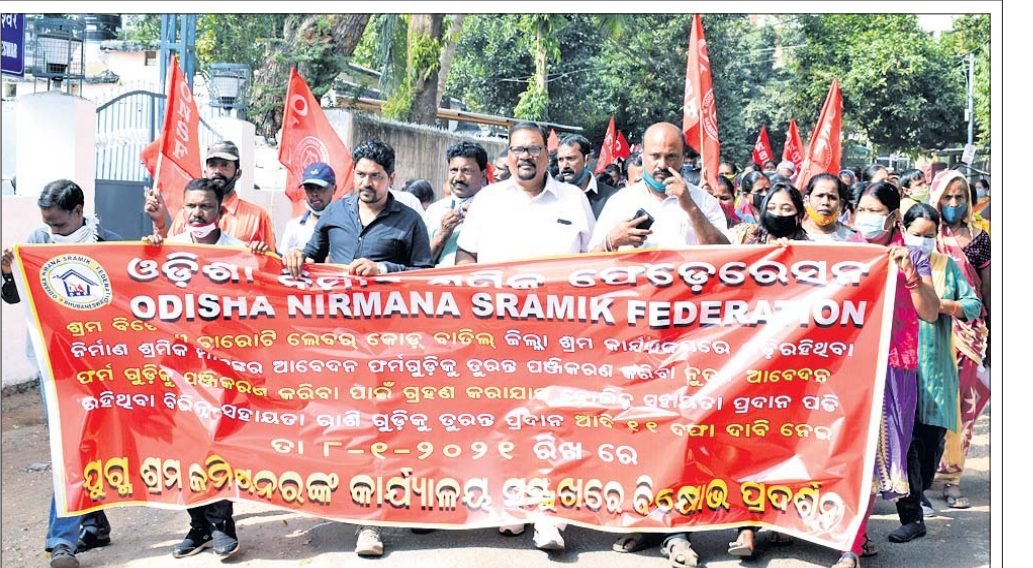
ଭୁବନେଶ୍ୱର ଓଡ଼ିଶା ନିର୍ମାଣ ଶ୍ରମିକ ଫେଡେରେସନର ପକ୍ଷରୁ ଯୁଗ୍ମ ନିର୍ମାଣର ଅର୍ଥ ସମ୍ବଳରେ ଶୁକ୍ରବାର ବିକ୍ଷୋଭ କରାଯାଇଛି।