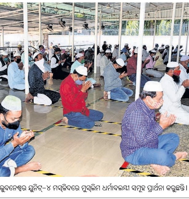
କୁବନେଶ୍ୱର ସୁନି-୪ ମସିହାରେ ମୁସଲିମ ଧର୍ମାବଲମ୍ବୀ ସମୂହ ପ୍ରାର୍ଥନା କରୁଛନ୍ତି।