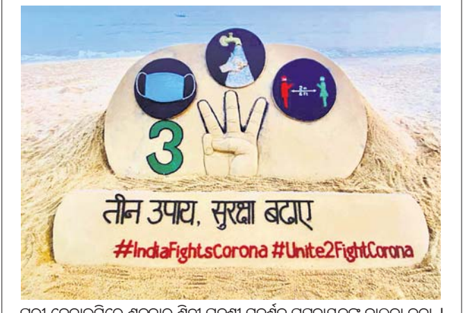
ପୁରୀ ବେଳାଭୂମିରେ ଶୁକ୍ରବାର ଶିଳ୍ପୀ ପଦ୍ମଶ୍ରୀ ସୁବର୍ଣ୍ଣନ ପଟ୍ଟନାୟକଙ୍କ ବାଲୁକା କଳା ।