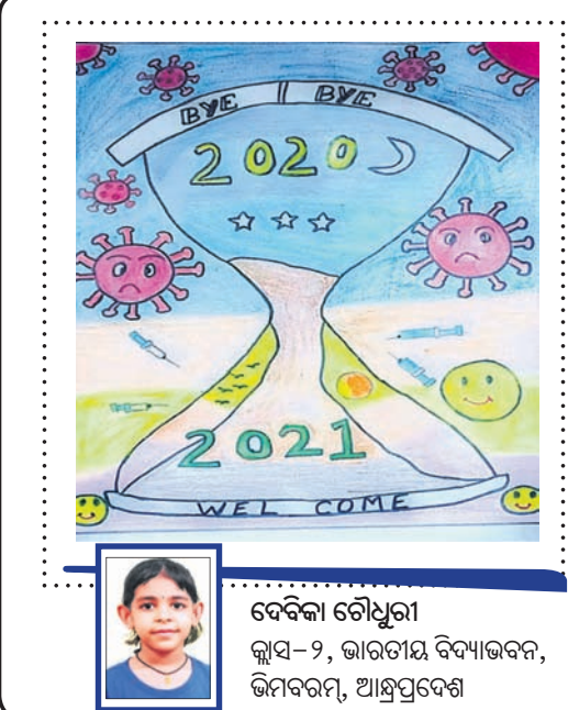
ଦେବିକା ଚୌଧୁରୀ କ୍ଲାସ୍-୨, ଭାରତୀୟ ବିଦ୍ୟାଳୟ, ଭିମବରମ, ଆନ୍ଧ୍ରପ୍ରଦେଶ