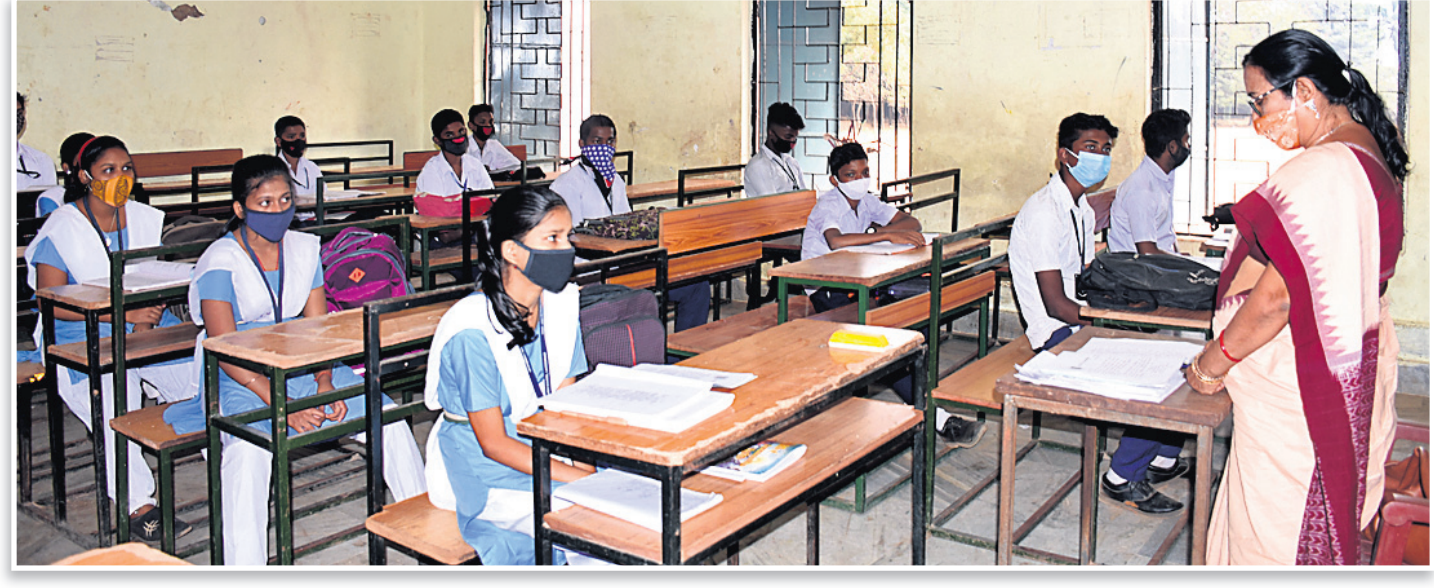
ଭୁବନେଶ୍ୱର ଲକ୍ଷ୍ମୀସାଗର ହାଇସ୍କୁଲରେ ଆରମ୍ଭ ହୋଇଛି ପାଠପଢ଼ା।