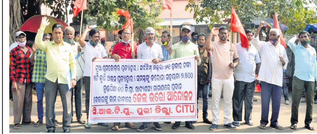
ପୁରୀ ଜିଲା ସିଆଇଟିପି ପକ୍ଷରୁ ଶୁକ୍ରବାର ବିଭିନ୍ନ ଦାବି ନେଇ ଜିଲାପାଳଙ୍କ କାର୍ଯ୍ୟାଳୟ ଆଗରେ ଧାରଣା ।