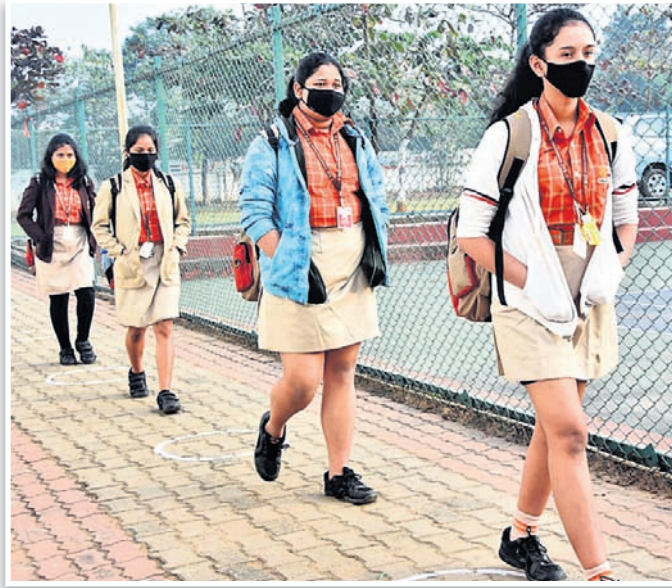
ସାମାଜିକ ଦୂରତ୍ୱ ରକ୍ଷାକରି ଭୁବନେଶ୍ୱର ସାଇ ଇନ୍‌ଫରମେଶନାଲ୍ ସ୍କୁଲର ଛାତ୍ରୀ ସ୍କୁଲ ପ୍ରବେଶ କରୁଛନ୍ତି।