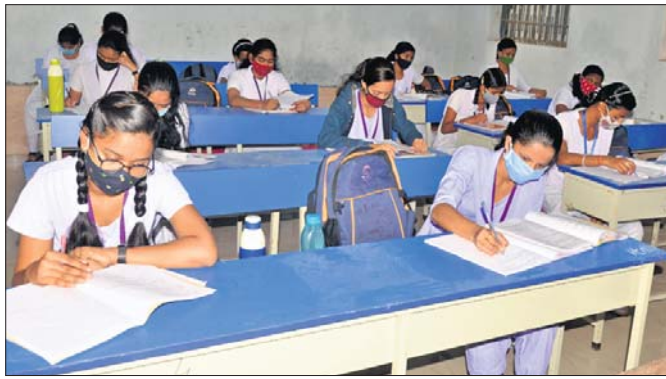
ପୁରୀ ବିଶ୍ୱାସ୍ୟ ବିଦ୍ୟାଳୟରେ ପିଲାମାନେ ମାସ ପିନ୍ଧି ପଢୁଛନ୍ତି ।

କୋରୋନା ମହାମାରୀ ଯୋଗୁ ଦୀର୍ଘ ୯ମାସ ସ୍କୁଲ ବନ୍ଦ ରହିବା ପରେ ଶୁକ୍ରବାର ଖୋଲିଛି କୋଭିଡ୍ କଟକଣା ପାଳନ ସହ ପୁରୀ ସହର ସମେତ ଜିଲାର ସମସ୍ତ ହାଇସ୍କୁଲରେ ଦଶମ ଶ୍ରେଣୀ ପିଲାଙ୍କ ପାଠପଢ଼ା ଆରମ୍ଭ ହୋଇଛି।