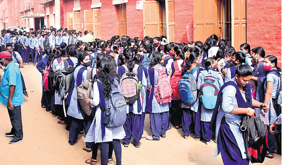
ପୁରୀ ଏସ୍‌ସିଏସ୍ କୁନିୟର କଲେଜ କ୍ୟାମ୍ପସ୍‌ରେ ଛାତ୍ରାଛାତ୍ରୀ।