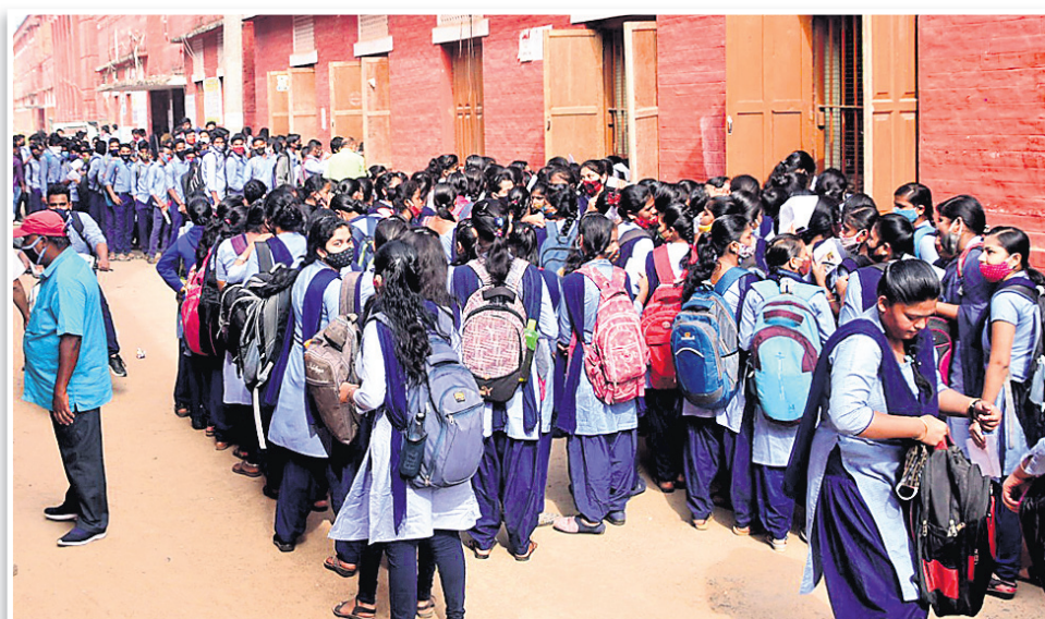
ଏସ୍ପିପି ବଳେ କ୍ୟାମ୍ପସ୍ରେ ଛାତ୍ରାଛାତ୍ରୀ।