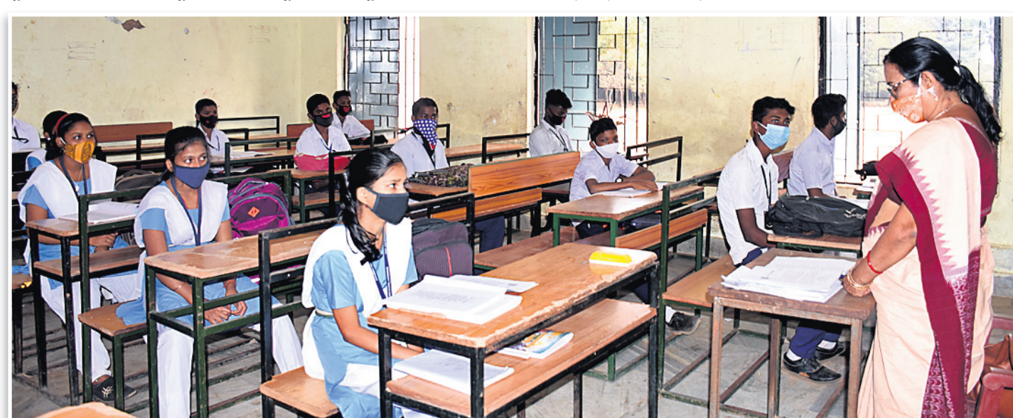
ଭୁବନେଶ୍ଵର ଲକ୍ଷ୍ମୀସାଗର ହାଇସ୍କୁଲରେ ଆରମ୍ଭ ହୋଇଛି ପାଠପଢ଼ା।