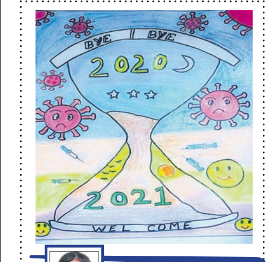
ଦେବିକା ଚୌଧୁରୀ କ୍ଲାସ-୨, ଭାରତୀୟ ବିଦ୍ୟାଳୟ, ଭିମବରମ, ଆନ୍ଧ୍ରପ୍ରଦେଶ