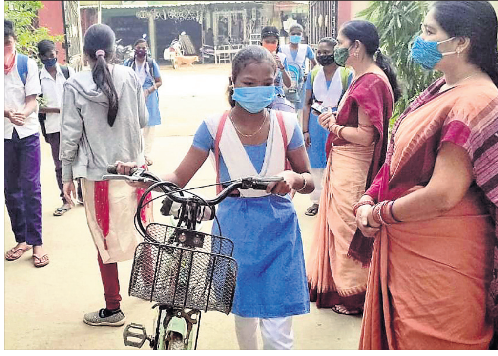
ବରଗଡ଼ ରାଣାପ୍ରତାପ ହାଇସ୍କୁଲ ଫାଟକ ଆଗରେ ଛାତ୍ରାଛାତ୍ରୀଙ୍କ ହାତ ସାନିଟାଇଜ୍ କରାଯାଉଛି।

■ ରିପୋର୍ଟ: ପ୍ରେମାନନ୍ଦ ଖମାପା, ବୀରେନ୍ଦ୍ର ଝାଙ୍କର, ଜୟନାରାୟଣ ମେହ୍ତା, ବି.ଶଙ୍କର, ଶ୍ରୀରାମି ସାହୁ, ମୃତ୍ୟୁଞ୍ଜୟ ଶତପଥୀ, ଅଜିତ ବାରିକ