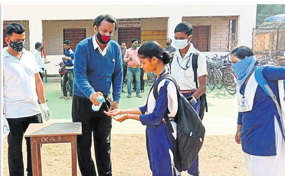
ଭଦ୍ରକ ଜିଲା ସ୍କୁଲରେ ଛାତ୍ରୀଙ୍କ ହାତ ସାନିଟାଇଜ୍ କରାଯାଉଛି।