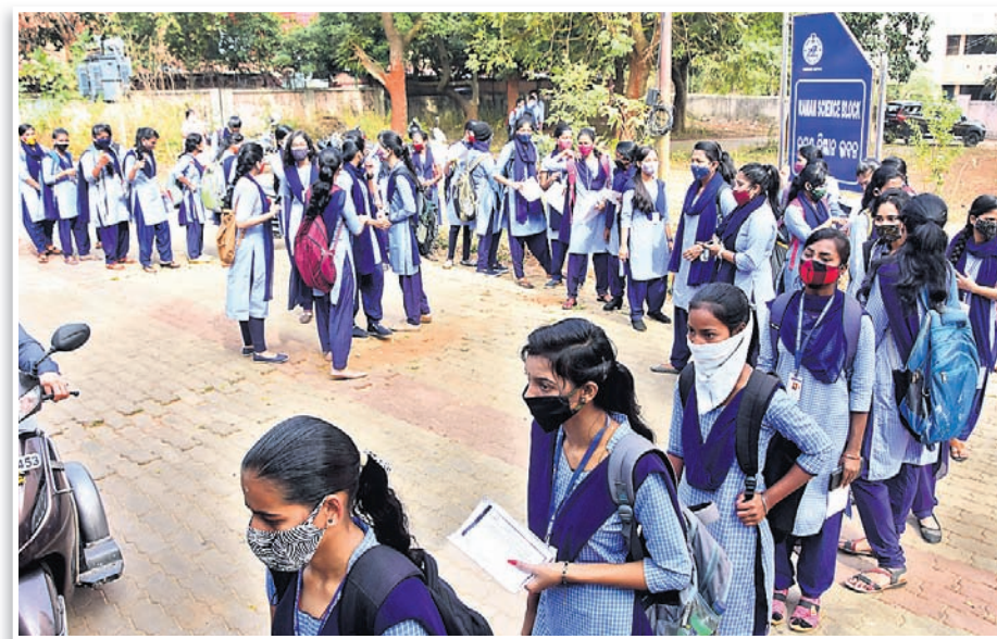
ବିଭେଦ ଅଟୋନୋମସ୍ କଲେଜର ଛାତ୍ରୀମାନେ ଧାଡ଼ିରେ ଆସୁଛନ୍ତି।