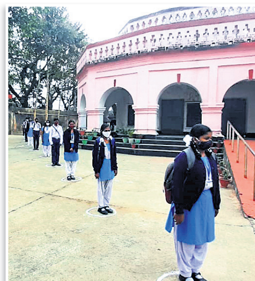
ଭୁବନେଶ୍ଵର ଭବାନୀଶଙ୍କର ହାଇସ୍କୁଲରେ ଛାତ୍ରାଛାତ୍ରୀ ସ୍କୁଲ ପ୍ରବେଶ କରୁଛନ୍ତି।