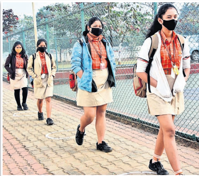
ସାମାଜିକ ଦୂରତ୍ଵ ରକ୍ଷାକରି ଭୁବନେଶ୍ଵର ସ୍କୁଲ ଛାତ୍ରୀ ସ୍କୁଲ ପ୍ରବେଶ କରୁଛନ୍ତି।