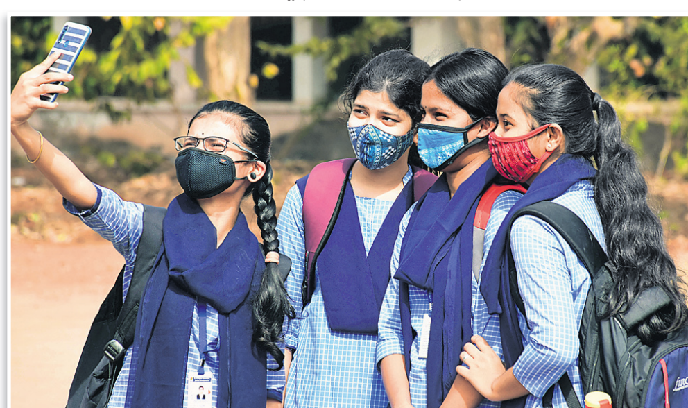
ଦୀର୍ଘଦିନ ପରେ ଏକାଠି ହୋଇ କଲେଜ କ୍ୟାମ୍ପସ୍ରେ ସେଲଫି ନେଉଛନ୍ତି।