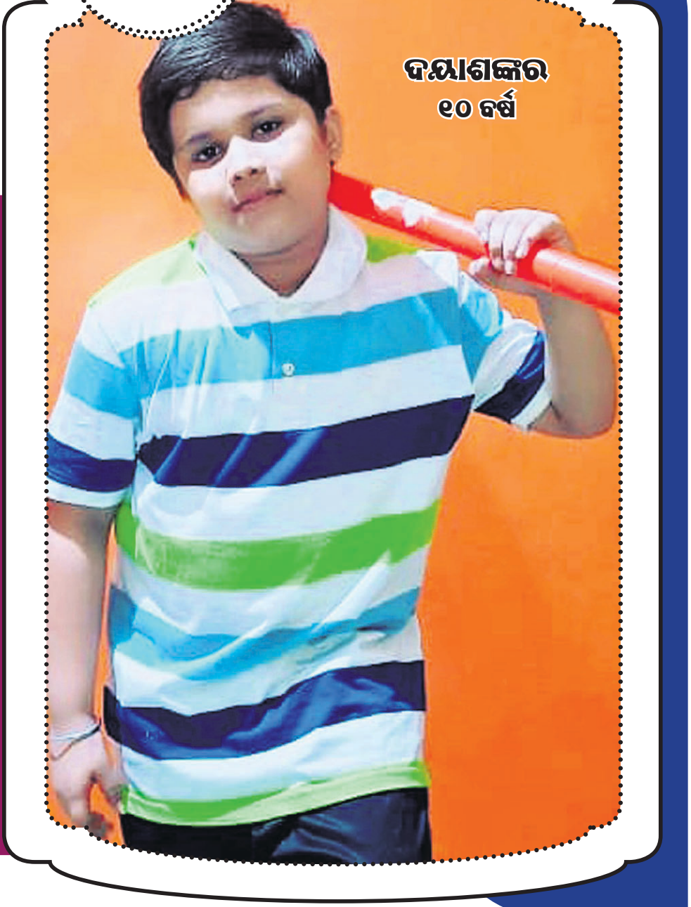
ଦୟାଶଙ୍କର ୧୦ ବର୍ଷ