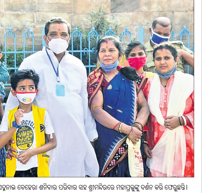
ସଡ଼କ ଓ ପରିବହନ ମନ୍ତ୍ରୀ ପଦ୍ମନାଭ ବେହେରା ଶନିବାର ପରିବାର ସହ ଶ୍ରୀମନ୍ଦିରରେ ମହାପ୍ରଭୁଙ୍କୁ ଦର୍ଶନ କରି ଫେରୁଛନ୍ତି।