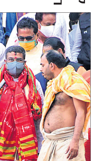
ପୁରୀ ଅଫିସ୍, ୯