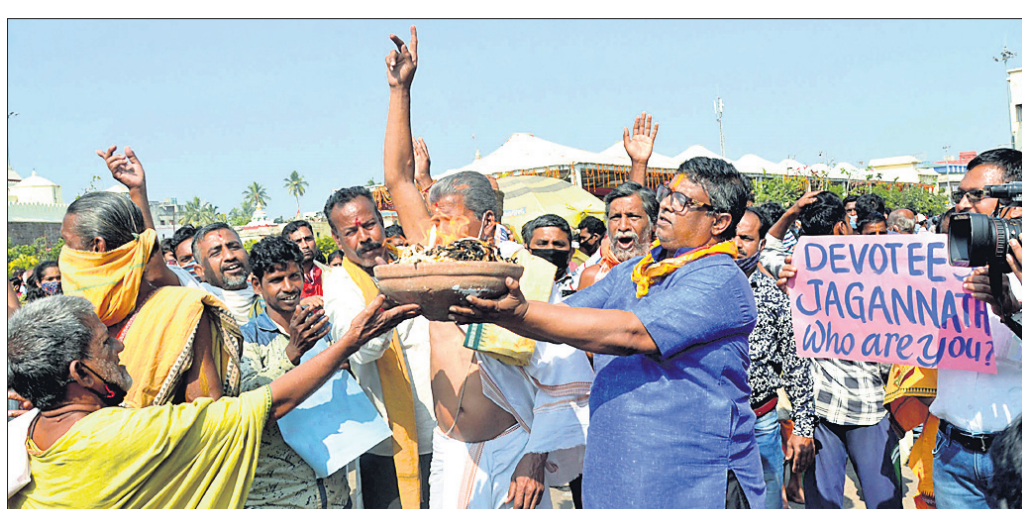
କୋଭିଡ୍ ନେଗେଟିଭ୍ ରିପୋର୍ଟକୁ ବିରୋଧ କରିବା ସହ ବିନା କଟକଣାରେ ଭକ୍ତମାନେ ମହାପ୍ରଭୁ ଶ୍ରୀଜଗନ୍ନାଥଙ୍କୁ ଦର୍ଶନ ପାଇଁ ଅନୁମତି ଦାବି କରି ଜଗନ୍ନାଥ ସେନା ପକ୍ଷରୁ ଶ୍ରୀମନ୍ଦିର ସମ୍ମୁଖରେ ଶନିବାର ଦାମପ୍ରସ୍ତୁତନ କରାଯାଇଛି।