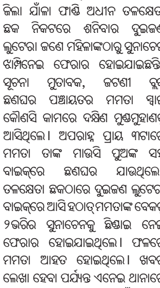
ଗୋପ, ୯ (ବି.ଏନ୍.ଏ.)