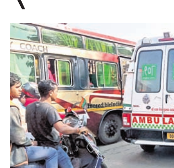
ପୁରୀ, କୋଣାର୍କ ପର୍ଯ୍ୟନ୍ତ ମନ୍ଦିର, ମା' ରାମଚଣ୍ଡୀ ଓ ଚନ୍ଦ୍ରଭାଗା ବୁଲିବାକୁ ପ୍ରତିଦିନ ହଜାରରୁ ଊର୍ଦ୍ଧ୍ୱ ପର୍ଯ୍ୟନ୍ତ ଆୟୁଲାନୁ କେତେକ ବୋକାଳା ରାସ୍ତା ଉପରେ

ପର୍ଯ୍ୟଟନ ରତ୍ନ ଚାଲିବା ସହ କରୋନା କଟକଣା କୋହଳ ପରେ ବିଶ୍ୱ ପ୍ରସିଦ୍ଧ ପୁରୀ, କୋଣାର୍କକୁ ପର୍ଯ୍ୟଟକଙ୍କ ସୁଅ ଛୁଟୁଛି। ହେଲେ ଅଧିକାଂଶ ସମୟ ମୁଖ୍ୟତଃ ଗୋପ ବ୍ଲକ୍‌ରେ ଗୋପ ବଜାରରେ ଗ୍ରାମିକ ସମସ୍ୟା ଦେଖାଦେଉଛି। ଶନିବାର ସକାଳ ୯ଟାରେ ଗ୍ରାମିକ ଜାମ୍ ଯୋଗୁଁ ରୋଗୀ ନେଇ ଯାଉଥିବା ଏକ ୧୦୮ ଆୟୁଲାନୁ ପ୍ରାୟ ୧୮ ମିନିଟ୍ ଧରି ଫର୍ସିଲା ଥିଲା। ଭିଡ଼ିରେ ଥିବା ଗୁହରଖାମାନେ ଅତିକ୍ରମ ଥିବା ଆୟୁଲାନୁକୁ ବହୁ କଷ୍ଟରେ ଗ୍ରାମିକକୁ ବାହାର କରିଥିବା ଦେଖିବାକୁ ମିଳିଥିଲା। ସୁନାଯୋଗ୍ୟ, କରୋନା କଟକଣା କୋହଳ ହୋଇଥିବାରୁ