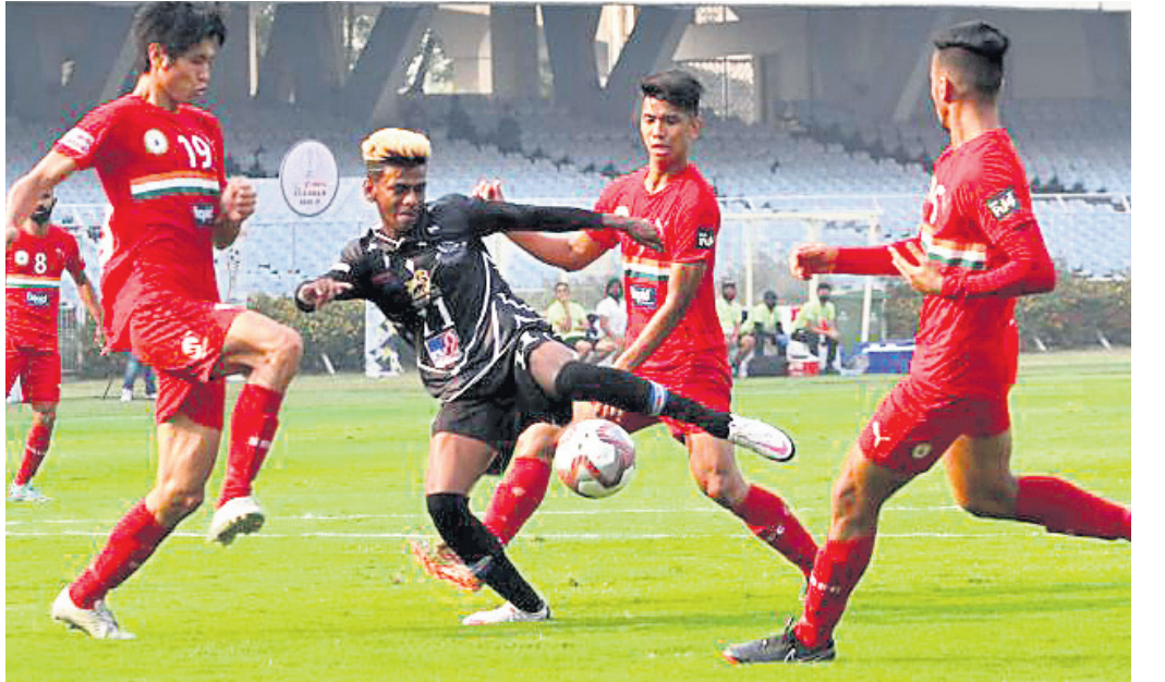
ଶନିବାର ମହମ୍ମଦାନ ସ୍କୋଟିଂ ଓ ସୁଦେବା ଦିଲ୍ଲୀ ଏସ୍ପି ମଧ୍ୟରେ ଅନୁଷ୍ଠିତ ଆଇ-ଲିଗ୍ ମ୍ୟାଚ।