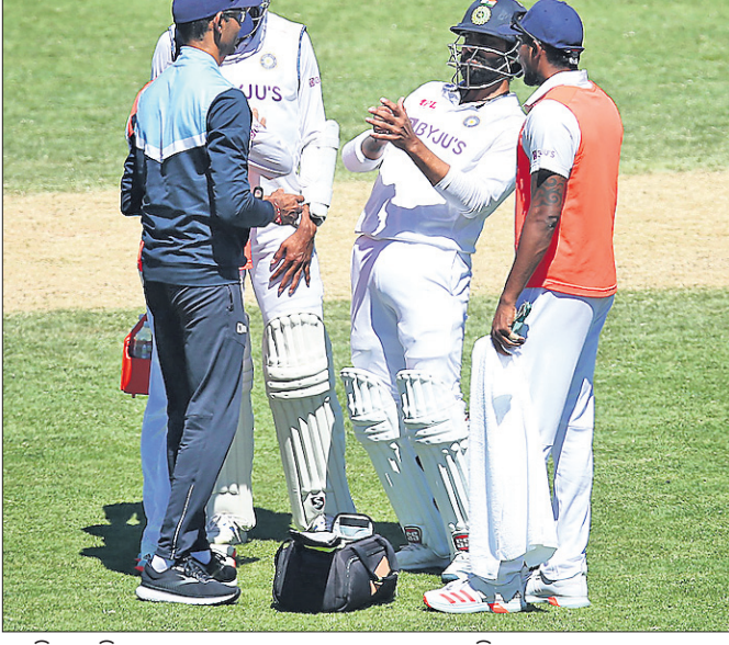
ମେଡିକାଲ୍ ଟିମ୍ ଆହତ ଜାଡେଜାଙ୍କୁ ଅବସ୍ଥା ଯାଞ୍ଚ କରୁଛନ୍ତି।

ଇଞ୍ଜୁରି ସତ୍ତ୍ୱେ ପତ୍ତ ହିତୀୟ ଇନିଂସରେ ବ୍ୟାଟିଂ କରିବେ