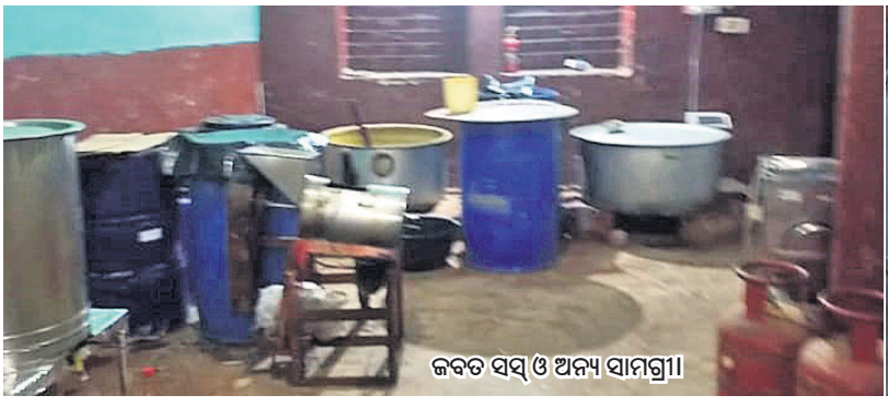
କବଚ ସସ୍ ଓ ଅନ୍ୟ ସାମଗ୍ରୀ

ଯାଜପୁର ଜିଲ୍ଲା ବଡ଼ଚଣା ଥାନା ଅଧୀନ କୁନ୍ଦଳ ଛକରେ ଏକ ବେନାମା ସସ୍ କାରଖାନା ଚାଲୁଥିଲା । ଏହି ଖବର ମିଳିବା ପରେ ଶୁକ୍ରବାର ରାତିରେ ଯାଜପୁର ଏସ୍ପିଓ ଚଳାଚଳ ନେତୃତ୍ୱରେ ଚଢ଼ାଉ କରାଯାଇଥିଲା ।