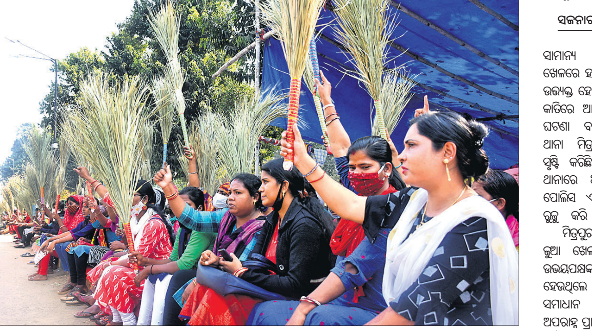
ବାକିର ହରାଇଥିବା କୋଇଲି ୧୯ ସିସିଏଫ୍ ନିୟୁତ୍ରପ୍ରାପ୍ତ ମହିଳା ସାମ୍ମ୍ୟକର୍ମୀ ପୁନଃଅଭିଯାନ ସହ ସ୍ଥାୟୀ ବାକିର ଦାବି କରି ଭୁବନେଶ୍ୱର ଲୋକସଭା ସଭାପତିଙ୍କୁ ଅଭିନନ୍ଦନ ପତ୍ର ପ୍ରଦାନ କରିଥିଲେ ।

ଭଦ୍ରକ ଅଫିସ୍, ୯୧ ଭଦ୍ରକ ଜିଲ୍ଲା ଗାନ୍ଧିନୀ ଶାସନର ଗୋଦାନରେ ଦୁଇଟି ଧାନ ଗୋଦାନ ଘଟଣା ଘଟିଛି ।