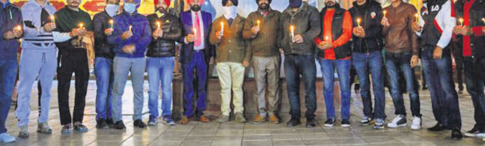
ଆୟୋକନରେ ପ୍ରାଣ ହରାଇଥିବା ଗଣାଙ୍କ ଉଦ୍ଦେଶ୍ୟରେ ଲୋକେ ଅମୃତସର ସ୍ୱର୍ଣ୍ଣ ମନ୍ଦିରଠାରେ କ୍ୟାଣ୍ଡେଲ ଜଳାଇ ଶ୍ରଦ୍ଧାଞ୍ଜଳି ଦେଉଛନ୍ତି।