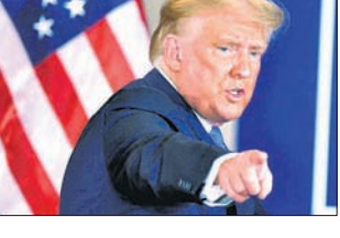
ବାଇଡେନଙ୍କୁ ଉତ୍ତରାଧିକାରୀ ଭାବେ ବ୍ୟାପକ ଅର୍ଥ କାରବାର କରିଥିବା କହି ଟ୍ରମ୍ପ ନିଜ ଛବିକୁ ସୁଦୃଢ଼ କରିବାକୁ ଚାହୁଁଥିଲେ। ଏ ନେଇ ଟ୍ରମ୍ପ ମୁକ୍ତେଶ୍ୱର ରାଷ୍ଟ୍ରପତିଙ୍କ ସହ କଥା ହେବା

ଡ୍ରମ୍ପ ବିରୋଧରେ ମହାଭିଯୋଗ ଆସିଲେ ଆମେରିକାରେ ସେ ଏକ ମାତ୍ର ରାଷ୍ଟ୍ରପତି ହେବେ ଯାହାଙ୍କ ବିରୋଧରେ ବିଚାର ଥର ଏହି ପ୍ରସ୍ତାବ ଆଗତ ହେବ। ୨୦୧୯ରେ ଟ୍ରମ୍ପ ନାମରେ ମହାଭିଯୋଗ ଚାଲିଥିଲା।