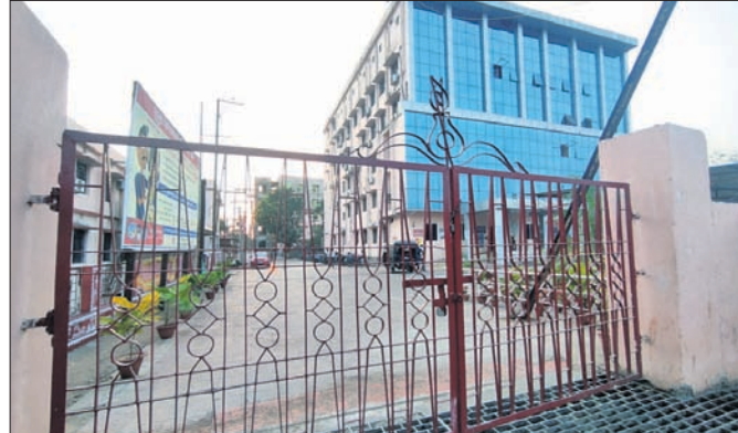
ମେଡିକାଲ ଫାଟକରେ ତାଲା ପଡ଼ିଛି।

ଅନୁରୋଧ ଅର୍ଥେ, ୯୧୧: ଅନୁରୋଧ ଜିଲ୍ଲା ମୁଖ୍ୟ ଚିକିତ୍ସାଳୟ କର୍ତ୍ତୃପକ୍ଷ କାର୍ଯ୍ୟକୁ ନେଇ ପୁଣି ଅସନ୍ତୋଷ ଦେଖାଦେଇଛି। ଶନିବାର ସକାଳୁ ପଞ୍ଚପାର୍ଶ୍ୱ ଗେଟ୍ରେ ତାଲା ପକାଇ ଦିଆଯାଇଥିବାରୁ ରୋଗୀମାନେ ପ୍ରବେଶ ଓ ପ୍ରସ୍ଥାନ ପାଇଁ ଅସୁବିଧାର ସମ୍ମୁଖୀନ ହୋଇଥିବା ଅଭିଯୋଗ ହୋଇଛି। ମରାମତି କାର୍ଯ୍ୟ ଚାଲିଥିବା ମେଡିକାଲ କର୍ତ୍ତୃପକ୍ଷ କହିଥିଲେ ହେଁ କାର୍ଯ୍ୟକ୍ରମ ଚଳୁ ଆସିବା ପୂର୍ବରୁ ସୌଧାର୍ଯ୍ୟକରଣ ପାଇଁ ଏପରି କରାଯାଇଥିବା ରୋଗୀମାନେ ଅଭିଯୋଗ କରିଛନ୍ତି। ରୋଗୀମାନଙ୍କ କହିବା ଅନୁଯାୟୀ, ଅନୁରୋଧ ଜିଲ୍ଲା ମୁଖ୍ୟ ଚିକିତ୍ସାଳୟକୁ କାର୍ଯ୍ୟକ୍ରମ ଚଳୁ ଆସିବା ସମୟରେ ସେମାନଙ୍କ ଆସିବେ। ତେଣୁ ଚଳୁ ସମୟକୁ ଖୁସି କରିବା ପାଇଁ ସୌଧାର୍ଯ୍ୟକରଣ କାର୍ଯ୍ୟ କରାଯାଇଛି। ଏଥିପାଇଁ କର୍ତ୍ତୃପକ୍ଷ