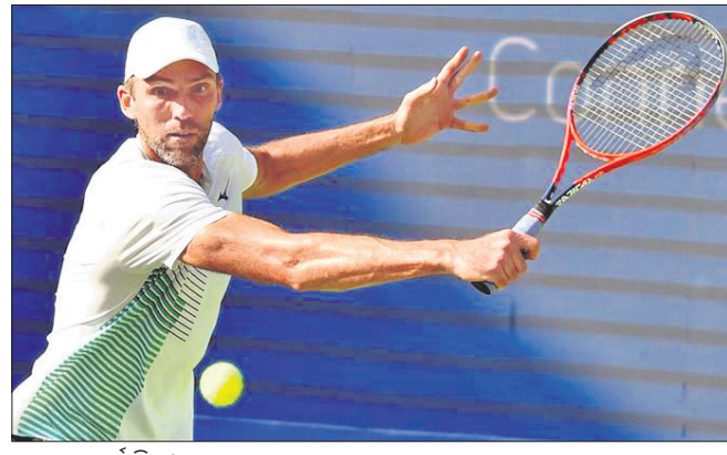
ଭେଇ କାର୍ଲୋଭିଚ୍ । ହେଉଛି ପ୍ରଥମ ବିଜୟ । ପ୍ରତିଯୋଗିତାର ଅନ୍ୟ ମ୍ୟାଚଟୁଡିକ ମଧ୍ୟରେ ୮ମ ସିଡ୍ ଫ୍ରାନ୍ସେସ୍କ ତିଆପୋ ୬-୩, ୬-୪ ସେଟ୍‌ରେ ଆମେରିକା ଡୋନାଲ୍ଡ ୬-୩ ସେଟ୍‌ରେ ବିଜୟ ହାସଲ କରିଛନ୍ତି ।

ପରିଶେଷରେ ସବୁଠାରୁ ବୟସ୍କ ଖେଳାଳି ହିସାବରେ ଏକ ଏଟିପି ଟୁର୍ ମ୍ୟାଚ ଜିତିବାର ଗୌରବ ଅର୍ଜନ କରିଛନ୍ତି କ୍ୟାପ୍ଟିଭ ଆର ଭେଇ କାର୍ଲୋଭିଚ୍ । ଡେଲହାଉସ ଟେନିସ ଟୁର୍ନାମେଣ୍ଟରେ ସେ ୨ମ ସିଡ୍ ସ୍ଥାନରେ ପାଉଁଶ ଆଣୁଥିବାବେଳେ ୭-୬, ୬-୪ ସେଟ୍‌ରେ ହରାଇ ଦେଇଛନ୍ତି । ଆସନ୍ତା ମାସରେ ୪୨ ବର୍ଷ ବୟସରେ ପଦାର୍ପଣ କରିବାକୁ ଥିବା କାର୍ଲୋଭିଚ୍ ୧୯୯୫ରେ ଜିମ୍ କର୍ଣ୍ଣର ପରେ ସବୁଠାରୁ ବୟସ୍କ ଖେଳାଳି ହିସାବରେ ଏକ ଟ୍ୟୁରୁଣ୍ଟ ଟୁର୍ ମ୍ୟାଚ ଜିତିଛନ୍ତି । କର୍ଣ୍ଣର ବୟସ ସେତେବେଳେ ୪୨ ବର୍ଷ ହୋଇଥିଲା । ଗତ ଫେବୃୟାରୀ ପରେ ଭେଟେରାନ କାର୍ଲୋଭିଚ୍‌ଙ୍କର ଏହା