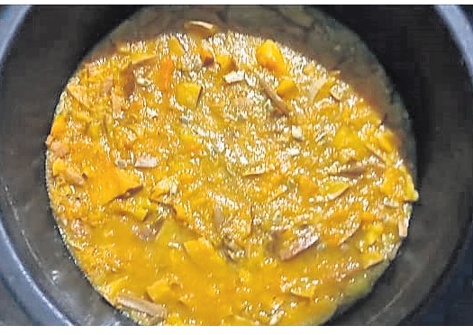
ସସ୍ ପ୍ରସ୍ତୁତ ସସ୍ ନମୁନା ପରୀକ୍ଷା ପାଇଁ