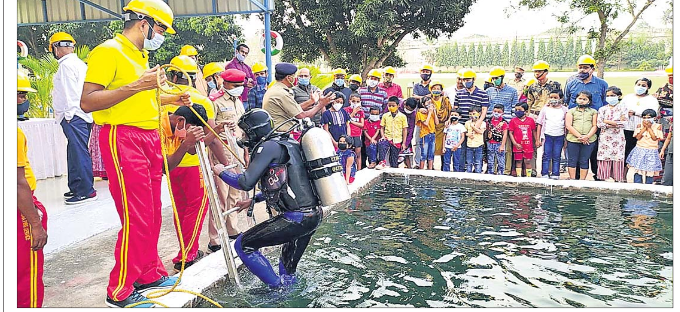
ଭୁବନେଶ୍ୱର ବରପୁଷ୍ପାସ୍ଥିତ ଓଏପ୍‌ଆର୍କ ପାଞ୍ଚର ପାର୍କର ଶନିବାର ରେସକ୍ସି ଅପରେଶନ ଉପରେ ପିଲାମାନଙ୍କୁ ଅଭିମୁଖ କର୍ମଚାରୀମାନେ ସଚେତନ କରୁଛନ୍ତି ।