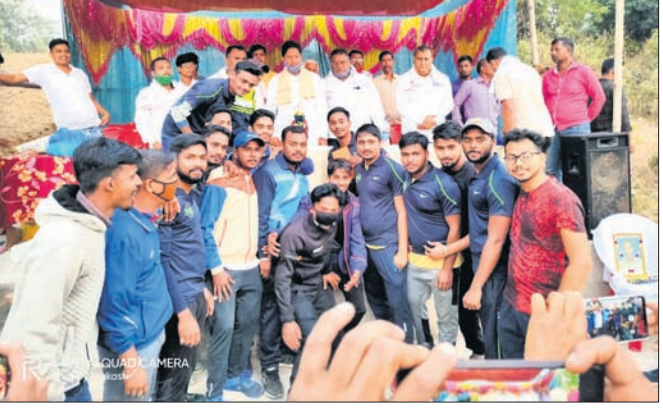
ଅତିଥିଙ୍କ ଗହଣରେ ଚାମ୍ପିୟନ ଦଳର ଖେଳାଳିମାନେ।