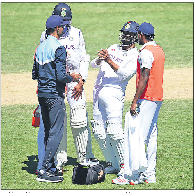
ମେଡିକାଲ ଟିମ୍ ଆହତ ଜାଡେଜାଙ୍କୁ ଅବସ୍ଥା ଯାଞ୍ଚ କରୁଛନ୍ତି।

ଇଞ୍ଜୁରି ସତ୍ତ୍ୱେ ପତ୍ତ ହିତୀୟ ଇନିଂସରେ ବ୍ୟାଟିଂ କରିବେ