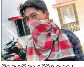
ରାଜ୍ୟ ଅଭିଯୁକ୍ତ ଅଭିନେତା ନାୟକ ।

୩ ବର୍ଷର ଶିଶୁପୁତ୍ରକୁ ଅପ୍ରାକୃତିକ ଯୌନ ନିର୍ଯାତନା ଦେବା ଅଭିଯୋଗରେ ବଲାଙ୍ଗୀର ଗଞ୍ଜ ଥାନା ପୋଲିସ୍ ଜଣେ ମୂରକକୁ ଚିରଫ କରିଛି ।