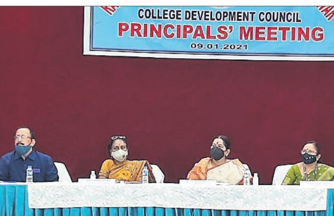
ଭୁବନେଶ୍ୱର, ୯୧ (ସ୍ୱା.ସେ.)

ରମାଦେବୀ ମହିଳା ବିଶ୍ୱବିଦ୍ୟାଳୟ ସହ ଅନୁବନ୍ଧିତ ସମଗ୍ର ମହାବିଦ୍ୟାଳୟ ଅଧିକାରୀ ବୈଠକ ଶନିବାର ଅନୁଷ୍ଠିତ ହୋଇଯାଇଛି ।