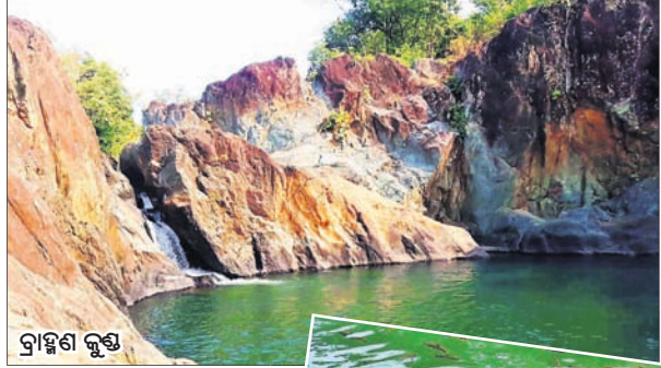
ପର୍ଯ୍ୟଟନସ୍ଥଳୀ ବ୍ରାହ୍ମଣ କୁଣ୍ଡ

ମୟୂରଭଞ୍ଜ ଜିଲ୍ଲା ଶିମିଳିପାଳ ନିକଟରେ ଥିବା ବ୍ରାହ୍ମଣ କୁଣ୍ଡ ପ୍ରକୃତିକ ସୁନ୍ଦରତା ପାଇଁ ପର୍ଯ୍ୟଟନସ୍ଥଳୀ ଭାବେ ଖ୍ୟାତି ଅର୍ଜନ କରିଛି । ଏହା ଛଡ଼ା ଏହାର ପାଣି ଚାଷୀଙ୍କୁ ମଧ୍ୟ ଉପଯୋଗୀ ହେଉଛି ।