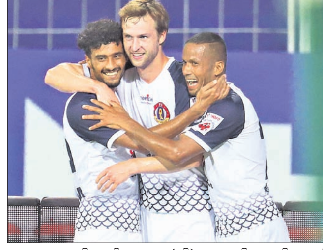
ଗୋଲ ସ୍କୋର ପରେ ଭିଲେ ମାଟି ସ୍ଟେଡିୟମ୍‌ରେ (ମଧ୍ୟ) ସାଥୀ ଖେଳାଳିଙ୍କ ସହ ଖୁସି ମନାଉଛନ୍ତି ।

ଇଣ୍ଡିଆନ ସୁପର ଲିଗ୍ (ଆଇଏସ୍‌ଏଲ୍)ରେ ଶନିବାର ଖେଳାଯାଇଥିବା ମ୍ୟାଚରେ ଇଷ୍ଟ ବେଙ୍ଗାଳ ୧-୦ ଗୋଲରେ ବେଙ୍ଗାଳୁରୁ ଏସ୍‌ପିଏଲ୍ ପରାସ୍ତ କରିଛି । ସ୍ଥାନୀୟ ଫାଗୋଡ଼ା ସ୍ଵାଗତମଣ୍ଡଳ ଅନୁଷ୍ଠିତ ଏହି ମ୍ୟାଚରେ ବେଙ୍ଗାଳୁରୁ ଆଶାଦ୍ୱାରୀ