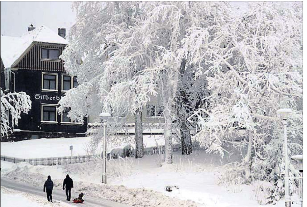
ଜର୍ମାନୀର ବ୍ରେଗେନ୍ସର ସହରର ଲୋକେ ବରଫାଚ୍ଛନ୍ନ ରାସ୍ତାରେ ଯାତାୟତ କରୁଛନ୍ତି।