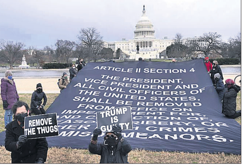
ରାଷ୍ଟ୍ରପତି ଡୋନାଲ୍ଡ ଟ୍ରମ୍ପ ଚୁରଟ ଗାଦି ଛାଡ଼ନ୍ତୁ! କ୍ୟାପିଟୋଲ ନିକଟରେ ଗୋଟିଏ ଗୋଷ୍ଠୀ ବିଶାଳ ବ୍ୟାନର ଧରି ଆହ୍ୱାନ ଦେଉଛନ୍ତି।

ସରା ଲୋଭରେ ସାମା ଚପିଛନ୍ତି ଡୋନାଲ୍ଡ ଟ୍ରମ୍ପ ଆମେରିକା ଇତିହାସରେ କଳଙ୍କିତ ଅଧ୍ୟାୟ ସୃଷ୍ଟିର ଖଳନାୟକ ଆଖ୍ୟା ପାଇସାରିବା ପରେ ବି ବଦଳୁନି ତାଙ୍କ ମାନସିକତା।