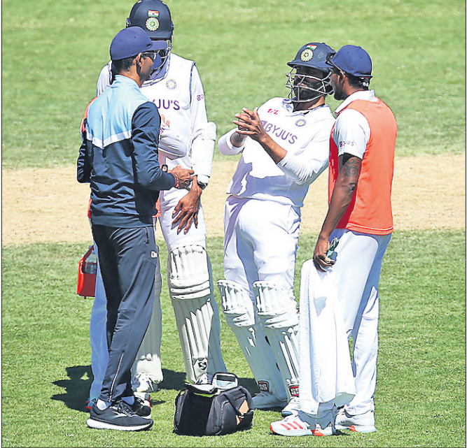
ମେଡିକାଲ୍ ଟିମ୍ ଆହତ ଜାଡେଜାଙ୍କୁ ଅବସ୍ଥା ଯାଞ୍ଚ କରୁଛନ୍ତି।

ଇଞ୍ଜୁରି ସତ୍ତ୍ୱେ ପଢ଼ ଦ୍ୱିତୀୟ ଇନିଂସରେ ବ୍ୟାଟିଂ କରିବେ