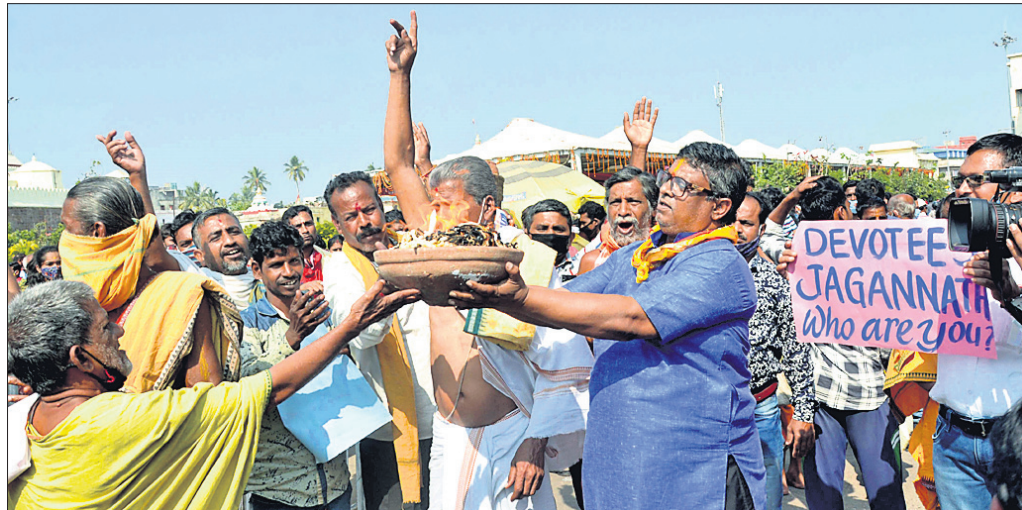
କୋଭିଡ଼ ନେଗେଟିଭ୍ ରିପୋର୍ଟକୁ ବିରୋଧ କରିବା ସହ ବିନା କଟକଣାରେ ଭକ୍ତମାନେ ମହାପ୍ରଭୁ ଶ୍ରୀଜଗନ୍ନାଥଙ୍କୁ ଦର୍ଶନ ପାଇଁ ଅନୁମତି ଦାବି କରି ଜଗନ୍ନାଥ ସେନା ପକ୍ଷରୁ ଶ୍ରୀମନ୍ଦିର ସମ୍ମୁଖରେ ଶନିବାର ଦୀପପ୍ରସ୍ତୁତନ କରାଯାଇଛି।

ଭୁବନେଶ୍ୱର, ୯ (ବ୍ୟବହାର) ହୋଇଥିଲେ। ୧୦ଦିନ କିପରି ପାଠପଢ଼ା ହୋଇପାରିବ ସେଥିପାଇଁ ମାନସିକ ସ୍ତରରେ ପ୍ରସ୍ତୁତ ରହିବା ପାଇଁ ସଚିବ ଶିକ୍ଷକମାନଙ୍କୁ ପ୍ରୋତ୍ସାହନ ଦେଇଥିଲେ। ସେ କହିଥିଲେ ଯେ, କରୋନାକୁ ନେଇ ପିଲାଙ୍କ ଭିତରେ ଯେଉଁ ଭୟ ରହିଛି ତାକୁ ଦୂର କରିବା ପାଇଁ ପିଲାଙ୍କ ସହିତ କଥା ହୁଅନ୍ତୁ। ୭୦ପ୍ରତିଶତ ପାଠ୍ୟକ୍ରମରେ ପରୀକ୍ଷା ହେବ ବୋଲି ପିଲାଙ୍କୁ ଅବଗତ କରାଇବା ସହିତ ସେମାନେ ପରୀକ୍ଷାକୁ ନେଇ ଯେପରି ଭୟ ନ କରନ୍ତି ସେନେଇ ସଚେତନ କରିବାକୁ ଶିକ୍ଷକଙ୍କୁ ପରାମର୍ଶ ଦେଇଥିଲେ। ଦୀର୍ଘଦିନ ପରେ ସ୍କୁଲକୁ ଫେରି ପିଲାମାନେ କିପରି ଅନୁଭବ କରୁଛନ୍ତି ସେ ସମ୍ପର୍କରେ ସଚିବ ରାୟ, ଶିକ୍ଷକ ଓ ପିଲାଙ୍କ ସହିତ କଥା