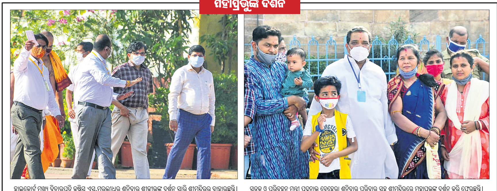
ହାଇକୋର୍ଟ ମୁଖ୍ୟ ବିଚାରପତି କଣ୍ଠସ୍ୱୟ ଏସ୍.ପୁରୁଲୀଧର ଶନିବାର ଶ୍ରୀଜଗନ୍ନାଥଙ୍କୁ ଦର୍ଶନ ସାରି ଶ୍ରୀମନ୍ଦିରକୁ ବାହାରିଛନ୍ତି। ସତ୍ତ୍ୱେ ଓ ପରିବହନ ମନ୍ତ୍ରୀ ପଦ୍ମନାଭ ବେହେରା ଶନିବାର ପରିବାର ସହ ଶ୍ରୀମନ୍ଦିରରେ ମହାପ୍ରଭୁଙ୍କୁ ଦର୍ଶନ କରି ଫେରୁଛନ୍ତି।