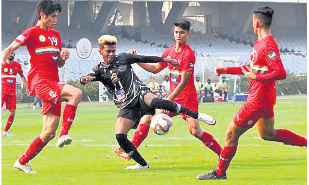
ଶନିବାର ମହମ୍ମଦାନ ସ୍କୋଟିଂ ଓ ସୁଦେବା ଦିଲ୍ଲୀ ଏସ୍ପି ମଧ୍ୟରେ ଅନୁଷ୍ଠିତ ଆଇ-ଲିଗ୍ ମ୍ୟାଚ।

କିଛି ଡାହା ପୂର୍ବରୁମାନ କରିହେଉ ନ ଥିଲା। ପ୍ରଥମାର୍ଦ୍ଧ ଖେଳରେ ଉଭୟ ଦଳ ଆକ୍ରମଣାତ୍ମକ ନ ଖେଳି ପରସ୍ପରର ଦୋଷ ଦୁର୍ବଳତା ଖୋଜି ବାହାର କରିବାକୁ ଚାହୁଁଥିଲେ। ସୁଦେବା ଦିଲ୍ଲୀ ଏସ୍ପି ଜାତୀୟ ରାଜଧାନୀର ପ୍ରଥମ ଦଳ ଭାବେ ଆଇ-ଲିଗ୍ ଖେଳୁଛି। ଏହାର ସମସ୍ତ ଖେଳାଳି ହେଉଛନ୍ତି ଭାରତୀୟ। ଏହି ଦଳ ଲକ୍ଷ୍ ବଲ୍ ଦ୍ୱାରା ମହମ୍ମଦାନ ସ୍କୋଟିଂ ରକ୍ଷଣାଭାବ ଭେଦ କରିବାକୁ ପ୍ରୟାସ କରିଥିଲା।