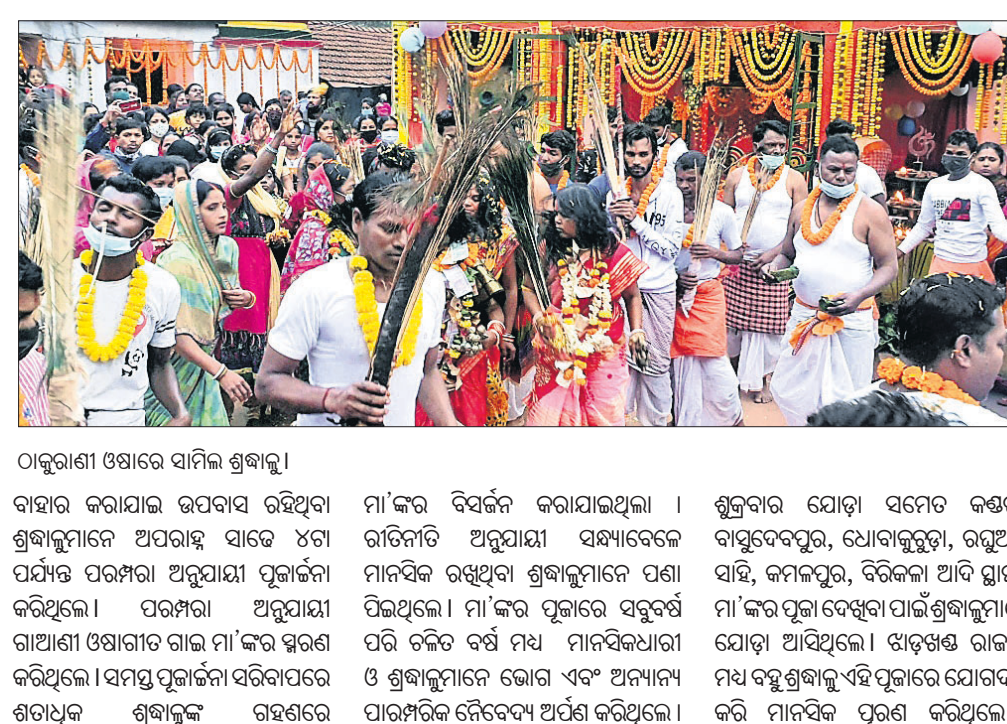
ଠାକୁରାଣୀ ଓଷାରେ ସାମିଲ ଶ୍ରଦ୍ଧାଳୁ ।