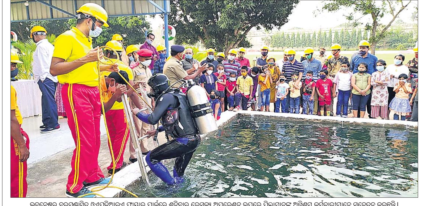
ଭୁବନେଶ୍ୱର ବରପୁଷ୍ପାସ୍ଥିତ ଓଏପିଆର୍ଏଫ ପାୟାର ପାର୍କର ଶନିବାର ରେସକ୍ସ ଅପରେଶନ ଉପରେ ପିଲାମାନଙ୍କୁ ଅଭିମୁଖ କର୍ମଚାରୀମାନେ ସଚେତନ କରୁଛନ୍ତି ।