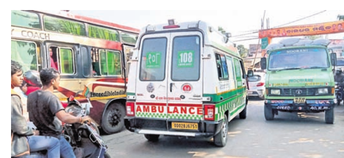
ପୁରୀ, କୋଣାର୍କ ପର୍ଯ୍ୟନ୍ତ ମନ୍ଦିର, ମା' ରାମଚଣ୍ଡୀ ଓ ଚନ୍ଦ୍ରଭାଗା ବୁଲିବାକୁ ପ୍ରତିଦିନ ହଜାରରୁ ଊର୍ଦ୍ଧ୍ୱ ପର୍ଯ୍ୟନ୍ତ ଆୟୁଲାର୍ସ ଗୋପ ବଜାରରେ କବରଦଖଳ ସାଜାକୁ କେତେକ ବୋକାଳା ରାତ୍ରି ଉପରେ

ପର୍ଯ୍ୟଟନ ରତ୍ନ ଚାଲିବା ସହ କରୋନା କଟକଣା କୋହଳ ପରେ ବିଶ୍ୱ ପ୍ରସିଦ୍ଧ ପୁରୀ, କୋଣାର୍କକୁ ପର୍ଯ୍ୟଟକଙ୍କ ସୁଅ ଛୁଟୁଛି। ହେଲେ ଅଧିକାଂଶ ସମୟ ମୁଖ୍ୟତଃ ଗୋପ ବ୍ଲକ୍ରେ ଗୋପ ବଜାରରେ ଗ୍ରାମିକ ସମସ୍ୟା ଦେଖାଦେଉଛି। ଶନିବାର ସକାଳ ୯ଟାରେ ଗ୍ରାମିକ ଜାମ୍ ଯୋଗୁଁ ରୋଗୀ ନେଇ ଯାଉଥିବା ଏକ ୧୦୮ ଆୟୁଲାର୍ସ ପ୍ରାୟ ୧୮ ମିନିଟ୍ ଧରି ଫର୍ସିଲା ଥିଲା। ଭିତ୍ତିରେ ଥିବା ଗୁହରଖାମାନେ ଅତିକ୍ରମ କରି ଥିବା ଆୟୁଲାର୍ସକୁ ମମତା ଆହତ ହୋଇଥିଲେ। ଖବର ଲେଖା ହେବା ପର୍ଯ୍ୟନ୍ତ ଏନେଇ ଆନାରେ କୌଣସି ଅଭିଯୋଗ ହୋଇନାହିଁ।