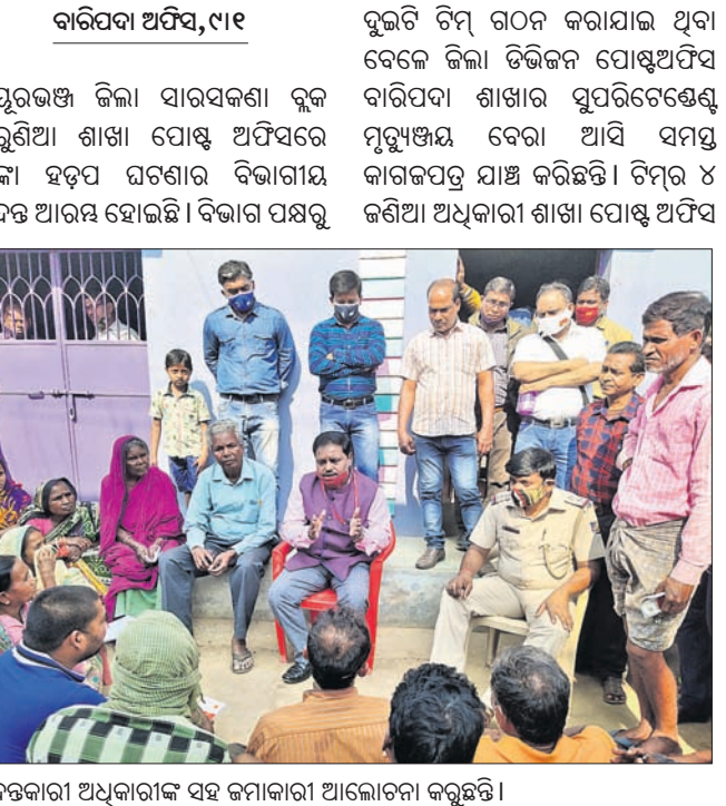
ତଦନ୍ତକାରୀ ଅଧିକାରୀଙ୍କ ସହ ଜମାକାରୀ ଆଲୋଚନା କରୁଛନ୍ତି ।