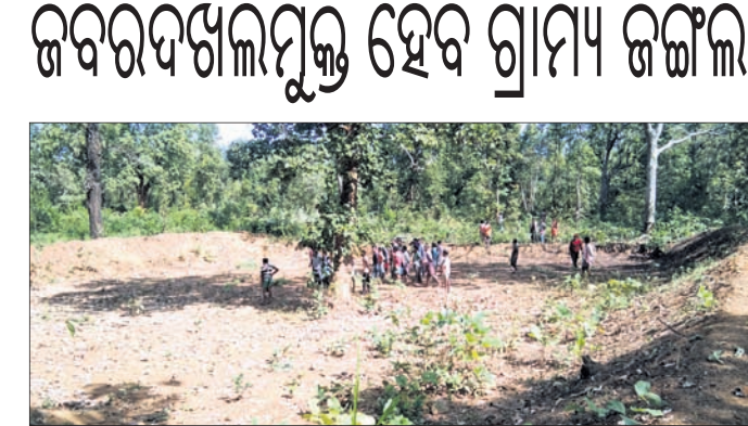
ଜଙ୍ଗଲ ଜମି ଚିହ୍ନଟ କରାଯାଇଛି ।