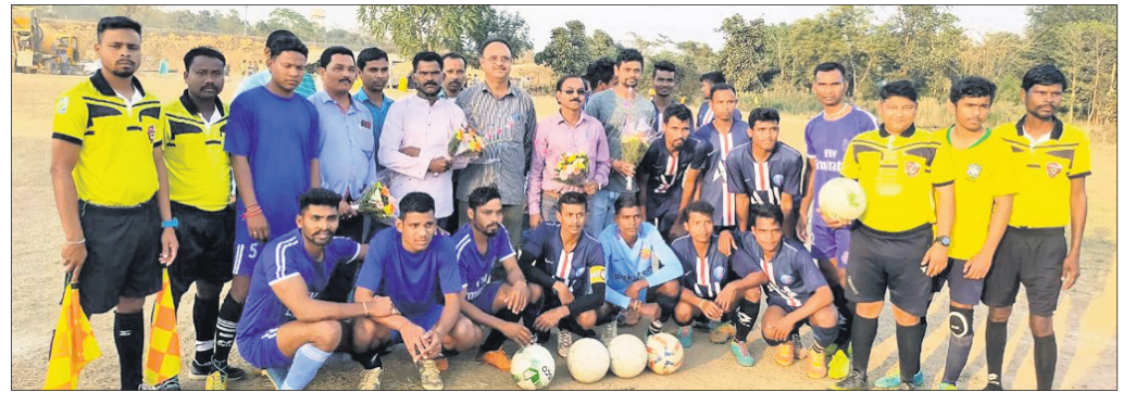
ଅତିଥିକ ଗହଣରେ ଚାମ୍ପିୟନ, ରତ୍ନ ଅଫ୍ ଦକ୍ଷିଣ ଖେଳାଳିବୃନ୍ଦ ।

ବରଗଡ଼ ଅଫିସ୍, ୧୦୧୧ ବରଗଡ଼ ବ୍ଲକ୍ ଅନ୍ତର୍ଗତ ଖୁଣ୍ଟପାଲି ବ୍ଲକ୍ରେ ଚାଲିଥିବା ନେହେରୁ କପ୍ ପୁଟବଲ ପ୍ରତିଯୋଗିତା ରବିବାର ଉଦ୍ଘାଟିତ ହୋଇଛି । ଉକ୍ତ ପ୍ରତିଯୋଗିତାର ପାଇକନାଳରେ ପୁରୁରୁପାଲି ପ୍ରତିପକ୍ଷ