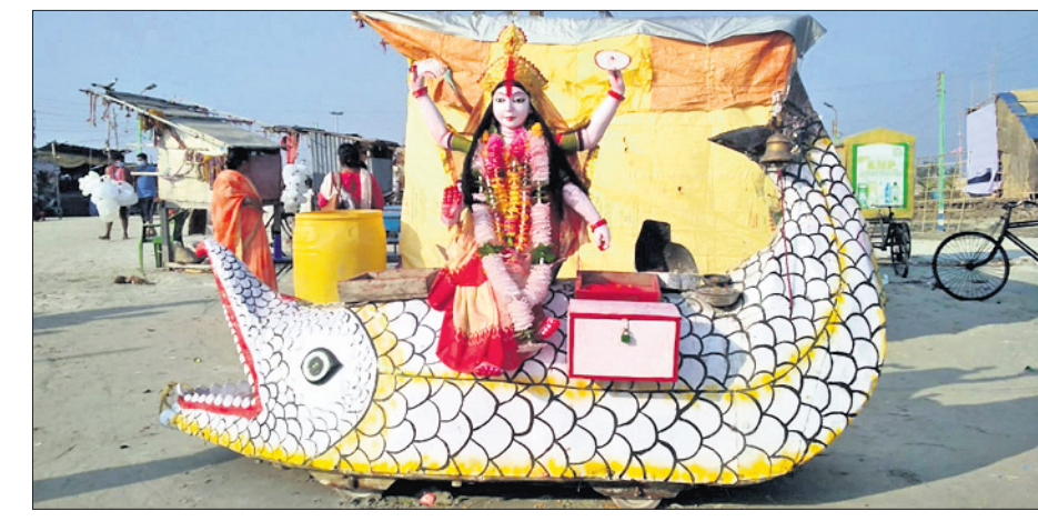
ଗଙ୍ଗାସାଗରରେ ମା' ଗଙ୍ଗାଙ୍କ ପ୍ରତିମା।