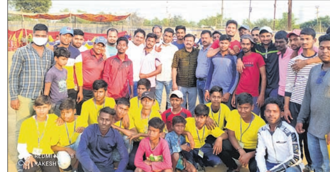
ଖେଳାଳିଙ୍କ ରହଣରେ ଅତିଥିମାନେ ।

ବ୍ରଜରାଜନଗର, ୧୦।୧ (ଡି.ଏନ୍.ଏ.): ଗ୍ଲାମାୟ ମଙ୍ଗଳା ମନ୍ଦିର କ୍ରିକେଟ ପଡ଼ିଆରେ ଚାଲିଥିବା ପ୍ରଥମ ବ୍ୟାଲେଞ୍ଜି କପ୍ କ୍ରିକେଟ ପ୍ରତିଯୋଗିତାରେ ରାୟଚୁଡ଼କୁ ହରାଇ ଡାକମଣ୍ଡ ଏକାଦଶ ଚାମ୍ପିୟନ ହୋଇଛି । ୧୬ ଗୋଟି ଦଳକୁ ନେଇ ପ୍ରତିଯୋଗିତା ଆରମ୍ଭ ହୋଇଥିଲା । ଶେଷରେ ରାୟଚୁଡ଼ ଓ ଡାକମଣ୍ଡ ଏକାଦଶ ଫାଇନାଲ ଖେଳିଥିଲେ । ଡାକମଣ୍ଡ ଏକାଦଶ ନିର୍ଦ୍ଧାରିତ ଓଭରରେ ୬ ଉଇକେଟ ବିନିମୟରେ ୮୪ ରନ କରିଥିଲା । ଜବାବରେ ରାୟଚୁଡ଼ ସମସ୍ତ ଉଇକେଟ ହରାଇ ୭୫ ରନ କରିଥିଲା ।