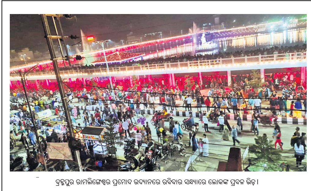
ବ୍ରହ୍ମପୁର ରାମଲିଙ୍ଗେଶ୍ୱର ପ୍ରମୋଦ ଭବନୀନରେ ରବିବାର ସନ୍ଧ୍ୟାରେ ଲୋକଙ୍କ ପ୍ରବଳ ଭିଡ଼।