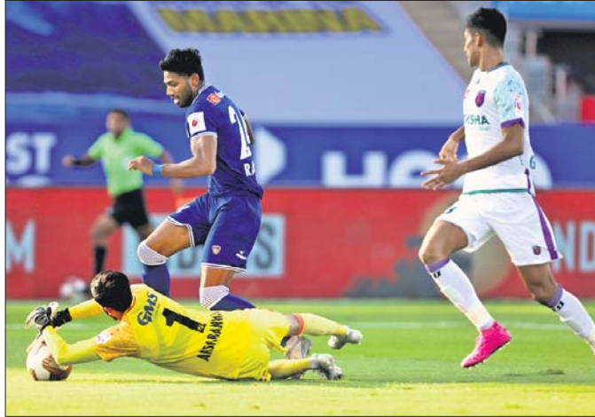
ଓଡ଼ିଶା ଏଫସି ଓ ଚେନ୍ନାଇନ୍ ମଧ୍ୟରେ ଅନୁଷ୍ଠିତ ମ୍ୟାଚ ।

ବାଲେଶିଳା, ୧୦।୧ ଭକ୍ତିଆନ ସୁପରଲିଗ୍ (ଆଇଏସଏଲ)ରେ ରବିବାର ଅନୁଷ୍ଠିତ ଓଡ଼ିଶା ଏଫସି-ଚେନ୍ନାଇନ୍ ମ୍ୟାଚ ଶୂନ୍ୟ ଡ୍ର ରହିଛି। ଉଭୟ ଦଳ ଏକାଧିକ ସୁଯୋଗ ହାତଛଡ଼ା କରିବାରୁ ପଏଣ୍ଟ ଭାଗ କରିବାକୁ ବାଧ୍ୟ ହୋଇଛନ୍ତି। ୧୦ ମ୍ୟାଚରୁ ୧ ବିଜୟ,