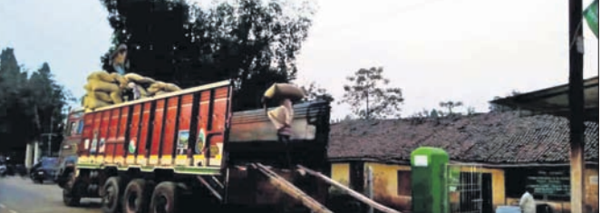
ମଣି ସମ୍ପର୍କରେ ଗ୍ରହଣ ଧାନ ଲୋଡ଼ କରାଯାଇଛି।

ପାଇକହତ୍ୟା, ୧୧।୧ (ଡି.ଏନ.ଏ.): ପାଇକହତ୍ୟା ବ୍ଲକ୍ ନିକଟରୁ ସେବା ସମବାୟ ସମିତିଠାରେ ଖୋଲା ଯାଇଥିବା ଧାନ ମଣିରେ ସୋମବାର ଦୁର୍ଭିକ୍ଷ ଘଟିଛି। ଚାଷୀମାନେ ଧାନ ବିକ୍ରି କରିବା ପାଇଁ ଛିଡା ହୋଇଥିବାବେଳେ ମଣି ଉପର ବେଜ ଯାଇଥିବା ଏକ ୧୧ କେ.ଭି. ବିଦ୍ୟୁତ୍ ତାର ହଠାତ୍ ଛିଣ୍ଡି ପଡ଼ିଥିଲା। ଫଳରେ ସେଠାରେ ଉପସ୍ଥିତ ମଣି କର୍ମଚାରୀ ଏବଂ କେତେଜଣ ଚାଷୀ ଆଘାତଗ୍ରସ୍ତ ହୋଇଛନ୍ତି। ଏ ନେଇ ଅନୁଗୋଳ ସରକାରଙ୍କୁ ଜଣାପଡ଼ିଛି। ଏ ନେଇ ସୋପାନିତ ସମ୍ପାଦକ ସ୍ଥାନୀୟ