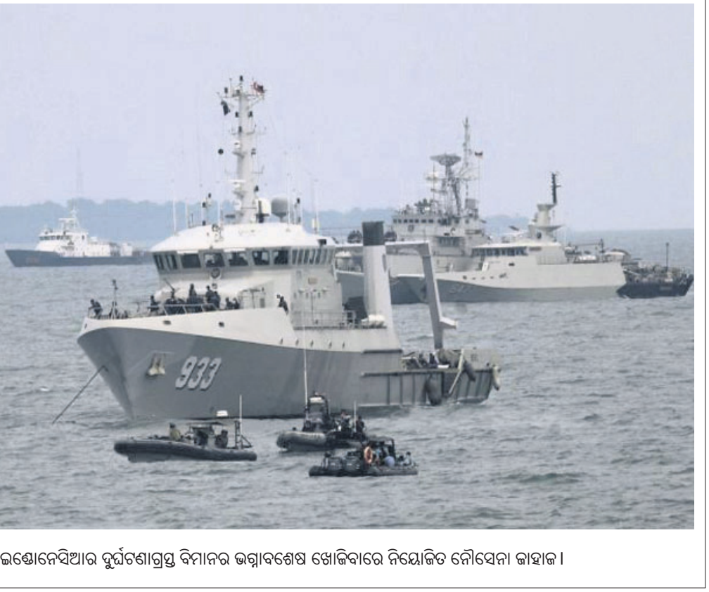
ଇଣ୍ଡୋନେସିଆର ଦୁର୍ଘଟଣାଗ୍ରସ୍ତ ବିମାନର ଭଗ୍ନାବଶେଷ ଖୋଜିବାରେ ନିଯୋଜିତ ନୌସେନା ଜାହାଜ।