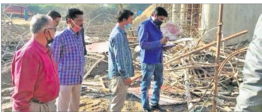
ଅଧିକାରୀମାନେ ଘଟଣାସ୍ଥଳରେ ପହଞ୍ଚି ଚଢ଼ାଉ କରୁଛନ୍ତି।