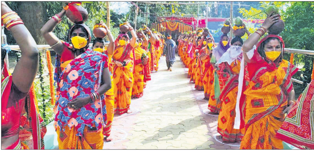
କଳସ ଶୋଭାଯାତ୍ରାରେ ମହିଳା ଶ୍ରଦ୍ଧାଳୁମାନେ।

ଦେଢ଼ାମାଲ ଅଫିସ, ୧୧।୧: ଦେଢ଼ାମାଲ ଜିଲ୍ଲା ଓଡ଼ାପଡ଼ା ବ୍ଲକ୍ ନାଥରାମ ଅଧିଷ୍ଠାତ୍ରୀ ଦେବୀ ମା' ରାମଚଣ୍ଡୀଙ୍କ ପୀଠରେ ବିଷ୍ଣୁ କଲ୍ୟାଣ ନିମନ୍ତେ ସୋମବାରଠାରୁ ଆରମ୍ଭ ହୋଇଛି ଶ୍ରୀବିଷ୍ଣୁ ମହାଯଜ୍ଞ। ଏହି ଉପଲକ୍ଷେ ବ୍ରାହ୍ମଣୀ ନଦୀ କୂଳରୁ ପୂଜାର୍ଚ୍ଚନା କରି ଶତାଧିକ ମହିଳା ଶ୍ରଦ୍ଧାଳୁ ଶୋଭାଯାତ୍ରାରେ ଜଳପୂର୍ଣ୍ଣ କଳସ ଆଣି ମଣ୍ଡପରେ ସ୍ଥାପନ କରିଥିଲେ। କମିଟି ପକ୍ଷରୁ କୋଭିଡ୍ ନିୟମ ଆଧାରରେ ସମସ୍ତ କାର୍ଯ୍ୟକ୍ରମ ଆୟୋଜିତ ହୋଇଥିଲା। ମଙ୍ଗଳବାର ମଧ୍ୟାହ୍ନ ୧୨ଟାରେ ପ୍ରାରମ୍ଭିକ ସଜ୍ଜା ସମ୍ପାଦନା, ସୂର୍ଯ୍ୟପୂଜା, ଗୋପୂଜା, ପଞ୍ଚାମୃତ, ଶ୍ରୀ ଗୋକନକେଶ୍ୱର ମହାଦେବଙ୍କ ରୁଦ୍ରାଭିଷେକ, ଶୋକ୍ଷ ଉପଚାର ଅନୁଷ୍ଠିତ ହେବ। ୧୩ ତାରିଖରେ ସୂର୍ଯ୍ୟପୂଜା, ଶନି ମହାରାଜଙ୍କ ଅଭିଷେକ, ସିନ୍ଧୁ ବିନାୟକଙ୍କ ଶୋକ୍ଷ ଉପଚାର ପୂଜା କରାଯିବ। ୧୪ ତାରିଖ ମକର ସଂକ୍ରାନ୍ତିରେ ମହାସଞ୍ଜର ପୂର୍ଣ୍ଣସ୍ମୃତି କାର୍ଯ୍ୟକ୍ରମ ରହିଛି।