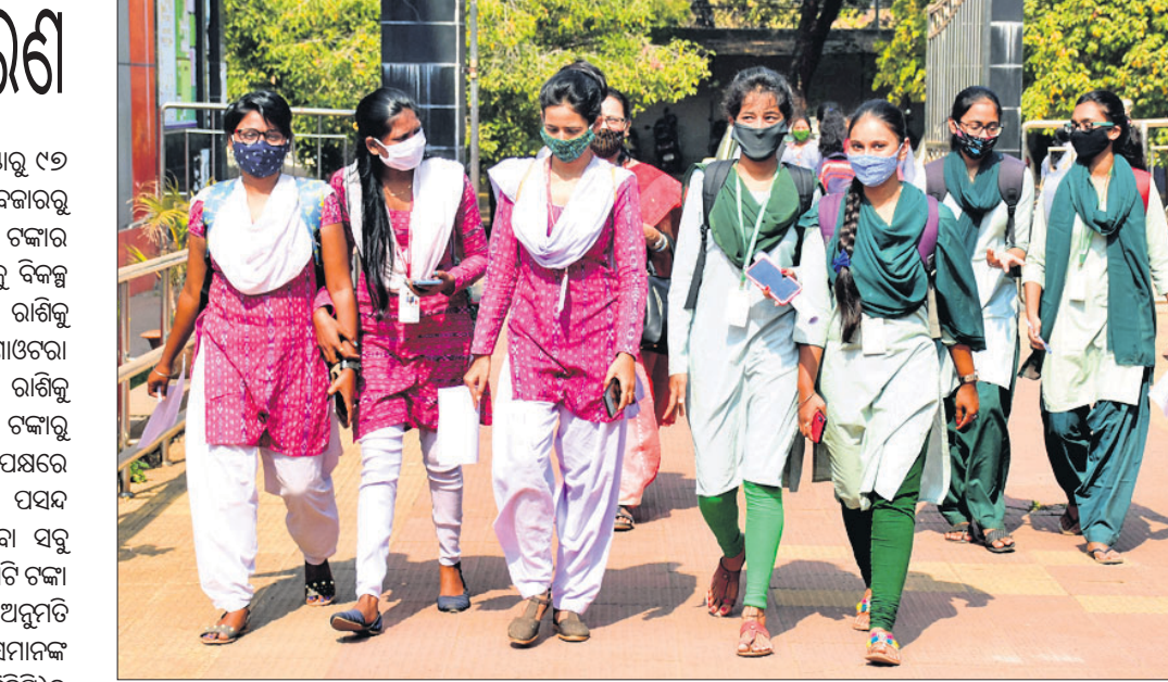
କରୋନା ପାଇଁ ଦୀର୍ଘ ୯ ମାସ ପରେ ସୋମବାର ଉଚ୍ଚ ଶିକ୍ଷାନୁଷ୍ଠାନ ଖୋଲିଛି। ଭୁବନେଶ୍ୱରସ୍ଥିତ ରମାଦେବୀ ମହିଳା ମହାବିଦ୍ୟାଳୟର ପିଠି ଏବଂ ସୁସ୍ଥ ୩ ଶ୍ରେଣୀ ଛାତ୍ରୀମାନେ ଶ୍ରେଣୀଗୁଡ଼ିକୁ ଅଭିମୁଖେ ଯାଉଛନ୍ତି।

ଦେଇଥିଲେ। ରିଜର୍ଭ ବ୍ୟାଙ୍କ ଫ୍ରେଣ୍ଡ୍‌ସ୍‌ରୁ ୯୭ ହଜାର କୋଟି କିମ୍ବା ଖୋଲା ବଜାରରୁ ମୋଟ ୨.୩୫ ଲକ୍ଷ କୋଟି ଟଙ୍କାର ରଣ ଉଠାଣ ନେଇ ରାଜ୍ୟଗୁଡ଼ିକୁ ବିକଳ ଦିଆଯାଇଥିଲା। କ୍ଷତିପୂରଣ ରାଶିକୁ ନେଇ କେନ୍ଦ୍ର ରାଜ୍ୟ ମଧ୍ୟ ଚର୍ଚ୍ଚାଓତରା ଲାଗି ରହିଥିଲା। ପ୍ରଥମ ବିକଳ ରାଶିକୁ କେନ୍ଦ୍ର ସରକାର ୧ ଲକ୍ଷ କୋଟି ଟଙ୍କା ଉର୍ଦ୍ଧ୍ୱକୁ ବଢ଼ାଇଛନ୍ତି। ଅପରପକ୍ଷରେ ପ୍ରଥମ ବିକଳକୁ ସବୁ ରାଜ୍ୟ ପସନ୍ଦ କରିଛନ୍ତି। ଏହି ବିକଳ ନେଇଥିବା ସବୁ ରାଜ୍ୟ ଅତିରିକ୍ତ ୧.୦୬ ଲକ୍ଷ କୋଟି ଟଙ୍କା ଉଠାଣ କରିବାକୁ କେନ୍ଦ୍ର ସରକାର ଅନୁମତି ପ୍ରଦାନ କରିଛନ୍ତି। ରାଜ୍ୟ ସେମାନଙ୍କ ମୋଟ ଘରୋଇ ଉତ୍ପାଦ (ଏସ୍‌ଜିଡିପି)ର ୦.୫୦% ରଣ ଉଠାଇ ପାରିବେ ବୋଲି କେନ୍ଦ୍ର ସରକାର ସ୍ପଷ୍ଟ କରିଛନ୍ତି।