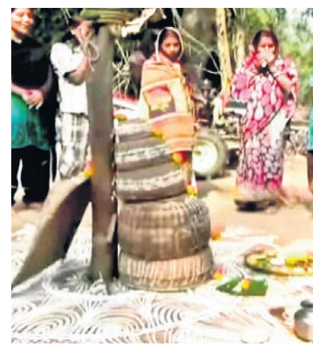
ସଂସୂକ୍ତା ଓ ସଂଗୀତ

ପାଉଁଶ ଆପଣା କରିବାର ଆଉ ନିବିଡ଼ ବନ୍ଧୁତାର ଇଏ ବି ଏକ ରୂପ। ଆଗରୁ ମକର ସଂକ୍ରାନ୍ତିରେ ମହିଳାମାନେ ଏମିତି ସ୍ୱତନ୍ତ୍ର ଜଙ୍ଗରେ ମକର ବସୁଥିଲେ। ଆଧୁନିକ ସମୟରେ ଏବେ ଯଦିଓ ମକର ବସିବା ପରମ୍ପରା କମି ଆସିଲାଣି ତଥାପି ଗାଁ ଗହଳିରେ ଅନେକ ମହିଳା ମକର ସଂକ୍ରାନ୍ତିରେ ମକର ବସି ସମ୍ପର୍କ ମଧୁରତାକୁ ବଢ଼େଇ ଚାଲିଛନ୍ତି। ମକର ଚାଉଳ ସାକ୍ଷୀ: ମକର ସଂକ୍ରାନ୍ତି ଦିନ ମକର ଚାଉଳକୁ ପରସ୍ପରକୁ ଦେଇ ଝିଅ କି ବୋହୁମାନେ ମକର ବସନ୍ତି। ସମ୍ପର୍କକୁ ଆହୁରି ଅଧିକ ମଧୁର କରିବା ନିମନ୍ତେ ମହିଳାମାନେ ବିଶେଷକରି ଏମିତି ମକର ବସିବାର ପରମ୍ପରା ଦେଖିବାକୁ ମିଳିଥାଏ। ଅର୍ଥାତ୍ ସମ୍ପର୍କ ସାକ୍ଷୀ ହୋଇଥାଏ ମକର ଚାଉଳ। ଭଗବାନଙ୍କର ଏହି ପ୍ରସାଦକୁ ସାକ୍ଷୀ ରଖି ସବୁ ବର୍ଗର ମହିଳାମାନେ ମକର ବସନ୍ତି। ଏମିତି କି କେବଳ ସାକ୍ଷୀମାନେ ନୁହନ୍ତି ଅନେକ ସମୟରେ ଅଧିକ ବୟସର