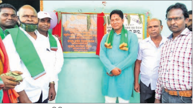
ପ୍ରକଳ୍ପ ଉଦ୍ଘାଟନ କରୁଛନ୍ତି ବିଧାୟକ।