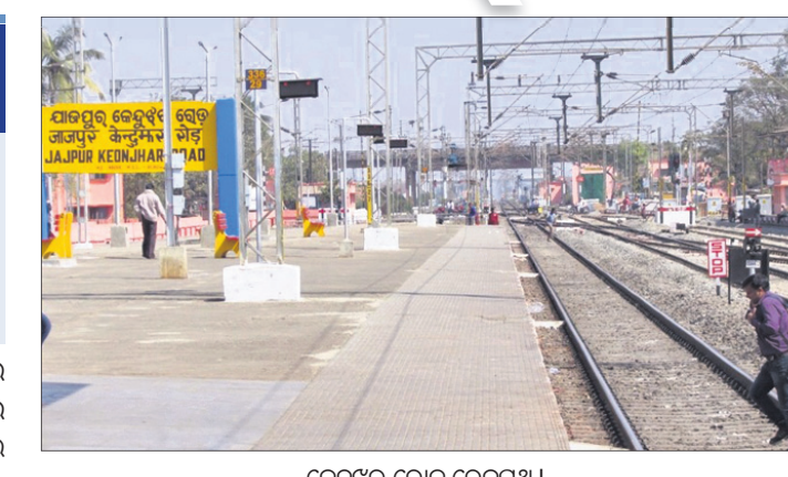
କେନ୍ଦୁଝର ରୋଡ଼ ରେଳପଥ।

ବିରଜାକ୍ଷେତ୍ରକୁ ରେଳପଥ ସଂଯୋଗ ■ ସତେରେ କାସ୍ତ୍ରୁତାଠାରୁ ଭିକ୍ ରିପୋର୍ଟ ■ ଆଗାମୀ ରେଳ ବଜେଟରେ ମଞ୍ଜୁର ଦାବି