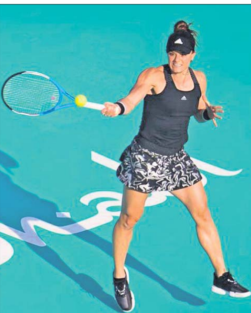
ରିଟର୍ଣ୍ଣ ଶର୍ ଖେଳିବା ଅବସରରେ ମାରିଆ ସାକାରି ।

ଅଷ୍ଟ୍ରେଲିଆନ ଓପନ ଚାମ୍ପିୟନ ସାକାରି ଆ କେନିନ୍‌ଙ୍କୁ ହରାଇ ଆରୁଧା ଓପନ ଚେମ୍ପିୟନ ଚୁନାମେଣ୍ଟର କାର୍ତ୍ତବ୍ୟାଳୟ ପର୍ଯ୍ୟାୟକୁ ବିଦାୟ ନେଇଛନ୍ତି । ଗ୍ରୀକ୍ ଖେଳାଳି ତଥା ୯ମ ସିଡ୍ ମାରିଆ ସାକାରି ୨-୬, ୬-୨, ୬-୦ ସେଟ୍‌ରେ କେନିନ୍‌ଙ୍କୁ ପରାସ୍ତ କରି ବିପର୍ଯ୍ୟୟ ସୃଷ୍ଟି କରିଛନ୍ତି । କେନିନ୍‌ଙ୍କ କ୍ୟାରିୟରର ଏହା ୧୪ତମ ଚୁରୁ କାର୍ତ୍ତବ୍ୟାଳୟ ମ୍ୟାଚ ଥିବାବେଳେ ତୃତୀୟ ପରାଜୟ ଥିଲା । ସାକାରି ପରବର୍ତ୍ତୀ ରାଉଣ୍ଡରେ ଚତୁର୍ଥ ସିଡ୍ ଆରିନା ସାକାରିଙ୍କୁ ଭେଟିବେ । ସେମିଫାଇନାଲରେ ଏକ ଗ୍ଲାନ ପାଇଁ ସେ ଏଲିନା ରିବାକିନାଙ୍କୁ ୬-୪, ୪-୬, ୬-୩ ସେଟ୍‌ରେ ପରାସ୍ତ କରିଛନ୍ତି । ଏହା ହେଉଛି ଟାଇମ୍ କ୍ରମାଗତ ୧୩ତମ ଚୁରୁ ବିଜୟ । ସାକାରିଙ୍କ ଗତ ସିଜନରେ ଓଷ୍ଟ୍ରେଲିଆ ଓ ଲିଞ୍ଜି ଇନ୍‌ଡୋରରେ ଗଜେଲ ଲିଟିଥିଲେ । ଆରୁଧାରେ ୪ ବିଜୟ ସହ ସେ ୨୦୨୧ ସିଜନ ଆରମ୍ଭ କରିଛନ୍ତି । ୪ ମ୍ୟାଚରୁ ୩ଟିରେ ବିଜୟ ହାସଲ କରିଛନ୍ତି । ଏହି ସାକାରିଙ୍କୁ ବିପକ୍ଷରେ ସେ ଏପର୍ଯ୍ୟନ୍ତ ଖେଳିଥିବା ସମସ୍ତ ମ୍ୟାଚ୍ ହାର୍‌ଡିକୋର୍ଟରେ ଖେଳାଯାଇଥିଲା ।