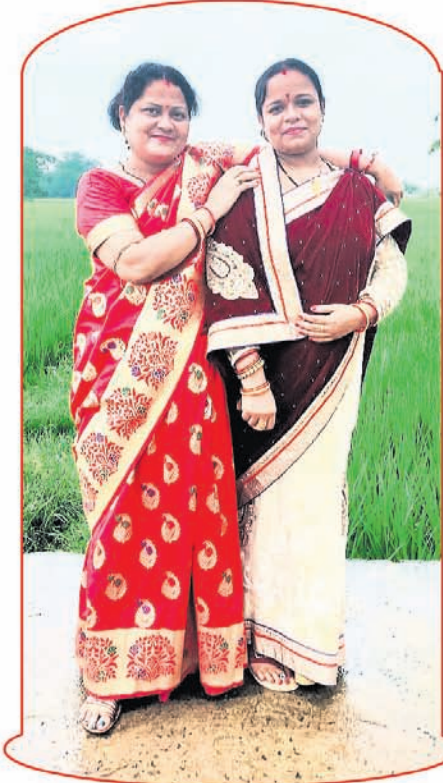
ସାମା ଓ ସୁତାଞ୍ଜଳି

ପାଉଁଶ ଆପଣା କରିବାର ଆଉ ନିବିଡ଼ ବନ୍ଧୁତାର ଇଏ ବି ଏକ ରୂପ। ଆଗରୁ ମକର ସଂକ୍ରାନ୍ତିରେ ମହିଳାମାନେ ଏମିତି ସ୍ୱତନ୍ତ୍ର ଜଙ୍ଗରେ ମକର ବସୁଥିଲେ। ଆଧୁନିକ ସମୟରେ ଏବେ ଯଦିଓ ମକର ବସିବା ପରମ୍ପରା କମି ଆସିଲାଣି ତଥାପି ଗାଁ ଗହଳିରେ ଅନେକ ମହିଳା ମକର ସଂକ୍ରାନ୍ତିରେ ମକର ବସି ସମ୍ପର୍କ ମଧୁରତାକୁ ବଢ଼େଇ ଚାଲିଛନ୍ତି। ମକର ଚାଉଳ ସାକ୍ଷୀ: ମକର ସଂକ୍ରାନ୍ତି ଦିନ ମକର ଚାଉଳକୁ ପରସ୍ପରକୁ ଦେଇ ଝିଅ କି ବୋହୁମାନେ ମକର ବସନ୍ତି। ସମ୍ପର୍କକୁ ଆହୁରି ଅଧିକ ମଧୁର କରିବା ନିମନ୍ତେ ମହିଳାମାନେ ବିଶେଷକରି ଏମିତି ମକର ବସିବାର ପରମ୍ପରା ଦେଖିବାକୁ ମିଳିଥାଏ। ଅର୍ଥାତ୍ ସମ୍ପର୍କ ସାକ୍ଷୀ ହୋଇଥାଏ ମକର ଚାଉଳ। ଭଗବାନଙ୍କର ଏହି ପ୍ରସାଦକୁ ସାକ୍ଷୀ ରଖି ସବୁ ବର୍ଗର ମହିଳାମାନେ ମକର ବସନ୍ତି। ଏମିତି କି କେବଳ ସାକ୍ଷୀମାନେ ନୁହନ୍ତି ଅନେକ ସମୟରେ ଅଧିକ ବୟସର