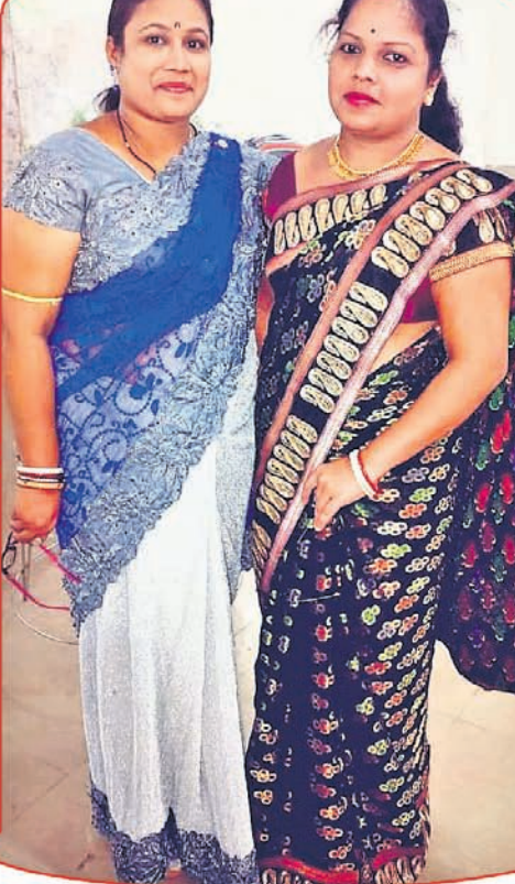
ସଂସୂକ୍ତା ଓ ସଂଗୀତ