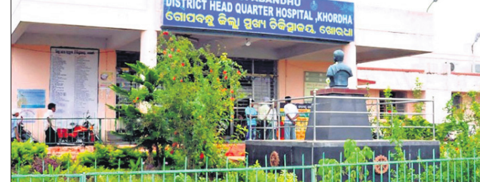
ଖୋର୍ଦ୍ଧା ଅଫିସ୍, ୧୧.୧୧.୧୯

ଖୋର୍ଦ୍ଧା ଜିଲ୍ଲା ପୁଖ୍ୟ ଚିକିତ୍ସାଳୟ ପରିସର ଅଧିକାରୀଙ୍କ ଆହ୍ୱାନରେ ପାଳିଚିଲି ମଙ୍ଗଳବାର ବୁଲିଲା ଖଣ୍ଡା, ମାରଣାସ୍ତ୍ର ଧରି ମେଡିକାଲରେ ଆଡ଼କ ଚଳାଇଥିଲେ। କାହାରିକୁ ଆକ୍ରମଣ କରିବା ଉଦ୍ଦେଶ୍ୟରେ ମେଡିକାଲରେ ଖଣ୍ଡା ବୁଲାଇ ଏପଟେ ସେପଟ ବୁଲିଥିଲେ। ବାହାରେ ଥିବା ରୋଗୀ ଏବଂ ସମ୍ପର୍କୀୟମାନେ ସେଠାରୁ ଛତୁଭଙ୍ଗ ଦେଇଥିଲେ। ରୋଗୀମାନେ ଭୟଭୀତ ହୋଇପଡିଥିଲେ। ଖବରପାଳ ଗଞ୍ଜେଇ ଯୋଗ୍ୟ ପକ୍ଷୀମାନଙ୍କୁ ଖୋଲିବା ନେଇ ଉଚ୍ଚଶିକ୍ଷା ବିଭାଗ ପକ୍ଷରୁ ଏକ ନିର୍ଦ୍ଦେଶନା ଜାରି ହୋଇଛି। ଉଦ୍ଧାର, ସାଧାରଣତନ୍ତ୍ର ଦିବସ, ସରସ୍ୱତୀ ପୂଜା ଓ ଉତ୍କଳ ଦିବସରେ କ୍ଲାସ୍ ହେବ ନାହିଁ ବୋଲି ବିଭାଗ ପକ୍ଷରୁ କୁହାଯାଇଛି।