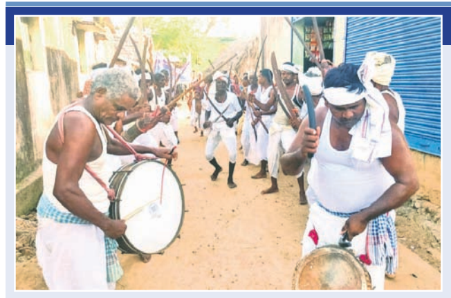
ଗ୍ରାମର ପାଇକମାନେ କଳା ପ୍ରଦର୍ଶନ କରୁଛନ୍ତି।