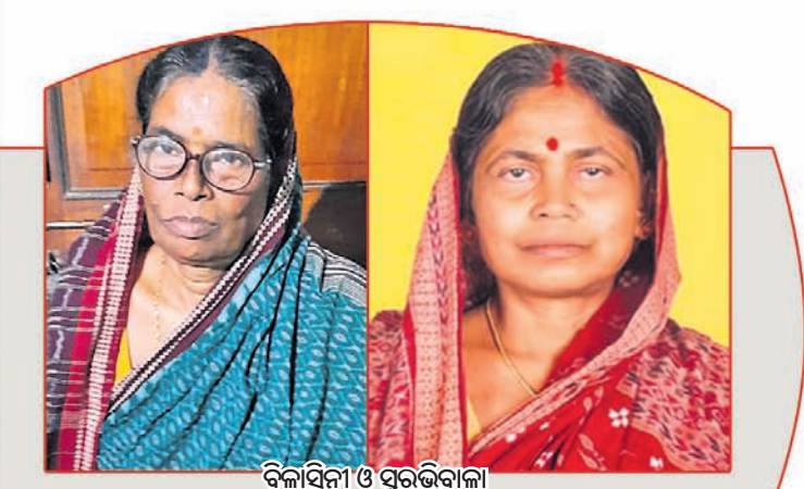
ବିଳାସିନୀ ଓ ପୁରଭବାଳା

ଭିନ୍ନ ଅନୁଭୂତି: ଏକାଠି ପଢ଼ିବା, ଏକାଠି ବୁଲିବା ଆଉ କଥାବାର୍ତ୍ତା ହେଲେ ପରସ୍ପର ମଧ୍ୟରେ ବନ୍ଧୁତାର ସମ୍ପର୍କ ଗଢ଼ି ଉଠିଥାଏ। କିନ୍ତୁ ବନ୍ଧୁମାନଙ୍କ ଭିତରେ ମକର ବସିବାର ଏକ ଭିନ୍ନ ଅନୁଭୂତି ରହିଥାଏ। ସାକ୍ଷୀମାନଙ୍କ ଭିତରେ ଜଣେ କି ଦୁଇଜଣ ମକର ହୋଇପାନ୍ତି। ତେଣୁ ସେମାନେ ନିଶ୍ଚିତଭାବେ ମକର ପାଖରେ ବନ୍ଧୁତାର ଭାବ ଚିକିଏ ଗଢ଼ା ରହିଥାଏ। ସେଥିପାଇଁ ସାକ୍ଷୀମାନେ ଧରି ଡାକିବା ବଦଳରେ ମକର ଡାକିଲେ ଚିକିଏ ଅଲଗା ଲାଗିଥାଏ।