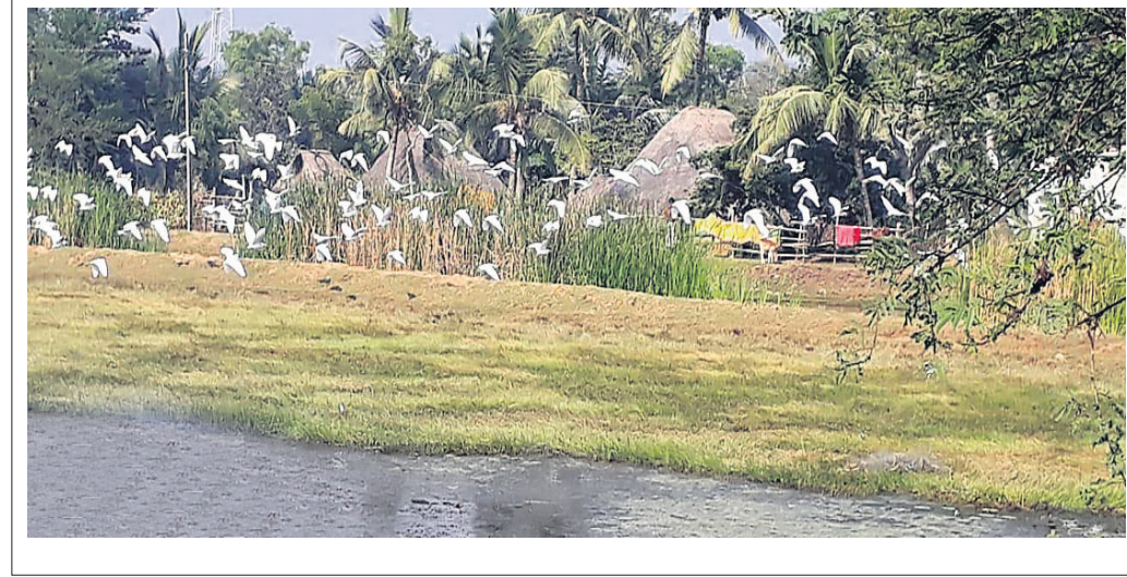
କମିଛି ପକ୍ଷୀ ସଂଖ୍ୟା