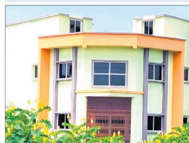
ଏନ୍ଏସି କଲ୍ୟାଣ ମଣ୍ଡପ।