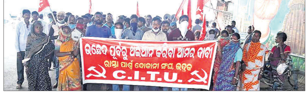
ଶୋଭାଯାତ୍ରାରେ ସାମିଲ ହୋଇଥିବା ଉଠା ଦୋକାନୀମାନେ।