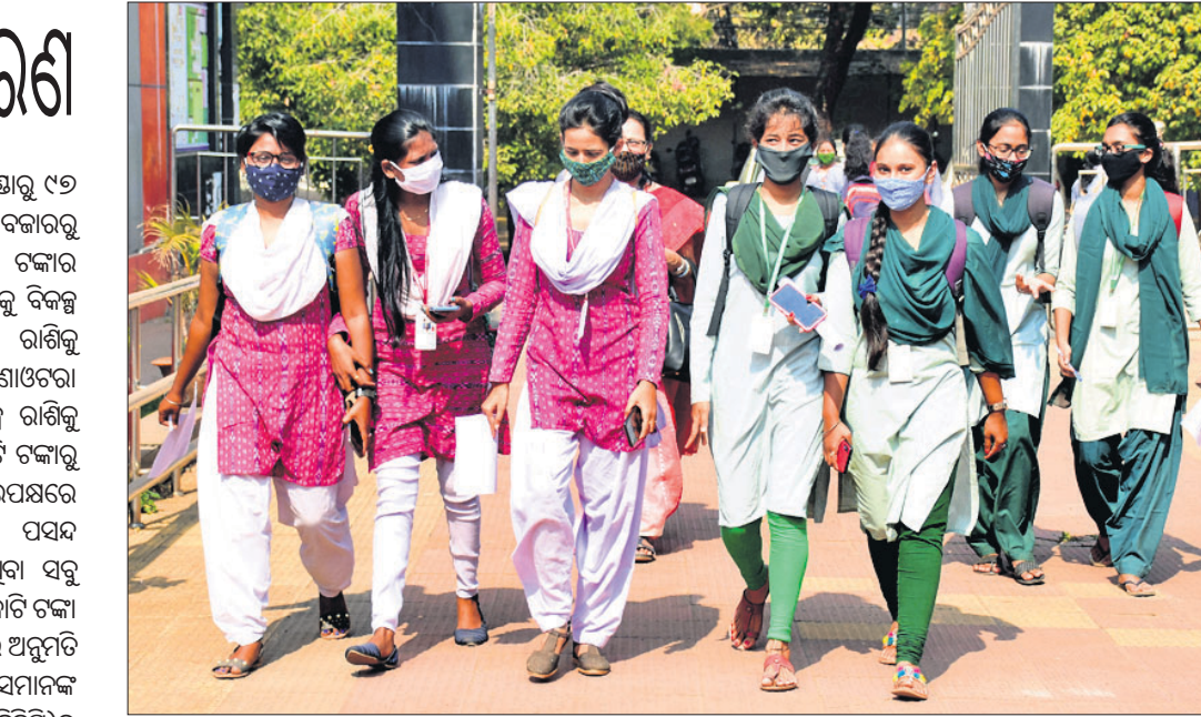
କରୋନା ପାଇଁ ଦୀର୍ଘ ୯ ମାସ ପରେ ସୋମବାର ଉଚ୍ଚ ଶିକ୍ଷାନୁଷ୍ଠାନ ଖୋଲିଛି। ଭୁବନେଶ୍ୱରସ୍ଥିତ ରମାଦେବୀ ମହିଳା ମହାବିଦ୍ୟାଳୟର ପିଠି ଏବଂ ସୁସ୍ଥ ୩ ଶ୍ରେଣୀ ଛାତ୍ରୀମାନେ ଶ୍ରେଣୀଗୁଡ଼ିକୁ ଅଭିମୁଖେ ଯାଉଛନ୍ତି।

ଦେଇଥିଲେ। ରିଜର୍ଭ ବ୍ୟାଙ୍କ ଫ୍ରେଣ୍ଡ୍‌ସ୍‌ ୯୭ ହଜାର କୋଟି କିମ୍ବା ଖୋଲା ବଜାରରୁ ମୋଟ ୨.୩୫ ଲକ୍ଷ କୋଟି ଟଙ୍କାର ରଣ ଉପାରେ ନେଇ ରାଜ୍ୟଗୁଡ଼ିକୁ ବିକଳ ଦିଆଯାଇଥିଲା। କ୍ଷତିପୂରଣ ରାଶିକୁ ନେଇ କେନ୍ଦ୍ର ରାଜ୍ୟ ମଧ୍ୟ ଚର୍ଚ୍ଚାଓତରା ଲାଗି ରହିଥିଲା। ପ୍ରଥମ ବିକଳ ରାଶିକୁ କେନ୍ଦ୍ର ସରକାର ୧ ଲକ୍ଷ କୋଟି ଟଙ୍କା ଉର୍ଦ୍ଧ୍ୱକୁ ବଢ଼ାଇଛନ୍ତି। ଅପରପକ୍ଷରେ ପ୍ରଥମ ବିକଳକୁ ସବୁ ରାଜ୍ୟ ପସନ୍ଦ କରିଛନ୍ତି। ଏହି ବିକଳ ନେଇଥିବା ସବୁ ରାଜ୍ୟ ଅତିରିକ୍ତ ୧.୦୬ ଲକ୍ଷ କୋଟି ଟଙ୍କା ଉପାରେ କ୍ଷତିପୂରଣ କେନ୍ଦ୍ର ସରକାର ଅନୁମତି ପ୍ରଦାନ କରିଛନ୍ତି। ରାଜ୍ୟ ସେମାନଙ୍କ ମୋଟ ଘରୋଇ ଉତ୍ପାଦ (ଏସ୍‌ଜିଡିପି)ର ୦.୫୦% ରଣ ଉପାରେ କ୍ଷତିପୂରଣ ବୋଲି କେନ୍ଦ୍ର ସରକାର ସ୍ପଷ୍ଟ କରିଛନ୍ତି।