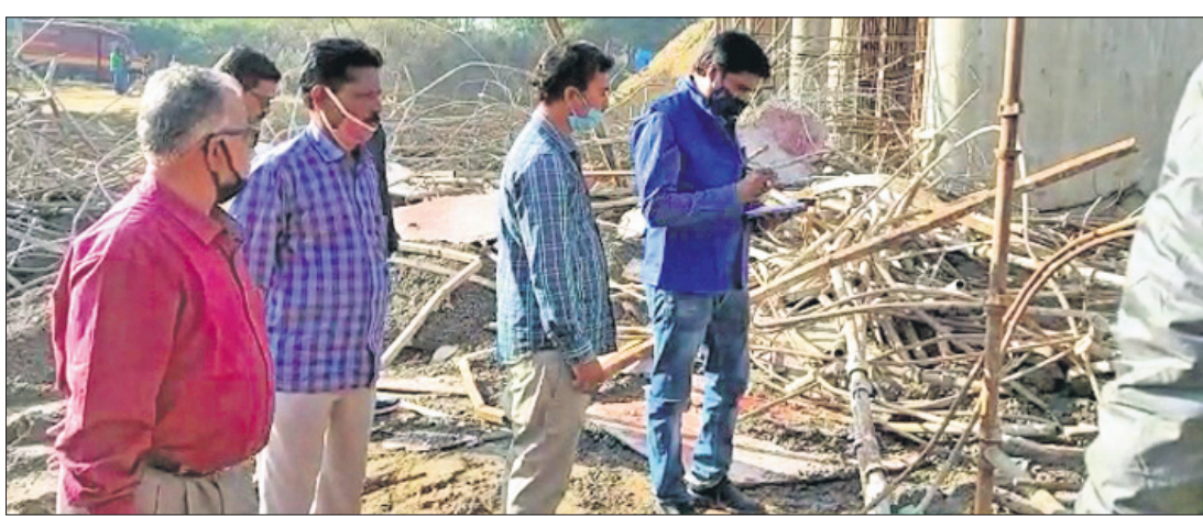
ଅଧିକାରୀମାନେ ଘଟଣାସ୍ଥଳରେ ପହଞ୍ଚି ତଦନ୍ତ କରୁଛନ୍ତି।