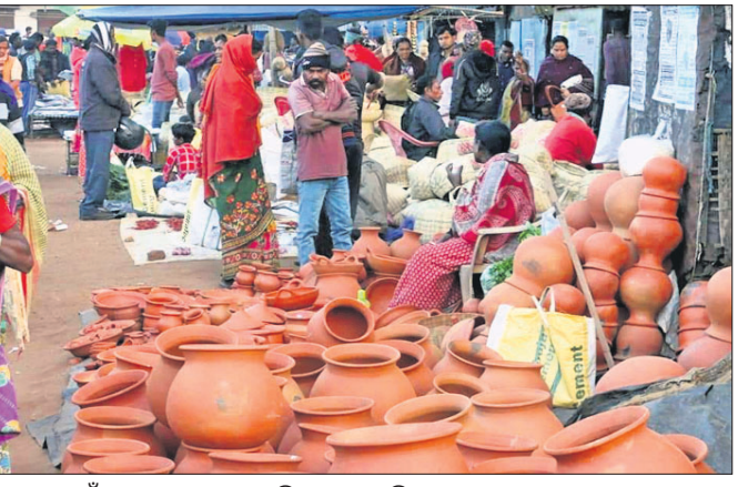
ମକର ପାଇଁ ଲୋକେ ବଜାରରେ ଭିଡ଼ ଜମାଇଛନ୍ତି।

ସରକାରଙ୍କ କୋଭିଡ଼ କଟକଣା କୋହଳ ହେବା ପରେ ସମସ୍ତଙ୍କ ମନରେ ଉଲ୍ଲସା ଉଠିଛି। ଅନୁରୋଧ ଆନନ୍ଦ। ଗାଁ ଠାରୁ ଆରମ୍ଭ କରି ସହର ପର୍ଯ୍ୟନ୍ତ ସବୁଠି ଲାଗିଛି ଗହଳି। ହାଟ ଓ ବଜାରରେ ନୂଆବସ୍ତ୍ର, ମାଟିଘାଣ୍ଟି, ବାଉଁଶ କୁଳା ପାଛିଆ, ଘରକରଣା ସାମଗ୍ରୀ ଆଦି କିଣିବା ପାଇଁ ଲୋକଙ୍କ ଭିଡ଼ ପରିଲକ୍ଷିତ ହେଉଛି। ଚୁସୁ ପୂଜା ପାଇଁ ବଜାରରେ ବିକ୍ରି ହେଲାଣି ପ୍ରତିମା। ଗାଁ ଗଣ୍ଡାରେ ମାଟିକାନ୍ଥକୁ ବିଭିନ୍ନ ହସ୍ତକଳାରେ ରଙ୍ଗବେରଙ୍ଗରେ ସୁସଜ୍ଜିତ କରାଯାଉଥିବା ବେଳେ ଶୁଭିଲାଣି ମାବଳର ଶବ୍ଦ ଓ ଚୁସୁ ଗୀତ। ଜଳଖିଆ ମାନଙ୍କରେ ମକର ପଇା(କୁମା) ପାଇଁ ଶୁଖିଲା ତାଳପତ୍ର ଠୁଳ ହେବା ଦୃଶ୍ୟ ମକରକୁ ସ୍ୱାଗତ କରୁଥିବା ପ୍ରତୀକ୍ଷାମାନ ହେଲାଣି। ଆସନ୍ତା ଗୁରୁବାର ମକର