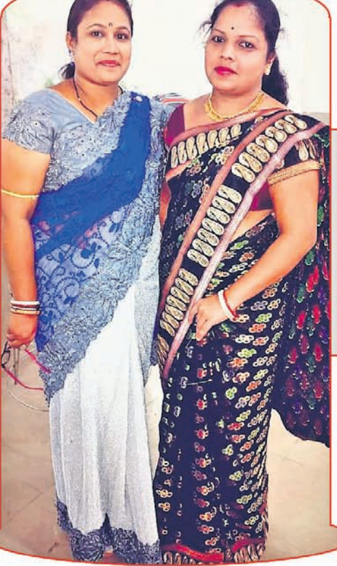
ସଂଯୁକ୍ତା ଓ ସଂଗୀତା