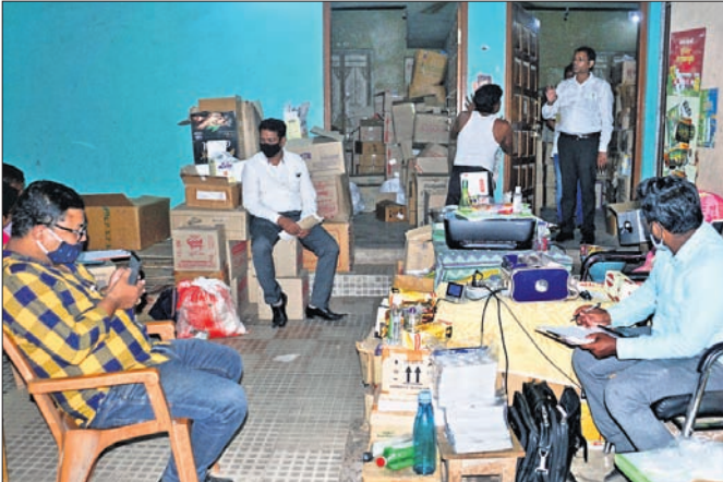
ଗୋଦାମରେ ଅଧିକାରୀମାନେ କାରଗପତ୍ର ଯାଞ୍ଚ କରୁଛନ୍ତି।

ଜର୍ଦ୍ଦୀ, ବିଭିନ୍ନ ଡିବରଜେଷ୍ଟ ପାଉଁର ସମ୍ପଦେ କିଛି ଖାଦ୍ୟ ସାମଗ୍ରୀର ମାଲ୍ ବ୍ୟବହାର କିଏ ଚିହ୍ନି ଚିହ୍ନି ଏଠାରେ ବିନା ବିଲ୍ରେ ଜିଏସ୍ଟି ଚିହ୍ନି ଓ କିଏ ଚିହ୍ନି ଫାକ୍ କାରବାର କରାଯାଉଥିବା ନେଇ ଜିଏସ୍ଟି ଚିହ୍ନି ନିକଟରେ ଅଭିଯୋଗ ହୋଇଥିଲା। ତେବେ ସମସ୍ତ ଅଭିଯୋଗ ତଦନ୍ତ ଶେଷ ହେବା ପରେ ଏହି ଠକେଇ ବାବଦରେ ସୂଚନା ଦିଆଯିବ ବୋଲି ଜିଏସ୍ଟି ଚିହ୍ନି ପକ୍ଷରୁ କୁହାଯାଇଛି।