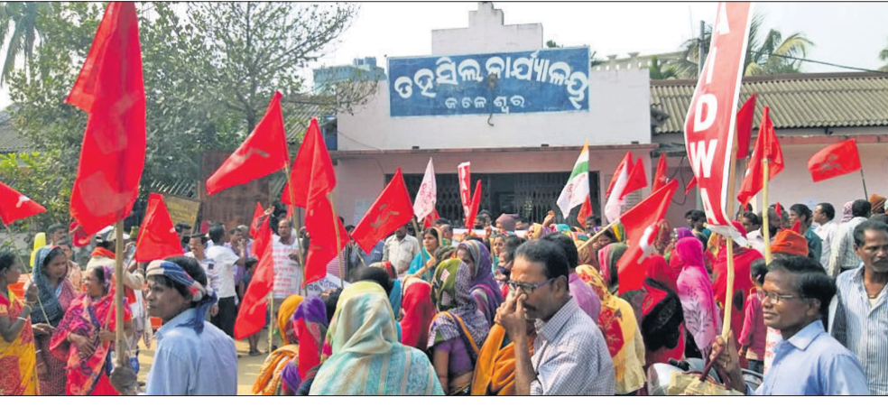
କୃଷକ ବିରୋଧୀ ଆଇନ ପ୍ରତ୍ୟାହାର ଦାବିରେ ବିକ୍ଷୋଭ