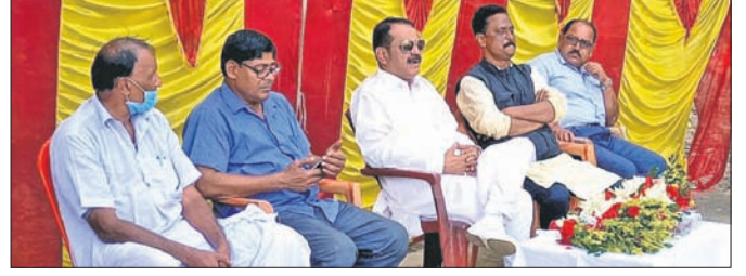
କଂଗ୍ରେସର ସାଙ୍ଗଠନିକ ବୈଠକରେ ଉପସ୍ଥିତ ଧାରଣାପତି ଓ ଅନ୍ୟ କର୍ମଚାରୀ।