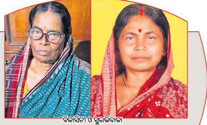
ବିଳାସିନୀ ଓ ପୁରଭବାଳା

ମହିଳା ଅର୍ଥାତ୍ କେଜେମା, ମାଉସୀମାନେ ମଧ୍ୟ ସେମାନଙ୍କ ନାତୁଣୀ କି ଝିଆରୀଙ୍କ ସହିତ ମକର ବି ବସିଥାନ୍ତି। ଅବଶ୍ୟ ଗାଁ