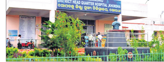
ଖୋର୍ଦ୍ଧା ଅଫିସ୍, ୧୧.୧୧.୧୯

ଖୋର୍ଦ୍ଧା ଜିଲ୍ଲା ପୁଖ୍ୟ ଚିକିତ୍ସାଳୟ ପରିସର ଅଧିକାରୀଙ୍କ ଆହ୍ୱାନରେ ପାଳିଚିଲି ମଙ୍ଗଳବାର ବୁଲିଲା ଖଣ୍ଡା, ମାରଣାସ୍ତ୍ର ଧରି ମେଡିକାଲରେ ଆଡ଼କ ଚଳାଇଥିଲେ। କାହାରିକୁ ଆକ୍ରମଣ କରିବା ଉଦ୍ଦେଶ୍ୟରେ ମେଡିକାଲରେ ଖଣ୍ଡା ବୁଲାଇ ଏପଟେ ସେପଟ ବୁଲିଥିଲେ। ବାହାରେ ଥିବା ରୋଗୀ ଏବଂ ସମ୍ପର୍କୀୟମାନେ ସେଠାରୁ ଛତୁଭଙ୍ଗ ଦେଇଥିଲେ। ରୋଗୀମାନେ ଭୟଭୀତ ହୋଇପଡ଼ିଥିଲେ। ଖବରପାଇ ଗାଉନ ପୋଲିସ୍ ପହଞ୍ଚିବା ପୂର୍ବରୁ ଖଣ୍ଡା ମାରଣାସ୍ତ୍ର ଛାଡି ସେଠାରୁ ଫେରାର ହୋଇଥିଲେ। ପୋଲିସ୍ ମାରଣାସ୍ତ୍ର ଜବତ କରି ଥାନାକୁ ଆଣିଥିଲା। ତେବେ କିଏ ଏମାନେ, କାହାକୁ ଆକ୍ରମଣ କିଏ ଦାବାବତ୍ ଆଦାୟ କରିବାକୁ ପଡିଥିଲେ, ତାହାକୁ ନେଇ ପ୍ରଶ୍ନବାଚୀ ସୃଷ୍ଟି ହୋଇଛି। ସୂଚନାଥାଉ କି, ମେଡିକାଲ ପରିସରକୁ ବାରମ୍ବାର ବାଜକ୍ ଚୋରି ନେଇ