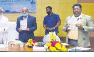
ଖେଦିନୀରେ କେନ୍ଦ୍ରମନ୍ତ୍ରୀ ପ୍ରଦାପ ଷଡ଼ଙ୍ଗୀ ଓ ଅନ୍ୟମାନେ।