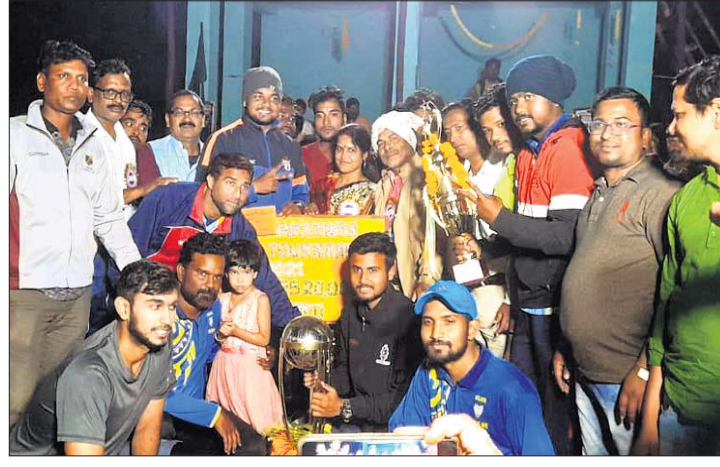
ଚାମ୍ପିୟନ ଯୁ ଆଣ୍ଡ ମି ଦଳର ଖେଳାଳିମାନେ ଟ୍ରଫି ସହ ଅତିଥିଙ୍କୁ ଗହଣରେ ।