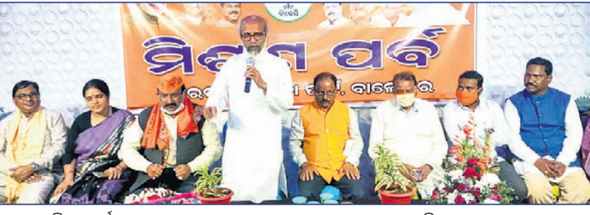
ଭାଜପା ପରବର୍ତ୍ତର କେନ୍ଦ୍ରମନ୍ତ୍ରୀ ପ୍ରତାପ ଚନ୍ଦ୍ର ଷଡ଼ଙ୍ଗା ଉଦ୍‌ଘୋଷଣା ଦେଉଛନ୍ତି ।

ସେଲସିୟସ୍ରେ ହ୍ରାସ ପାଇଛି । ଆସନ୍ତା ଦୁଇ ଦିନ ଆଭ୍ୟନ୍ତରୀଣ ଓଡ଼ିଶାରେ ଶୀତ ଲହରି ହେବ ବୋଲି ପାଣିପାଗ ବିଭାଗ ପୂର୍ବାନୁମାନ କରିଛି । ଶୁକ୍ରବାର ଓ ଶନିବାର ସୁନ୍ଦରଗଡ଼ ଓ ଝାରସୁଗୁଡ଼ା ଜିଲ୍ଲାର କେତେକ ଗ୍ଵାମରେ ଥଣ୍ଡା ଲହରି ପ୍ରବାହିତ ହେବ । ଏ ନେଇ ପାଣିପାଗ ବିଭାଗ ପକ୍ଷରୁ ଏକ୍ସଲୋଡିଂ କାରି କରାଯାଇଛି । ଉପକୂଳ ଜିଲ୍ଲାରେ କୁହୁଡି ହେବାର ସମ୍ଭାବନା ରହିଛି । ଆସନ୍ତା ୨୪ ଘଣ୍ଟା ମଧ୍ୟରେ ଅନୁଗୋଳ, ବୌଦ୍ଧ, ନୟାଗଡ, କଟକ, ଖୋର୍ଦ୍ଧା, ପୁରୀ ଏବଂ କନ୍ଧମାଳ ଜିଲ୍ଲାର ଗୋଟିଏ ଭୂଖଣ୍ଡ ଗ୍ଵାମରେ ଘନକୁହୁଡି ହେବାର ସମ୍ଭାବନା ରହିଛି ।