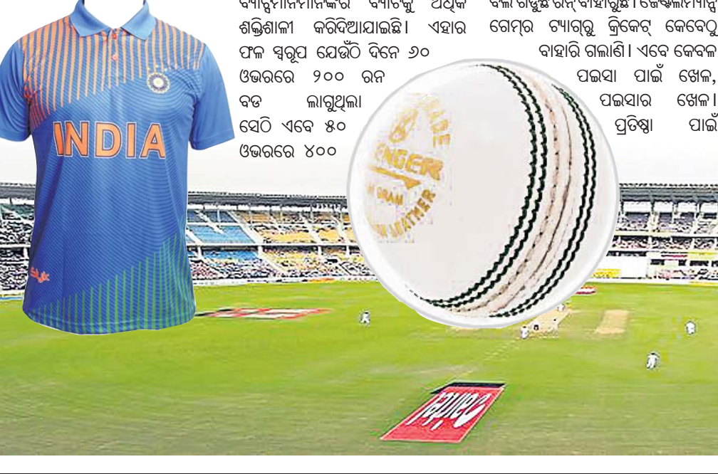
ଏକଦିବସୀୟ କ୍ରିକେଟ୍ କେବେ ୫୦ ଓଭରରେ ୨୦୦ ରନ ପଇସା ପାଇଁ ଖେଳା ଯାଉଥିଲା

କଲେ। ଆଉ ୫ ତାରିଖ ଦିନ ହୋଇଥିବା ଆଉ ଷ୍ଟାଡିୟମରେ ଖେଳା ଯାଇଥିଲା। ଏହି ମ୍ୟାଚ୍‌ରେ ଅଷ୍ଟ୍ରେଲିଆ ପାଞ୍ଚ ଉଇକେଟରେ ଇଂଲଣ୍ଡକୁ ହରାଇଥିଲା। ଇଂଲଣ୍ଡ ପ୍ରଥମେ ବ୍ୟାଟିଂ କରି ୧୯୦ ରନ କରିଥିଲାବେଳେ ଅଷ୍ଟ୍ରେଲିଆ ଏହାକୁ ସହଜରେ ଅତିକ୍ରମ କରିଯାଇଥିଲା। ତଥ୍ୟ ଅନୁଯାୟୀ ଏହି ମ୍ୟାଚ୍‌କୁ ଦେଖିବା ପାଇଁ ୪୪୦୦୦ ବର୍ଷକ ପଡିଆରେ ଉପସ୍ଥିତ ଥିଲେ। ଆଉ ଏକଥା ହିଁ ବିଶ୍ୱ କ୍ରିକେଟରେ ମୋଡ ବଦଳିଯାଇଥିଲା। ଧୂମା ଚେଷ୍ଟା ମ୍ୟାଚ୍‌କୁ ଧୀରେ ଧୀରେ ପଛକୁ ଠେଲି ଏକ ଦିବସୀୟ କ୍ରିକେଟ୍ ସମୟର କଷ୍ଟିତ ପଥରରେ ନିଜକୁ ପ୍ରତିଷ୍ଠିତ କରାଇପାରିଲା। ଚେଷ୍ଟା ମ୍ୟାଚ୍ ହେବାର ଯେଉଁ ପ୍ରଥମ ୫୦ ବର୍ଷ ତଳେ ଆରମ୍ଭ ହୋଇଥିଲା ତାହା ଏବେ ଆହୁରି ଛୋଟ ହେବା ସହ ରୋମାଞ୍ଚକ ଏବଂ ଅର୍ଥ ପ୍ରଦାନକାରୀ ହୋଇ ଯାଉଛି। ଏହି ଖେଳ ଆରମ୍ଭ ହେବାର ମାତ୍ର ୪ ବର୍ଷ ମଧ୍ୟରେ ଏହାର ବିଶ୍ୱକପ ଆୟୋଜନ ଆରମ୍ଭ ହୋଇ ପାରିଥିଲା। କ୍ରିକେଟର ଏହି ଗତିଶୀଳ ପରା କାହାଣୀରେ ଅନେକ ପରିବର୍ତନ ଆସିଛି। ବିନା ପଇସାରେ କେବଳ ଯୌକ ପାଇଁ ଖେଳୁଥିବା ଲୋକ କେବେଠାରୁ ଇତିହାସ ପାଇଗିଲେଣି। ଏବେ କ୍ରିକେଟରେ ଷ୍ଟାର