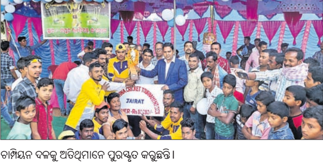
ଚାମ୍ପିୟନ ବକଳୁ ଅତିଥିମାନେ ପୁରସ୍କୃତ କରୁଛନ୍ତି।

କିଶୋରନଗର ବ୍ଲକ୍ କର୍ମଶାଳାରେ ଆୟୋଜିତ ରାଧାକୃଷ୍ଣ କର୍ମ ଉଦ୍‌ଯାପିତ ହୋଇଯାଇଛି।