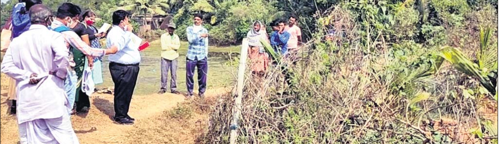
ଭିଜିଲାନ୍ସ ଅଧିକାରୀମାନେ କ୍ଷେତ୍ର ଅଞ୍ଚଳରେ ଯାଞ୍ଚ କରୁଛନ୍ତି।