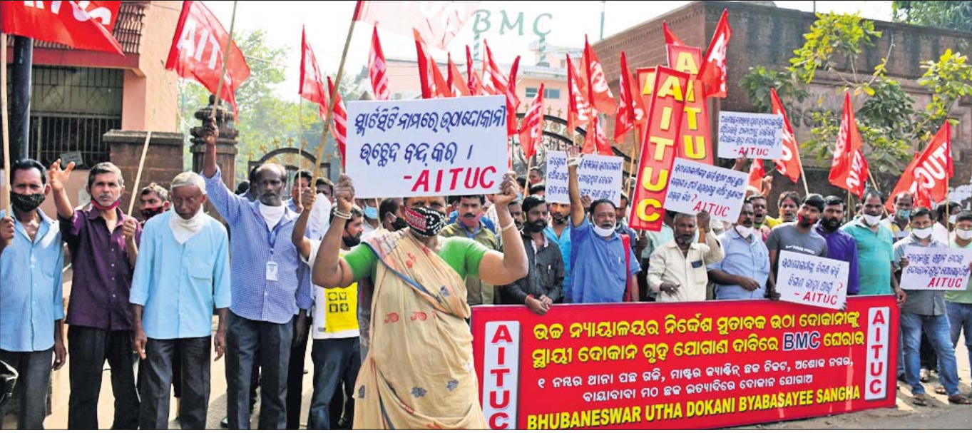
ଭଠା ଦୋକାନୀଙ୍କୁ ସ୍ଥାୟୀ ଦୋକାନଗୃହ ଯୋଗାଣ ଦାବିରେ ଭୁବନେଶ୍ୱର ଭଠା ଦୋକାନ ବ୍ୟବସାୟୀ ସଂଘ ପକ୍ଷରୁ ଶୁକ୍ରବାର ବିଏମ୍‌ସି ଅଫିସ ଘେରାଉ କରାଯାଇଛି।

ଓଡ଼ିଶା ସମେତ ରାଜ୍ୟ ବାହାର ଜମାକାରୀଙ୍କଠାରୁ ୧୭ ହଜାର ୫୦୦ କୋଟି ଟଙ୍କା ଠକି ନେଇଥିଲେ। ଚିତ୍‌ପଞ୍ଚ ବ୍ୟାଙ୍କ ଅଫ୍ ଇଣ୍ଡିଆ (ଆରବିଆଇ) ଓ ସିକ୍ୟୁରିଟି ଏକ୍ସଚେଞ୍ଜ ବୋର୍ଡ ଅଫ୍ ଇଣ୍ଡିଆ(ଏସ୍‌ଏକ୍ସିଆଇ) ଗାଢ଼ଭୁଲାଇନକୁ ଉଲ୍‌ସାନ କରି ଜମାକାରୀଙ୍କୁ ଠକେଇ କରାଯାଇଥିଲା। ଜମାକାରୀଙ୍କ ଅଭିଯୋଗକ୍ରମେ ସୁପ୍ରିମକୋର୍ଟ ସିବିଆଇକୁ ଠକେଇର ତଦନ୍ତ ଭାର ଦେଇଥିଲେ।