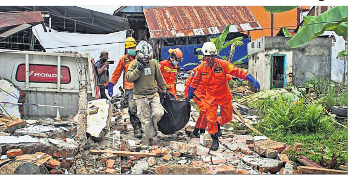
ସ୍କୁଲାଓସି ଦ୍ୱୀପରେ ଭୂକମ୍ପ ପରେ ଉତ୍ତରାବଶେଷକୁ ଲୋକଙ୍କୁ ଉଦ୍ଧାର କରାଯାଉଛି।