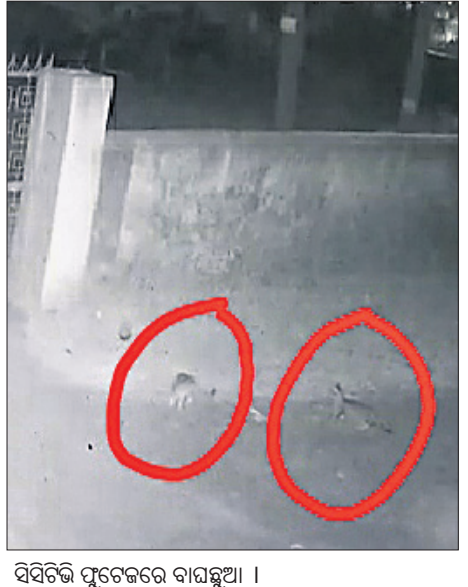
ସିପିଡି ପୁରେକରରେ ବାଘଛୁଆ ।