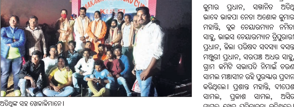
ଅତିଥିକ ସହ ଖେଳାଳିମାନେ।