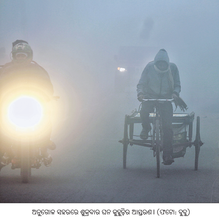
ଅନୁରୋଧ ସହରେ ଶୁକ୍ରବାର ଘନ କୁହୁଡ଼ିର ଆସୁରଣ ।