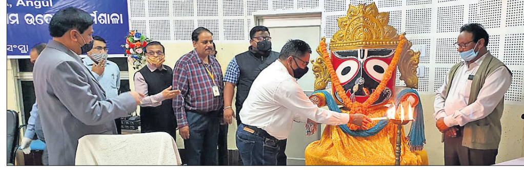
ଏମ୍‌ଏସ୍‌ଏମ୍‌ସି ଉଦ୍ୟୋଗ କର୍ମଶାଳାକୁ ଅତିଥିମାନେ ଉଦ୍‌ଯାପନ କରୁଛନ୍ତି।