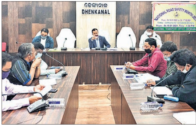
ବୈଠକରେ ଜିଲାପାଳ ଓ ପ୍ରଶାସନିକ ଅଧିକାରୀମାନେ।

ସାତମାଲ, ୧୫୧୧(ଡି.ଏନ.ଏ.): ହିନ୍ଦୋଳ ବୁକ୍ ଅଫିସର ଯାତ୍ରାପାଳିକାଙ୍କୁ ନେତା ମହାବିଦ୍ୟାଳୟରେ 'ଓଡ଼ିଆ ସାହିତ୍ୟର ନବକାଗରଣ' ସମ୍ପର୍କିତ ରାଜ୍ୟସ୍ତରୀୟ ଓଡ଼ିଆ ଅନୁଷ୍ଠାନ ସମାବେଶର ଆରମ୍ଭ ହୋଇଛି।