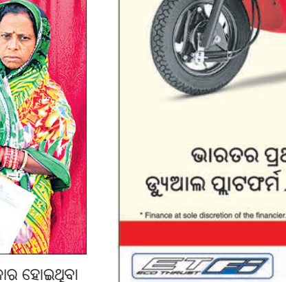
୦କେଇ ଠିକଣା ହୋଇଥିବା ମହିଳା ।