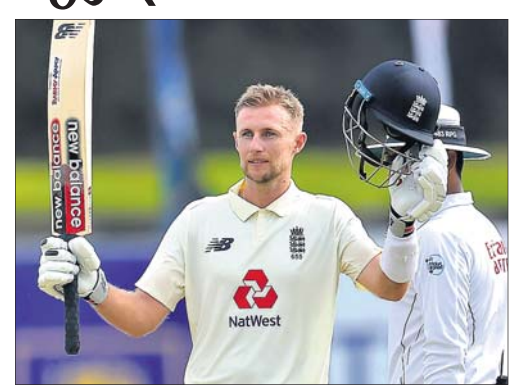
ଶତକ ହାସଲ ପରେ ଜୋ ରୁଟ୍।

ଗାଲ, ୧୫।୧ (ପି.ଟି.) ଅଧିନାୟକ ଜୋ ରୁଟ୍‌ଙ୍କ ଅପରାଜିତ ଶତକ (୧୬୮*, ୨୫୪ ବଲ୍, ୧୨ ଚୋକା) ବଳରେ ଇଂଲଣ୍ଡ ଘରୋଇ ଶ୍ରୀଲଙ୍କା ବିପକ୍ଷ ପ୍ରଥମ ଟେଷ୍ଟରେ ବୃହତ୍ ଅଗ୍ରଣୀ ହାସଲ କରି ସ୍ଥିତି ଦୃଢ଼ କରିଛି। ଚତୁର୍ଥ ଶ୍ରୀଲଙ୍କା ପ୍ରଥମ ଇନିଂସରେ ୪୬.୧ ଓଭରରେ ୧୩୫ ରନକରି ଅଲଆଉଟ୍ ହୋଇଥିଲା। ଜବାବରେ ପ୍ରଥମ ଇନିଂସ ଆରମ୍ଭ କରି ଇଂଲଣ୍ଡ ଶୁକ୍ରବାର ବର୍ଷା ବାଧାପ୍ରାପ୍ତ ଦ୍ୱିତୀୟ ଦିବସ