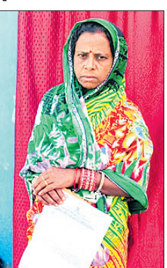
୦କେଇର ଶିକାର ହୋଇଥିବା ମହିଳା।