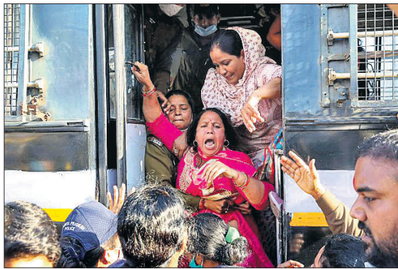
ଭୋପାଳରେ 'କିଷାନ ଅଧିକାର ଦିବସ' ପାଳନ ବେଳେ କଂଗ୍ରେସର ମହିଳା କର୍ମୀଙ୍କୁ ପୋଲିସ୍ ଜାମିନରେ ବନ୍ଦୀ ରଖିଛନ୍ତି।

ଚାଷୀଙ୍କ ପ୍ରତି ପ୍ରଧାନମନ୍ତ୍ରୀ ନରେନ୍ଦ୍ର ମୋଦିଙ୍କ ଆଦୌ ସମ୍ମାନ ନାହିଁ। କୃଷି ଆଇନ ବିରୋଧରେ ଆନ୍ଦୋଳନରତ କୃଷକମାନଙ୍କୁ ପ୍ରତିହତ କରିବା ଲାଗି ମୋଦି ଉଦ୍ୟମ ଚଳାଇଛନ୍ତି।