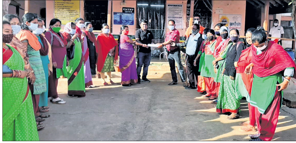
ପଟାଳା ଗୋଷ୍ଠୀ ସ୍ଵାସ୍ଥ୍ୟକେନ୍ଦ୍ର ଚିକିତ୍ସାଧାରୀଙ୍କୁ ସ୍ଵାସ୍ଥ୍ୟକର୍ମୀମାନେ ଦାବିପତ୍ର ଦେଉଛନ୍ତି।

ସ୍ଵାସ୍ଥ୍ୟକର୍ମୀଙ୍କ ପ୍ରତି ସରକାର ବୈମାତୃକ ମନୋଭାବ ପ୍ରଦର୍ଶନ କରୁଛନ୍ତି। ତାଙ୍କର ଦାବି ପ୍ରତି ସରକାର କର୍ତ୍ତୃପାତ କରୁ ନାହାନ୍ତି।