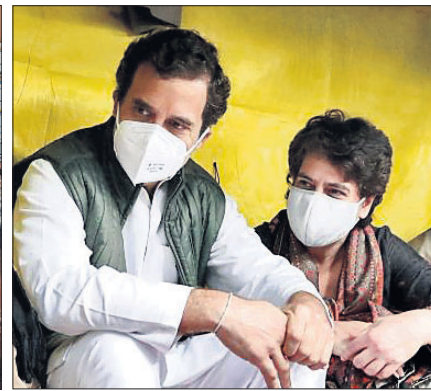
ନୂଆଦିଲ୍ଲୀର ଯନ୍ତ୍ରମନ୍ତ୍ରରେ କଂଗ୍ରେସ ପକ୍ଷରୁ ବିରୋଧରେ ନେତା ରାହୁଲ ଗାନ୍ଧୀ ଓ ପ୍ରିୟଙ୍କା ଗାନ୍ଧୀ ଭଣ୍ଡା ।

ଉପଯୋଗ କରି ସେ ଚାଷୀଙ୍କୁ ଦିନେ ନା ଦିନେ କ୍ଲାନ୍ତ କରିଦେବେ। ଚାଷୀଙ୍କ ପ୍ରତି ତାଙ୍କର ନୌକିଳ ସମ୍ମାନ ମଧ୍ୟ ନାହିଁ।