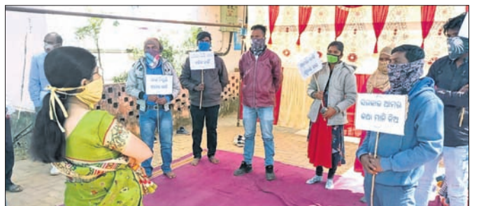
ଧାରଣା ଦେଇଥିବା ଛଟେଇ କର୍ମଚାରୀମାନେ।

ଯୋଗାଇଛନ୍ତି। ତାହାକୁ ଅଣଦେଖା କରି ଛଟେଇ କରାଯିବାକୁ ସେମାନେ ନାପସନ୍ଦ କରିଛନ୍ତି। ପୁନଃ ନିୟୁତ୍ତି ଦେବାକୁ ଦାବି କରି ଧାରଣା ଦେଇଥିବା ଛଟେଇ କର୍ମଚାରୀ କହିଛନ୍ତି।