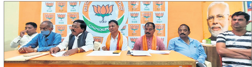
ଝରଦବାଟା ସମ୍ମିଳନୀରେ ଉପସ୍ଥିତ ଭାଜପା ନେତା ଓ କର୍ମୀମାନେ।

କଳାହାଣ୍ଡି ଜିଲ୍ଲାରେ ପୁସ୍ତକାଳୟ ନବୀନ ପଞ୍ଜନାୟକ ବିଭିନ୍ନ ପ୍ରକଳ୍ପର ଉଦ୍‌ଘାଟନ ଓ ଭିଜିପ୍ରସ୍ତର ଗ୍ଠନ କରିଛନ୍ତି। ଏହା ମଧ୍ୟରେ ଅନେକ ଜଳସେଚନ ପ୍ରକଳ୍ପ ରହିଛି।