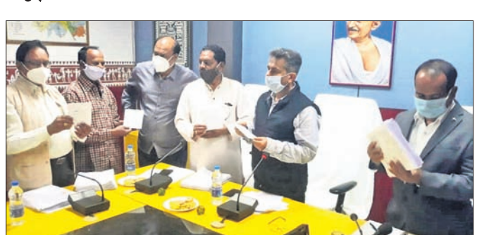
ଜିଲ୍ଲା ନିର୍ବାଚନ ଅଧିକାରୀ ଏବଂ ଅନ୍ୟମାନେ ସଂଶୋଧିତ ଭୋଟର ତାଲିକା ପ୍ରଦର୍ଶନ କରୁଛନ୍ତି।