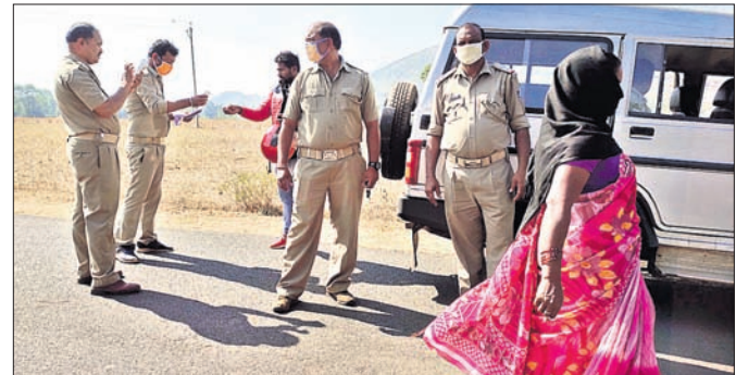
ପୋଲିସ୍ ପକ୍ଷରୁ ଗାଡ଼ି ଯାଞ୍ଚ କରାଯାଉଛି।

କୋରାପୁଟ ଜିଲ୍ଲା ଦଶମପଡ଼ାରେ ବୃକ୍ଷରୋଧୀ ଶୁକ୍ରବାର ପୋଲିସ୍ ଯାନବାହନ ଯାଞ୍ଚ କରିବାକୁ ନିର୍ଦ୍ଦେଶ ଦେଇଛନ୍ତି।