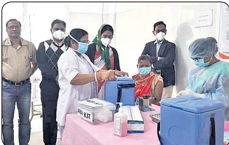
ମୟୂରଭଞ୍ଜ ଜିଲା ଉଦକା ଉପଖଣ୍ଡ ଚିକିତ୍ସାଳୟରେ ଜଣେ ସଫେଇ କର୍ମଚାରୀଙ୍କୁ ଟିକା ଦିଆଯାଇଛି।