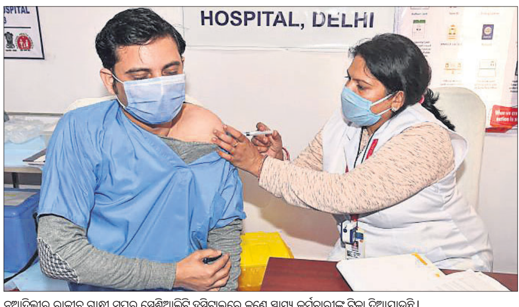
ନୂଆଦିଲ୍ଲୀର ରାଜୀବ ଗାନ୍ଧୀ ସୁପର ସ୍ପେଶିଆଲିଟି ହସ୍ପିଟାଲରେ ଜଣେ ସ୍ୱାସ୍ଥ୍ୟ କର୍ମଚାରୀଙ୍କୁ ଟିକା ଦିଆଯାଇଛି।