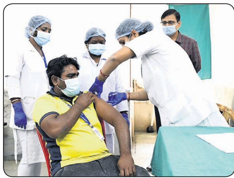
ସମ୍ବଲପୁର ଜିଲା ମୁଖ୍ୟ ଚିକିତ୍ସାଳୟରେ ଜଣେ ସଫେଇ କର୍ମଚାରୀଙ୍କୁ ଟିକା ଦିଆଯାଇଛି।