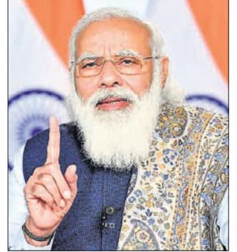
ଟିକାକରଣ କାର୍ଯ୍ୟକ୍ରମର ଶୁଭାରମ୍ଭ କରୁଛନ୍ତି ପ୍ରଧାନମନ୍ତ୍ରୀ ନରେନ୍ଦ୍ର ମୋଦି

ଶ୍ରାବଣରେ ଟିକାଦାନ କରାଯାଇଥିଲା। ଭାରତରେ ପ୍ରସ୍ତୁତ ଟିକା କରୋନା ମହାମାରୀ ବିରୋଧରେ ନିର୍ଣ୍ଣୟକ ବିଜୟ ହେବ ବୋଲି ପ୍ରଧାନମନ୍ତ୍ରୀ ଦୃଢ଼ୋକ୍ତି ପ୍ରକାଶ କରିଛନ୍ତି। ଏହି ଅବସରରେ ପ୍ରଧାନମନ୍ତ୍ରୀ ଦେଶବାସୀଙ୍କୁ ଅଭିନନ୍ଦନ ଜଣାଇବା ସହ ଯେଉଁମାନଙ୍କ ପାଇଁ ଟିକା ସର୍ବାଧିକ ଆବଶ୍ୟକ ସେମାନେ ପ୍ରଥମେ ପାଇବେ ବୋଲି କହିଥିଲେ। ଦେଶ ପାଇଁ ଏହା ଏକ ଐତିହାସିକ ମୁହୂର୍ତ୍ତ। ଏହା ଆତ୍ମନିର୍ଭର ଭାରତର ପ୍ରାମାଣିକତା ବୋଲି ଭାଙ୍ଗିପାର ଶୀର୍ଷ ନେତା ଓ କେନ୍ଦ୍ରମନ୍ତ୍ରୀମାନେ କହିଛନ୍ତି।