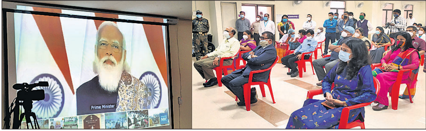
ପ୍ରଧାନମନ୍ତ୍ରୀ ନରେନ୍ଦ୍ର ମୋଦି ଭିଡିଓ କନ୍ଫରେନ୍ସ କରିଆରେ କରୋନା ଟିକା ଶୁଭାରମ୍ଭ କାର୍ଯ୍ୟକ୍ରମରେ ଉଦ୍‌ଘୋଷଣା ଦେଉଥିବାବେଳେ କଟକ ଏସ୍‌ସି ମେଡିକାଲ କଲେଜ ପରିସରରେ ଜିଲାପାଳ, ସିଏମ୍‌ସି କମିଶନର ଓ ଏସ୍‌ସିବିର ଅଧିକାରୀମାନେ ଦେଖୁଛନ୍ତି।