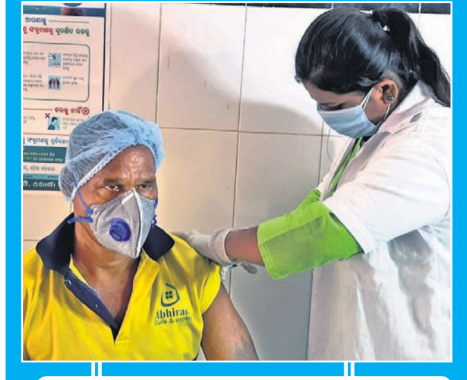
ଖୋର୍ଦ୍ଧା ମୁଖ୍ୟ ଚିକିତ୍ସାଳୟରେ ଜଣେ ସଫେଇ କର୍ମଚାରୀଙ୍କୁ ଟିକା ଦିଆଯାଇଛି।