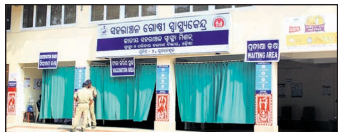
ଟିକାକରଣ ଅପେକ୍ଷାରେ ଭୁବନେଶ୍ଵର ଯୁନିଟ୍-୪ସ୍ଥିତ ଗୋଷ୍ଠୀ ସ୍ଵାସ୍ଥ୍ୟକେନ୍ଦ୍ର।