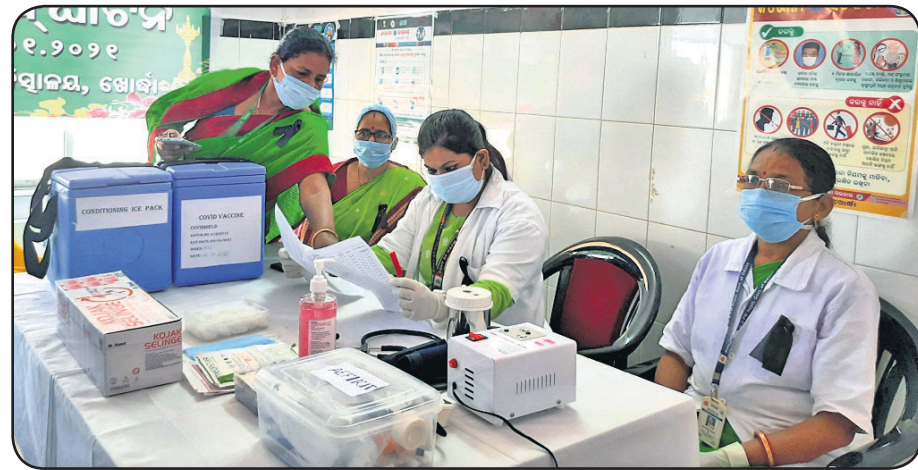
ଖୋର୍ଦ୍ଧା ଜିଲା ମୁଖ୍ୟ ଚିକିତ୍ସାଳୟରେ ଟିକା ପାଇଁ ସ୍ଵାସ୍ଥ୍ୟକର୍ମୀମାନେ ତାଲିକା ଯାଞ୍ଚ କରୁଛନ୍ତି।