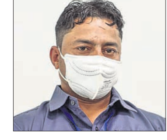
ଫକ୍ରପୁର। ଚାରିଆଡ଼େ ଟିକାକୁ ନେଇ ଗୁରୁତ୍ୱ ପ୍ରଦାନ ହେଉଥିବାବେଳେ ଗଣାଧ୍ୟାୟ ସେଥିରୁ ଦୂରେଇ ରହି ଲୋକମାନଙ୍କୁ ଠିକ୍ ତଥ୍ୟ ଦେବା ପାଇଁ ହର୍ଷବର୍ଦ୍ଧନ ଅନୁରୋଧ କରିଥିଲେ।

ଦିଲ୍ଲୀର ରାମମନୋହର ଲୋହିଆ (ଆରବ୍‌ମ୍ୟାକ୍) ହସ୍ପିଟାଲର ଡାକ୍ତରମାନେ ଭାରତ ବାୟୋଟେକ୍ ପ୍ରସ୍ତୁତ କୋଭାକ୍ସିନ୍ ଟିକା ନେବାକୁ ଅନୁମତି ପ୍ରକାଶ କରିଛନ୍ତି। ସେମାନେ ହସ୍ପିଟାଲ ସୁପରିଷେକ୍ସେକ୍ସ ଟିଠି ଲେଖି କୋଭାକ୍ସିନ୍ ବଦଳରେ ସିରମ୍ ଇନ୍‌ଷ୍ଟିଚ୍ୟୁଟର କୋଭିଡ୍‌କୁ ନେବାକୁ ଗ୍ରହଣ କରିଛନ୍ତି। କୋଭାକ୍ସିନ୍‌ର କ୍ଲିନିକାଲ ପରୀକ୍ଷା ସମ୍ପୂର୍ଣ୍ଣ ହୋଇ