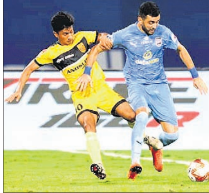
ମ୍ୟାଚ୍ ଏକ ସଂଘର୍ଷପୂର୍ଣ୍ଣ ମୁହୂର୍ତ୍ତ। କରି ଖେଳିଥିଲା। ମୁମ୍ବାଇ ତା'ର ପରବର୍ତ୍ତୀ ମ୍ୟାଚ୍‌ରେ ୨୨ ଚାରିଶ ଶୁକ୍ରବାର ଇଷ୍ଟ ବେଙ୍ଗାଳୁ ଭେଟିବ। ସେହିପରି ହାଇଦ୍ରାବାଦ ୧୯ ଚାରିଶ ମଙ୍ଗଳବାର ତା'ର ପରବର୍ତ୍ତୀ ମ୍ୟାଚ୍‌ରେ ଓଡ଼ିଶାକୁ ଭେଟିବ।

ବାୟୋଲିମ୍, ୧୬୧୧: ଇଣ୍ଡିଆନ ସୁପର ଲିଗ୍ (ଆଇଏସ୍‌ଏଲ୍)ରେ ଶନିବାର ମୁମ୍ବାଇ ସିଟି ଏଫ୍‌ସି ଓ ହାଇଦ୍ରାବାଦ ଏଫ୍‌ସି ମଧ୍ୟରେ ଖେଳାଯାଇଥିବା ମ୍ୟାଚ୍ ଗୋଲ ଶୂନ୍ୟ ଭାବେ ଶେଷ ହେବା ସହ ତ୍ର ରହିଛି। ସ୍ଥାନୀୟ ଜିଏମ୍‌ସି ସ୍ପୋର୍ଟସ୍‌ମେନ୍ ଅର୍ଗନାଇଜେସନ୍ ଏହି ସଂଘର୍ଷପୂର୍ଣ୍ଣ ମ୍ୟାଚ୍‌ରେ କୌଣସି ବଲ୍ ଗୋଲ୍ ସ୍କୋର କରିବାକୁ ସକ୍ଷମ ହୋଇ ନ ଥିଲେ। ମ୍ୟାଚ୍ ପରେ ଇଣ୍ଡିଆନ ଟାଇମ୍‌ସ୍‌ରେ ଅତିରିକ୍ତ ୩ ମିନିଟ୍ ଖେଳ ହୋଇଥିଲା। ଉଭୟ ଦଳ ଏକାଧିକ ସୁଯୋଗ ପାଇଥିଲେ ମଧ୍ୟ ଗୋଲରେ ପରିଣତ କରିପାରି ନ ଥିଲେ। ଏଥିସହି ମୁମ୍ବାଇ ୧୧ଟି ମ୍ୟାଚ୍ ଖେଳି ୮ ବିଜୟ, ୨ ଡ୍ର ଓ ୧ ପରାଜୟ ସହ ୨୬ ପଏଣ୍ଟ୍ ହାସଲ କରି ଟାଇଲାର ଶୀର୍ଷ ସ୍ଥାନରେ ରହିଛି। ସେହିପରି ହାଇଦ୍ରାବାଦ ୧୧ଟି ମ୍ୟାଚ୍ ଖେଳି ୪ ଲେଖାଏ ବିଜୟ ଓ ତ୍ର, ୩ ପରାଜୟ ସହ ୧୬ ପଏଣ୍ଟ୍ ପାଇ ଚତୁର୍ଥ ସ୍ଥାନରେ ରହିଛି। ବଲ୍ ପକେଟିଙ୍ଗ, ପାଞ୍ଚ ଓ ପାଞ୍ଚ ଆକ୍ରମଣରେ ହାଇଦ୍ରାବାଦଠାରୁ ମୁମ୍ବାଇ ଯଥେଷ୍ଟ ଆଗରେ ରହିଥିଲା। ମ୍ୟାଚ୍ ତ୍ର ହୋଇଥିଲେ ମଧ୍ୟ ମୁମ୍ବାଇ ପ୍ରଭାବ ବିସ୍ତାର