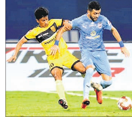
ମ୍ୟାଚ୍ ଏକ ସଂଘର୍ଷପୂର୍ଣ୍ଣ ମୁହୂର୍ତ୍ତ।

ବାୟୋଲିମ, ୧୬୧୧: ଇଣ୍ଡିଆନ ସୁପର ଲିଗ୍ (ଆଇଏସ୍‌ଏଲ୍)ରେ ଶନିବାର ମୁମ୍ବାଇ ସିଟି ଏଫ୍‌ସି ଓ ହାଇଦ୍ରାବାଦ ଏଫ୍‌ସି ମଧ୍ୟରେ ଖେଳାଯାଇଥିବା ମ୍ୟାଚ୍ ଗୋଲ୍ ଶୂନ୍ୟ ଭାବେ ଶେଷ ହେବା ସହ ତ୍ରୁ ରହିଛି। ଘାନାୟ ଜିଏମ୍‌ସି ଷ୍ଟାଡିୟମରେ ଅନୁଷ୍ଠିତ ଏହି ସଂଘର୍ଷପୂର୍ଣ୍ଣ ମ୍ୟାଚ୍‌ରେ କୌଣସି ଦଳ ଗୋଲ୍ ଷ୍ଟୋର କରିବାକୁ ସକ୍ଷମ ହୋଇ ନ ଥିଲେ। ମ୍ୟାଚ୍ ପରେ ଇଣ୍ଡିଆ ଟାଇମ୍ ବାବଦରେ ଅତିରିକ୍ତ ୩ ମିନିଟ୍ ଖେଳ ହୋଇଥିଲା। ଉଭୟ ଦଳ ଏକାଧିକ ସୁଯୋଗ ପାଇଥିଲେ ମଧ୍ୟ ଗୋଲ୍‌ରେ ପରିଣତ କରିପାରି ନ ଥିଲେ। ଏଥିସହ ମୁମ୍ବାଇ ୧୧ଟି ମ୍ୟାଚ୍ ଖେଳି ୮ ବିଜୟ, ୨ ଡ୍ର ଓ ୧ ପରାଜୟ ସହ ୨୬ ପଏଣ୍ଟ୍ ହାସଲ କରି ଟାଇଲାର ଶୀର୍ଷ ସ୍ଥାନରେ ରହିଛି। ସେହିପରି ହାଇଦ୍ରାବାଦ ୧୧ଟି ମ୍ୟାଚ୍ ଖେଳି ୪ ଲେଖାଏ ବିଜୟ ଓ ତ୍ରୁ, ୩ ପରାଜୟ ସହ ୧୬ ପଏଣ୍ଟ୍ ପାଇ ଚତୁର୍ଥ ସ୍ଥାନରେ ରହିଛି। ବଲ୍ ପକେଟିନ, ପାସ୍ ଓ ପାସ୍ ଆକ୍ସିରେସିରେ ହାଇଦ୍ରାବାଦଠାରୁ ମୁମ୍ବାଇ ଯଥେଷ୍ଟ ଆଗରେ ରହିଥିଲା। ମ୍ୟାଚ୍ ତ୍ରୁ ହୋଇଥିଲେ ମଧ୍ୟ ମୁମ୍ବାଇ ପ୍ରଭାବ ବିସ୍ତାର