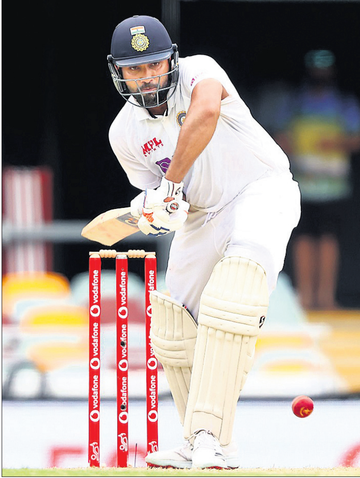
ରଞ୍ଜଣାତ୍ମକ ଶର୍ତ୍ତ ଖେଳୁଛନ୍ତି ରୋହିତ ଶର୍ମା।