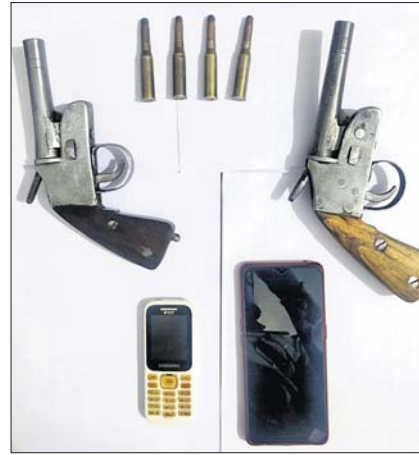
ଜବତ ବନ୍ଧୁକ, ମୋବାଇଲ୍ ଫୋନ୍ ।

ବଲାଙ୍ଗୀର ଜିଲ୍ଲା ଲୋକସିଂହା ବୁକ୍ସ ଲୁଗା ଗାଁର ଦୁଇ ଭାଇଙ୍କୁ ୫ଜଣ ଡକାୟତ ଶନିବାର ସକାଳେ ବନ୍ଧୁକ ଦେଖାଇ ଏକ ଲାପ୍ଟପ୍ ଓ ୩୫ ହଜାର ଟଙ୍କା ଲୁଚି ନେଇ ଫେରାର ହୋଇ ଯାଇଥିଲେ। ଖବରପାଇ ଲୋକସିଂହା ପୋଲିସ୍ ସେମାନଙ୍କୁ ପ୍ରାୟ ୨୦ କିଲୋମିଟର ପିଛା କରିଥିଲା। ବୁକ୍ସର ପୋଲିସ୍-କୁଟାସିଂହା ମଧ୍ୟଭାଗରେ ଥିବା ଜଙ୍ଗଲ ରାସ୍ତାରେ ଦୁର୍ଭରମାନେ ବାଲକ୍ ଛାଡ଼ି ଖସିଯିବାକୁ ଉଦ୍ୟମ କରିଥିଲେ। ସ୍ଥାନୀୟ ଗ୍ରାମବାସୀ ଓ ପୋଲିସ୍ ସେମାନଙ୍କୁ ପିଛା କରିଥିଲେ। ଲୁଚେନାମାନେ ଗୋଟିଏ ରାଉଣ୍ଡ ଟୁଲି ଟଙ୍କାଲ ସେମାନଙ୍କୁ ଭୟଭୀତ କରିବାକୁ ଉଦ୍ୟମ କରିଥିଲେ। ହେଲେ ୩ ଡକାୟତଙ୍କୁ ଲୋକସିଂହା ପୋଲିସ୍ କୌଣସିମାତେ କାନ୍ଦୁ କରିଥିଲା। ୨ ଜଣ ସୁବର୍ଣ୍ଣପୁର ଜିଲ୍ଲାର ହୋଇଥିବା ବେଳେ ଅନ୍ୟ ଜଣେ ଛତିଶଗଡ଼ ଅଞ୍ଚଳର ବୋଲି ଜଣାପଡ଼ିଛି। ସେମାନଙ୍କଠାରୁ ୨ଟି ବନ୍ଧୁକ, ଗୋଟିଏ ପଲ୍ଲସର ବାଲକ୍ (ନଂ.ଟିଏନ-୧୮-ଏସି-୨୦୭୩) ଓ ୨ ମୋବାଇଲ୍ ଜବତ ହୋଇଥିବା ଆଇଆଇସି ଲିଳିତା