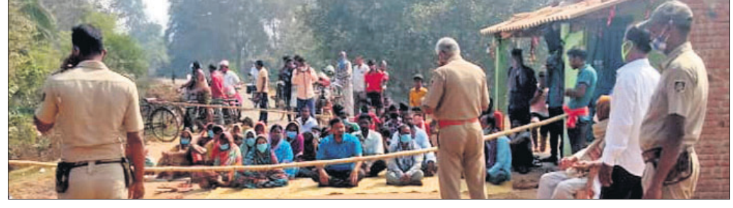
ବୈତରଣୀ ନଦୀବନ୍ଧ ଉପରେ ରାସ୍ତାବନ୍ଧନ କରି ଲୋକେ ଧାରଣାରେ ବସିଛନ୍ତି।