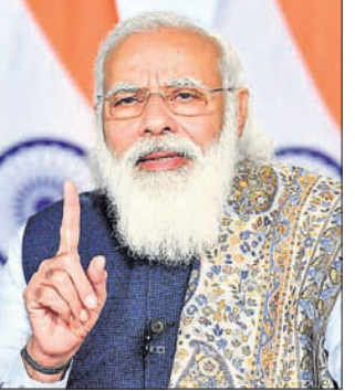
ଟିକାକରଣ କାର୍ଯ୍ୟକ୍ରମର ଶୁଭାରମ୍ଭ କରୁଛନ୍ତି ପ୍ରଧାନମନ୍ତ୍ରୀ ନରେନ୍ଦ୍ର ମୋଦି

ନୂଆଦିଲ୍ଲୀ, ୧୬।୧ (ପି.ଟି.) ପ୍ରଧାନମନ୍ତ୍ରୀ ନରେନ୍ଦ୍ର ମୋଦି ଶନିବାର ଦେଶରେ ବିଶ୍ୱର ସର୍ବବୃହତ୍ କୋଭିଡ୍ ଟିକାକରଣ ଅଭିଯାନ ଶୁଭାରମ୍ଭ କରିଛନ୍ତି। ପ୍ରଥମ ଦିନରେ ପ୍ରାୟ ୩