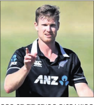
ନିଶାମଙ୍କ ଆଲୁଓରେ ଅସ୍ତ୍ରୋପଚାର

ନିଶାମଙ୍କ ଆଲୁଓରେ ଅସ୍ତ୍ରୋପଚାର ହୋଇଛି। କ୍ରିକେଟ ଫ୍ରେଲିଂଟନ ତରଫରୁ ଏହା ଘୋଷଣା କରାଯାଇଛି। ସଂଗ୍ରହକ ମଧ୍ୟରେ ଜଣେ ହ୍ୟାଣ୍ଡିକ୍ୟାପ୍ଡ ଫୁଲ୍ ଟାଇମ୍ କ୍ରୀଡ଼ାକାରୀ ତାହାର ସମାପନ କରାଯିବ।