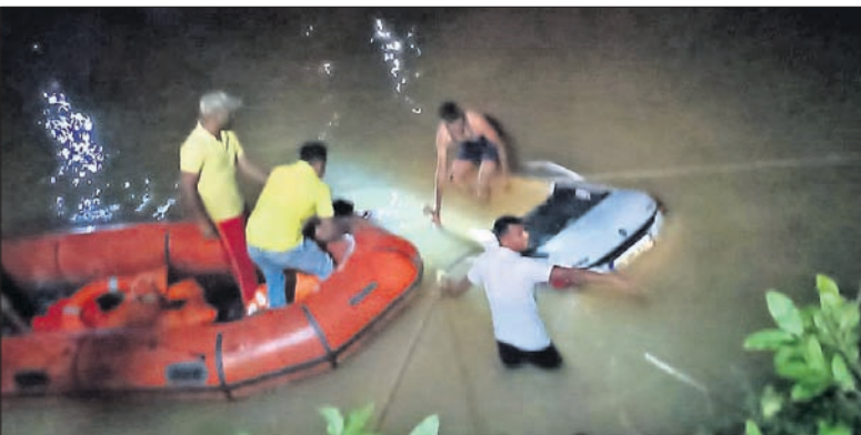
କେନାଲ ମଧ୍ୟରୁ ଅଗ୍ନିଶମ ବିଭାଗ କର୍ମଚାରୀମାନେ କାରକୁ ବାହାର କରୁଛନ୍ତି।