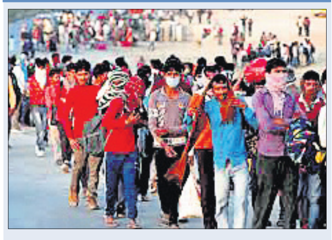
ବେରୋଜଗାରରେ ଯୁବପିଢ଼ିଙ୍କ ସଂଖ୍ୟା ବୃଦ୍ଧି ପାଇଛି

ବର୍ତ୍ତମାନ ସମୟରେ ବେକାରି ଏକ ପୁଖ୍ୟ ସମସ୍ୟା ହୋଇଥିବା ବେଳେ ଏହି ସମୟରେ ଏକ ରୋଚକ ତଥ୍ୟ ସାମ୍ନାକୁ ଆସିଛି। ଦେଶରେ ବେକାରି ହୋଇ ରହିଥିବା ସବୁ ବର୍ଗର ଲୋକମାନଙ୍କ ମଧ୍ୟରେ ଯୁବପିଢ଼ିଙ୍କ ସଂଖ୍ୟା ତେଜ ଅଧିକ ରହିଛି।