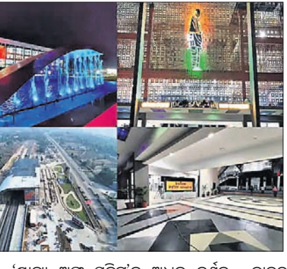
ଝାରୁପୁ ଅଫ୍ ଯୁନିଟ୍

ପ୍ରଧାନମନ୍ତ୍ରୀ ନରେନ୍ଦ୍ର ମୋଦି ରବିବାର ଗୁଜୁରାଟର କେଢ଼ାଡ଼ିଆକୁ ସଂଯୋଗ ପାଇଁ ୮ଟି ନୂଆ ଟ୍ରେନ୍ କରାଯିବ କହିଛନ୍ତି। ଏହି ଅବସରରେ ସେ କହିଥିଲେ ଯେ, 'ଏକ ଭାରତ, ଶ୍ରେଷ୍ଠ ଭାରତ'ର ଏକ ସ୍ତମ୍ଭର ଚିତ୍ର।