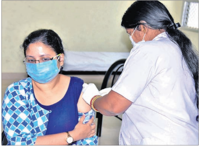
କଟକ ଏସିଏସିରେ ଜଣେ ସ୍ତ୍ରୀଙ୍କୁ ଟିକା ଦିଆଯାଉଛି।