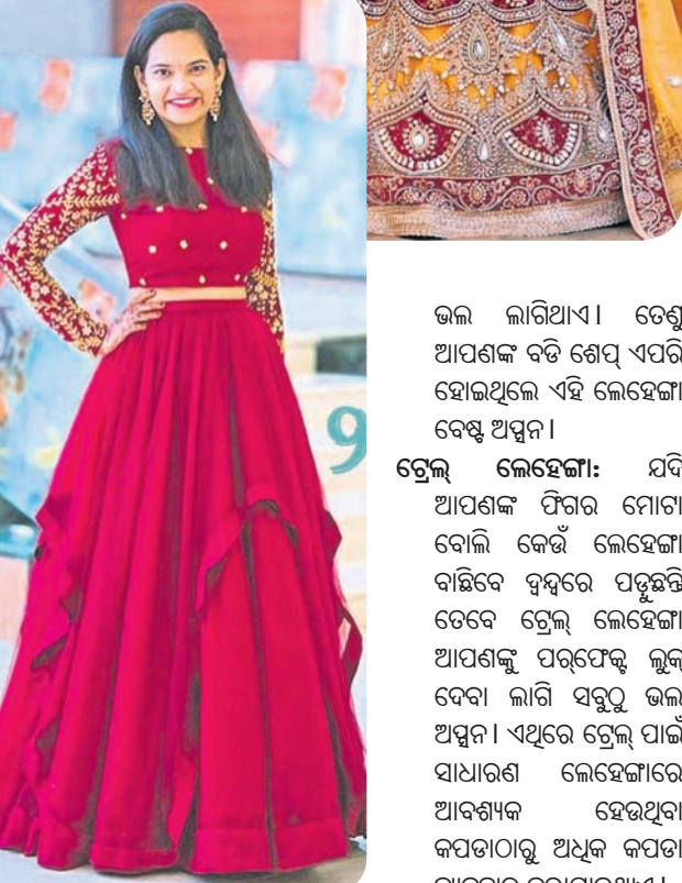
ଭଲ ଲାଗିଥାଏ। ତେଣୁ ଆପଣଙ୍କ ବଡ଼ି ଶେପ୍ ଏପରି ହୋଇଥିଲେ ଏହି ଲେହେଙ୍ଗା ବେଷ୍ଟ ଅପ୍ସନ।

କ୍ୟାକେଟ୍ ଡ୍ରେସ୍ ଲେହେଙ୍ଗା: ଏହା ବର୍ତ୍ତମାନ ଲାଗେଣୁ ଫ୍ୟାଶନ୍ ପାଇଁ ଲେହେଙ୍ଗାରେ ଚୋଲି ଉପରେ ଏକ କଣ୍ଟ୍ରାଷ୍ଟ କଲରର ଲଙ୍ଗ କ୍ୟାକେଟ୍ ରହୁଛି। ବିଶେଷ କରି ସାଇନିଂ