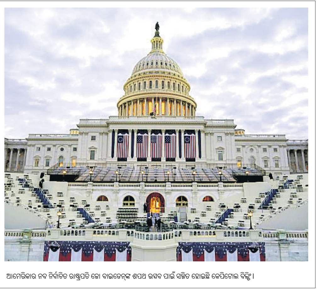
ଆମେରିକାର ନବ ନିର୍ବାଚିତ ରାଷ୍ଟ୍ରପତି ଜୋ ବାଇଡେନ୍‌ଙ୍କ ଶପଥ ଉତ୍ସବ ପାଇଁ ସଜ୍ଜିତ ହୋଇଛି କେପିଟୋଲ ବିଲ୍ଡିଂ।

ଉକ୍ତ ଅଞ୍ଚଳରେ କୌଣସି ନିର୍ମାଣ ଆରମ୍ଭ ହୋଇ ନ ଥିଲା। ଏପରିକି ୨୦୨୦ ଅଗଷ୍ଟରେ ମଧ୍ୟ ସେଠାରେ ଗାଁ ଦେଖାଯାଇ ନ ଥିଲା। ତେଣୁ ଖୁବ୍ କମ୍ ଦିନ ମଧ୍ୟରେ ୧୦୧ଟି ଘର ନିର୍ମାଣ ହୋଇଥିବା ଜଣାପଡ଼ିଛି। ଚାଇନା ଗତ କିଛିବର୍ଷ ହେବ ସାମାରେ ବିଭିନ୍ନ ଭିତ୍ତିଭୂମି କାର୍ଯ୍ୟ ଜାରି ରଖିଛି। ଭାରତ ସରକାର ମଧ୍ୟ ସାମାରେ ଭିତ୍ତିଭୂମି ବିକାଶ କରୁଥିବା ବହିର୍ବ୍ୟାପାର ମନ୍ତ୍ରଣାଳୟ କହିଛି।