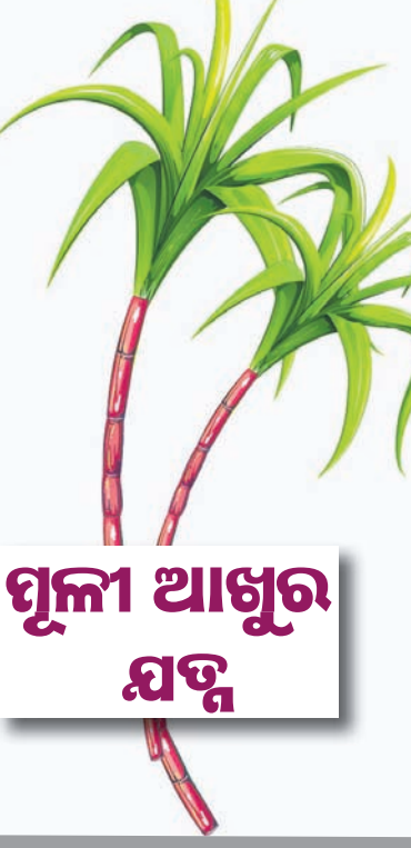
ମୂଳା ଆଖୁର ଯଦୁ