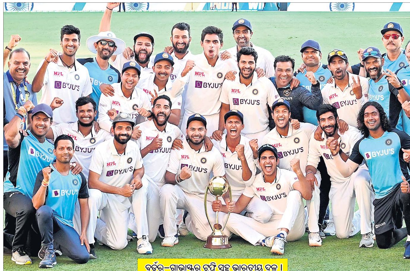
ବର୍ତ୍ତନ-ଗାଭାସ୍କର ଟ୍ରଫି ସହ ଭାରତୀୟ ଦଳ ।

୦ ୩୨୯ ରନ ଅଷ୍ଟ୍ରେଲିଆ ମାଟିରେ ଭାରତର ସର୍ବାଧିକ ରନଟେଜ୍ । ଅଷ୍ଟ୍ରେଲିଆରେ କୌଣସି ଦଳର ଏହା ୫ମ ସର୍ବାଧିକ ଟେଜ୍ । ଗତ ୨୦ ବର୍ଷରେ କେବଳ ଦକ୍ଷିଣ ଆଫ୍ରିକା ସର୍ବାଧିକ ରନ ଟେଜ୍ କରିପାରିଛି । ୨୦୦୮ରେ ଏହି ଦଳ ପର୍ଯ୍ୟନ୍ତ ୪୧୪ ରନ କରି ସଫଳତା ପାଇଥିଲା । ୦ ତ୍ରିସ୍ୱେନର୍ରେ ଅଷ୍ଟ୍ରେଲିଆକୁ ୩ ଉଇକେଟରେ ହରାଇବାପରେ ଭାରତ ବିଶ୍ୱ ଚାମ୍ପିୟନଶିପ୍ ଟେବୁଲର ଶୀର୍ଷକୁ ଉନ୍ନତ ହୋଇଛି । ୫ ସିରିଜ୍ ଖେଳି ୪ଟିରେ ବିଜୟ ହୋଇଛି ଭାରତ । ଏହି ସମୟରେ ମୋଟ ୧୩ ମ୍ୟାଚ ଖେଳି ୯ ବିଜୟ, ୩ ପରାଜୟ ଓ ୧ ଡ୍ର ସହ ୪୩୦ ପଏଣ୍ଟ ପାଇଛି । ଲ୍ୟୁଇଲାଣ୍ଡ ଓ ଅଷ୍ଟ୍ରେଲିଆ ପରବର୍ତ୍ତୀ ୨ ଗ୍ଲାନରେ ରହିଛନ୍ତି । ୦ ପ୍ରଥମ ଟେଷ୍ଟରେ ହାରିବାପରେ ଭାରତ ସଫଳ ପ୍ରତ୍ୟାବର୍ତ୍ତନ କରି ୨-୧ରେ ସିରିଜ୍ ଜିତିଛି । ପୂର୍ବରୁ ଅଷ୍ଟ୍ରେଲିଆ ମାଟିରେ କେବଳ ଇଂଲଣ୍ଡ ୩ ଥର ଏହା କରି ପାରିଥିଲା । ୦ ଚିନ୍ମିତ ପକ୍ତ ୮୯ ରନରେ ଅପରାଜିତ ରହି ଭାରତ ବିଜୟରେ ଗୁରୁତ୍ୱପୂର୍ଣ୍ଣ ଭୂମିକା ନିର୍ବାହ କଲେ । କୌଣସି ଟେଷ୍ଟର ୪ର୍ଥ ଇନିଂସରେ ଜଣେ ଉଇକେଟ କିପରକ