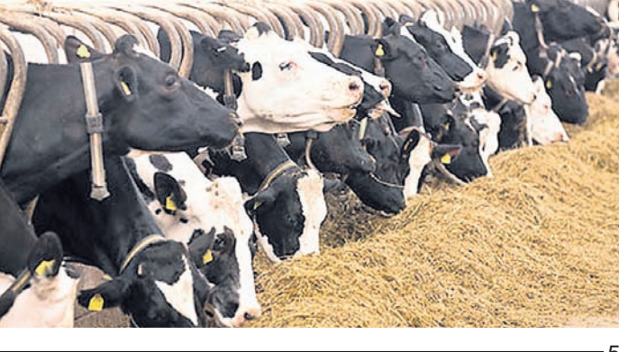
ଉପଖଣ୍ଡ ପ୍ରାଣୀ ଚିକିତ୍ସା ଅଧିକାରୀ, ଭୁବନେଶ୍ୱର ମୋ : ୯୪୩୭୩୭୭୩୮୫

ଆବ୍ୟ ପାନୀୟ ନ ଦେବା, ପଶୁପକ୍ଷୀକୁ ଉପଯୁକ୍ତ ଆୟତନରେ ନ ରଖିବା, ପଶୁଙ୍କ ବୃତ୍ତାନ୍ତରେ ବା ଅତ୍ୟଧିକ ରୋଗଗ୍ରସ୍ତ ବେଳେ ଘରୁ ବାହାର କରିଦେବା, କୁକୁଡ଼ା ଲଢ଼େଇ କରିବା।