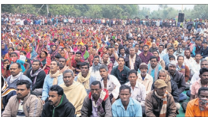
ଯେକେଣେ ଯୋଗ ଦେଇଥିବା ଚାଷୀ । ସଭାରେ ଯୋଗ ଦେଇଥିବା ଚାଷୀମାନଙ୍କ ସହିତ ସମସ୍ୟା ସମ୍ବନ୍ଧରେ କେମିତି କେମିତି ସମାଧାନ କରାଯାଇପାରେ ତାହା ଚର୍ଚ୍ଚା କରାଯାଇଥିଲା ।

ବାଲେଶ୍ୱର ଜିଲ୍ଲା ବାଲିଆପାଳ ବ୍ଲକ୍ ଆଲୋଚନା ପଞ୍ଚାୟତ ଅଞ୍ଚଳରେ ଚାଷୀମାନଙ୍କର ସମସ୍ୟା ସମ୍ବନ୍ଧରେ କେମିତି କେମିତି ସମାଧାନ କରାଯାଇପାରେ ତାହା ଚର୍ଚ୍ଚା କରାଯାଇଥିଲା ।