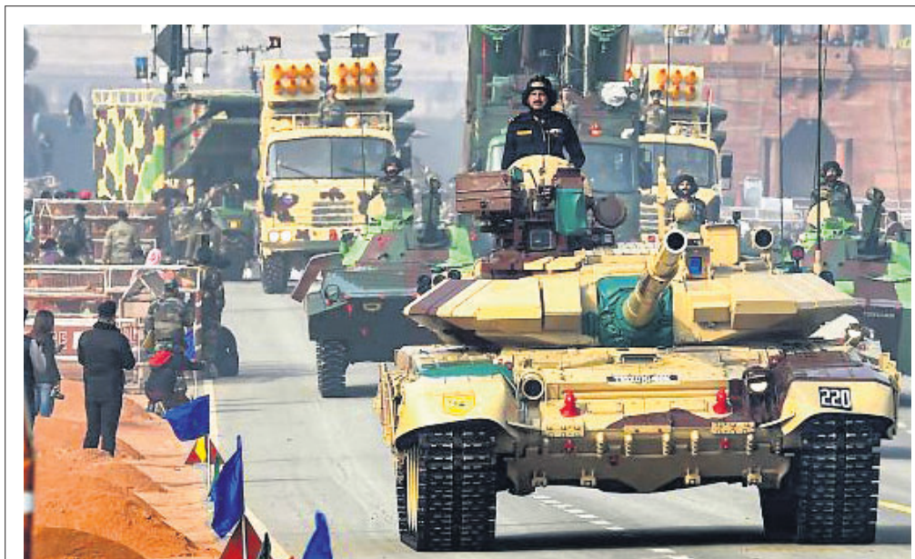
ସାଧାରଣତନ୍ତ୍ର ଦିବସ ପରେ ପାଇଁ ଅନୁଷ୍ଠିତ ରିହସ୍ୟାଲରେ ଭାଗ ନେଇଥିବା ସେନା ଟ୍ୟାଙ୍କ

ଓ ବାଂଲାଦେଶ ଅଧିକାରର ଅବରୋଧ ବୋଲି ନୂଆଦିଲ୍ଲୀ ହାଇକୋର୍ଟ କହିଛନ୍ତି। ବ୍ରହ୍ମପୁତ୍ର ଜଳକୁ ଅଟକାଇ ବେକି ଜଳବିଦ୍ୟୁତ ପ୍ରକଳ୍ପ ନିର୍ମାଣ କଲେ ଏହାର ଅବହାସନକୁ ନିର୍ଦ୍ଦେଶ ଦେଇଛନ୍ତି।