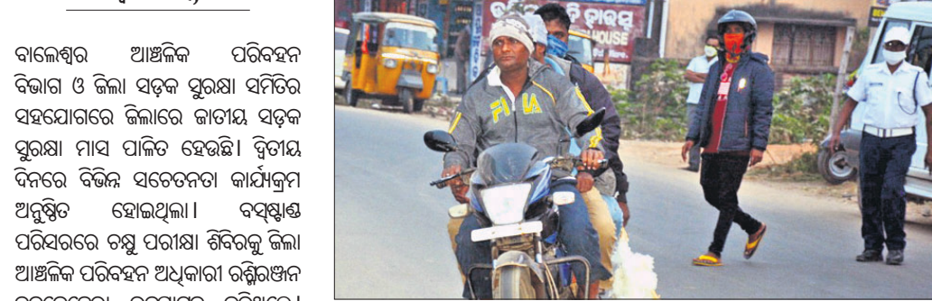
ବାଇକ୍‌ରୁ ଉଠିବା ସମୟରେ ଆହତ ହୋଇଥିବା ଦୁଇଜଣ ।

ବାଲେଶ୍ୱର ଆଞ୍ଚଳିକ ପରିବହନ ବିଭାଗ ଓ ଜିଲ୍ଲା ସଡ଼କ ସୁରକ୍ଷା ସମିତିର ସହଯୋଗରେ ଜିଲ୍ଲାରେ ଜାତୀୟ ସଡ଼କ ସୁରକ୍ଷା ମାସ ପାଳିତ ହେଉଛି ।