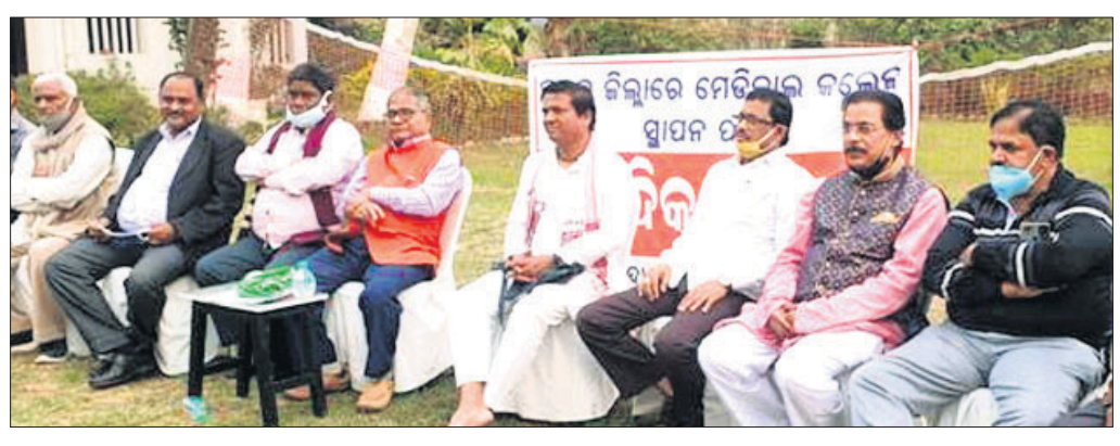
ଖବରଦାତା ସମ୍ମିଳନୀରେ ଭଦ୍ରକ ମେଡିକାଲ କଲେଜ କ୍ରିୟାନ୍ୱୟାନ କମିଟି ସଭାସଭା ।

ଉପଜିଲ୍ଲାପାଳ, ବିଡ଼ିଓଙ୍କଠାରେ ଅଭିଯୋଗ ଦିଆଯିବ, ୫୦ଟି ଶହାଧାର ବ୍ୟବସ୍ଥା, ପାଇଖାନା ଘର ମରାମତି ସହ ପାନୀୟ ଜଳର ସମସ୍ୟା ସମ୍ବନ୍ଧରେ କେମିତି କେମିତି ସମାଧାନ କରାଯାଇପାରେ ତାହା ଚର୍ଚ୍ଚା କରାଯାଇଥିଲା ।