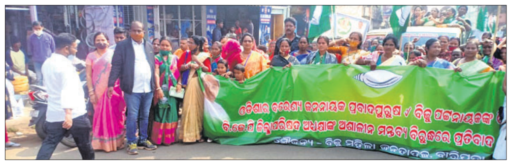
ମହିଳା ସଙ୍ଘଠ ପକ୍ଷରୁ ଆୟୋଜିତ ଶୋଭାଯାତ୍ରା ।

ବାରିପଦା ଅଫିସ୍, ୨୦୧୯ - ବିଜେଡି ମହିଳା ସଙ୍ଘଠର ଶୋଭାଯାତ୍ରା କରାଯାଇଛି । ଏହି ଯାତ୍ରାରେ ବିଜେଡି ମହିଳା ସଙ୍ଘଠର ସମସ୍ୟା ସମ୍ବନ୍ଧରେ କେମିତି କେମିତି ସମାଧାନ କରାଯାଇପାରେ ତାହା ଚର୍ଚ୍ଚା କରାଯାଇଥିଲା ।